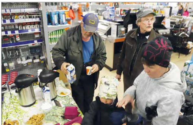
Koko päivän ajan oli kahvitarjoilu, jota käytettiin ahkerasti hyväksi.