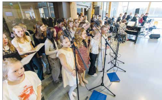
Lopuksi konsertin kaikki esiintyjät kajauttivat komeasti 'Kotkan poikki ilman siipiä'.