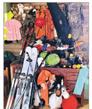
Erä-, liikunta- ja vapaa-aikateemainen kirppari kannustaa ihmisiä laittamaan kiertoon käytöstä pois jääneitä välineitä, vaatteita yms.