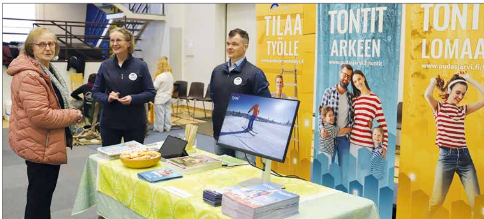
Pudasjärven Kehitys Oy oli messuilla mukana tukijana ja messupisteen muodossa.