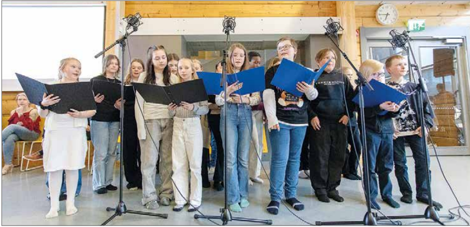
3–6-luokkien kuoro esitti opebändin kanssa yhdessä kappaleen Unohtumaton.

vaihtuvalla kokoonpanolla ja meillä on itse asiassa melko iso joukko musisoivia opettajia täällä Pudasjärvellä, Turunen kertoo.