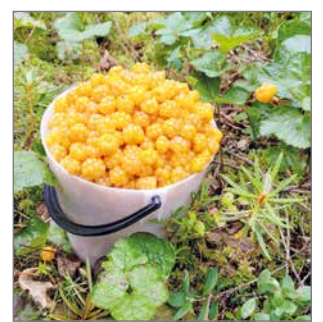
Kirpparille voi tuoda myyntiin esimerkiksi viime kauden marjoja.

Järjestäjät toivottavat kaikki tervetulleiksi viettämään mukavaa keväistä päivää ja tapahtumaa Hir-