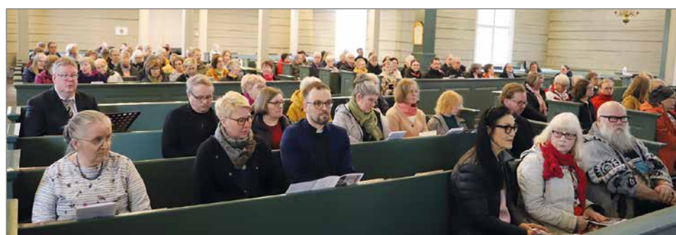
Pudasjärven kirkossa järjestettyyn Anna Magdalena Bachin elämästä kertovaan musiikkikuvaelmaan ja konserttiin osallistui lähes 200 kuulijaa kirkossa.