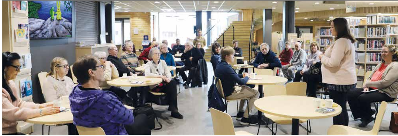
Keskustan Pudasjärven vaalilaisuudessa toivottiin puolueen saavan EU-Parlamenttiedustajan Pohjois-Suomesta.

Keskustelussa toivottiin raideliikenteen sähköistämistä Tornion kautta Ruotsin puolelle ulottumaan merille saakka. Kellon viisarien siirtelylle toivottiin myös päättymistä sekä ihmeteltiin koiraveron ja verrattiin sitä aikanaan olleeseen vanhan pojan ja -piian veron. HT