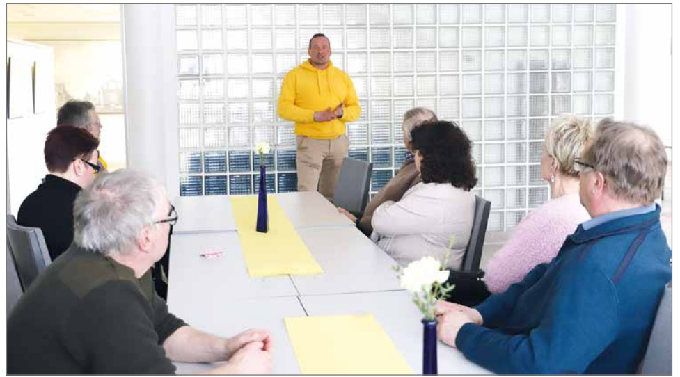
Polvinen käytti puheenvuoron myös telttatapahtuman jälkeen Pohjantähdessä, jonne oli kutsuttu paikallisyhdistyksen hallitus sekä perussuomalaiset eri luottamustehtävissä toimivat henkilöt.

Parituntisen telttatapahtuman jälkeen keskustelua jatkettiin Pohjantähdessä, jonne oli kutsuttu paikallisyhdistyksen hallitus sekä piirikokousedustajat ja perussuomalaiset eri kaupungin luottamustehtävissä toi-