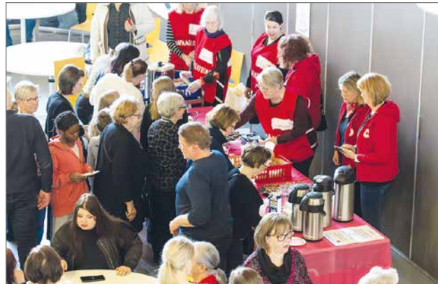
Tapahtuma järjestettiin yhteistyössä SPR:n Pudasjärven osaston kanssa, jonka kautta ohjattiin lahjoitukset konsertin avustuskohteisiin Gazan ja Ukrainan sotien uhreille.

Jenny Kärki