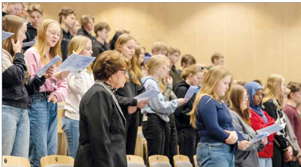
Kymmenen virran maa laulettiin yhdessä.