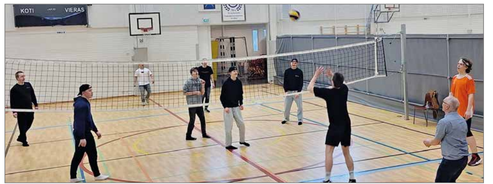
Lentopallo oli tapahtumassa suosittu.