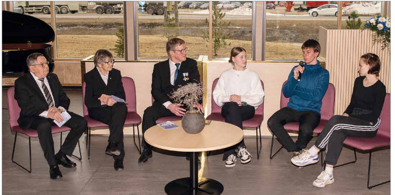
Paneelikeskustelussa käytiin läpi monia aiheita sodanjälkeiseen elämään liittyen.

Paneelikeskustelussa käytiin läpi monia koskettavia aiheita läheisten menettämistä henkisiin ja fyysisiin vammoihin sekä sodan jälkeisen ajan ankariin vuosiin, jolloin veteraanit palasivat rintamalta ja suomalaiset puursivat yhteistuumiin so-