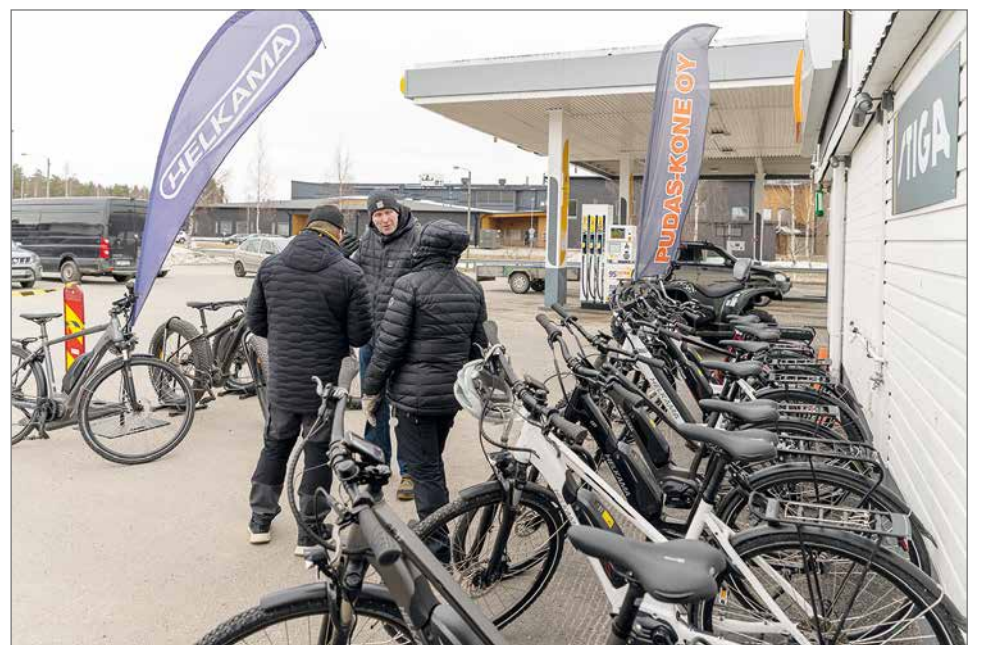
Esittelypäiville oli tuotu jopa kaksikymmentä polkupyörämallia testattavaksi.