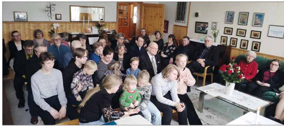
Hankkilan kodissa koulun entinen luokkahuone toimi hyvin seurojen pitopaikkana.