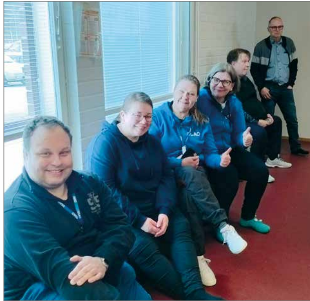
Henkilökunta otti välillä huilitauon.