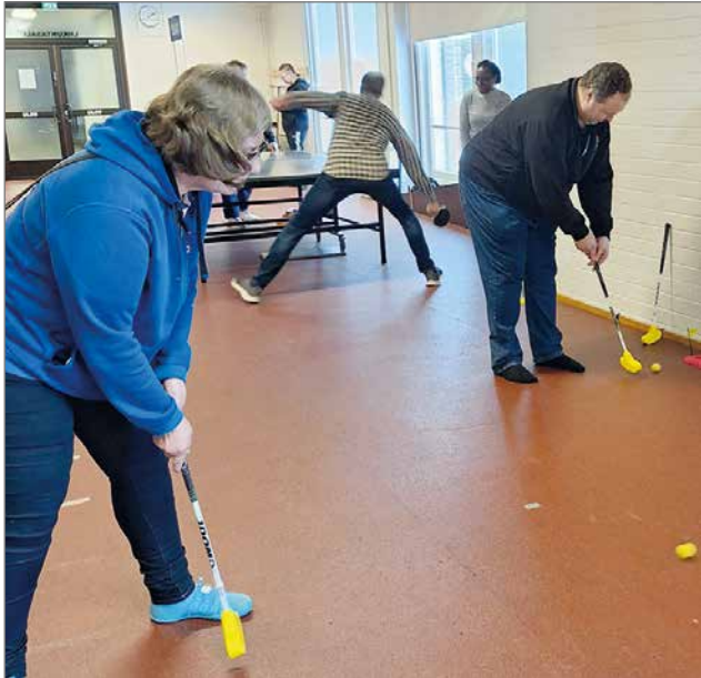
Minigolfissa mailatkin olivat minimallia.