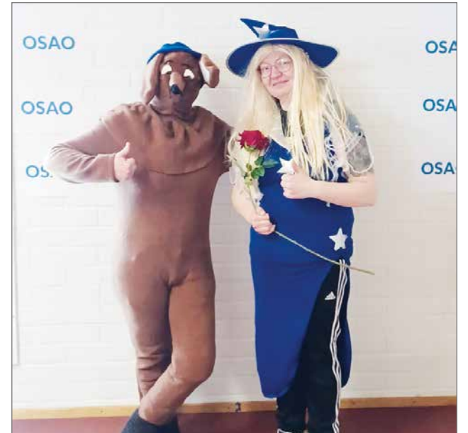
Valokuvausnurkkauksessa sai hassutella erilaisissa asuissa.

OSAOlaisilla oli vähän erilainen iltapäivä torstaina 16.4. Tapahtumatuotannon kurssia suorittavat liiketoiminnan opiskelijat järjestivät koko OSAOn Pudasjärven yksikön välle Liikuntahöntsän Tuomas Sammelvo -salissa. Iltapäivän tapahtumassa pääsi kokeilemaan muun muassa lentopalloa, sulkapalloa, minigolfia ja pingistä. Kaverinurkkauksessa saattoi hassutella vaika-