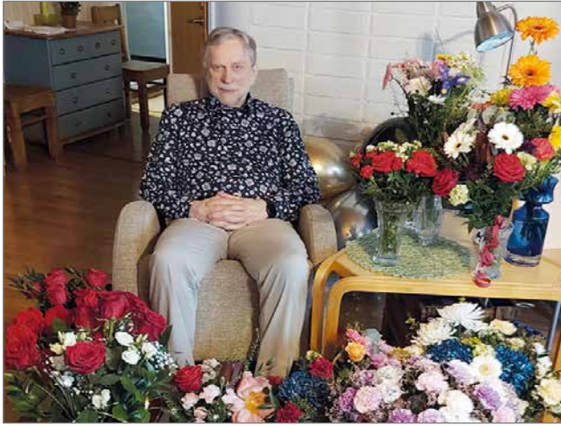
Päiväsankari onnittelukukien keskellä.

- Kun opettaja oli vierail- lut kotonani Metelinmäen talossa, hän oli sanonut van- hemmilleni, että tämä poi- ka on pantava oppikouluun,