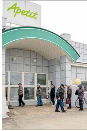
Tuotekehityspizzojen myyntipäivä keräsi jatkuvan jonon Pudasjärven pizzatehtaalle.

Suomalaisten mieltymykset on Apetit mukaan otettu