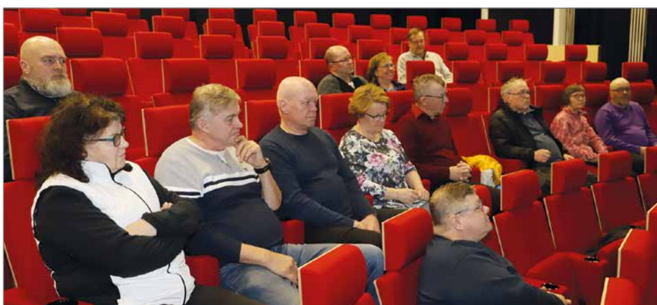
Pudasjärven Perussuomalaiset pitivät kevätkokouksen Pohjantähdessä.