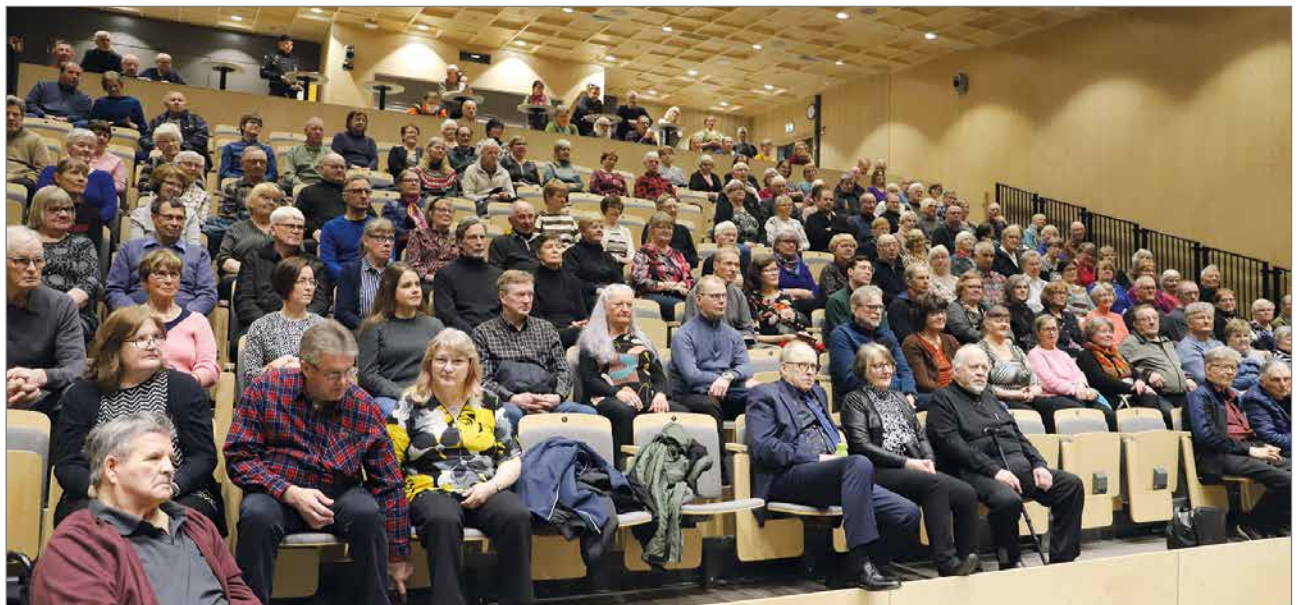
Konsertissa oli Kurkisali täynnä yleisöä.