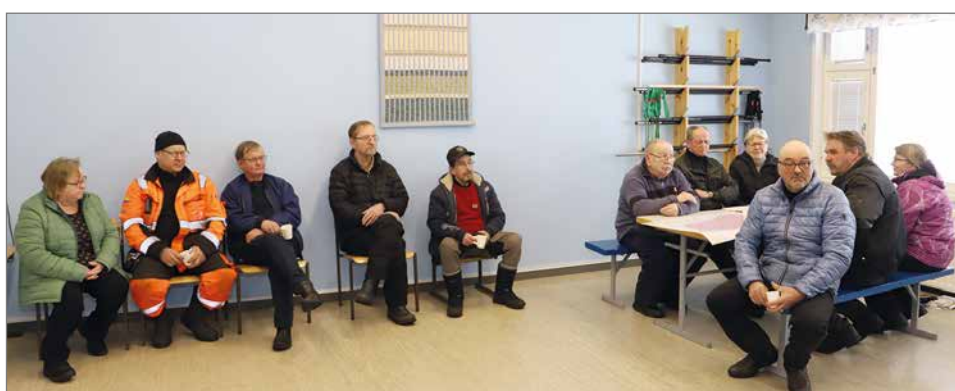
Maanomistajat olivat neuvotelleet porukalla hyvissä ajoin maanvuokrausasiat ja olivat yksimielisesti hankkeen takana.

Alustavan hankealueen koko on noin 7500 hehtaaria, jonne suunnitellaan tämän hetken tiedon mukaan 34-51 voimalaa. Kokonais-teho on 270-410 MW. Voimaloiden maksimikorkeus, johon varaudutaan, on 310 metriä. Selvityksen alla on