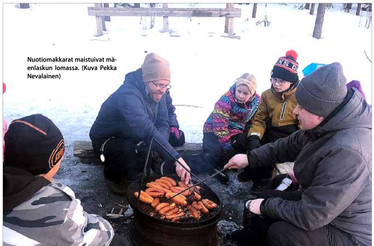
Nuotiomakkarat maistuivat mäenlaskun lomassa.