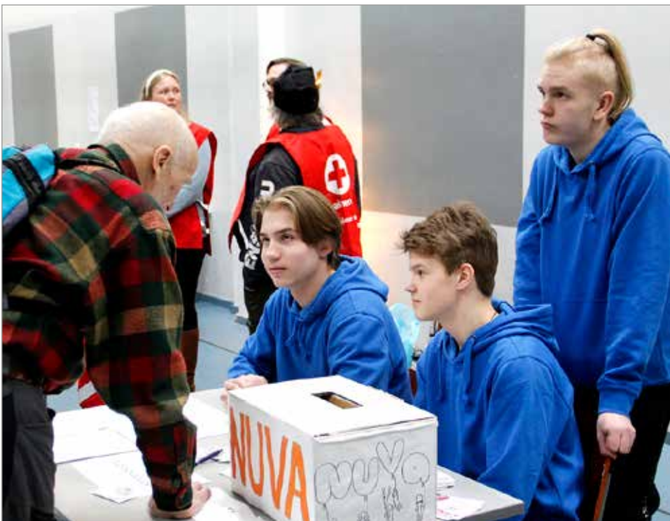
Iin Nuorisovaltuuston porukka esitteli toimintaansa Iin messuilla ja he esittelivät muun muassa nuorille järjestettyjen varjovalien tuloksia.