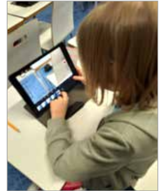
Haminan 2.-3. luokkalaisten kuvauskerhossa kerholaiset saivat itse suunnitella ja toteuttaa animaatioita.

tai lukemiskerhoja. Kaikkien toiveet ovat tärkeitä, ja pyrimme parhaamme mukaan täyttämään niitä myös tulevaisuudessa.