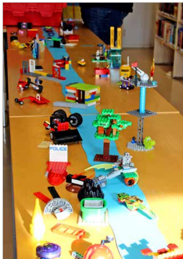
Legoista rakentui teoksia teemalla li ennen, nyt ja tulevaisuudessa.