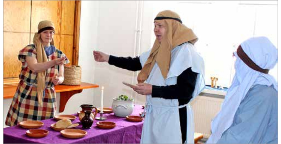
Kirkon eteisen rastilla kuvattiin Jeesuksen ja opetuslasten viimeistä ateriaa sekä ehtoollisen asetamista.

aasilla Jerusalemiin ratsastamista elävöitettiin paikalle tuoduilla aaseilla. Kirkkoon päättynyt vaellus kertoi lopuksi, mitä kaikkea risti kristityille kuvaa. MTR