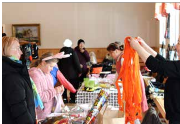
Myyntipöydillä oli tarjolla monenlaista tavaraa ja kauppa kävi.

Kuivaniemen nuorisoseura järjesti perinteiseen tapaan pääsiäismyyjäiset. Tällä kertaa ajankohta oli pääsiäisviikko edeltävä lauantai. Monista päällekkäisistä tapahtumista ja heikosta säästä johtuen yleisömenestys ei ollut aivan edellisten vuosien