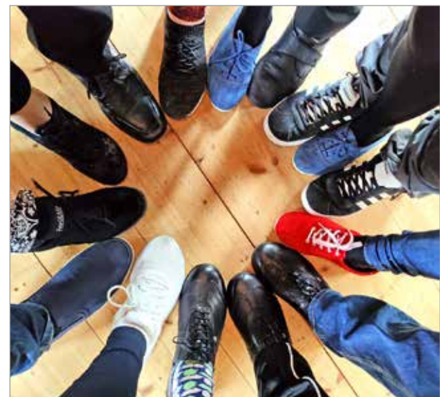
Jalat etsivät askelkuvioita ja joukkoon mahtuu myös muutama "hups" ja "oho".