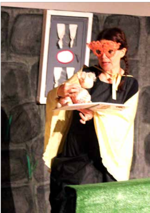
Täti Kultasiipi ja toukkavauva PiuPau nukketheateriesityksessä "Taikaovet".