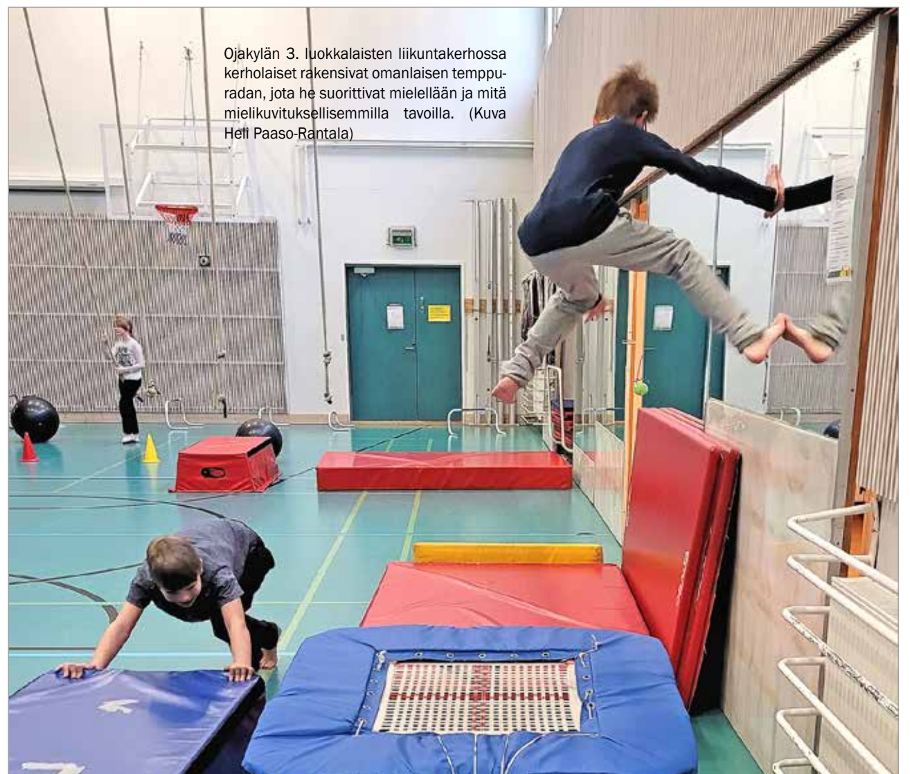
Ojakylän 3. luokkalaisten liikuntakerhossa kerholaiset rakensivat omanlaisen tempuradan, jota he suorittivat mielellään ja mitä mielikuvituksellisemmilla tavoilla.