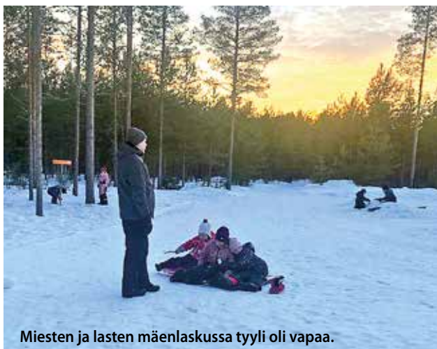
Miesten ja lasten mäenlaskussa tyyli oli vapaa.