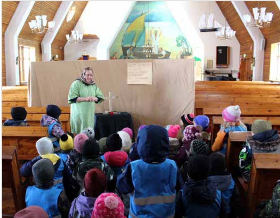
Kirkkoon rakennettu Golgata sai lapset hiljentymään sanan äärelle.

Iin seurakunnan järjestämä pääsiäisvaellus johdatti osallistujat pääsiäisen tapahtumien ja ilosanoman äärelle. Kolmen päivän aikana (25.-27.3.) vaellukselle osallistui useita päiväkotii-