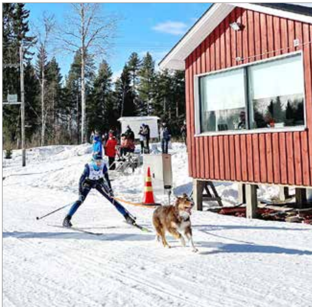
Illinsaaren latuverkosto oli huippukunnossa, ja maaliin saavuttiin hyvillä mielin auringon helleissä taustalla.

Valjakkohiihdon eri rotujen mestaruuksista kilpailtiin 9.3.-10.3.2024 Pohjois-Pohjanmaan ja Helsingin seudun piirinmestaruuksista Illinsaarella. Oulun Palveluskoiraliiton alainen valjakkohiihto-