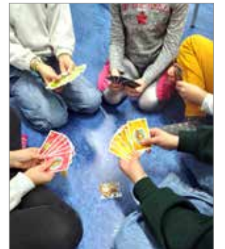
Haminan 3. luokkalaisten kaverikerhossa pelataan korttipeliä.