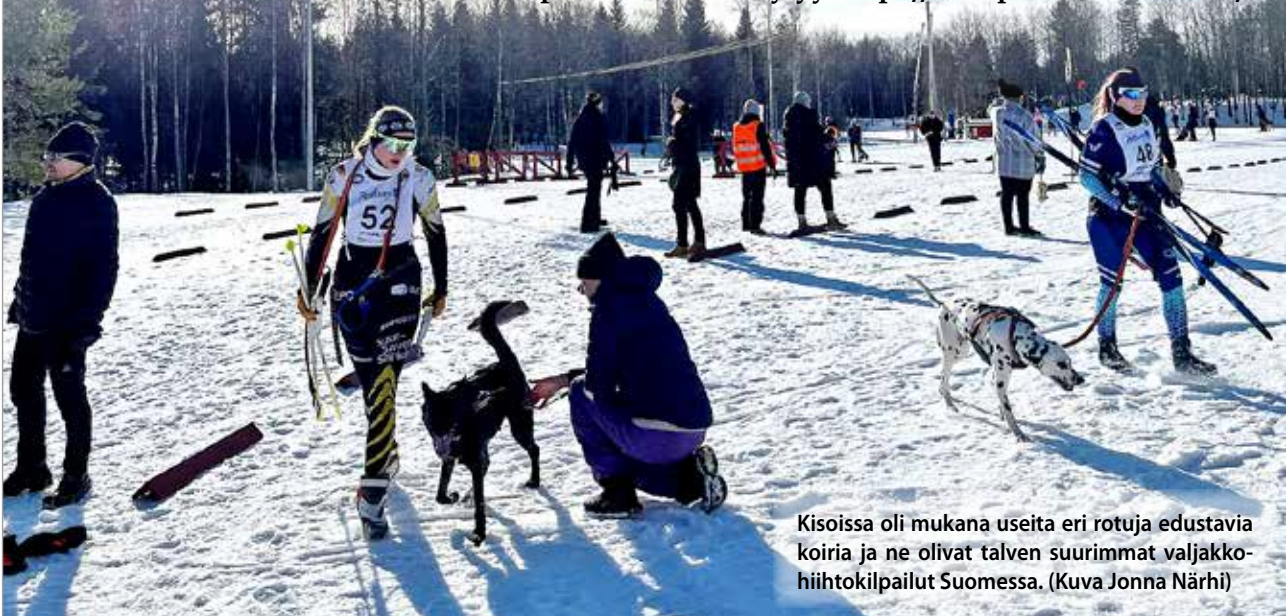
Kisoissa oli mukana useita eri rotuja edustavia koiria ja ne olivat talven suurimmat valjakkohiihtokilpailut Suomessa.

Kilpailun tulokset löytyy: https://tulospalvelu.virkku.net/