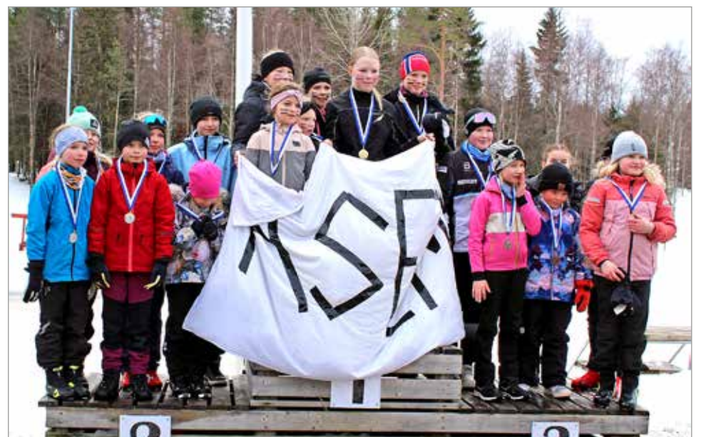
Tyttöjen viestin mitalijoukkueet. Vasemmalta Pohjois-Ii, Asema, Hamina.