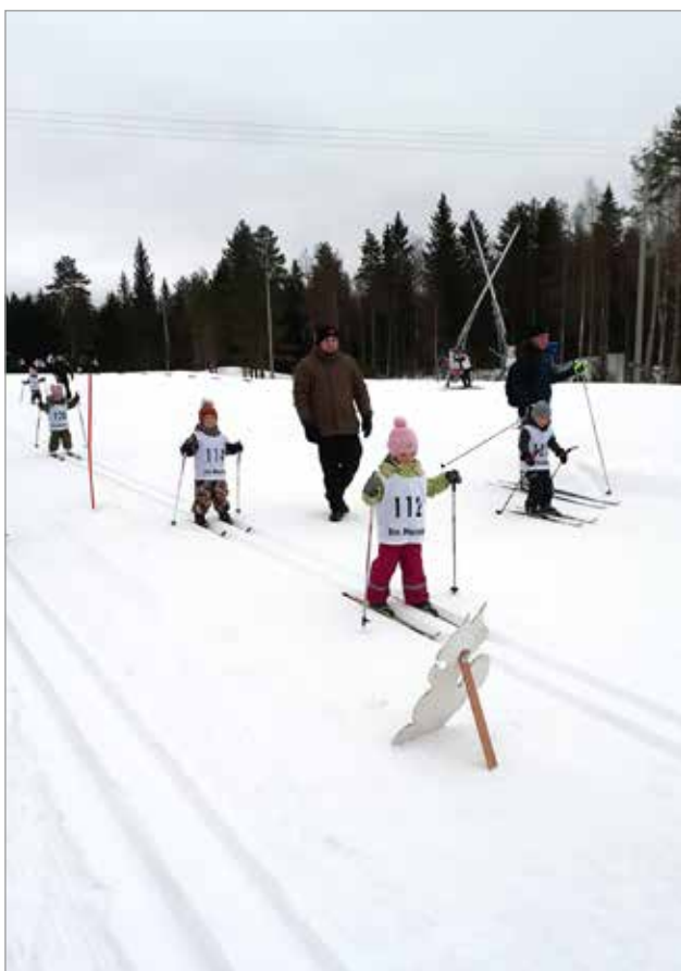
Näissä hiihdoissa matkaa taitettiin sulassa sovussa muun muassa pupun kuva kiertäen.

Ilinsaaren hiihtostadion täyttyi maanantaina 11.3. iloista lapsista ja jopa neljässä sukupolvessa hiihtäjiä kannustamaan tulleista aikuisista.