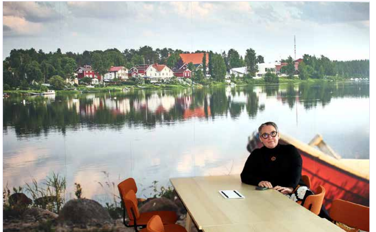
Kunnanhallituksen ja lautakuntien kokoukset pidetään jatkossa uudessa kokoushuoneessa, jonka seinää koristaa valokuvasuurenno lijojen rantamaisemista.

Hän, kuten muutkin hiihtoloman jälkeen tiloihin muuttaneet työntekijät kertoivat viihtyvänsä uusissa tiloissa. Työergonomiaa parantavat uudet sähköpöydät, joten halutesaan voi olla istumalakossa, vaikka koko päivän. Hissi ei vielä juttua tehdessä ollut käytettävissä, mutta sekin on tulossa, varmistamaan