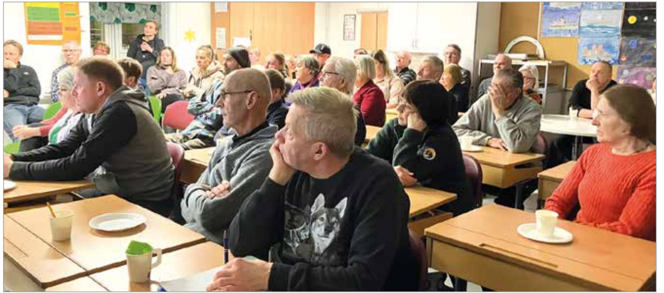
ilaisuuteen osallistui reilut 50 asiasta kiinnostunutta.