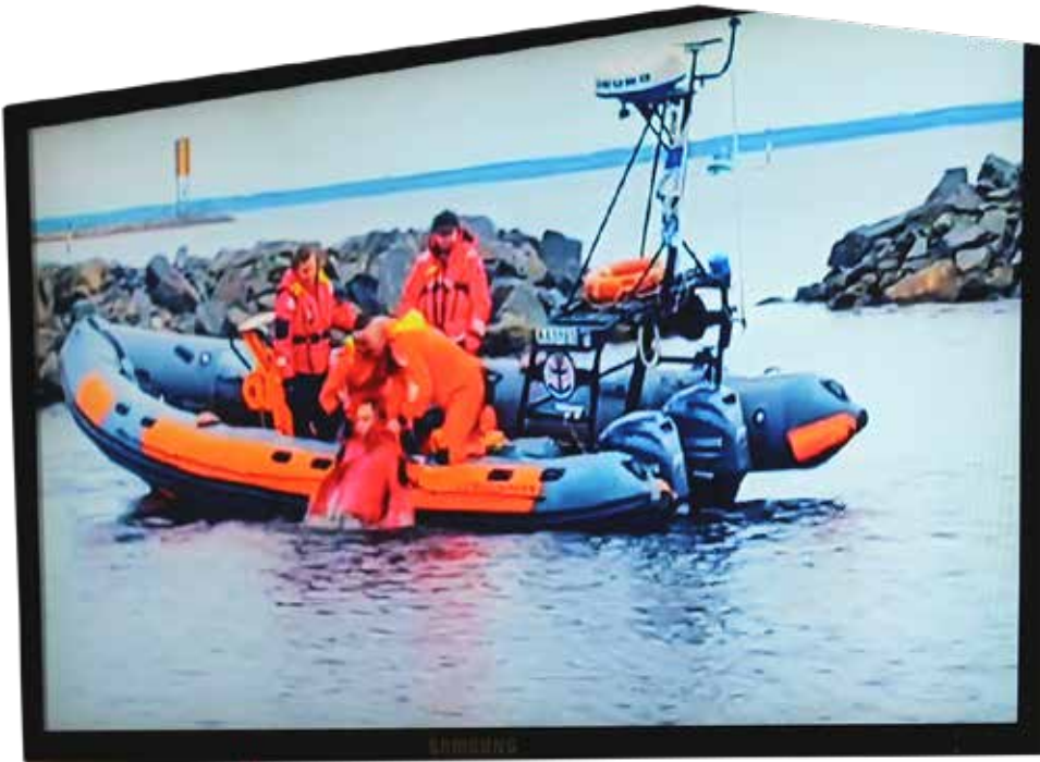
Pelastusharjoituksissa opetellaan muun muassa, kuinka ihminen saadaan vedestä veneeseen.

-Meillä oli yhdistyksessä vaarana ukkoutuminen, mutta nyt tilanne näyttää