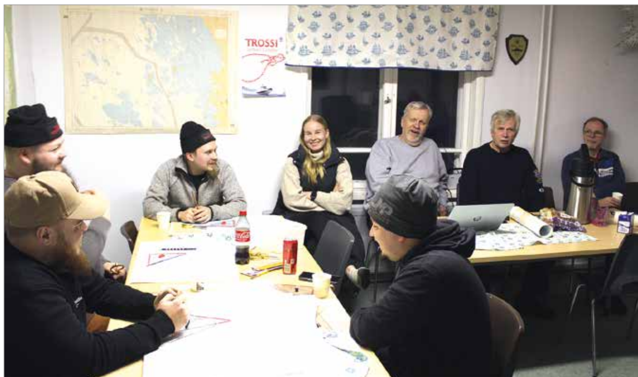
Iin Meripelastajien aktiiveja Rantakestilän tukikohdassa.