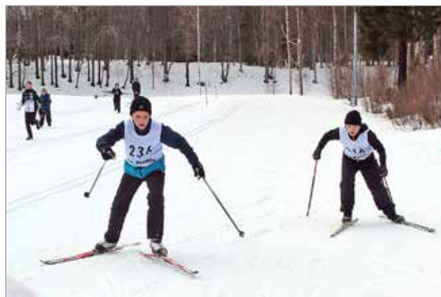
Poikien viestissä Hamina onnistui venyttämään hopealle ennen Alarantaa.

useita minutteja Alarantaan ja Haminaan 5.luokan poikien osuuden alkaessa. 5. ja 6. luokilla matkana oli 2 kilometriä ja niiden aikana joukkue onnistui kuin onnistuikin nousemaan selvään voittoon. Haminan ja Alarannan sijoitukset ratkesivat kirjaimellisesti maaliviivalla. Hamina otti tiukassa taistossa hopeat ja kilpaa pitkää hallinnut Alaranta pronssit. MTR