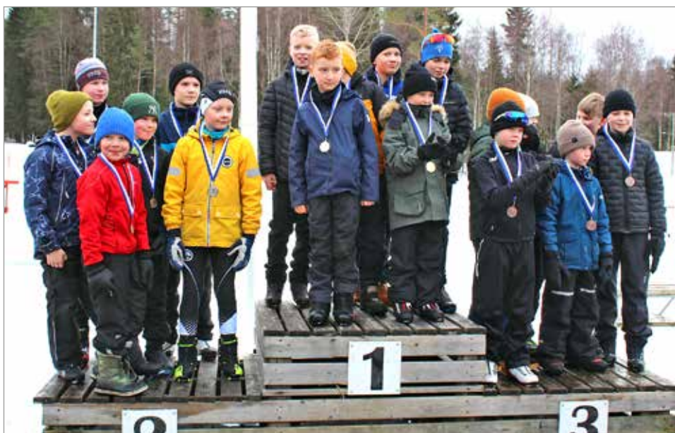
Pojissa korkeimmalle pallille nousi Pohjois-Ii. Tiukan taiston jälkeen hopeaa Haminaan ja pronssia Alarannalle.