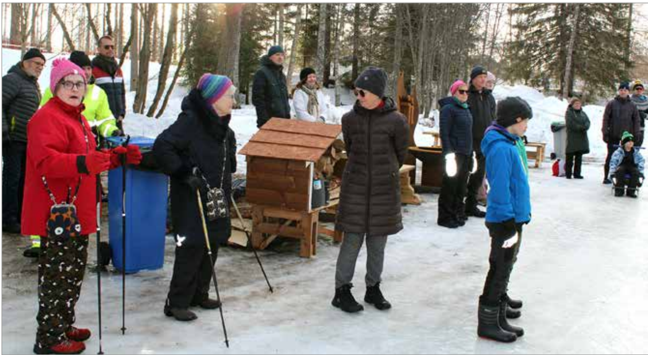
Lumi- ja jäätaideteosten avajaisiin saapui runsaasti yleisöä.