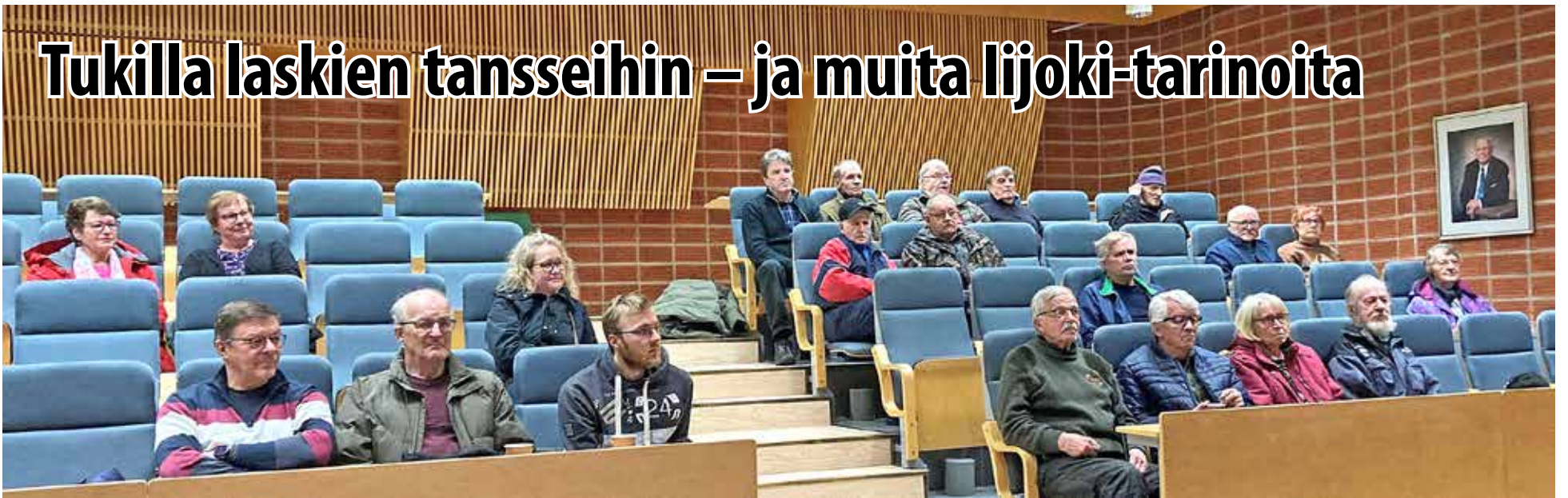
Perinneperinöihin saapui kolmisenkymmentä henkilöä muistelevaan Ijoen uittoihin liittyviä tarinoita – osa muistelevaan ja osa kuunteluoppilaiksi.

Tiistaina 27.2. Nätteporin Auditorioon kokoontui kolmisenkymmentä henkilöä muistelevaan ja kuuntelemaan Ijoen uittoihin liittyviä tarinoita Perinneperinat-tapahtumaan. Kyseessä oli ensilaukaus STORE-hankkeen tarinoiden keräämiselle.