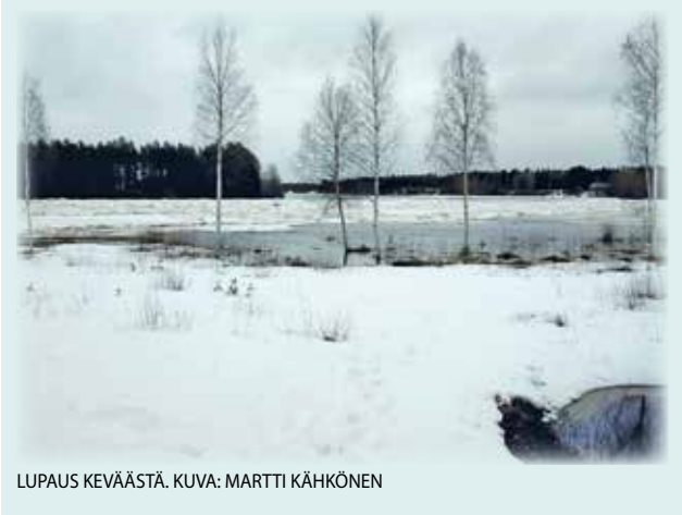
LUPAUS KEVÄÄSTÄ.

lukijoiden palaute ja jutut: vkkmedia@vkkmedia.fi