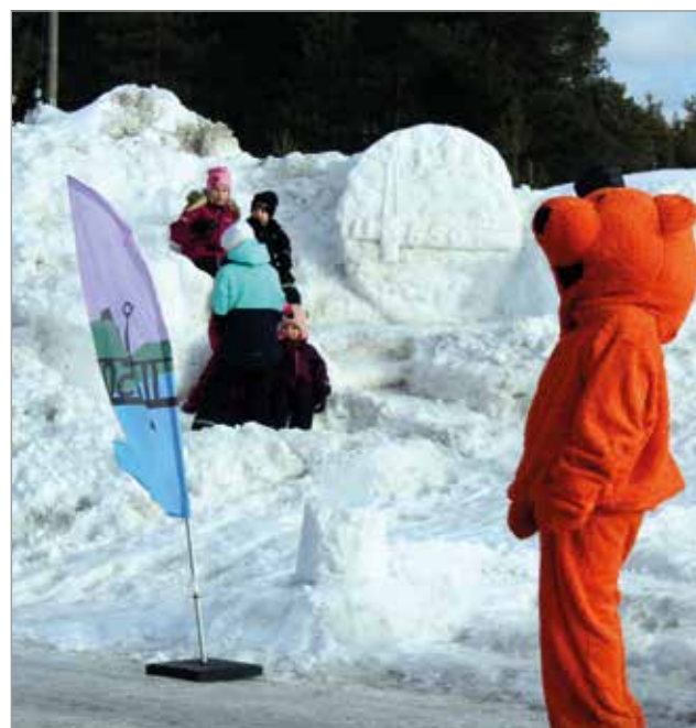
Lumesta syntyi komea Ii650- juhluvuo den logo pulkkamäen viereen.