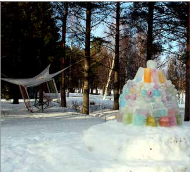
Kummeli-teoksen valmistamiseen pääsivät kuntalaiset osallistumaan.