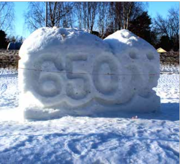
Nopeasti lämmennyt sää ehti muokata 4tien laitaan valmistunutta lumitaideteosta ennen avajaisia.