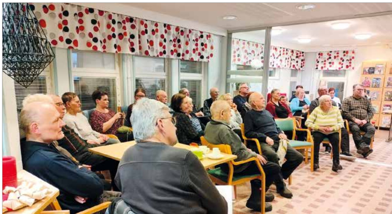
Kuivaniemen kotiseutuyhdistyksen yhdessä järjestämät Perinneporinat kokosivat reilun 20 hengen seurueen jutustelemaan.

Kuivaniemen kirjastolla muisteltiin Kuivaniemen alueella toimineita kauppia, grillejä, kioskeja ja muita myymälöitä. Maanantaina 26.2. Kuivaniemen kirjaston ja Kuivaniemen kotiseutuyhdistyksen yhdessä järjestämät Perinneporinat kokosivat reilun 20 hengen seurueen jutustelemaan rennosti.