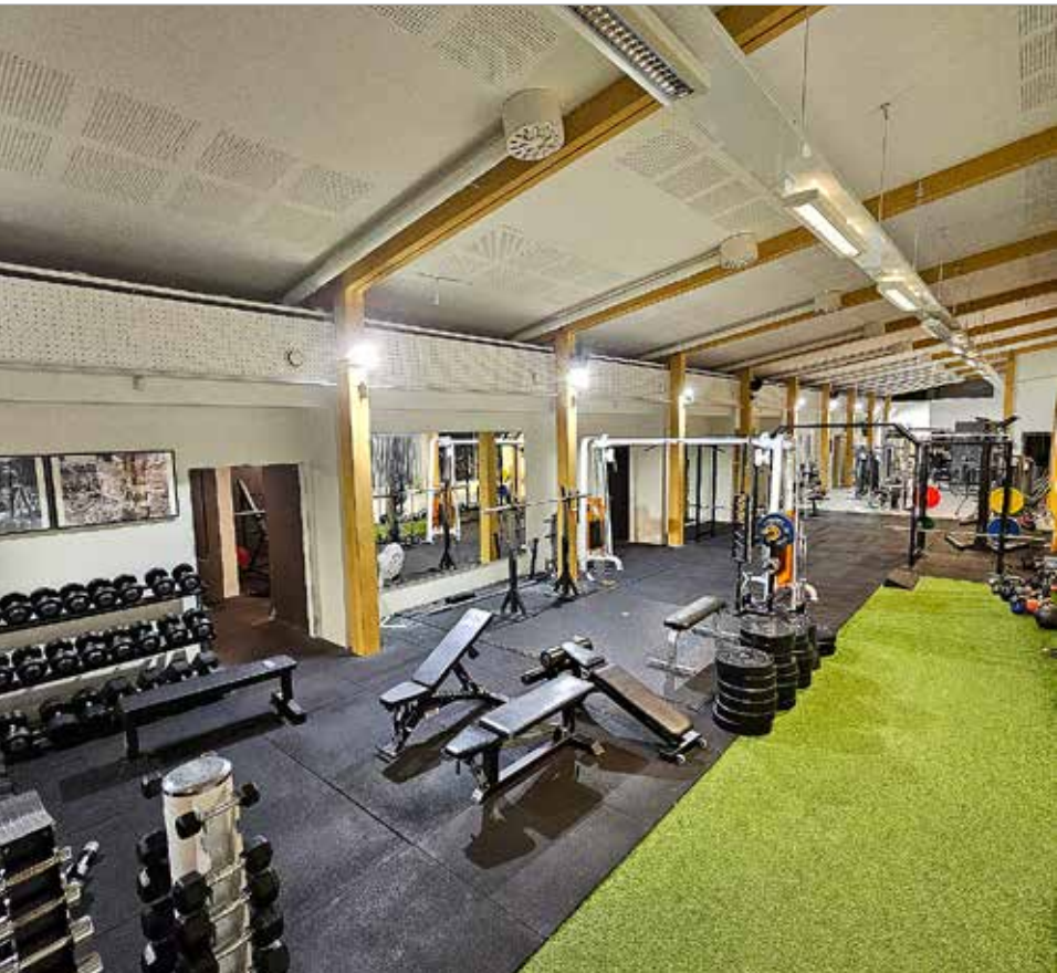
Sali99 korkeat, ilmatilat mahdollistavat monien lajien harjoittelun.

Varsinaiset avajaiset vie- tetään salin uuden ilmeen ollessa valmis, maaliskuun vaihteessa. Samalla paljastetaan yhteistyökump- pani, joka alkaa vetämään erilaisia liikuntaryhmiä sa- lilla monessa eri lajissa. MTR