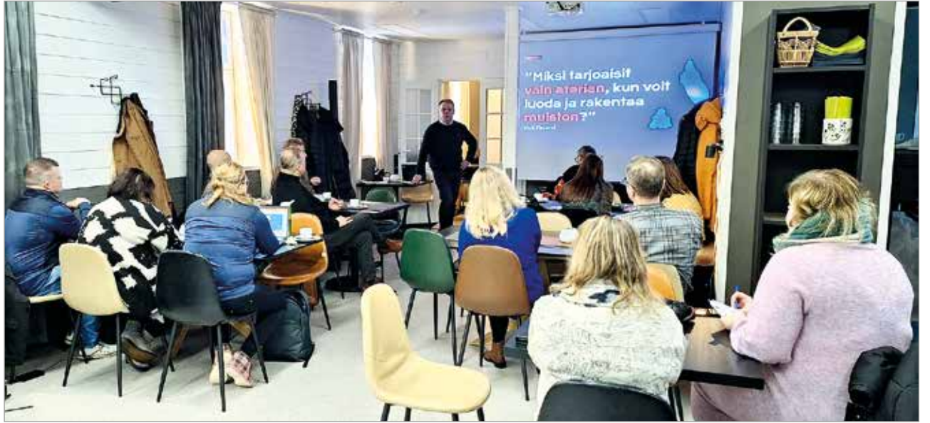
Matkailuselvitystä jatkotyöstettiin työpajassa Iin Sillat -matkailukeskuksessa.

Vuonna 2023 hanke aloitti Ijoen alueen matkailuselvitystyön, jonka päämääränä on selvittää alueen matkailumahdollisuudet ja -haasteet. Tavoitteena on luoda strategia tuleville vuosille, joka auttaa Ijoen aluetta kasvamaan matkailukohteena ja houkuttelemaan vierailijoita ympäri vuoden. Selvitystyön pohjalta luodaan konkreettinen toimenpideohjelma, joka ohjaa käytännön tekemistä ja kasvun aikaansaamista. Tavoitteena on myös luoda uusia liiketoimintamahdollisuuksia ja verkottaa yrityksiä erilaisin keinoin.