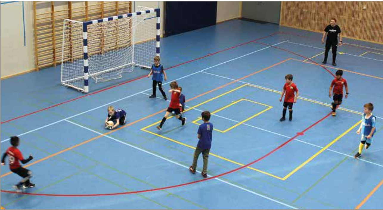
Tiukka tilanne Alarannan maalilla. Punaisissa pelaava Tervarit on päässyt laukaisemaan, mutta Alarannan maalivahti pelastaa joukkueensa takaiskulta.