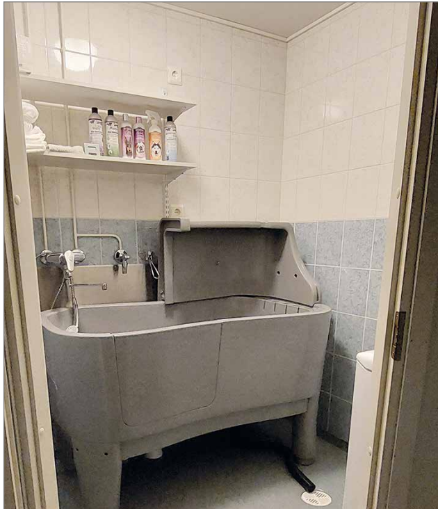
Trimmaamolta löytyy myös erillinen pesuhuone.