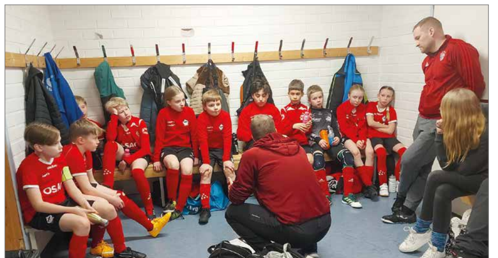
PT12 joukkue valmistautumassa peliin.