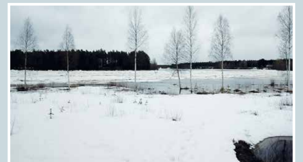
Lupaus keväästä.

Martti Kähkönen lukijoiden palaute ja jutut: vklkmedia.fi