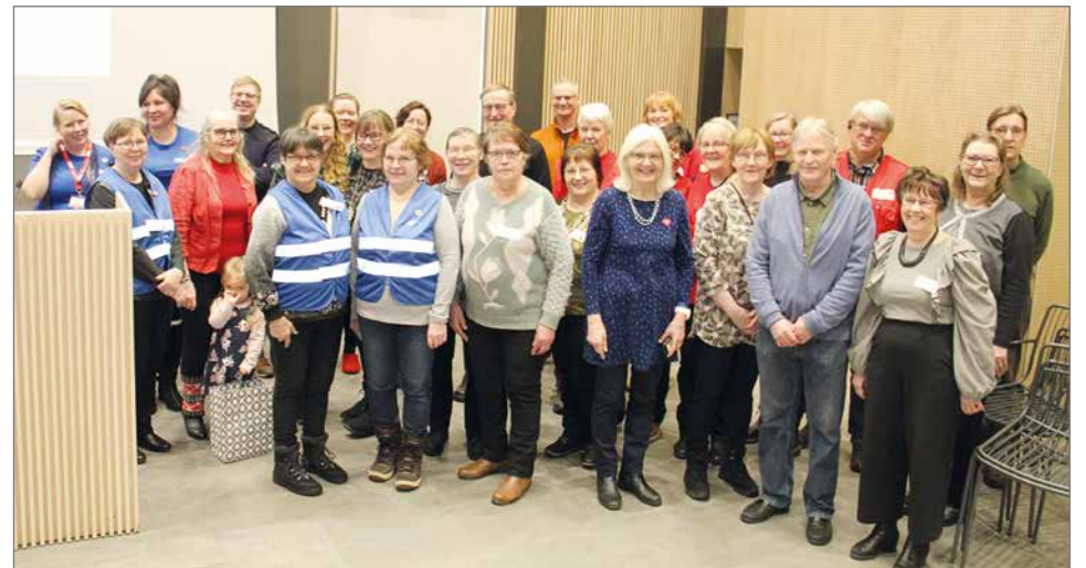
Ystävänäpäiväpörskeet osoittivat, että tapahtumien järjestämisessä on talkoohenki voimissaan Pudasjärvellä.

Keskiviikkona 14.2. Kurkisalilla täyttyi iloisista ilmeistä ja puheensorinasta, kun Pudasjärven voimaa vanhuuteen työryhmä sekä Pudasjärven vanhus- ja vammaisneuvosto kutsuivat mukaan useita eri järjestöjä toteuttamaan yhteistyössä jo toisen kerran järjestetyt Ystävänäpäiväpörskeet.