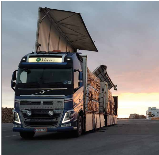
Rahti Alatalon autoilla kuljetetaan pitkin Suomea kaikenlaista mikä lavalla pysyy ja mikä pitää siirtää paikasta toiseen.

Pudasjärvellä syntynyt Alatalo kasvoi monien pai-