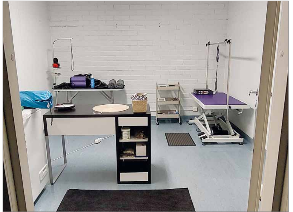
Teollisuustiellä sijaitsevasta trimmaamosta löytyy yhdelle henkilölle sopivat työtilat erikoisten koirien ja pieneläinten trimmaamiseen.