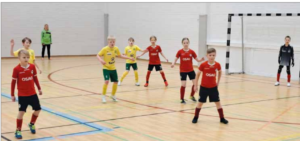
PT11 joukkue Suojalinnalla Haupaa vastaan.

PT11 ja PT12 joukkueen johto sekä valmennus