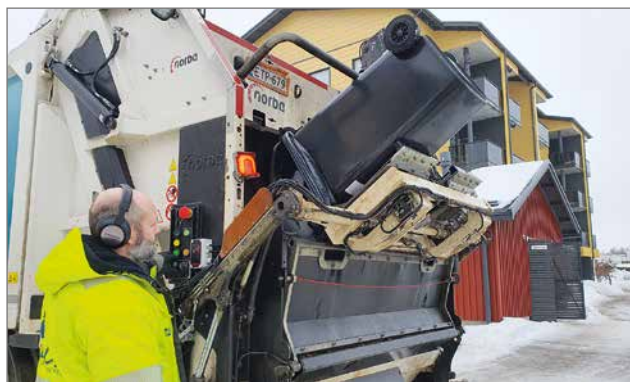
Jäteautoon asennettu vaaka punnitsee astian sekä ennen tyhjennystä että sen jälkeen.

Jäteautoon asennettu vaaka punnitsee jäteastian sekä ennen tyhjennystä että sen