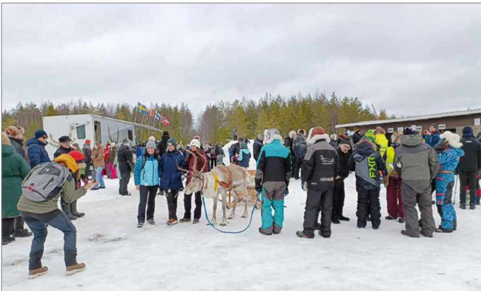
Porokisojen yleisöä.