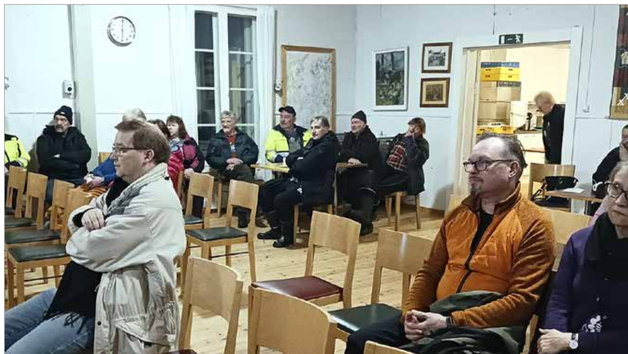
Vuosiojan tila ja kunnostaminen kiinnostavat maanomistajia ja kyläläisiä.

Maanomistajat ovat suhtautuneet hankkeeseen myönteisesti ja se on tarkoitus toteuttaa koskipaikkojen osalta kesän 2024 aikana Helmi-ohjelman tuella. MTR