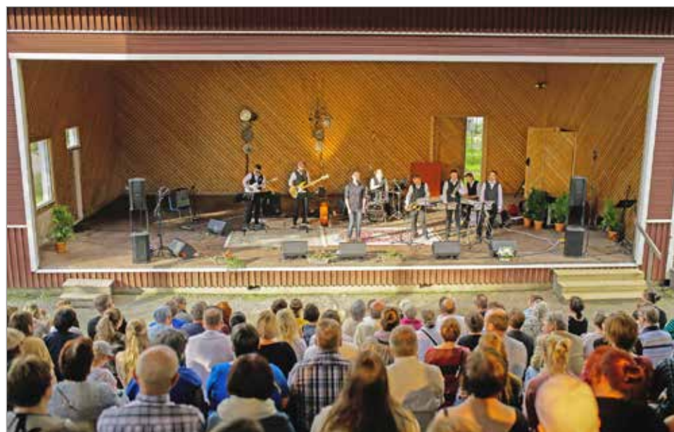
Kuva vuoden 2017 konsertista.