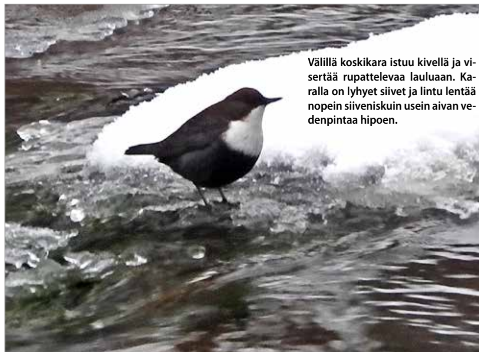
Välillä koskikara istuu kivellä ja visertää rupattelevaa lauluaan. Karalla on lyhyet siivet ja lintu lentää nopein siiveniskuun usein aivan vedenpintaa hipoen.

Iijokivarren kuntien alueelta useita vuosia luontojuttuja kirjoittanut Jarmo Vacklin on pyhäjokinen luontokuvaaja. Iijokivarren alueet ovat olleet hänelle jo vuosikymmenien ajan tärkeä kuvausretkien kohde.