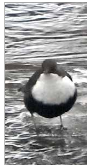
Karoilta kuluu koko lyhyt ja hämärä talvipäivä ravinnon haakuun virtaavan puron tai joen pohjasta.