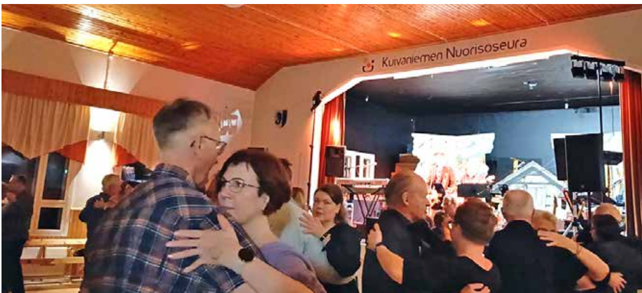
Seurantalons tanssilattialla riitti tanssijoita tungokseksi saakka.

paniemi, Ville Kortessalmi, Juha Alavari ja Alekski Kos- kela. Talkoolaisia tapahtu- man onnistuminen vaati eri tehtäviin noin 40. MTR