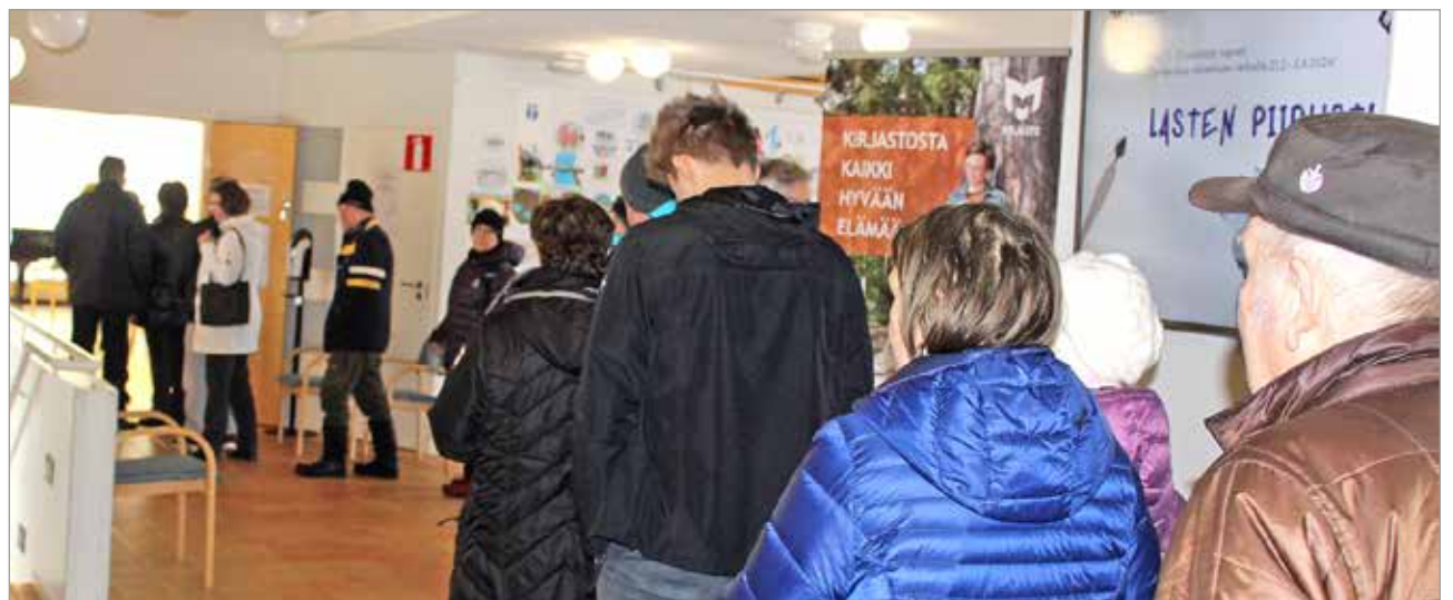
Presidentinvaalit kiinnostavat. Toisen kierroksen ennakoäänestyksen alkaessa Nätteporiin jonotettiin äänestämään.