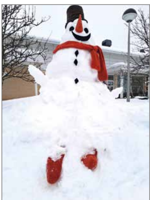
Asiakkaat rakensivat toimintakeskuksen pihalle komean Säpäkkä -lumiukon ilahduttamaan ohikulkijoita.

Koko Suomi elää jännittäviä aikoja, kun maallemme valitaan uusi presidentti. Kansalaiset tekevät valinnan äänestämällä mielestään parasta ehdokasta. Meillä työkeskuksessakin suoritettiin vaalit viikolla neljä. Äänestimme nimestä ja samalla Pohteen linjauksen mukaisesti entinen Pudasjärven työ- ja päivätoiminta/toyokeskus muuttui Pudasjärven toimintakeskukseksi. Asiakkaat saivat itse jättää nimehdotuksia ja lopulliseen äänestykseen päätyivät seuraavat nimet: