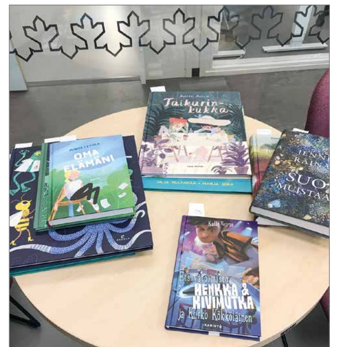
Palkintokirjat lähdessä kirjastoauton mukana Pudis lukee! -kampanjan voittajille.

MYYTÄVÄNÄ KUUSAMON MUIKKUA, TUORETTA SIIKAA, SAVUKALAA PUDASJÄRVEN S-MARKET PIHA PE 16.2. KLO 8.00-9.45. P. 044 013 1493/VILJO KARJALAINEN