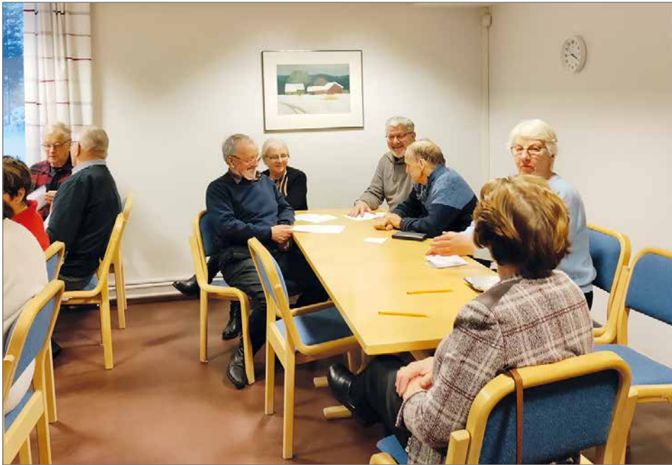
"Anagrammeja Suomen kaupungeista" osallistujien pähkältävänä.

Viime vuoden varsinaisesta toiminnasta mainittakoon muun muassa säännölliset