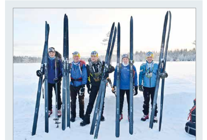
Kisassa hopealle hiihti kestmomenestyjä pudasjärveläinen Kiinteistöneliön joukkue.