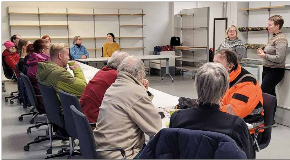
Entisen kirjakaupan tiloihin kertyi mukavasti kiinnostuneita kuulijoita.

Pudasjärven Vihreät ry