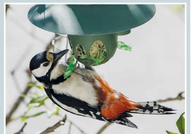
Tässä se on: Käpytikka.

Martti Kähkönen lukijoiden palaute ja jutut: vkkmedia.fi