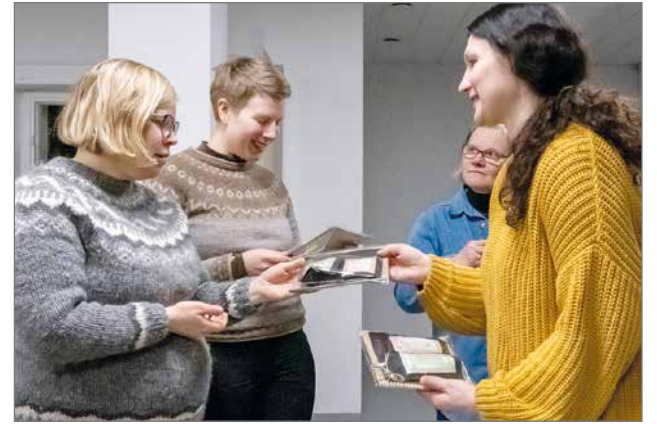
Kansanedustajat saivat muistoksi paikallisia Syötteen sieni ja yritti ky:n tuotteita.

punut kuulemaan parikymmentä henkilöä. Tilaisuuden lopuksi yleisöllä oli mahdollisuus esittää kysymyksiä, ja keskustelua syntyiikin varsin vilkkaasti.