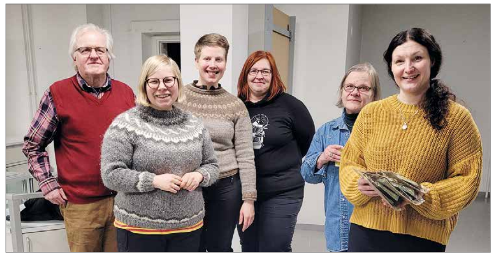
Kansanedustajat ja Pudasjärven Vihreiden hallituksen jäseniä.