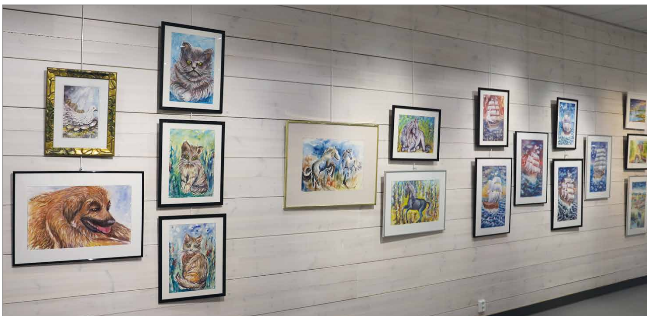
Näyttelytilan peräseinälle on ripustettu mm. eläin- ja laiva-aiheisia teoksia.