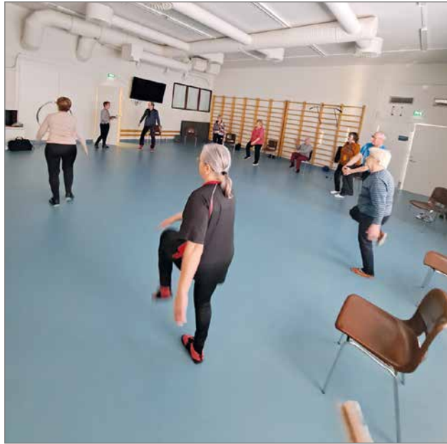
Tuolijumppaan voi osallistua oman liikkumistason mukaan ja liikkeitä voi tehdä joko seisten tai istuen.

Tuolijumppaa järjestetään tiistaisin parittomina viikkoina kello 11-12 liikun-