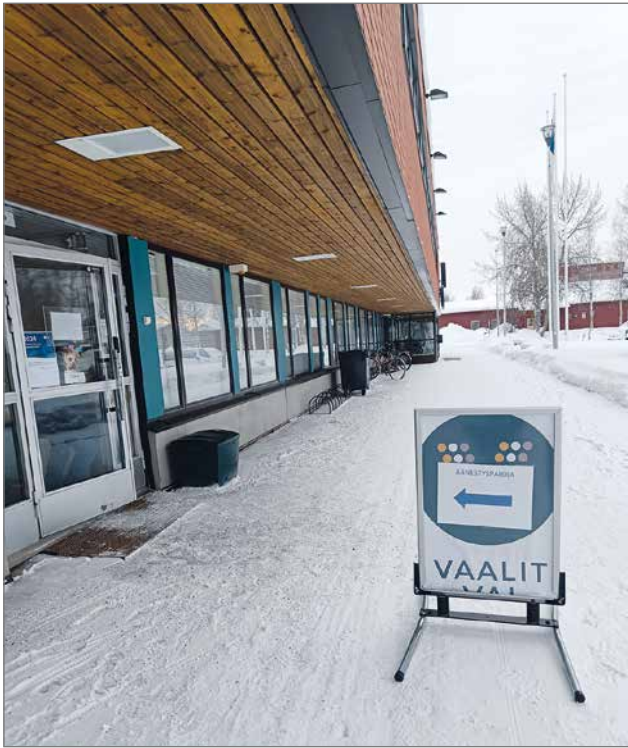
Kurenalan äänestyspaikka sijaitsee tällä kertaa kaupungintalon Häävi-kokoushuoneessa, jonne kuljetaan kaupungintalon sivuovesta.

Halla-ahon ja Rehniin lisäksi presidenttikisan toiselta kierrokselta tipahtivat Mika Aaltola, Li Andersson, Sari Essayah, Harry