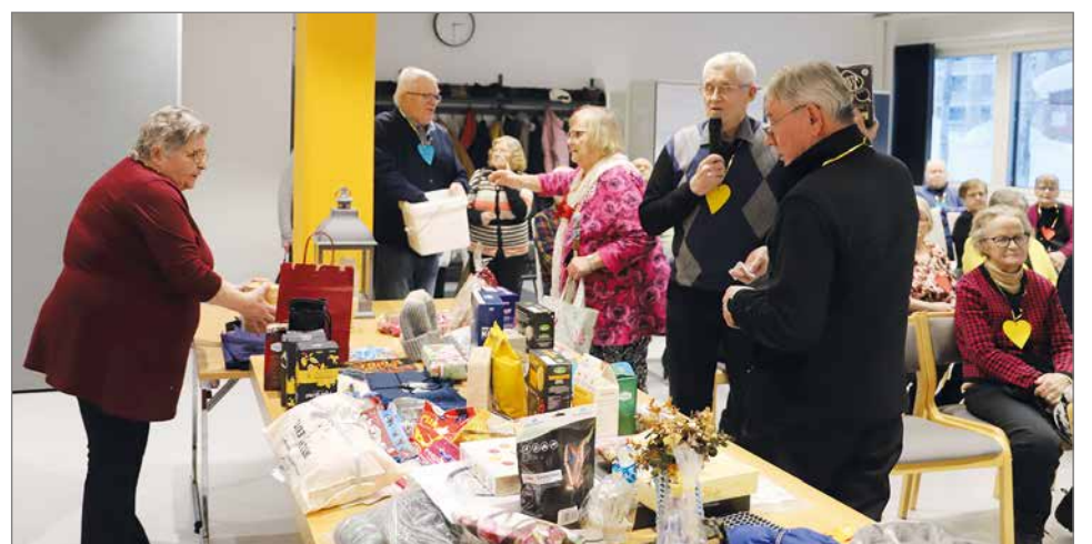
Arpajaispalkintoja oli todella runsaasti ja kaikki voitot tuli jaetuksi.