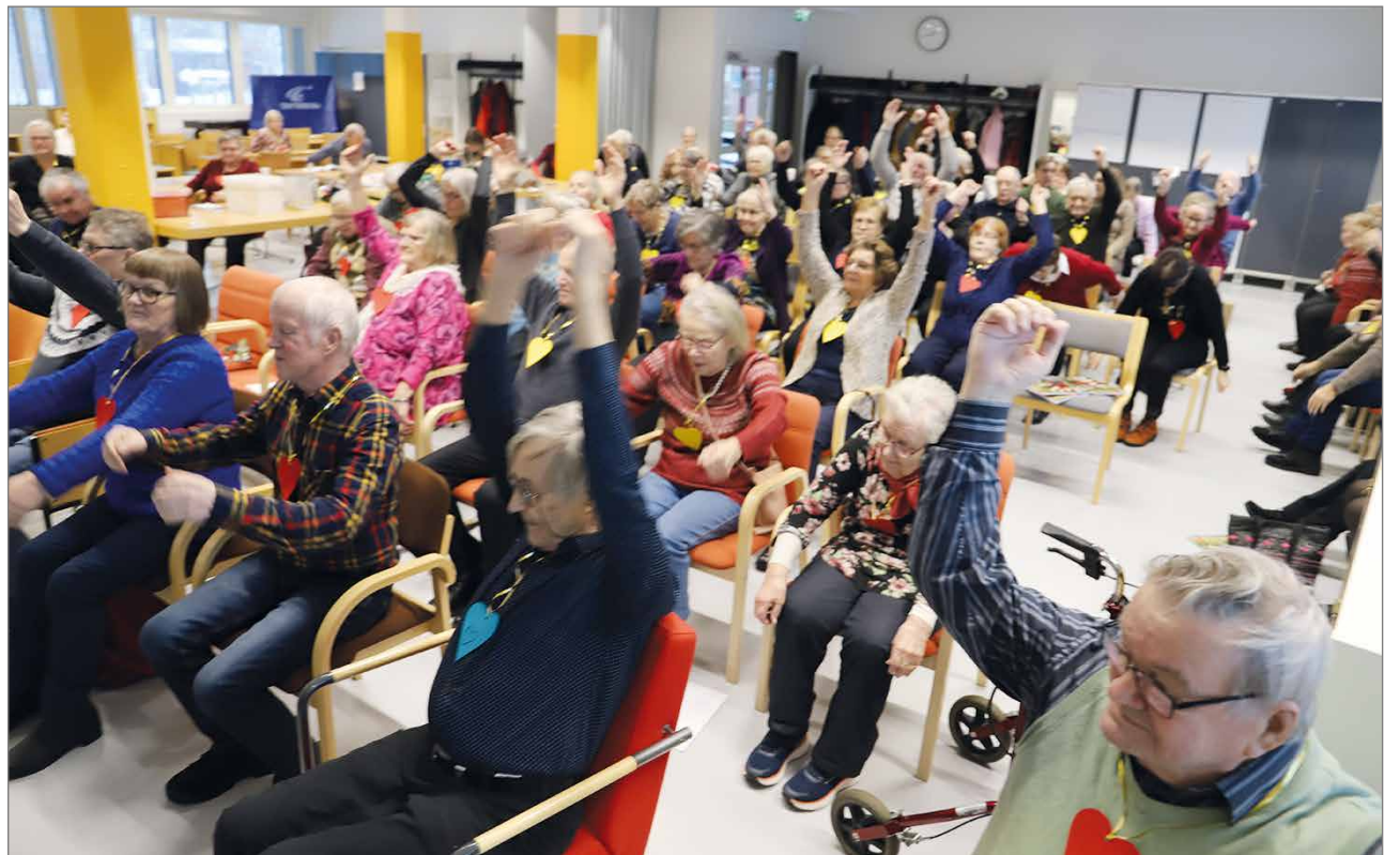
Tuolijumppaan osallistuttiin innokkaasti. Mukana oli reilut 80 henkeä.

Pudasjärveläisten terveisiä kertoi Sydänyhdis-