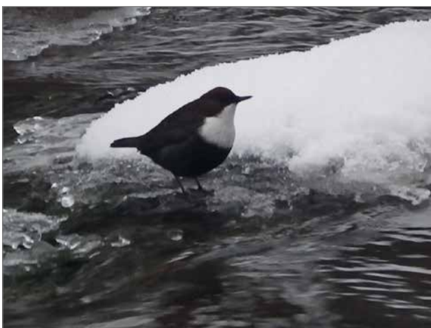
Välillä koskikara istuu kivellä ja visertää rupattelevaa lauluaan. Karalla on lyhyet siivet ja lintu lentää nopein siiveniskuin usein aivan vedenpintaa hipoen.

Koskikara on hyvin kevyt lintu. Karat pystyvät kävelemään virtojen pohjalla ravintoa etsien. Lintu osaa asettua etukeno asentoon, jotta kävely vastavirtaan onnistuu. Veden paine painaa lintua pohjaa kohden