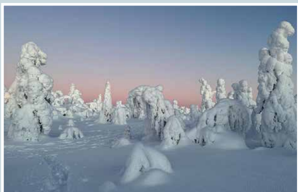
Talven ihmema.

lukijoiden palaute ja jutut: vkkmedia.fi