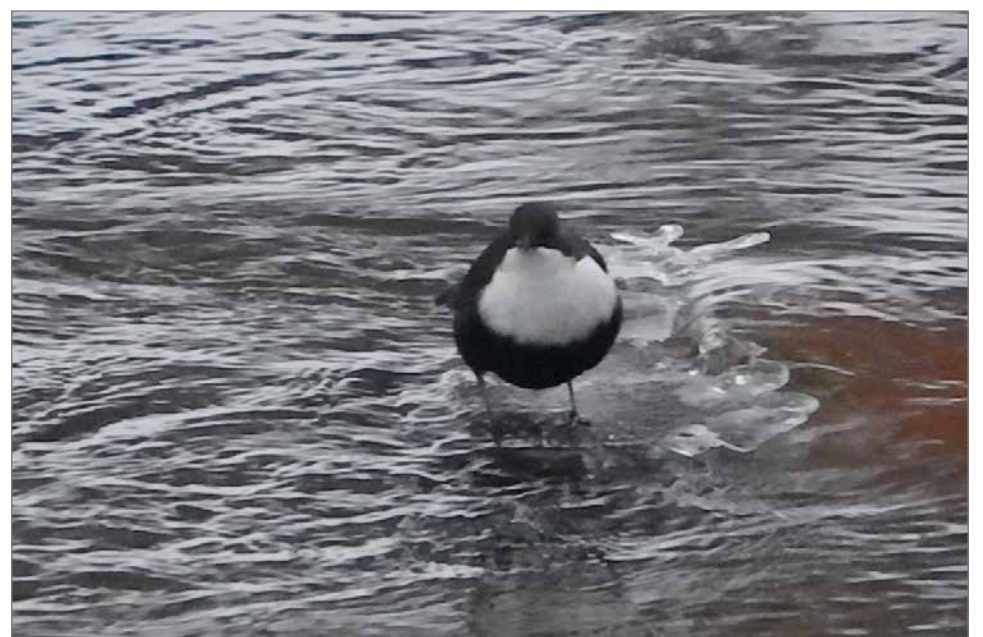
Karoilta kuluu koko lyhyt ja hämärä talvipäivä ravinnon hakuun virtaavan puron tai joen pohjasta.

riippuen hieman missä päin Suomea ollaan. Nimiä ovat olleet muun muassa koskikarastas, koskihakaraka ja koskiparooni. Menneinä kovina talvina saattoi koskikaraja olla suurimmilla koskilla kerralla kymmenittäin, kun pienemmät virtapaikat olivat jäätyneet umpeen. Kesäisin karan elinpiiriä ovat pienet kosket ja pesä on kuohuvan kosken partaalla aivan vesirajassakin turppaan kätöksessä tai kivenkolossa. Karalle ei ole niinkään tärkeää millaisissa maisemissa pesä on, vaan tärkeämpää on veden kirkkaus ja riittävän virtaava joki tai puro.