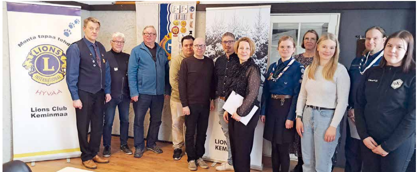
Isohaaran tulvaveikkauksen lienee vanhin yhtäjaksoinen rahankeruuprojekti Suomen Lions-liikkeessä. LC Keminmaa jakaa koko lyhentämättömän tuoton keväisin keminmaalaisille kouluille, urheiluseuroille ja nuorisjärjestöille. Kuvassa kevään 2023 stipendien vastaanottajia.

Valtakunnallisen Leijonahiihtotapahtuman tavoitteena on innostaa lapset suksille. Pienten lasten kannalta tapahtuma onnistuu. Toivottavasti Leijonahiihtoja voidaan jatkaa myös nuor-