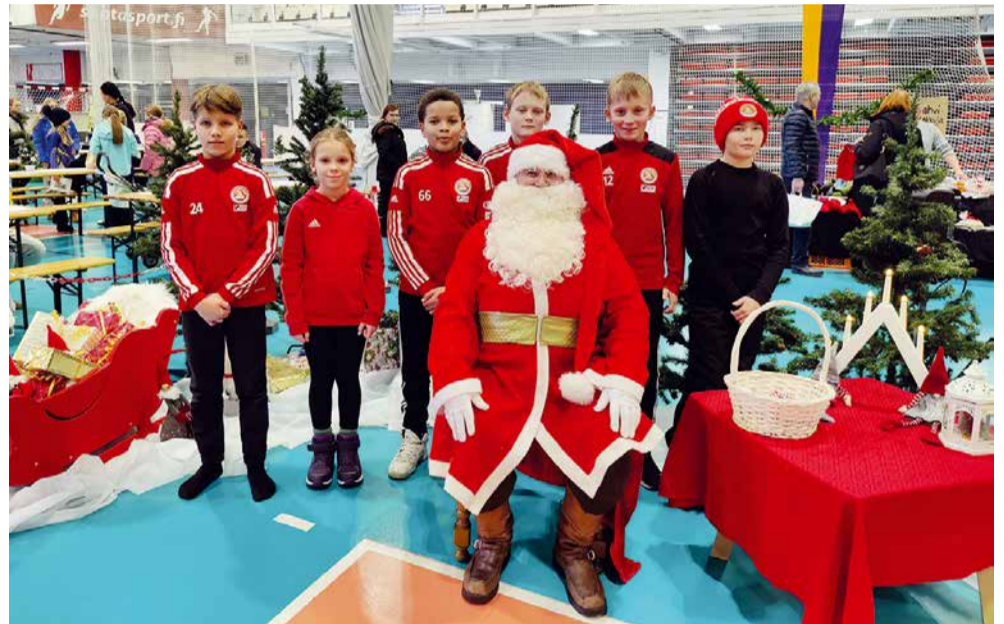
Joulupukki haastatteli myös FC Santa Clausin Junioreiden Pukinpoikien jalkapallo- nuoria heidän tulevasta Irlannin ystävyysottelureissustaan, jonka toteuttamisessa on myös klubimme osaltaan mukana.