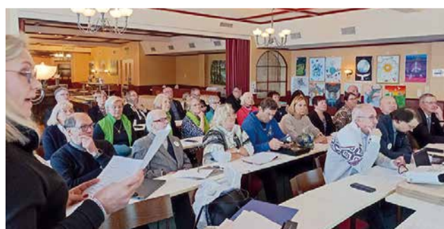
Piirihallituksen kokous Ylitorniolla, paikalla runsaslukaisesti lioneita.