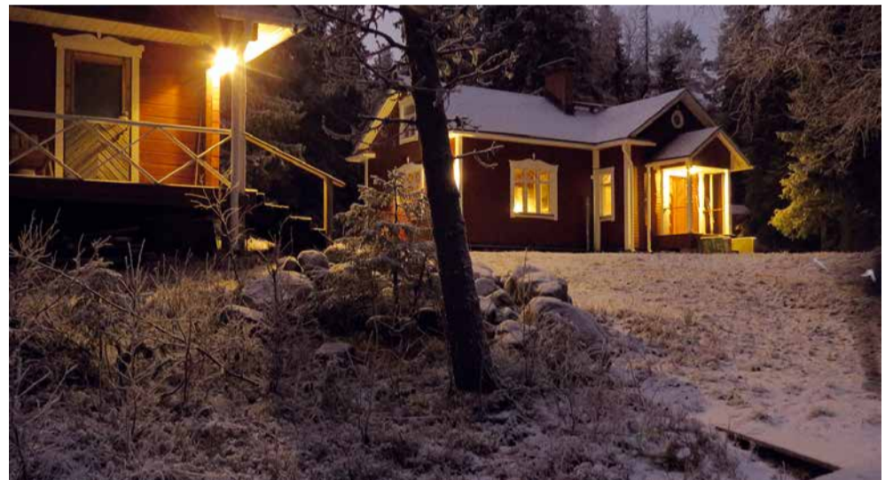
Partiolaiset esittivät vuonna 2021 toiveen Oijusluoman Eräkämpän sähköistyksestä. Valot helpottaisivat kämpän käyttöä pimeinä vuodenaikoina ja pihamaan valaistus toisi turvallisuuttakin.