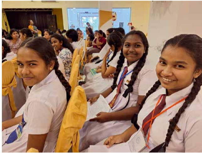
Kummilapset ja heidän vanhempansa valmiina haastatteluun Embilitiyassa.

Tukijäsenenä voit osallistua lähemmin Sri Lankan Lions