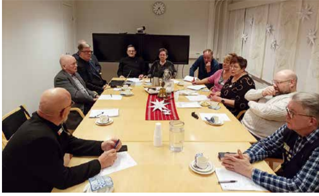
LC Tervolan klubi-illassa esiteltiin mm. klubin aktiiviteettejä.