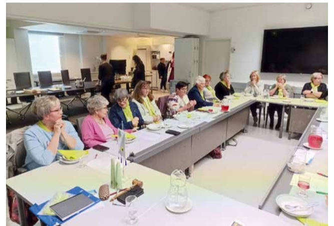
LC Pudasjärvi/Hilimat, samalla klubiin otettiin uusi jäsen.