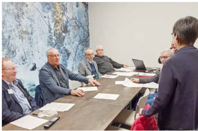
LC Kuusamo/Rukan yksi merkittävin aktiviteetti on L-piirin pinssi.