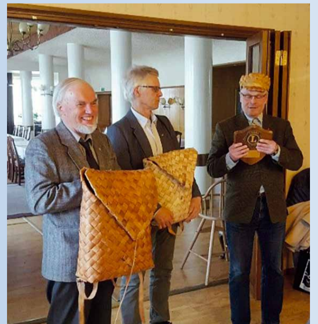
Ritari Kilven ryöstöretket toisiin klubeihin ovat hauskoja ja puhuttavat vielä vuosien jälkeen.