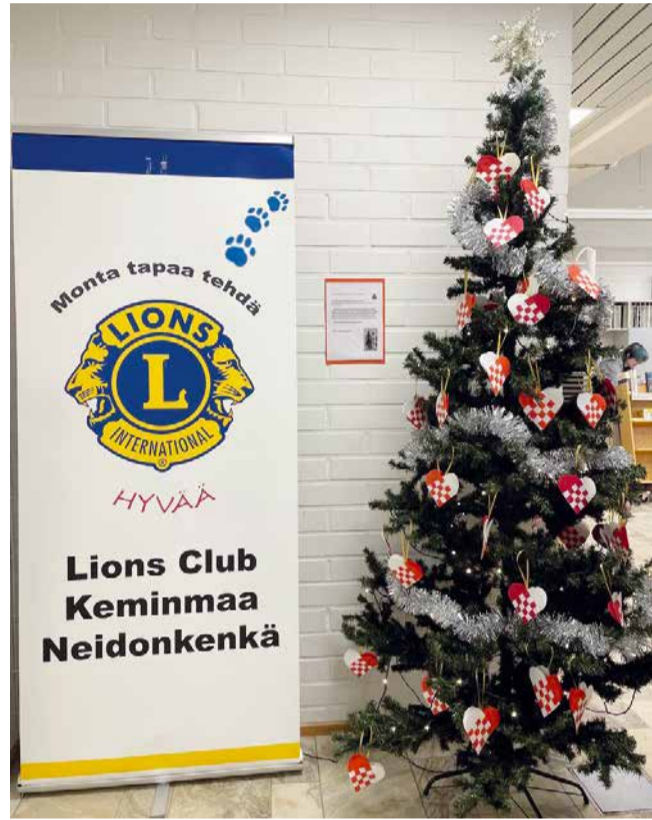
Hyvän mielen joulupuu.