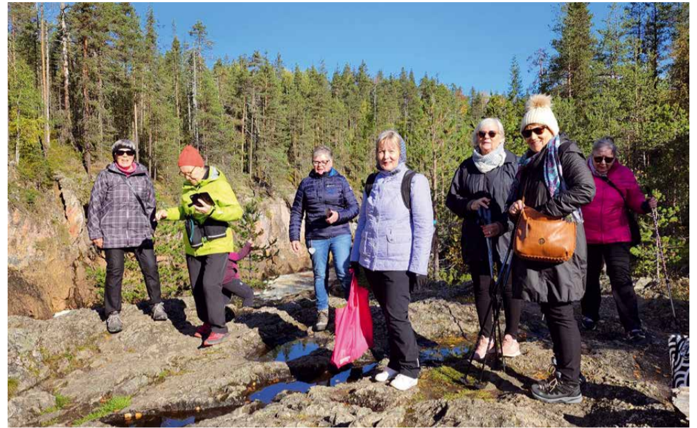
Lions Vantaa Vernissat syyskuussa 2023 Kuusamossa.

Kuusamossa olemme vienneet ystävyysklubiemme vieraita upeisiin luontokohteisiin, istuttu nuotion äärellä, ihasteltu revontulia ja juttu on luistanut. Yhteiset ravintolaillalliset ovat tuoneet