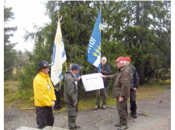
Syksyllä 2012, 20 N-piiriläistä vierailivat Lapissa Posion maisemissa. Vierailun yksi kohokohta oli Leijona Henki laulu Riisitunturin laella ja tietysti piirien liput mukana tunturissakin.