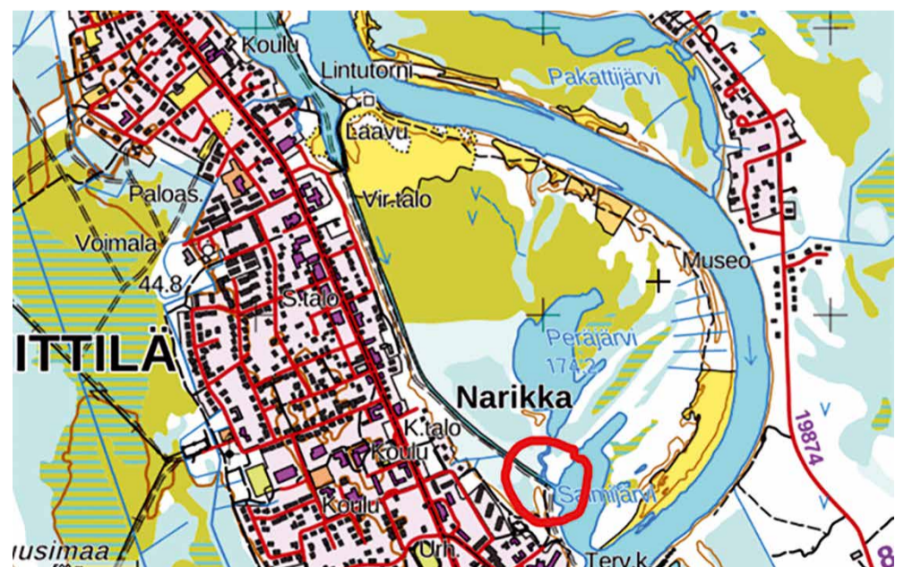
Sillan paikka punaisessa ympyrässä, josta oikealle tulee polku raivattavaksi.