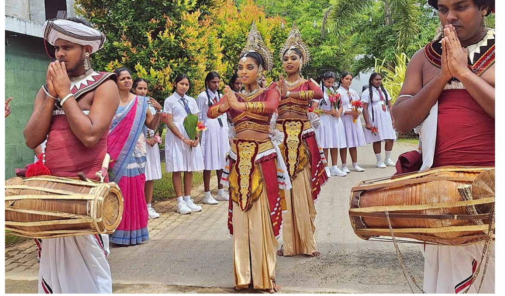
Tervetuloa Embilipitiyaan. Portilla tanssiryhmä ja kummilapset odottivat suomalaisia vieraita.