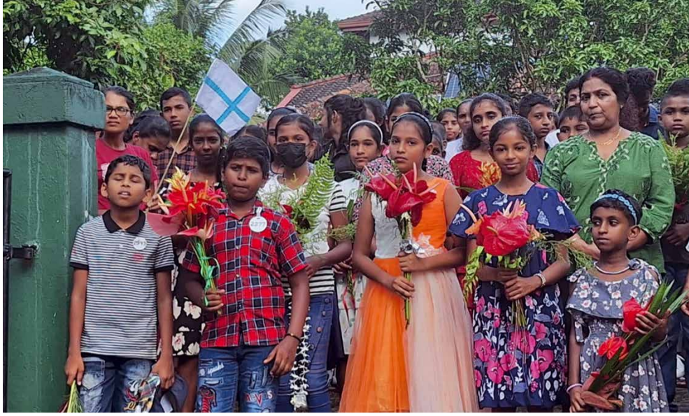
Tervetuloa Baddegaman klubin tilaisuuteen. Kummilapset ja heidän perheensä toivat suomalaiset kummit tervetulleiksi.