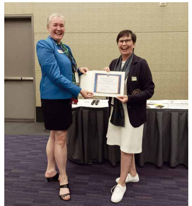
Todistus suoritetusta koulutuksesta.