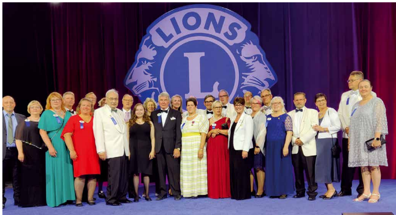
Tulevat Suomen piirikuvernöörit.