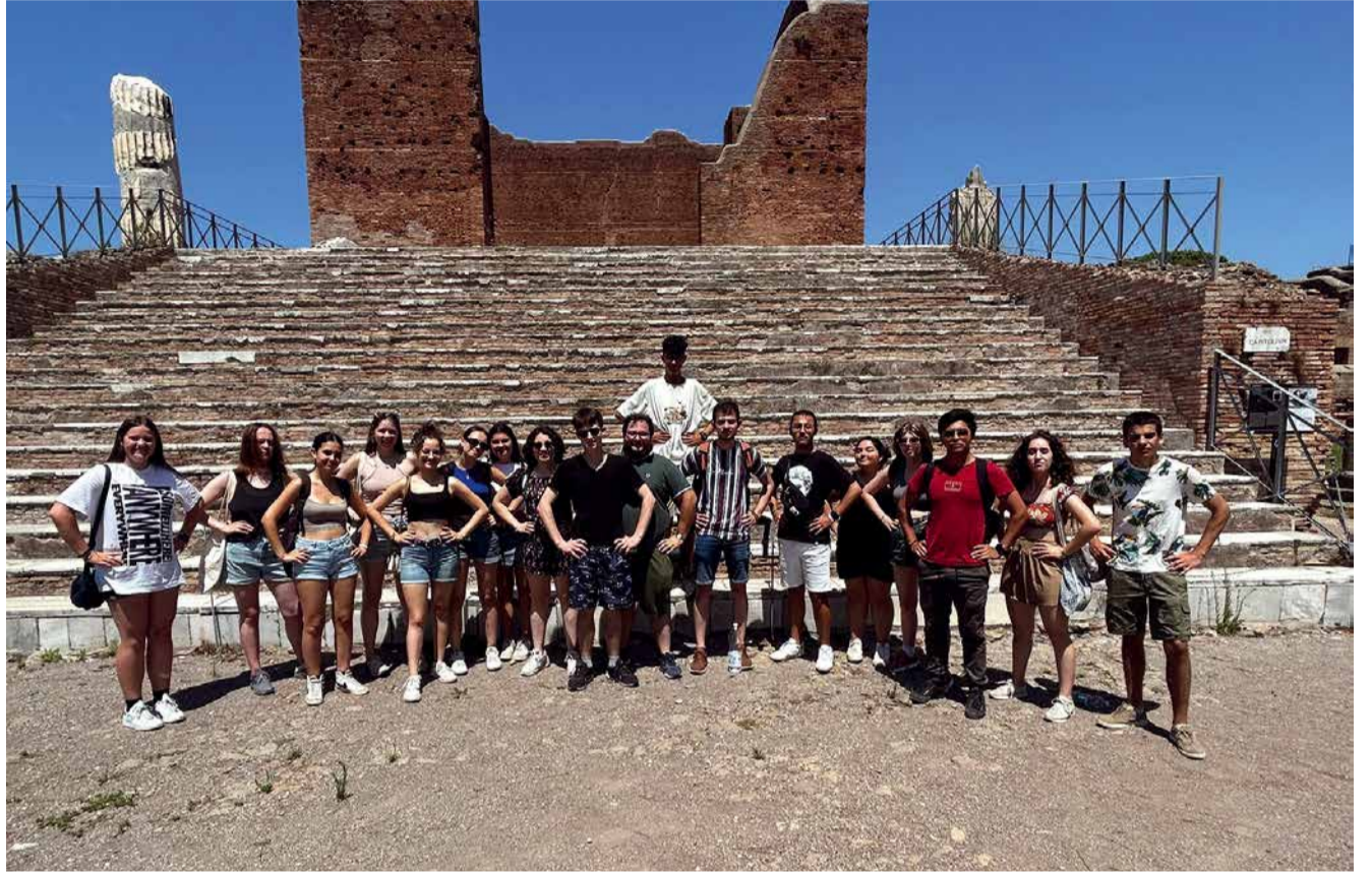
Yhteisellä leirillä oli nuoria ympäri maailmaa.