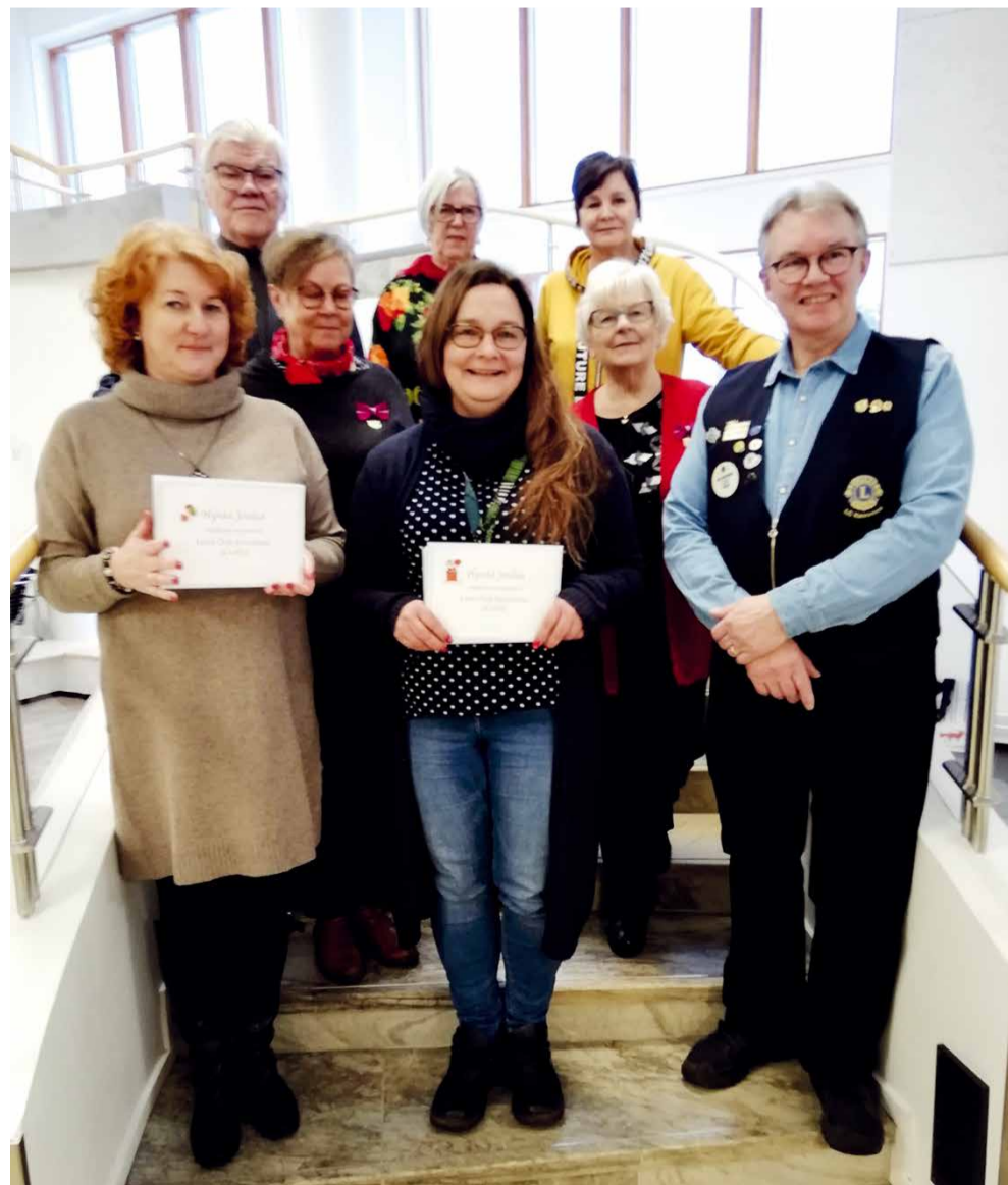
Perinteiset joulun lahjakortit luovutettiin vuonna 2023 ensi kertaa Lapin hyvinvointialueen edustajille jaettavaksi Keminmaan vähävaraisille perheille.

ten suuntaan. Suomessa ongelma on lasten liian aikainen kyllästyminen maailman terveellisimpään liikuntaan, hiihtoon.