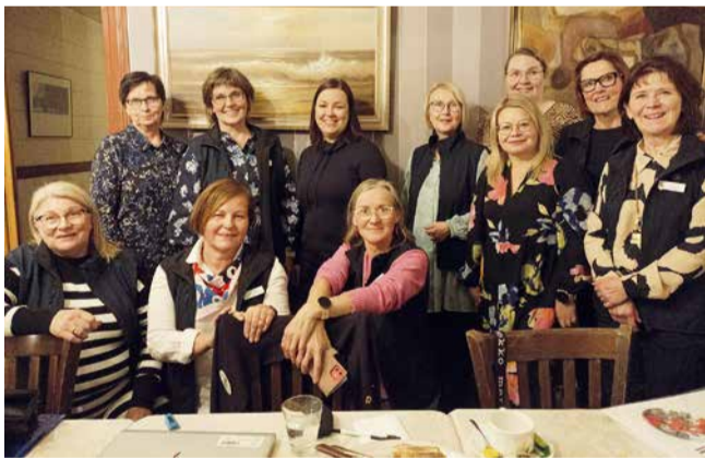
LC Keminmaa/Neidonkengät saivat kaksi uutta jäsentä klubi-illassaan.