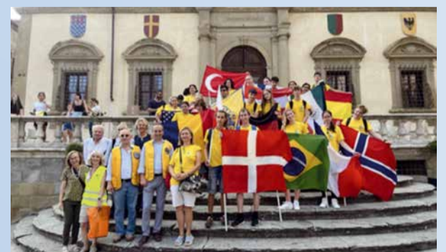
Kesällä 2023 Italiassa kansainvälisellä nuorisoleirillä olevat nuoret vierailivat Roomassa, Toscanassa ja Firenzessä.