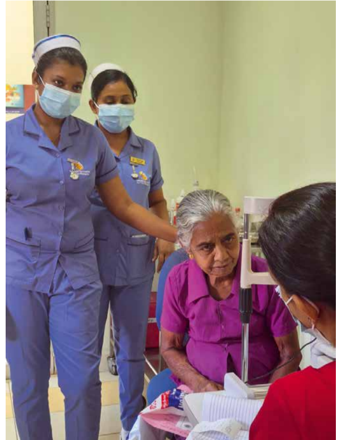
Haastateltavana onnellinen potilas, joka sai näkökyvyn liki 10 vuoden pimeyden jälkeen.