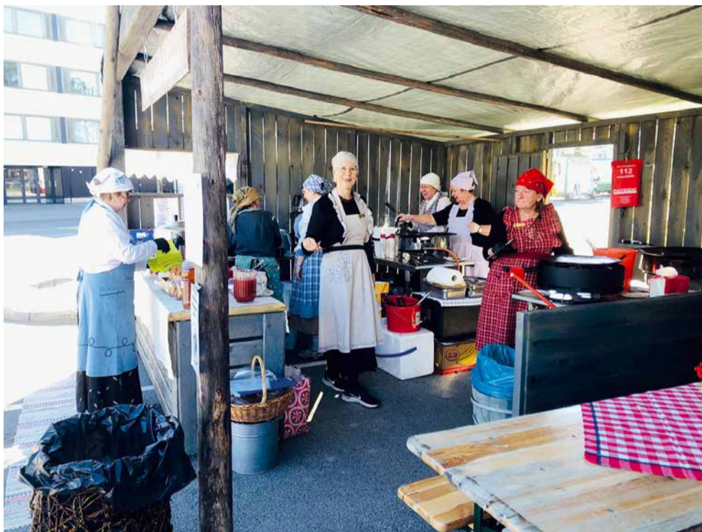
Iloisesta lättyjen myyntiporukasta on tullut myönteistä palautetta.

Viime kesän 2023 lättypuodin tuotoilla olemme voineet tukea mm. Rovaniemen Erityislasten omaisten ELO ry:n, Lapin keskussairaalan nuorten ja lasten psykiatriaosaston, Lapin CP-yhdistyksen, Rovaniemen kaupungin Etsivän nuorisotyön toimintaa sekä Mannerheimin Lastensuojeluliiton koululaisten loma-