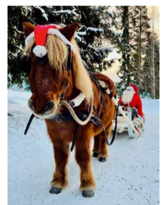
Myös meidän oma Joulupukkimme uskaltautui kokeilemaan ratsastusta ja toki myös hevosrekiäjelua, mikä oli hänelle hieman tutumpaa hommaa. Mutta ei nyt varmaan vielä kuitenkaan vaihtaisi poroja reen edestä pois!