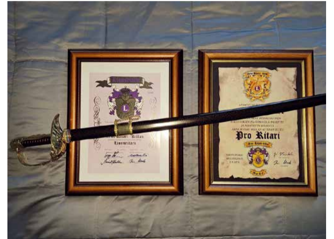
Kuvituskuvassa Ritari ja Pro Ritari -taulut ja Pro Ritareille luovutettava miekka.

Ymmärrämme, että maailmalla tarvitaan nyt paljon apuamme, etenkin Ukrainassa ja myös saapuneille