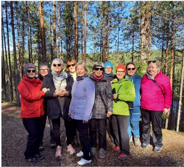
Lions Hämeenkyrön Kyröttäret lokakuussa 2023 Kuusamossa.