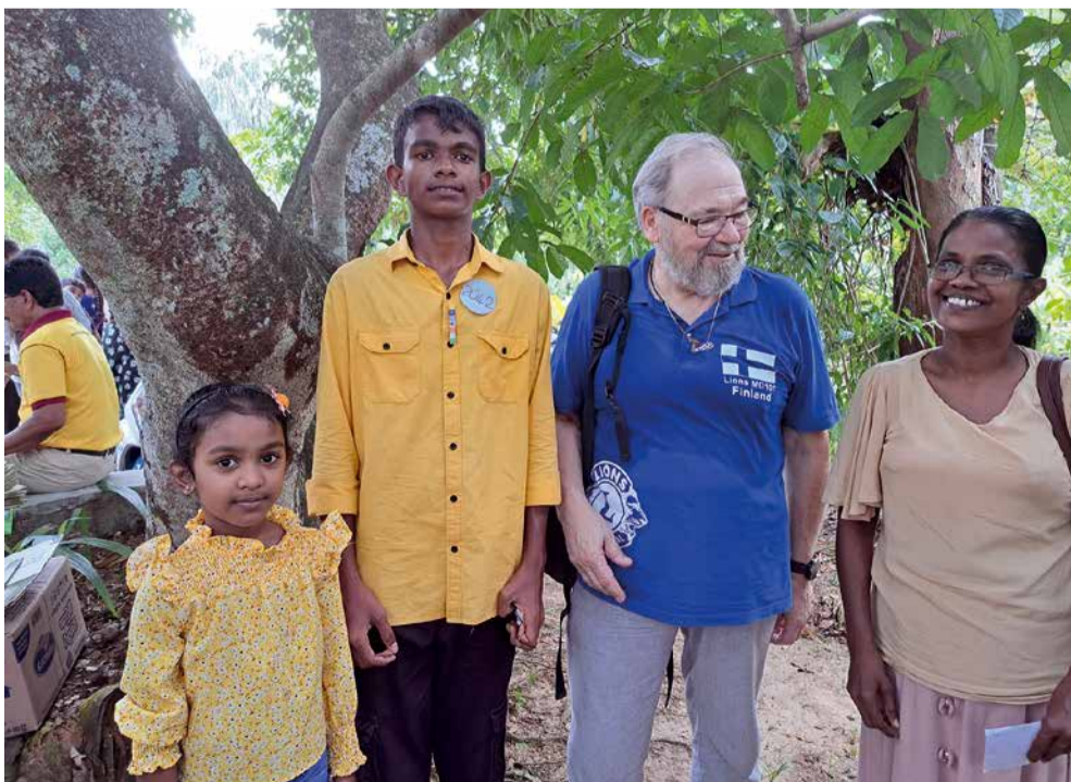
LC Rovaniemi/Pöyliön Kavindu äitinsä ja sisarensa kanssa.