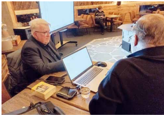
LC Rovaniemi/Lainaksen presidentti ja sihteeri toimeensa.