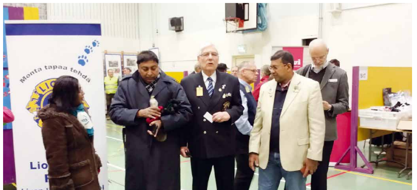
Viimeisimmälle vierailulle L-piiriin ja jälleen Posiolla ja Rovaniemelle Otto oli saanut mukana myös kansainvälisiä leijonia Saksasta ja Sri Lankasta, mihin heillä oli myös omat ystävyysuhteet.