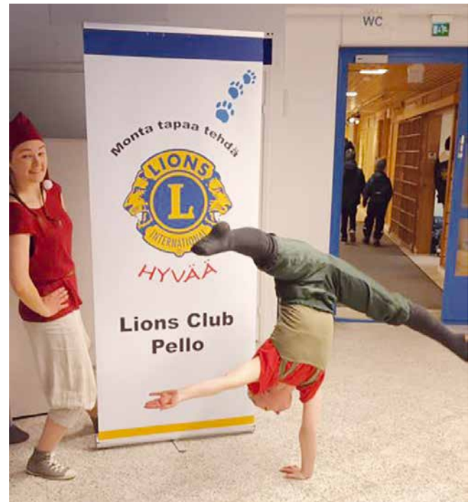
Pari taitavaa ja taipuisaa sirkustaiteilijaa esiintyi myös joulumyyjäisissä.

Olemme olleet mukana tukemassa Ukraina-ambulanssien ja Ukraina-kamiinoiden hankintoja.