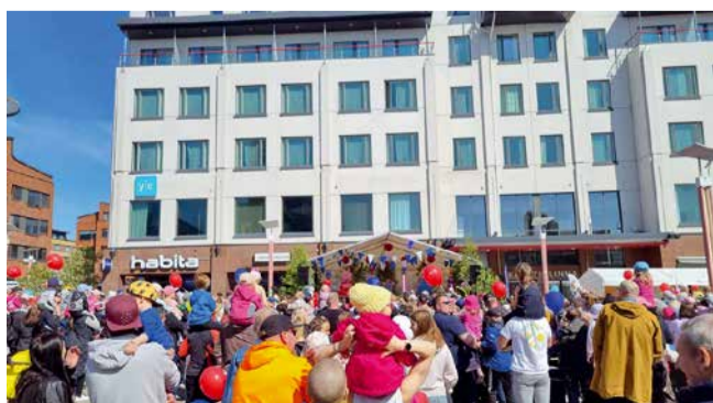
Klubimme leijonia oli järjestyksenvalvojina myös kesäkuussa Kulma-karnevaalissa Rovaniemellä.