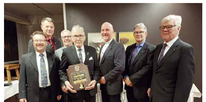
LC Keminmaan 65-vuotisjuhlassa klubin Melvin Jones jäseniä.