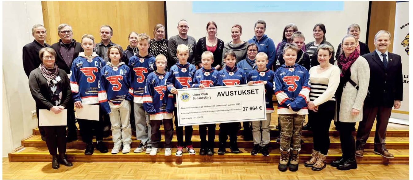
Vuoden 2023 Martin Pilkin tuotosta jaettiin tukea mm. nuoriso- ja urheiluseuroille sekä alueelliselle vanhustyölle.