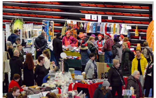
Joulumyyjäisten kävijämäärä ylsi jälleen n. 3500 henkilöön.

mukana ja tapahtuma onnistui todella hyvin. Tapahtuman tuotto lahjoitettiin Rovaniemen Mieli ry:n nuorten mielenterveystyön hyväksi. Monenlaista tapahtumaa on siis klubillamme vuoden aikana ollut ja monenlaista