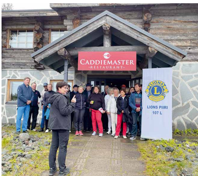
Lions L-piirin golftapahtuma heinäkuussa 2023.

tustumaan lajiin. Kilpailun voitto meni Kuusamoon, onnittelut voittajille. Yhteinen päivä oli onnistunut ja tulevana kesänä tavataan uudestaan!