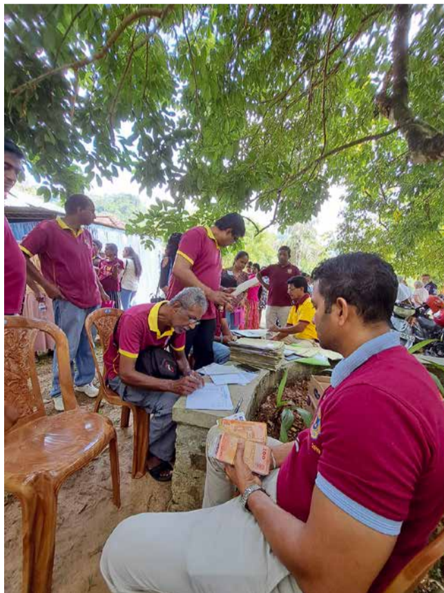
Paikallinen klubi maksoi kummilapsille tarkastuskäynnin aikana myös Suomesta tulleen kuukausiavustuksen.

"Et pääse elämässä pitkälle, ennen kuin alat tehdä hyviä tekoja toisten hyväksi."