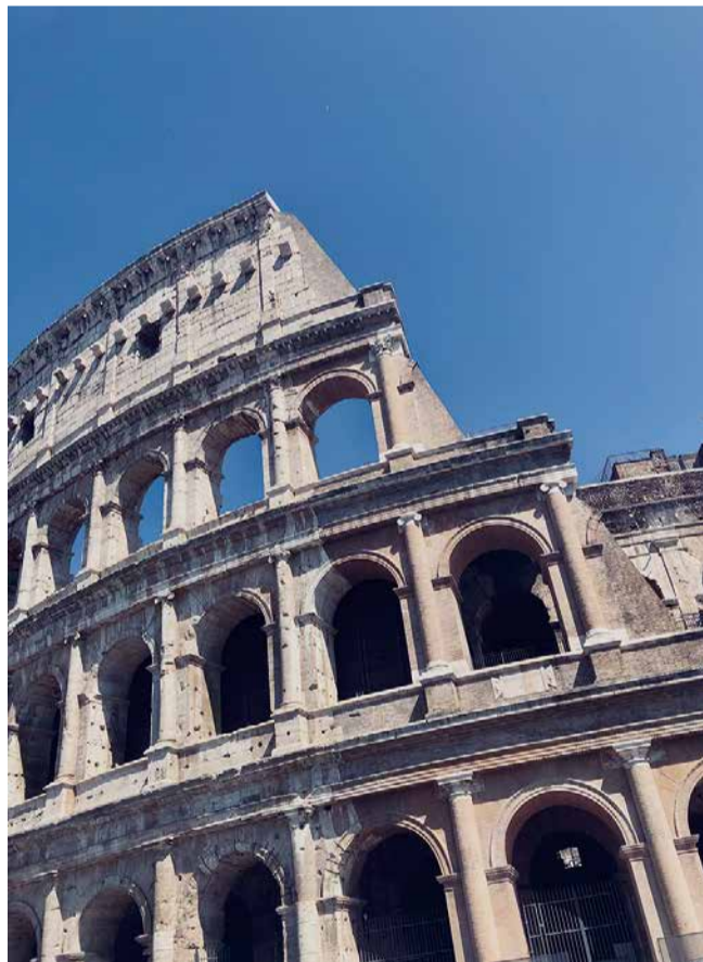
Roomassa oli paljon historiallisia paikkoja nähtävänä.