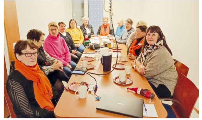
LC Rovaniemi/Ronjat klubi-illassaan. Samalla he saivat piirikuvernööriltä koulutusta Lion-järjestöstä.