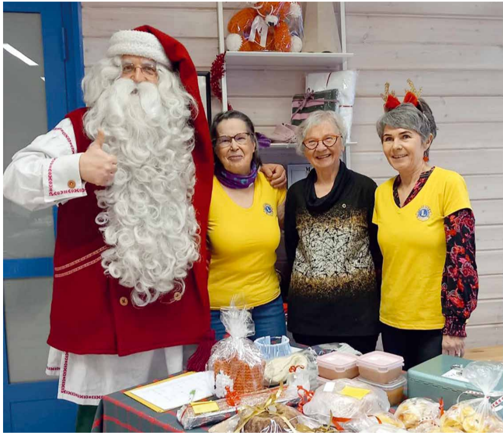
Pellon kunnan joulumyyjäisissä Vihreällä Pysäkillä kävi joulupukkikin tervehtimässä leijonia.