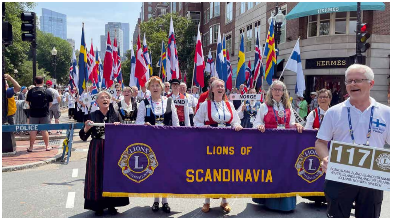
Pohjoismaiden lionit marssissa.

jelmiä. Toisaalta tämän päättökseen tulee lopultaan teemmään Turun vuosikokous.