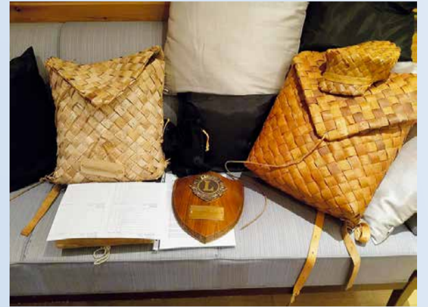
Ritarin kilpi ja tarvikkeet.