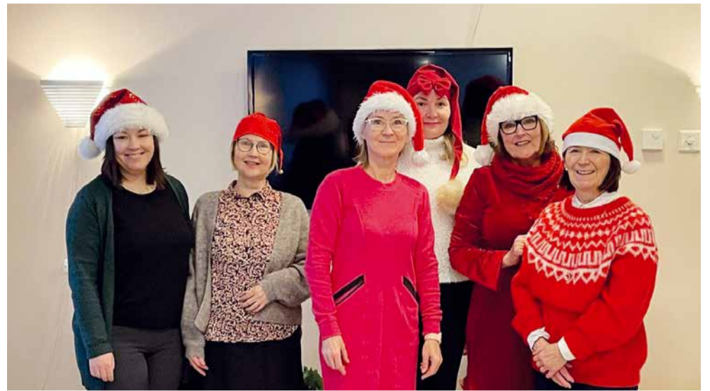
Leijona Sisaret Kallinrannan palvelukodissa 1. adventtina.

Perinteinen joululaulusessio Kallinrannan palvelutalossa ensimmäisenä adventtina sai ajatukset jouluun. Asukkaat ja omaiset ottivat meidät lämpimästi vastaan ja lauloivat kansamme tutuja joululauluja. Laulujen jälkeen kahvitelimme yhdessä asukkaiden ja henkilökunnan kanssa. Samoihin