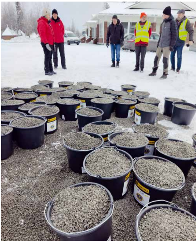
Lions Club Tornio Putaan hiekoitussepeä aktiviteetti toteutettiin toisen kerran.