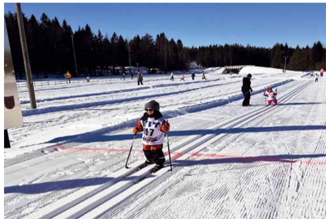
Leijona-hiihdot maaliintulo. Kallinkankaan hiihtokeskus tarjosi parastaan puhumattakaan lapsista, jotka nauttivat hiihdosta ja maaliintulosta.