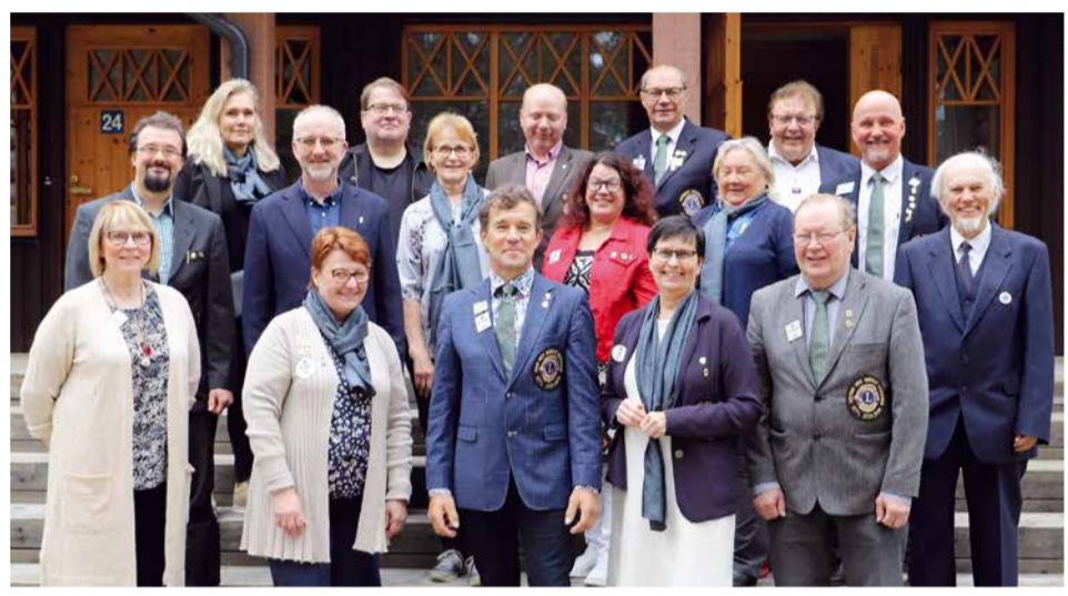
L-piirin hallitus kuvattuna Posion piirihallituksen kokouksessa viime syyskuussa.