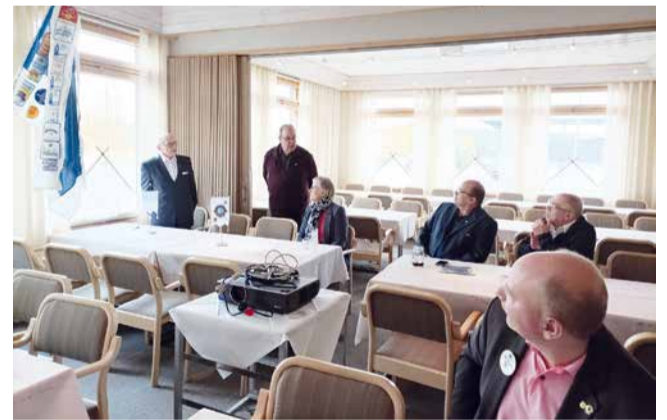
LC Enontekiön klubivierailulla.