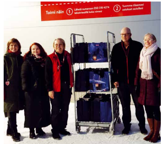
Keminmaan Citymarketin kauppiat, perhetyöntekijä yhdessä klubimme jäsenten kanssa.