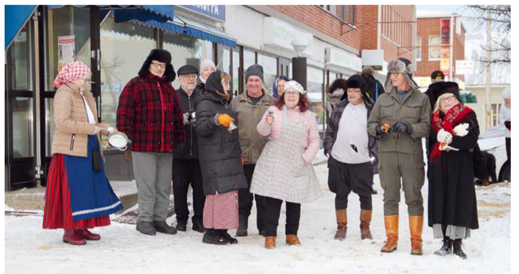
Iloinen römppäkulkue lähdössä reitilleen Römppäkortteli-tapahtumassa marraskuussa 2023.

Leijonaklubien toiminta on siis paljon enemmän kuin vain varojen keräämistä ja avun tarjoamista. Se on