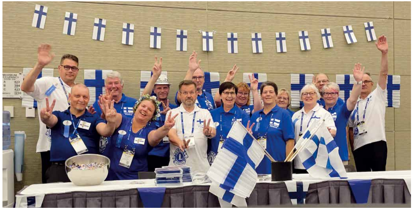
Valmistautumista Pohjoismaiden iltaan.

KVN-kokouksiin (kuvernöörineuvosto) olen osallistunut aktiivisesti ja vienyt sinne piirimme toimintamalleja kuten GAT-tiimin kiertämisen esim. lohkofoorumissa. Toimintamallimme on ollutkin hyvä ja siihen on palattu usein keskusteluissa. KVN-kokouksessa olemme myös päättäneet hakea joko vuodelle 2030 tai 2031 (molempia haettu vaihtoehtoisesti) kansainvälistä kokousta Suomeen. Olemme iso lionmaa ja meillä voi olla mahdollisuus saada kokous Helsinkiin. ”Kutsu lioniksi -kampanja” tullaan toteuttamaan kolmen vuoden aikana ja saada uusia jäseniä toimintaan. Tämä tukee Mission 1.5 sekä Strategia 2030 oh-