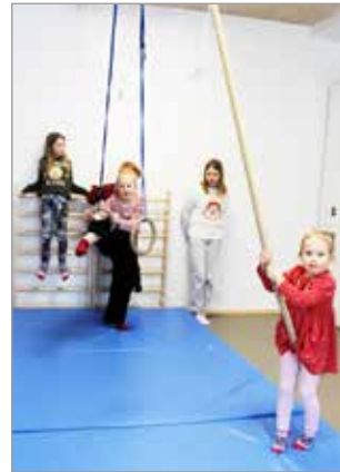
Kotikujan päiväkotitoiminta on rakennettu moneen koloon erilaisia liikuntaan kannustavia ympäristöjä.

Haminan koulun viereen Iin keskustaan valmistui kunnan uusi Kotikujan päiväkotitoiminta. Avajaisissa kävi mukavasti kuntalaisia ja uudet tilat herättivät heissä ihastusta. Päiväkotitoiminta on rakennettu erilaisia liikuntaan kannustavia ympäristöjä.