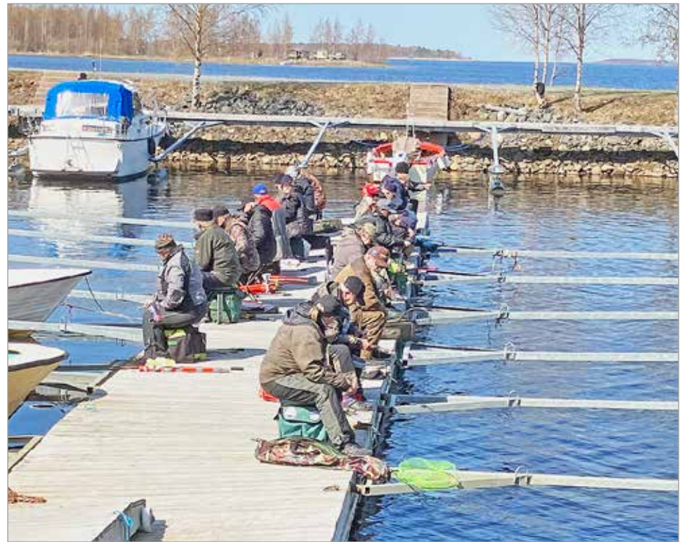
Laituripilkissä kilpailijat vierivieressä seurasivat omaa ja samalla myös naapurien saalistusta.