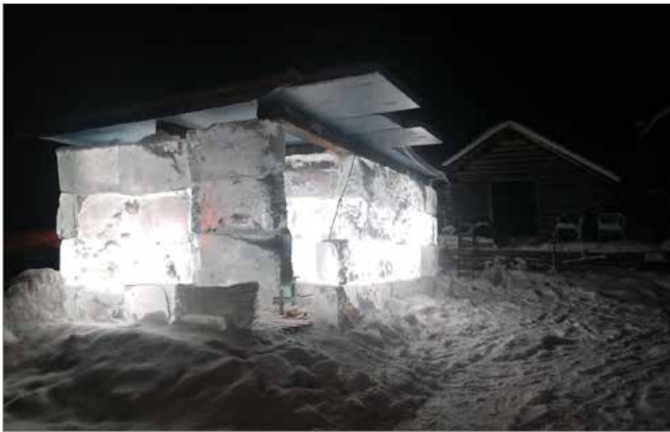
Jääsauna näkyy led-valojen ansiosta kauas lijoen vastarannalle saakka. (Kuva Joonas Kuismanen).