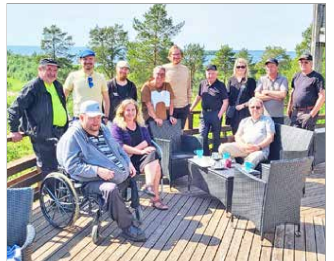
Kuivaniemen Yrittäjien järjestämän tutustumisretken osallistajat kahvitaulla aurinkoisessa Merihelmessä.