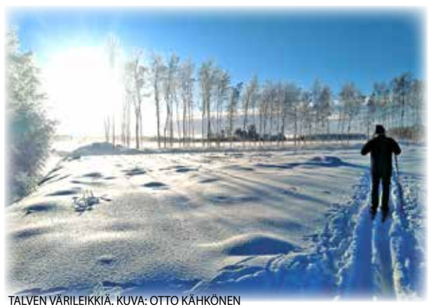
TALVEN VÄRILEIKKIÄ.

lukijoiden palaute ja jutut: vkkmedia@vkkmedia.fi