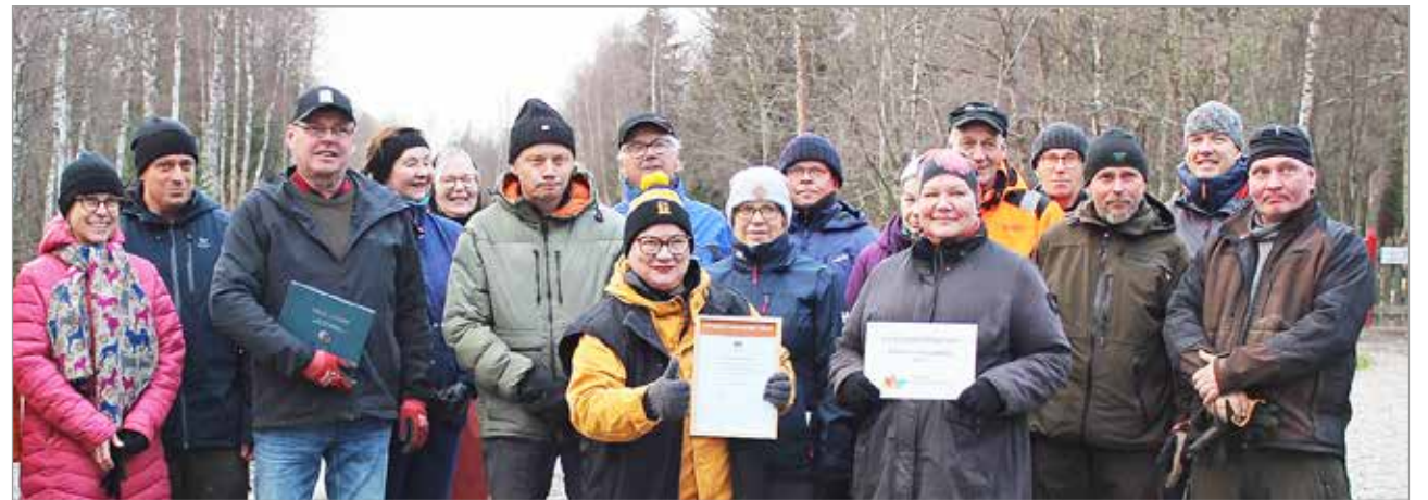
Vuoden maisematekopalkinnon luovuttaneet Oulun Maa- ja kotitalousnaisten edustajat yhdessä Pohjois-Iin kyläyhdistyksen aktiivien kanssa Hiastinhaaran maisemissa.

Hiastinhaaran varrella. Kyllällä on tehty valtaisa määrä talkootyötä 10 vuoden aikana. Maisematunnustusta juhliittiin Hiastinhaaran lautumilla ja laavulla lokakuun puolivälissä järjestetyssä palkinnon luovutustilaisuudessa.