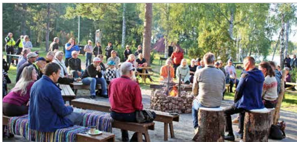
Metsäkeskustelu keräsi runsaasti yleisöä nuotion äärelle.