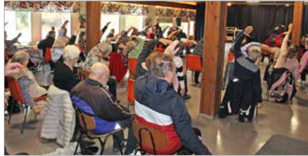
Vanhustenviikolla eläkeläisjärjestöjen jäsenten Musiikki- ja liikuntapäivä aloitettiin yhteisellä tuolijumpalla.