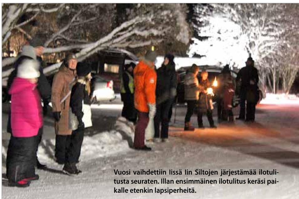
Vuosi vaihdettiin Iissä Iin Siltojen järjestämää ilotulitusta seuraten. Illan ensimmäinen ilotulitus keräsi paikalle etenkin lapsiperheitä.

Popparoikka musisoimassa Iin Siltojen ravintolassa.