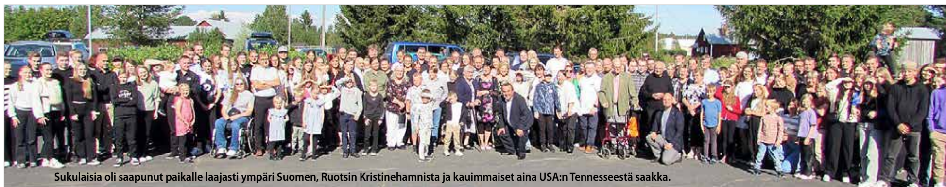
Sukulaisia oli saapunut paikalle laajasti ympäri Suomen, Ruotsin Kristinehamnista ja kauimaiset aina USA:n Tennesseestä saakka.