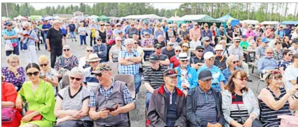
Kaunis ja kesäinen sää veti omalta osaltaan markkinoille runsaasti yleisöä.