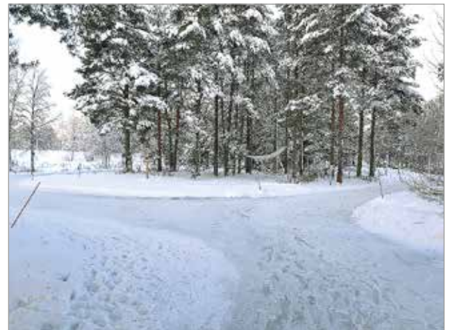
Taidepuiston jää odottelee luistelijoita. Kiertosuunta on merkatu opastein.