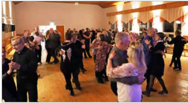
Lippuja myytiin talon täydeltä, josta tanssien järjestäjä Kuivaniemen Nuorisoseurassa oltiin oikein tyytyväisiä.