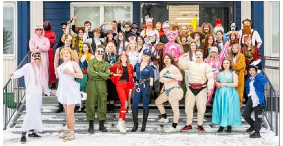
Huhtikuun 2023 abit kokoontuivat perinteiseen ryhmäkuvaan lukion portaille.