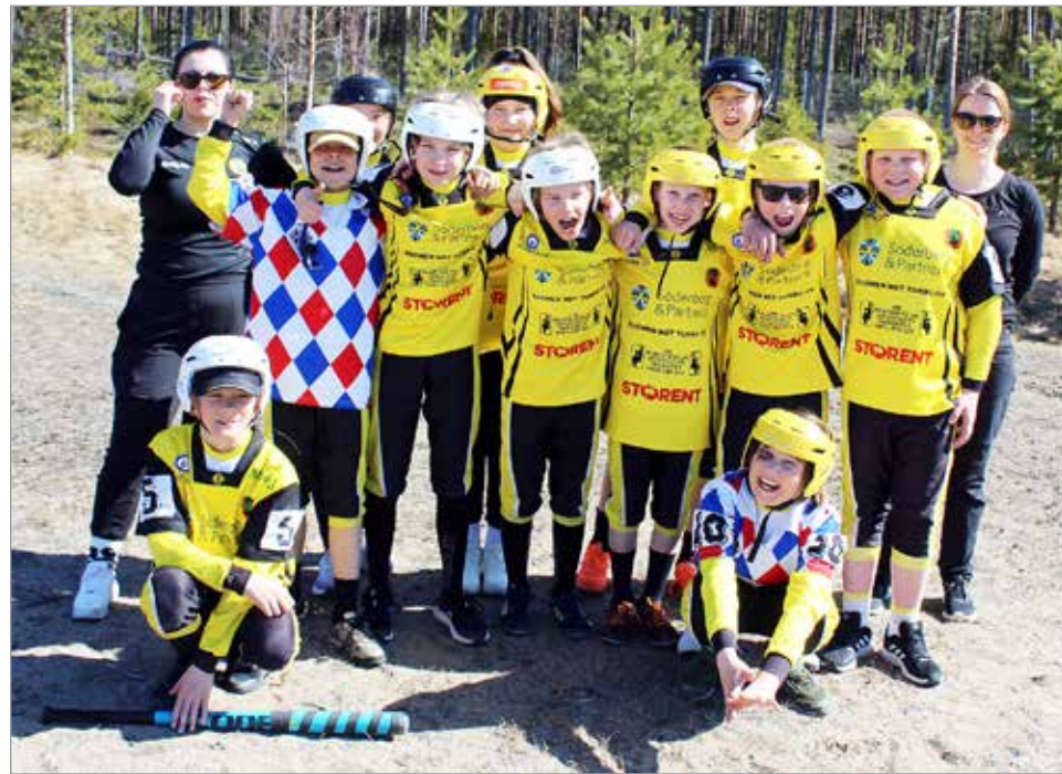
Iin Urheilijoiden E-juniorit pelasivat 2023 sekajoukkueiden sarjaa.