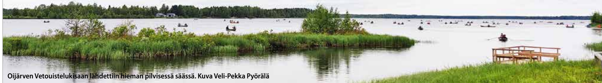
Oijärven Vetouistelukisaan lähdettiin hieman pilvisessä säässä.

Gould ja Ursus Factory, jotka villitsivät noin 200-päistä rokkiyleisöä.