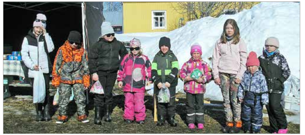
Särkijärven osakaskunnan pillkikilpailun nuorten sarjoissa palkittiin kaikki pillkikisaan osallistuneet, jotka maltoivat jäädä odottelemaan palkitsemista.