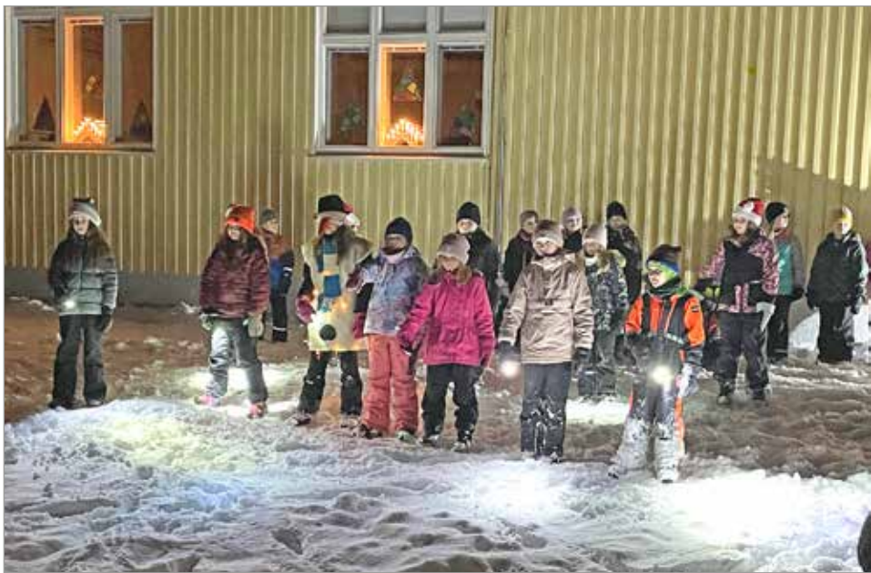
Esityksessä valoilla luotiin tunnelmaa pimenevään talvi-iltaan.