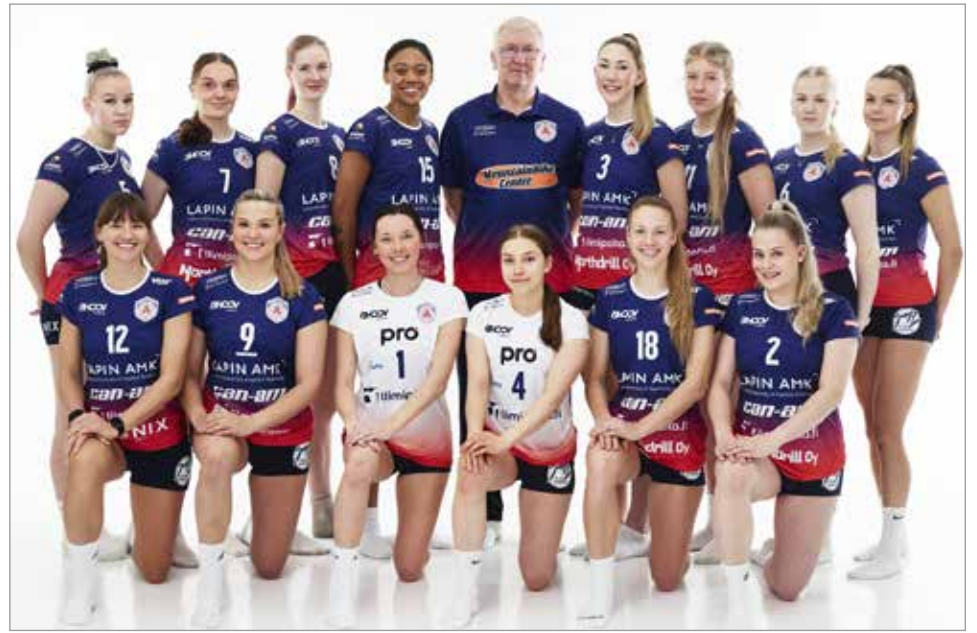
Arctic Volley Rovaniemeltä joukkuekuva.

Tammikuun 29. päivänä 250 katsojaa saapui Iisi-areenalle katsomaan mestaruusliigatason lentopalloa. Tällä kertaa Arctic Volley kohtasi Hämeenlinnan Lentopallokerhon ja ArVo voitti ottelun erävoitoin 3-1.