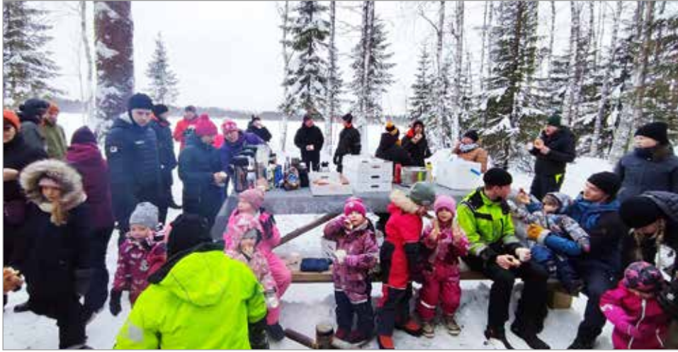
Hyrssä 2.12. vihittiin Herrainpolun luontopolku. Vuosijärven laavulla nautittiin kahvit ja mehut käristemakkaroitten kera.