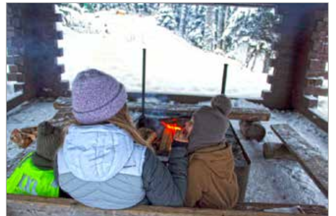
Leppoisassa tapahtumassa makkara maistui hiihdon lomassa.