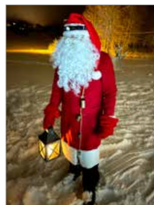
Jakun joulujuhlaan saapui myös joulupukki, jolla ikävä kyllä oli silmälasit aivan hurrussa.