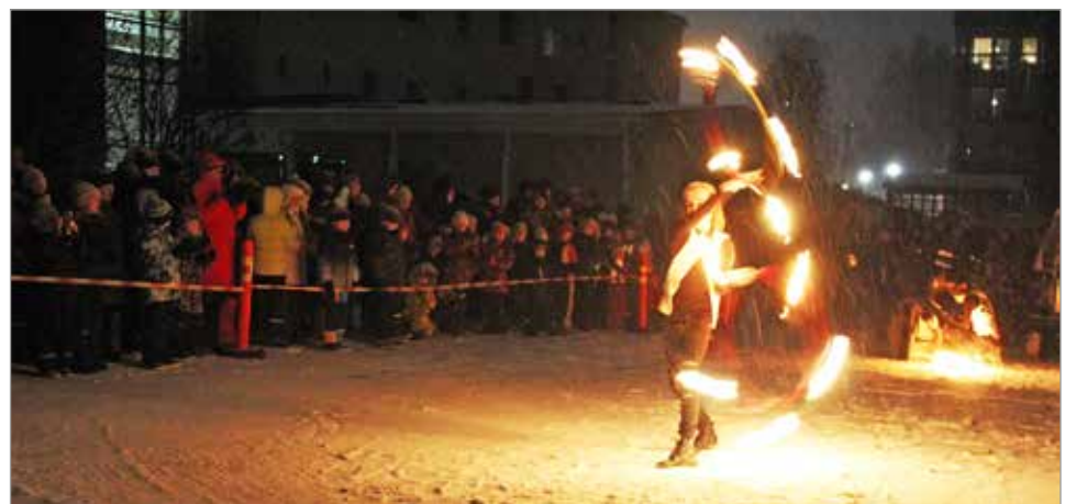
Valtakunnallisen mielenterveysviikon avajaispäivän ohjelmanumero Tulishow keräsi kunnantalon pihalle yli 200 katsojaa.