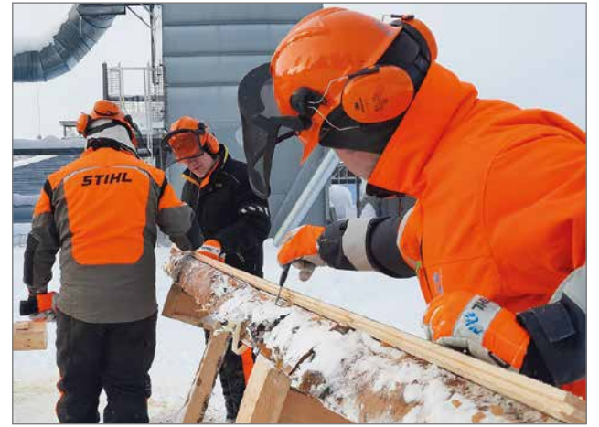
Hirsi- ja korjausrakentamisen koulutuksessa suuntaudutaan perinteiseen rakentamiseen.

Lisätietoa koulutuksista ja itselle parhaasta hakutavasta on saatavana. OSAO Ovi -hakijapalveluista saat hakemiseen liittyvää ohjausta ja neuvontaa. OSAO Pudasjärven yksikön opin-