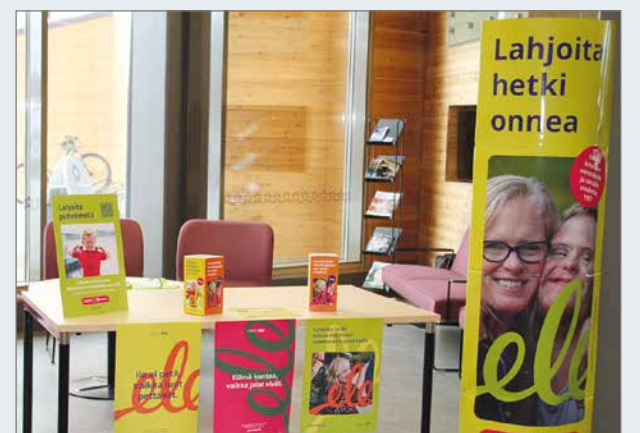
Tuhannet vapaaehtoiset toimivat ympäri Suomen pieni ele -lipasvahteina presidentinvaalien äänestyspaikoilla keräämässä lahjoituksia vammaisille ja pitkäaikaissairaille.