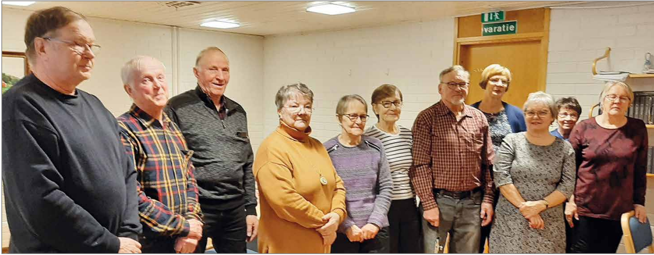
Vuoden 2024 yhdistyksemme hallitus yhteiskuvassa.