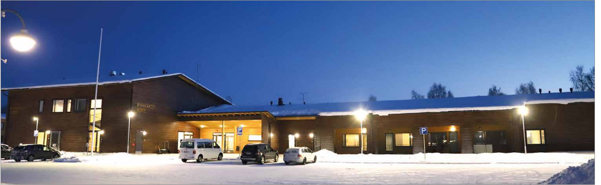
Onnelliset asukkaat pääsivät muuttamaan 9.1. Ryhmäkoti Kortteen uusiin tiloihin Pudasjärven torin laidalle.