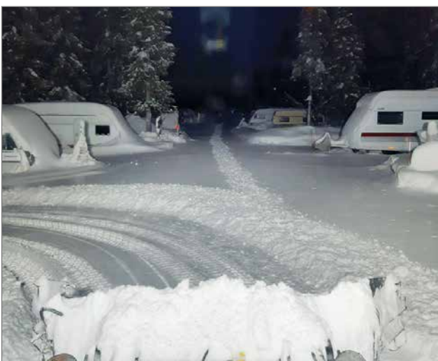
Talviaikaa vaunuaalueella on runsaasti lääniä aurattavaksi.

Nykyisin Syöte Camping työllistää yrittäjän itsensä sekä osa-aikaisesti hänen avopuolisonsa. JK