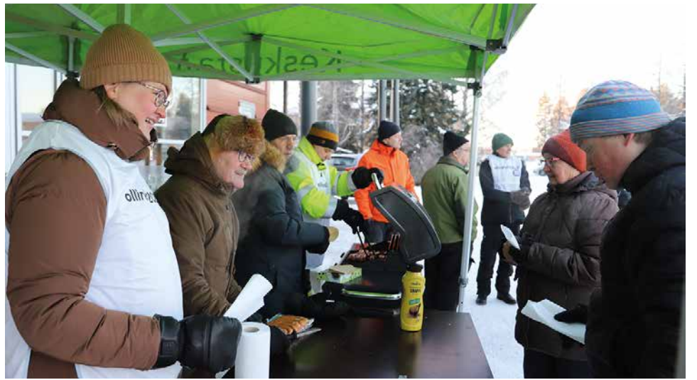
Keskustan vaaliteltalla S-marketin edustalla paikalliset aktiivit tarjoilivat perjantaina 12.1. grillimakkaraita ja suosittelivat presidenttiehdokas Olli Rehniä seuraavaksi presidentiksi.