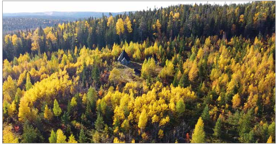
Teerikoda sijaitsee Teerivaaran upeissa maisemissa.