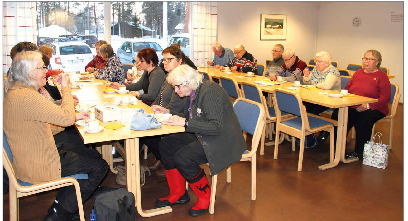
Uuden vuoden ensimmäisessä kerhossa mietittiin presidentinvaaleihin liittyviä sanapareja.