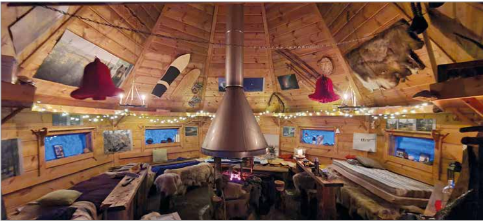
Matti Kinnusen yrityksen toimintaa tapahtuu Teerikodalla Teerivaaralla, jonne on luontokeskukselta noin kilometrin mittainen matka.