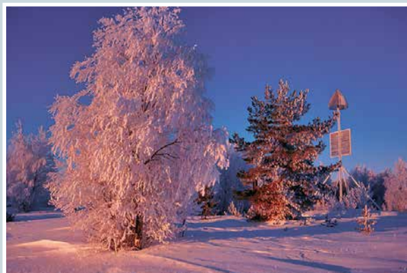
Talviaamu satakarin saarella.

lukijoiden palaute ja jutut: vkkmedia.fi