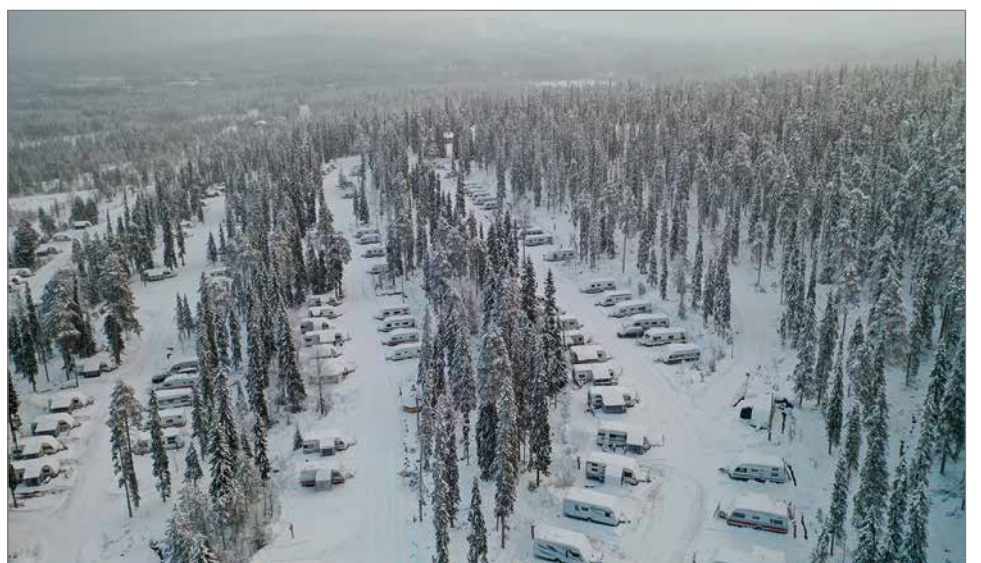
Syöte Campingin alueelta löytyy noin 300 vaunupaikkaa, joista valtaosa on kausipaikkoina.

- Parhaimmillaan meillä majoittuu yhden yön aikana noin 700 henkeä, varsinkin sesonkikautena alue on aivan täynnä. Erityisen ruuhkasta on syyskuussa pidetyn rekkaviikonlopun aikana, pääsiäisen aikaan sekä