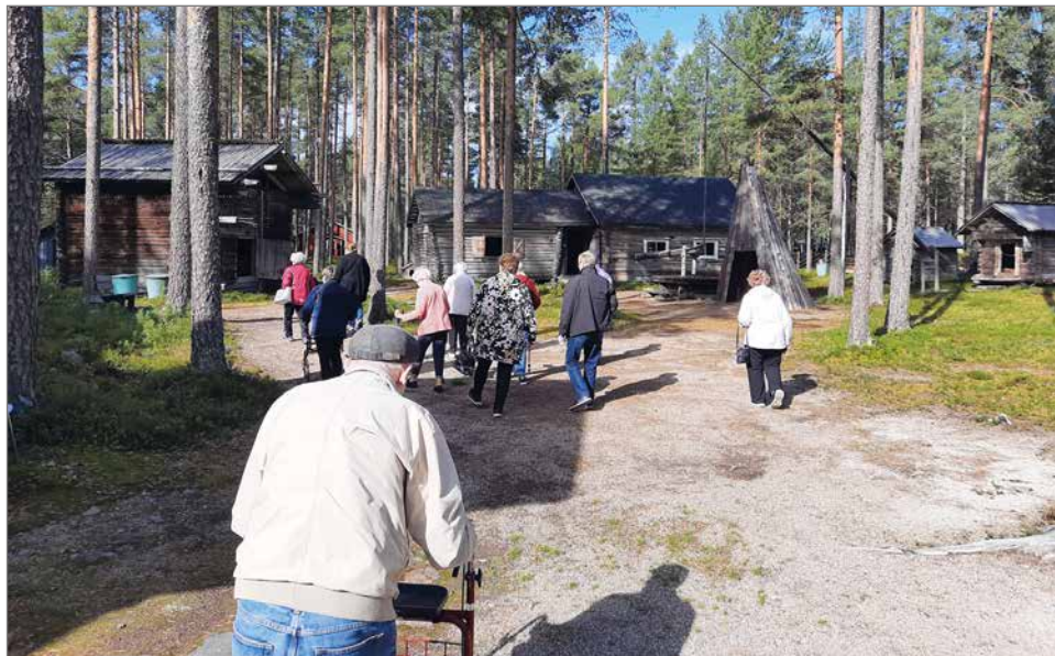
Kesällä 2023 ikäihmisten liikuntaryhmä vieraili kotiseutumuseolla.