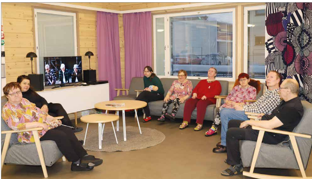
Yhteisistä tiloista löytyvässä tilavassa olohuoneessa asukkaat viihtyvät muun muassa televisiota katsellen. Lisäksi ovat yhteiset ruokailutilat sekä sauna ja pukuhuoneet.