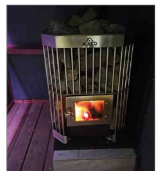
Löylyistä pääsin nauttimaan joulun aaton aattona Boiestownissa.

ja maassaololuvan jatkohakemiset etenevä. Nyt on viiden vuoden luvat hakusessa ja sen jälkeen voisi anoa myös kansalaisuutta. Täällä ei voi poistua ennen kuin lupa-asiat ovat kunnossa, koska takaisin ei pääse ilman voimassa olevia lupia. Maassa voi sen sijaan oleskella ja tehdä töitä, kun hakemukset ovat käsittelyssä. Mutta jos mahdollista, niin ensi kesänä olisi aikomus poiketa Suomessa.