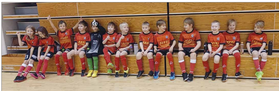
P/T9 aloitti ensimmäiset sarjapelinsä Jatulissa joulukuussa.

P19- joukkue on pelannut menestyksekkäästi sarjansa kärkipaikoilla, mutta SM-lopputurnaukseen paikka joukkueelle on auennut vain 15-vuotiaiden ikäluokassa kuusi vuotta sitten. Viime kaudella joukkue eteni jatkokarsintaan saakka. Tälle kaudelle lähdettiin kovin odotuksien. Pelaajien taso on kova, peräti kolme on pelannut liigakentillä yhteistyöseura TopVin riveissä ja maajoukkue-edustajakin joukkueesta löytyy. Valitettavasti on ollut kuitenkin laadukkaan pelaajien niukkuus. Tälle kaudelle kiiminkiläisestä LaFKista saatiin uusia pelaajia, jotka miesten jalkapallojoukku-