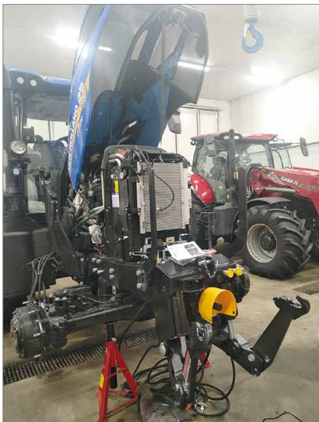
Koskitraktorilla pakkaset harvemmin aiheuttavat yllättäviä kiireitä, koska työt ovat useimmiten suunniteltuja raskaan kaluston huoltoja, kuten kuvassa käynnissä oleva uuden traktorin varustelu- ja luovutushuolto.