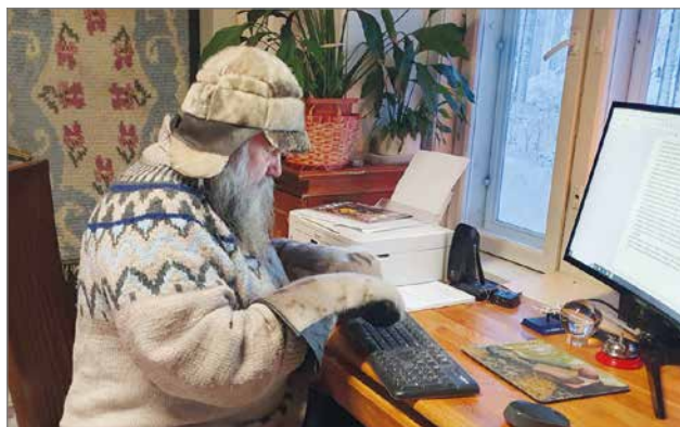
Pakkanen vaikutti myös sisäilman lämpötilaan.

Mutta summasummarum, kylällä ne ilmat lauhtuvat ja kevät kohta rakkauden