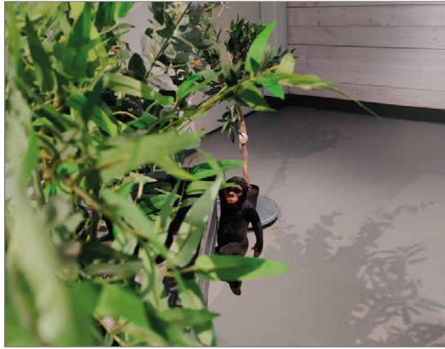
Tammikuun 28. päivään saakka Taidekamarissa on esillä Botanical Garden – Pupujen silta -näyttely, jossa kasvit ovatkin sarjatuotettuja arjen käyttöesineitä.

Helmikuun puolella 19.2. esitetään Heinähattu ja Vilttitossu klo 17.00 ja Luotto-