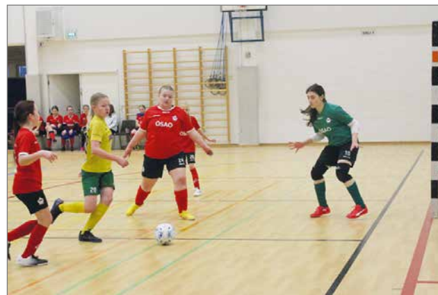
Kurenpojilla on pitkää aikaa mukana myös tyttöjoukkue T15-sarjassa.

P14 Futsal-Ykköässä Kurenpojat johtaa sarjaansa neljän ottelun jälkeen yhdellä tappiolla. Sarja on kuitenkin tasainen ja puolet peleistä pelaamatta. Kurenpojilla on hyvä lähtö kahteen kau-