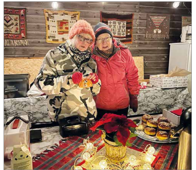
Yhteisöllisyys lämmittää, sanotaan.