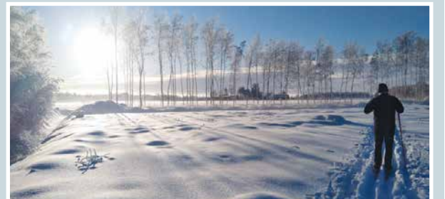
Talven värileikkiä.

lukijoiden palaute ja jutut: vkkmedia.fi