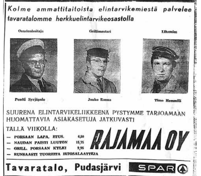
Rajamaa Oy:n vanhassa lehti-ilmoituksessa herkkuelintarvikeosaston henkilöstö pääsi oikeuksiinsa.