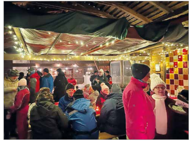
Sisätiloissa höyry nousi ilmaan ihmisten poristessa tuttuja parissa ja kahvi ja makkara teki kauppansa pullien kera.