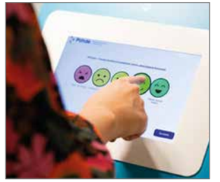
Ohjelman toimittaja on Roidu Oy. Palautejärjestelmä on tuttu hymynaama-laitteista.

Asiakaspalautteesta saadut kehittämissuositukset käsitellään yksiköissä ja toteutetaan mahdollisuuksien mukaan. Tavoitteena on, että asiakaspalautejärjestelmien avulla saatavaa tietoa hyödynnetään palvelujen kehittämistyön tukena.