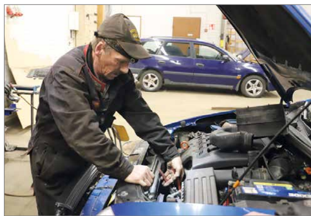
Autohuolto Reino Malmia on pakkasella työllistäneet muun muassa auton lohkolämmittimien korjaukset ja asennukset.

- Sana kulkee hyvin ja yhteistyö pelaa, esimerkiksi Vianorin kanssa ja muidenkin yrittäjien. Heillä on niin pitkät jonot, niin mielellään sitä matkalaisia auttaa, jos