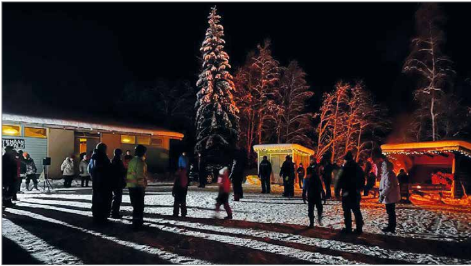
Uloskin uskaltauduttiin, vaikka pakkasta oli 30 astetta.

Omalta kohdaltani olen päättänyt pitää yleisöltä suljettuna säästösyistä Puikkaria myötäillen heinä, elo ja syyskuun Siuruan kansan-