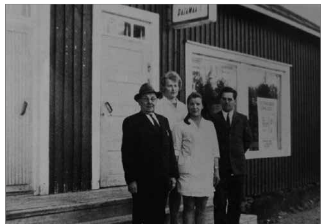
Rajamaa Oy:n johtokunnan puheenjohtaja, myymälänhoitaja apulaisineen ja toimitusjohtaja vuonna 1925 avatun Puhoksen sivumyymälän portilla 1969.