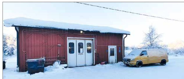
Rytingin Palvelun autokorjaamo sijaitsee noin 10 kilometrin päässä Rytingin kaupalta, ja tarvittaessa apu saadaan paikan päälle huoltoauton ansiosta.