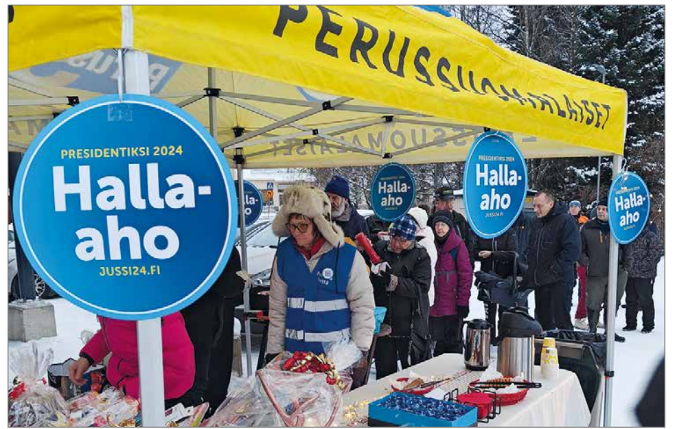
S-marketin pihalla järjestetty jouluihin tehtävä tapahtuma keräsi runsaasti kävijöitä. Makkarat, glögi sekä piparit maistuivat jonoksi asti.