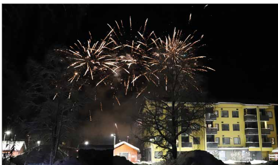
Kurenalla toteutettiin vuoden vaihteessa vuosien tauon jälkeen näyttävä ilotulitus. Kuvat otettu kaupungintalon parkkipaikalta.

Yhteistyössä olivat: Autohuolto Miksa Oy, Jurmun Maatila Oy, Kakku- ja Pito-palvelu Vengasaho, KHR Oy, Kone-Sarajärvi Oy, Kos-