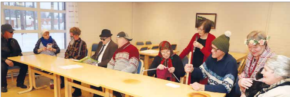
Senioritalo Iltätähden asukkaiden haastatteluissa oli huumori herkässä.