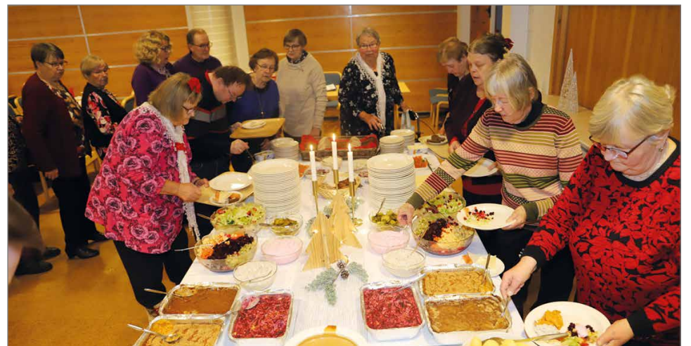
Jouluruokailun tarjoaminen jäsenille pienellä omavastuulla on yksi Sydänyhdistyksen toiminnan vuosittainen kohokohta.

periaatteella "ken lahjan toi, hän lahjan sai".