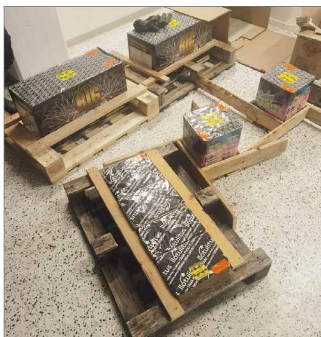
Rakettipadat tuettiin kunnolla kaatumisen estämiseksi.

Ilotulitusta oli seuraamassa noin tuhat ihmistä, katsojia oli kaupunginta-