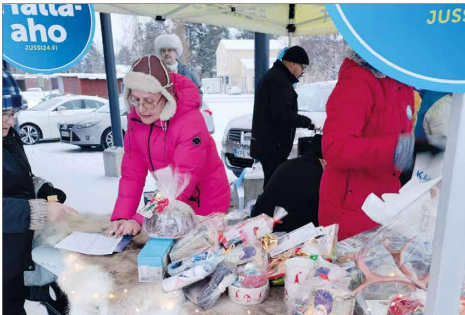
Arpoja oli myytävänä ja voitto tarkistettiin heti.