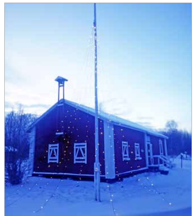
Sydäntalven sininen hämähä on laskeutunut Kuivaniemen kotiseutumuseon ylle.