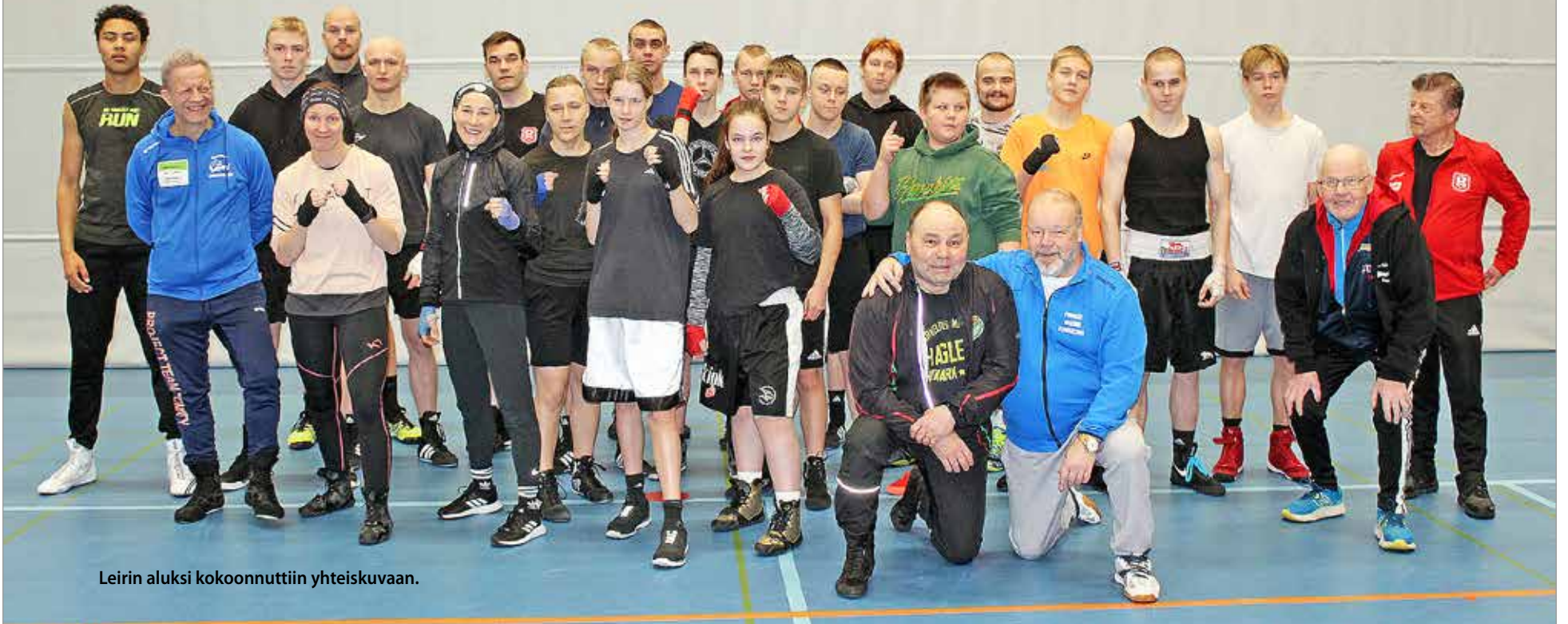
Leirin aluksi kokoonnuttiin yhteiskuvaan.