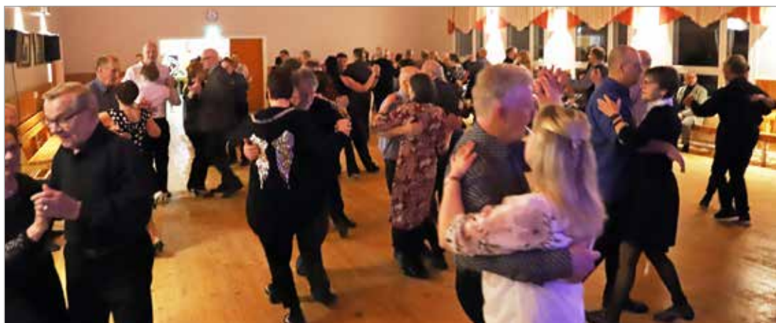
Viime tammikuun Pookitanssit Kuivaniemen Seuralalla. Lippuja myytiin talon täydeltä.