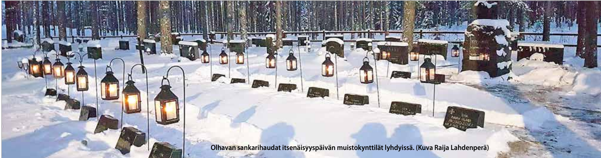
Olhavan sankarihaudat itsenäisyyspäivän muistokynttilät lyhdyissä.