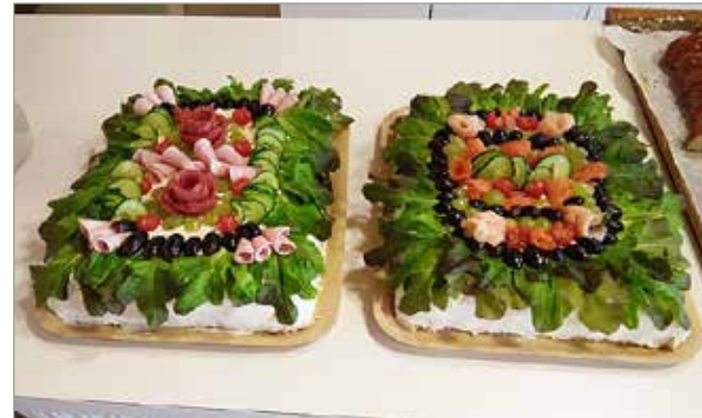
Eetun ja Marin loihittamat voileipäkakut saivat syöjiltään runsaasti kehuja, sillä ne veivät kielen mennessään.