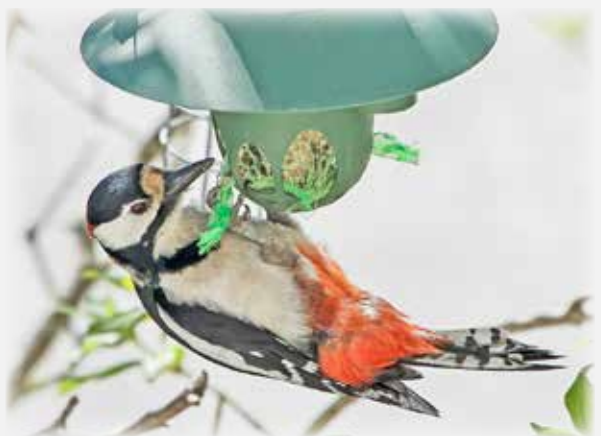
TÄSSÄ SE ON: KÄPYTIKKA.

lukijoiden palaute ja jutut: vkkmedia@vkkmedia.fi