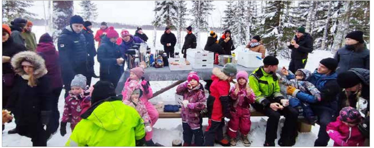
Vuosijärven laavulla nautittiin kahvit ja mehut käristemakkaroitten kera.

-Herrainpolun luontoreitti on nyt virallinen, kai-