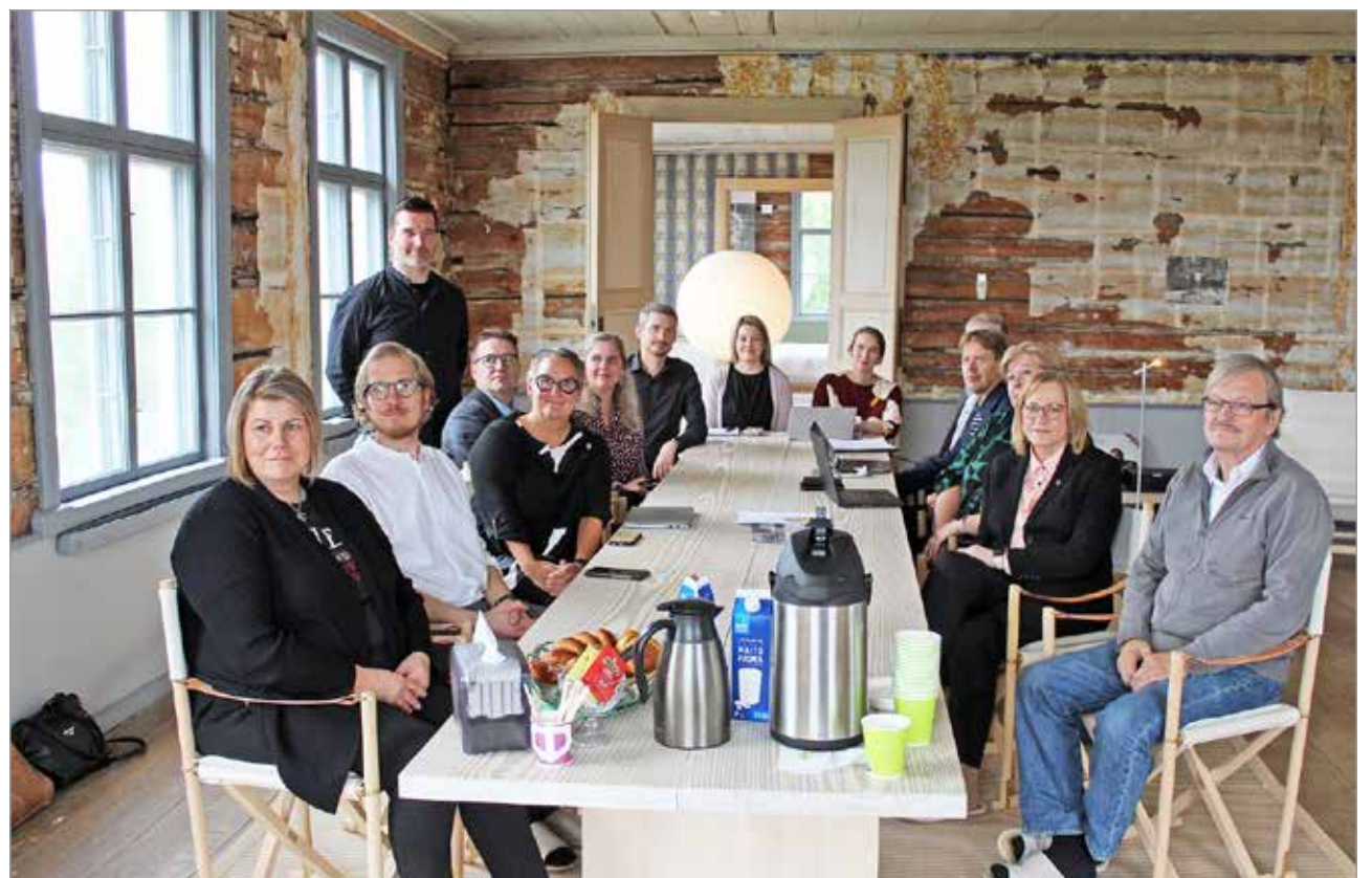
Aluehallintoviraston ja kunnan edustajat kokoustivat Akolan kartanossa.