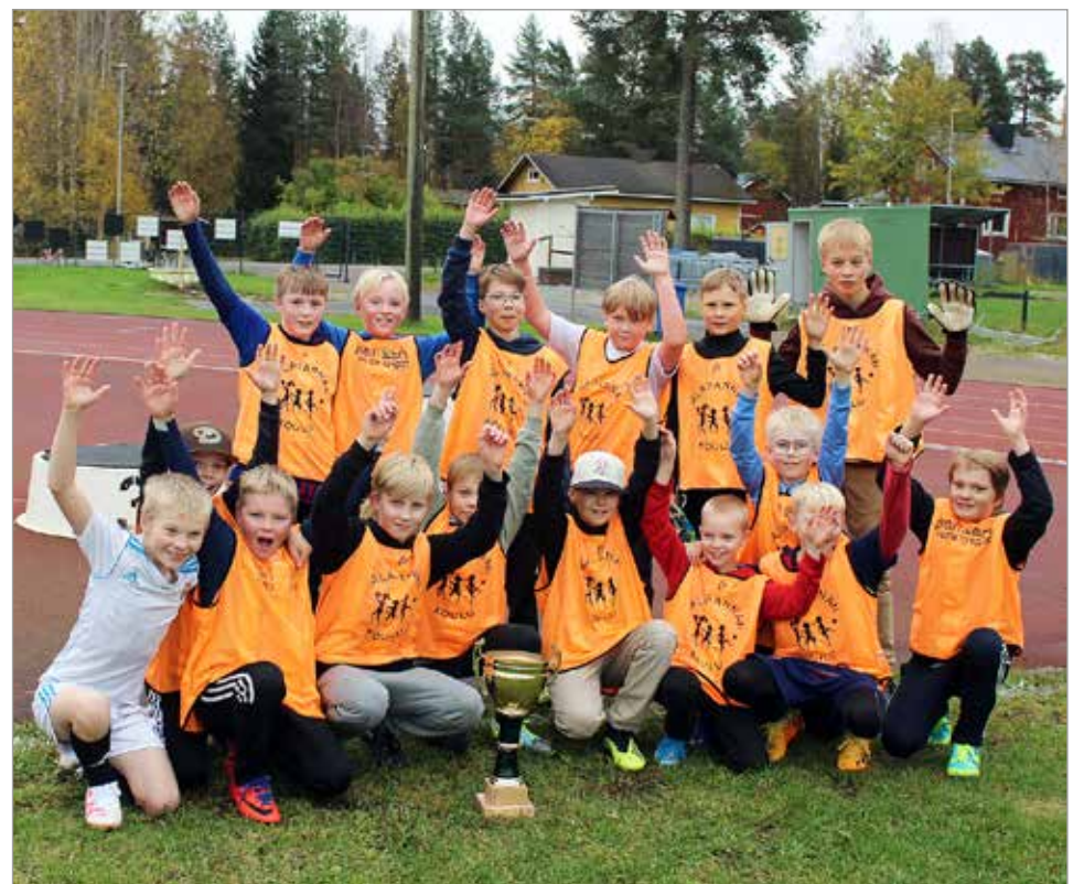
Poikien mestaruuden vienyt Alarannan joukkue riemuitsee ottelun jälkeen.