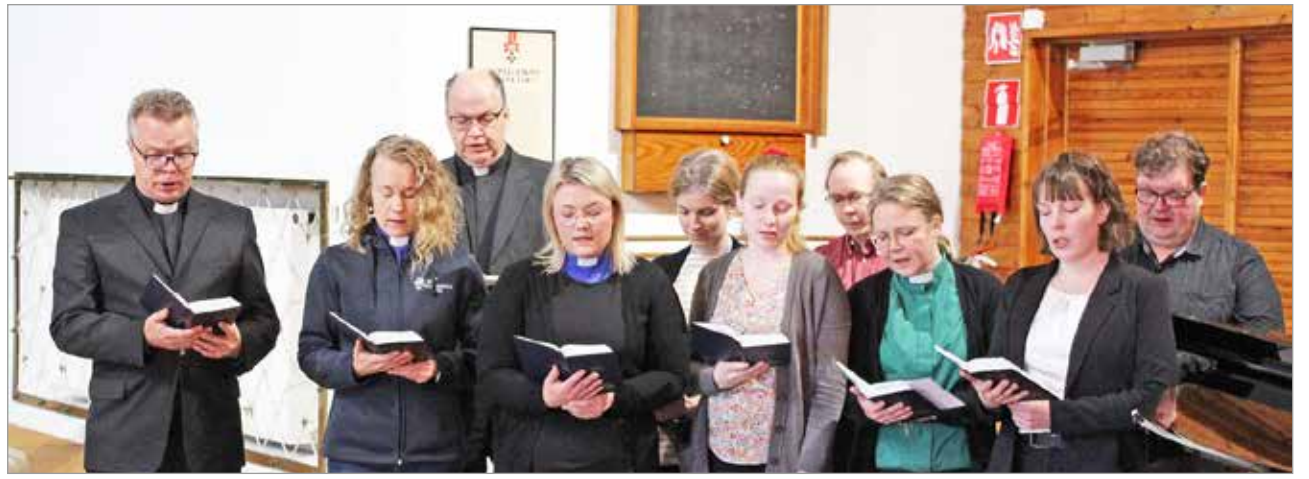
Seurakunnan työntekijöiden lauluryhmä esiintyi perjantain rukoushetkessä.