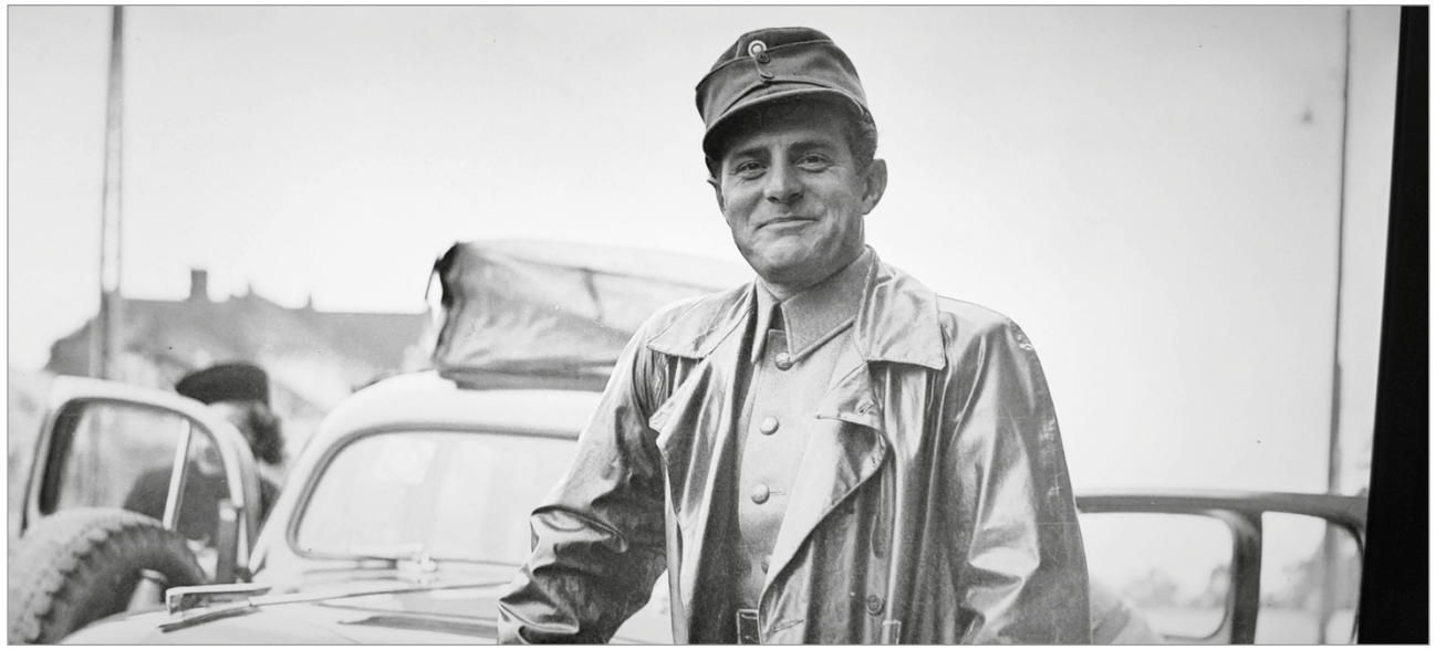
Suomen eturivin artistit olivat mukana tuomassa viihdettä ja helpotusta puolustusvoimien arkeen. Vuonna 1941 Tauno Palo oli yksi rintamalla viihdyttäenistä artisteista.