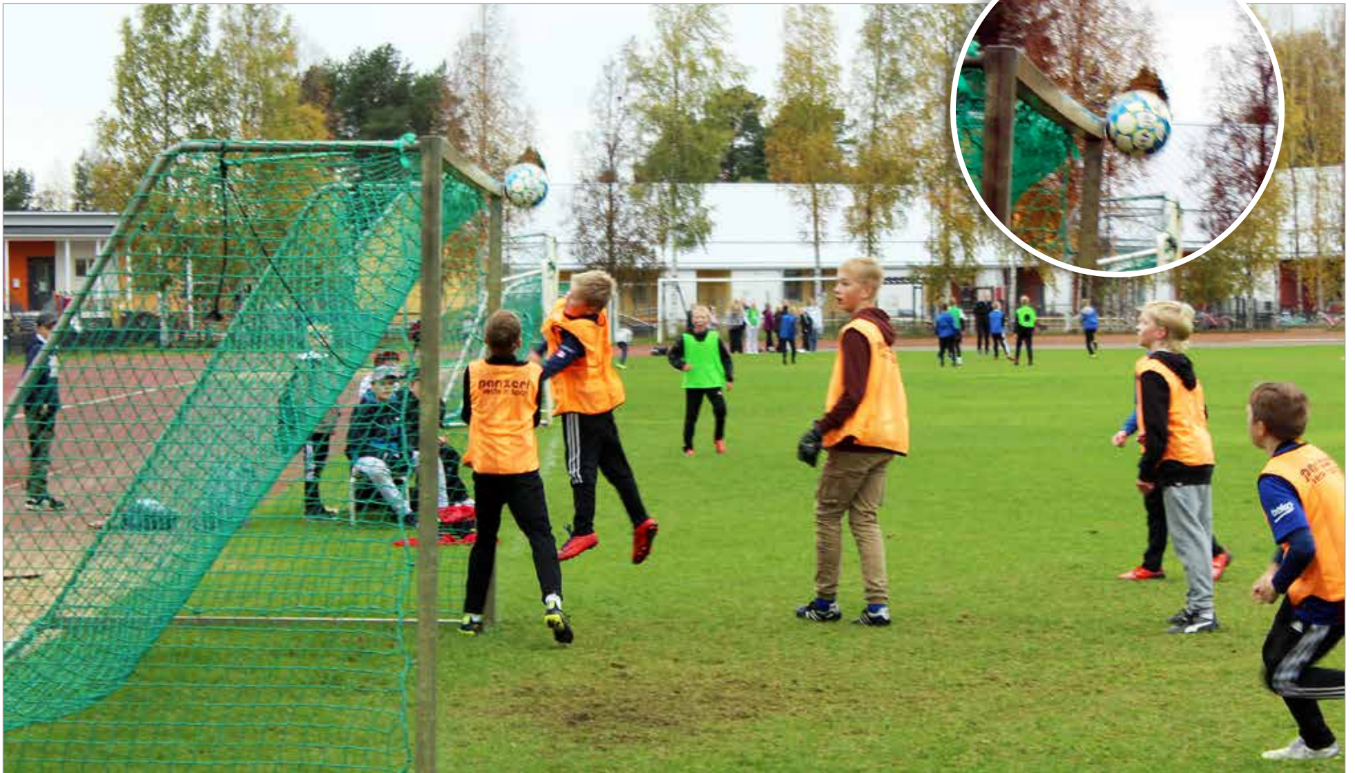
Tolpat ovat maalivahdin parhaat kaverit. Näin lähellä oli Pohjois-lin tasoitusmaali poikien loppuottelun viimeisellä minuutilla. Maalikehikko pelasti Alarannan ja mestaus ratkesi heidän edukseen.