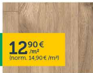
Ideo Viva -vinyylilankut