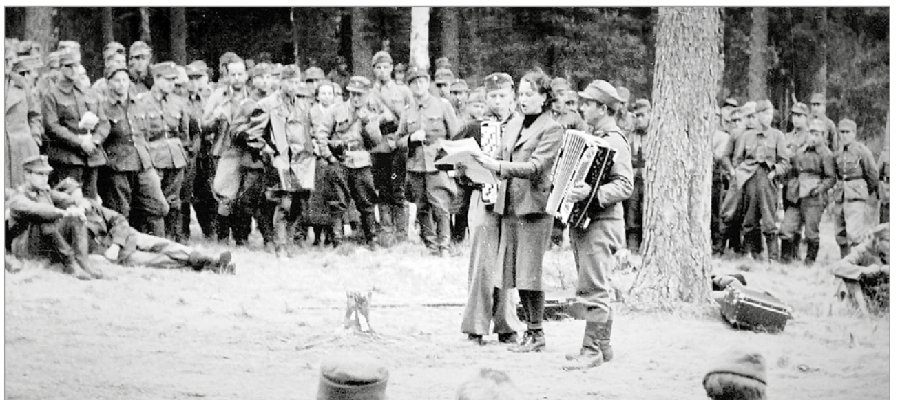
Dokumenttielokuvailan toisessa teoksessa "SA-Int Show - Viihdytykit rintamalla ja rauhan töissä" nähdään vilauksia jatkosodan rintamaviihhteestä.