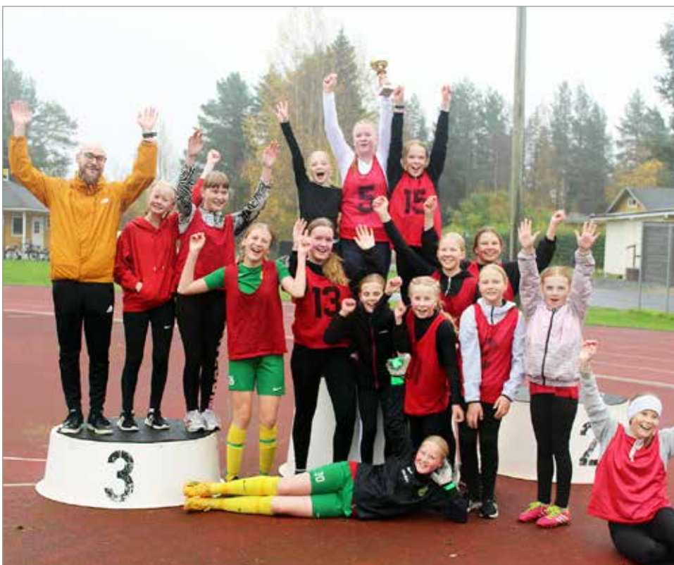
Tyttöjen mestaruuspokaali matkasi Haminan koululle voittoa juhlineen joukkueen mukana.

puvihellyksen soidessa, joten mestaruus ratkesi rankaistuspotkukilpailulla. Siinä Hamina oli onnekkaampi, napaten kiertopalkinnon vuodeksi haltuunsa. Tyttöjen pronssit vei mukanaan Pohjois-Ii. MTR