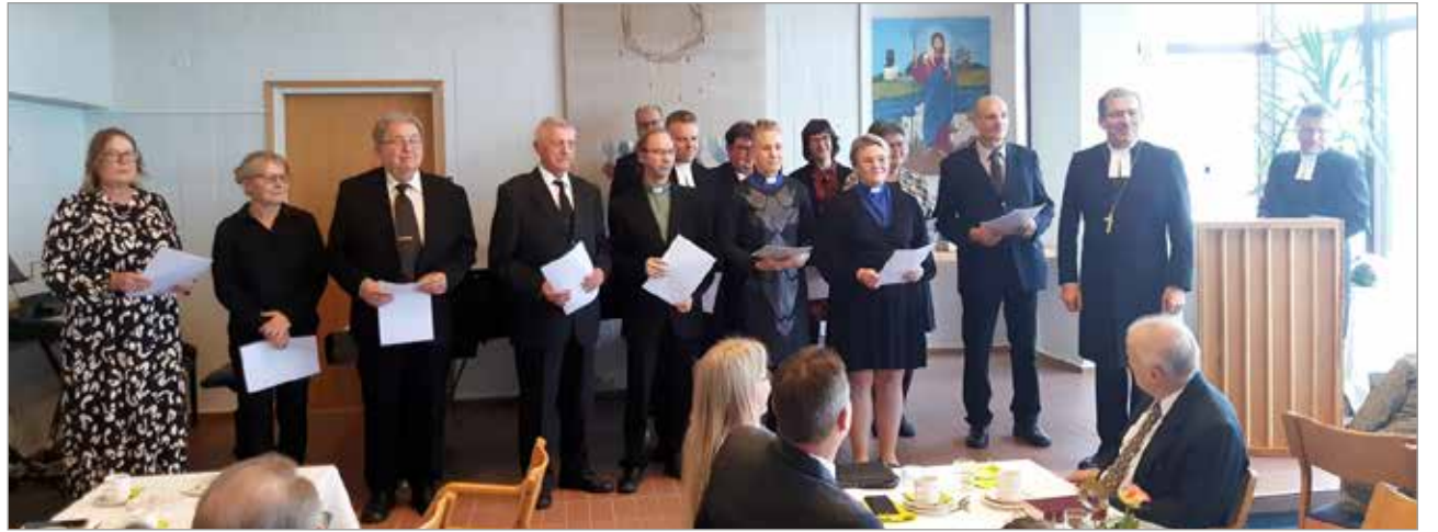
Seurakuntatalolla pidetyssä juhlassa kunniamerkkejä saivat seurakunnan työntekijät ja luottamushenkilöt