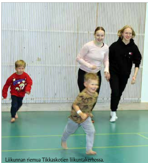
Liikunnan riemua Tikkaskodien liikuntakerhossa.

Iissä kahta päiväkotia, Päiväkoti Tikkaset ja Harjuntähti, pyörittävä Tikkaskodit Oy haluaa edistää lasten liikuntaa. Varhaiskasvatuksen asiakasmaksuun sisältyy myös ilmaisia liikuntaker-