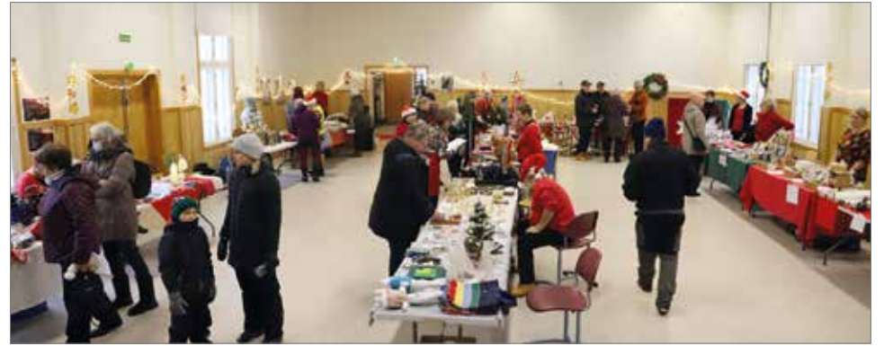
Suojalinnan sali palveli hyvin myyjäispaikkana.

Suuret kiitokset ihan jokaiselle tavalla tai toisella myyjäisiin osallistuneille,