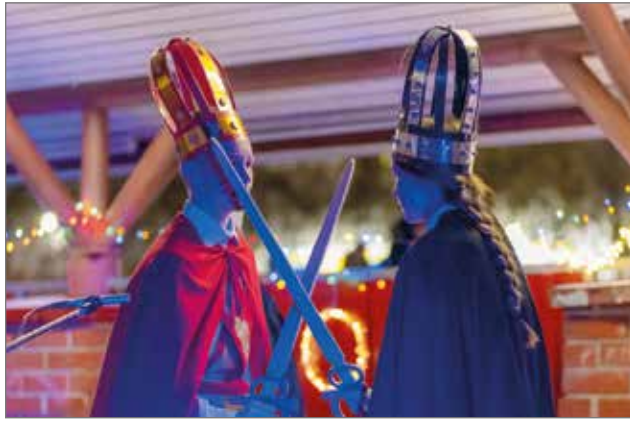
Pimeyttä vastaan taisteltiin perinteisesti miekoin ja sapelein Tiernojen esityksessä.

Voimaa vanhuuteen -työryhmä myöntää vuosittain