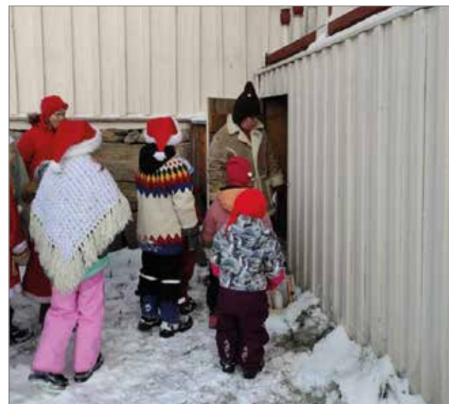
Jalmari-tonttu esittelee lapsille omaa asuinpaikkaansa isojen rappujen alla.