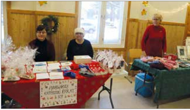
Myyjäisien puuhayhdistyksen Pudasjärven Erityistuki Erkat ry:n myyntipöydällä oli monenlaista myytävää.

Perinteisistä joulumyyjäisistä poiketen läsnäolijat pääsivät seuraamaan Eläkeliiton Pudasjärven yhdistyksen jäsenten esittämää Hölmöläisten kummallinen joulupuu -näytelmää. Joulumyyjäisten tunnelma oli lämmin ja mukava puheen-