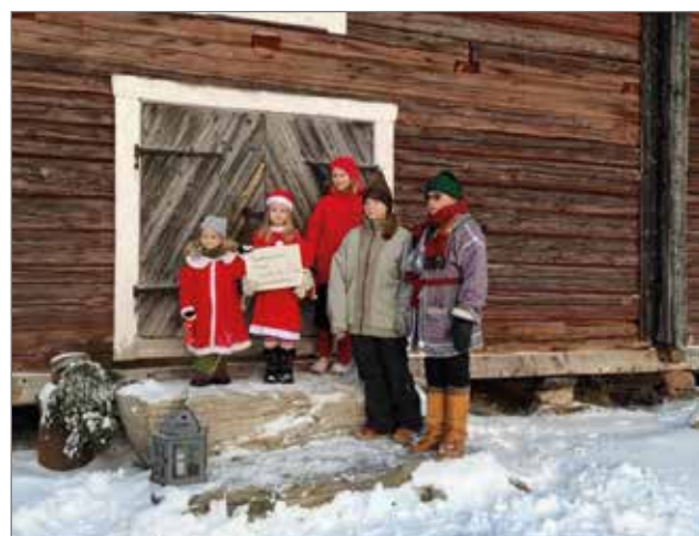
Tonttupolun väkeä portailla.