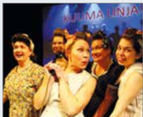
Kuuma linjan naisnäyttelijät.

"Esityksen tarkoituksena on tuottaa ihmisille iloa ja hyvää mieltä. Sitä tämän kokonaisuuden valmistelu on ainakin tuottanut koko meidän työryhmällemme", tuumii esityksen ohjaaja Ulla Schroderus. "Projektin on jokaisesta ilon ja toisaalta myös tuskan aihe. Ajattelu täytyy kääntää asentoon, jossa arkisista, välillä turhauttavastakin asioista, täytyy löytää