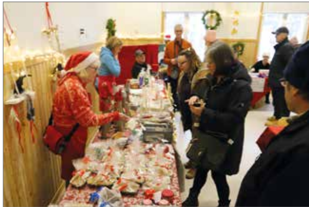
Siuruan kylä ry:llä oli pitkä pöytä täynnä myytävää.

Myyjäisiä päästiin valmistelemaan jo perjantaina kускаamalla myyntipöytiä Tuomas Sammeltu -salilta Suojalinnalle, jossa pöydät aseteltiin paikoilleen. Kaikki olivat iloisin mielin touhussa mukana, talkoomeininki oli mitä mahtavin. Sama meininki oli myyjäisten jälkeekin - jokainen osallistui talkoisiin - Kiitos! Tässäkin tapahtumassa korostui loistavasti yhteistyön merkitys.