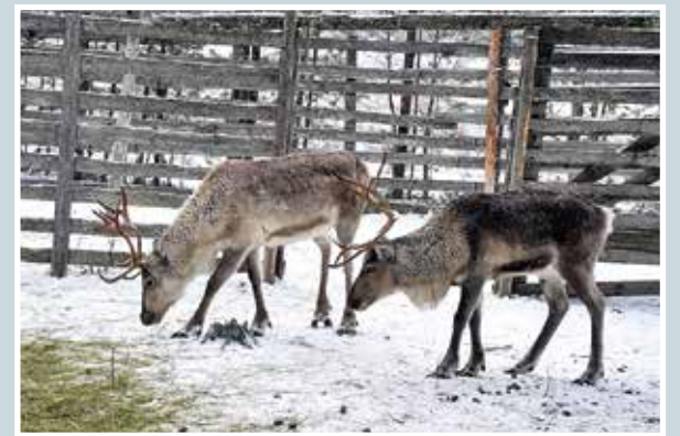
Onko Petteri Punakuonoa näkynyt?

Martti Kähkönen lukijoiden palaute ja jutut: vkkmedia.fi