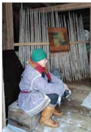
Hermanni-tonttu kertoili mm. siitä, millaista oli elää kartanonväen kanssa kauan sitten.

Tapahtumapäivälle sattui sopivan talvinen sää; lunta leijaili hiljalleen taivaalta ja aikaisin mailleen painuva aurinko ehti tervehtiä vierailijoita ja kartanon väkeä tapahtuman aikana. Kartanon sisätiloissa oli mahdollisuus lämmitellä, sillä tonttupolku päättyi sisällä pidettävään askartelupajaan. Kartanossa tarjoiitiin riisipuuroa ja soppaa pientä maksua vastaan. Kahvittelemaan pääsi esimerkiksi salin puolelle ja tarjolla oli monenlaista leivonnaista kahvin kylkeen. Tapahtuman yhteydessä oli