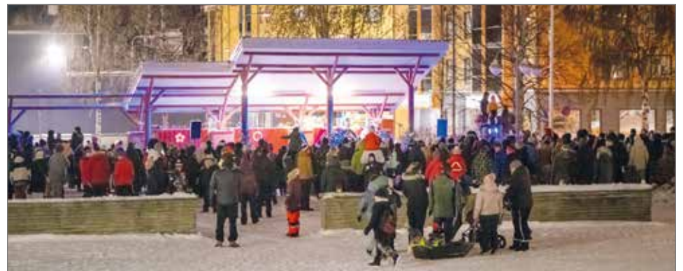
Joulunavauksessa torilla oli mukavasti kävijöitä.