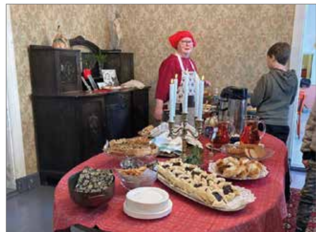
Kahvilan tarjontaa ja keittiöväkeä.