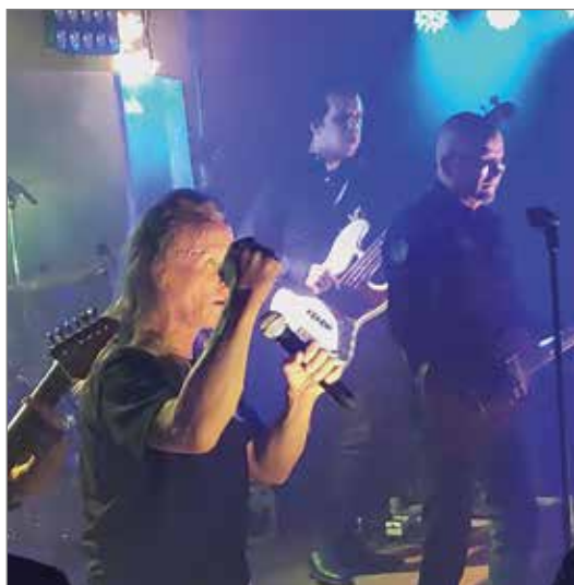
TANNAN musiikki on Tannan säveltämää/sanoittamaa.

Kappaleet seurasivat toisiaan lähes tauotta. Tanna milloin laulatti yleisöä tai tempasi mukaan yhteistaputuksiin. Seuraavana oli avausraitia "Fata Morgana", 2023, jota seurasi uusin single "Mayday", 2023. Olisiko