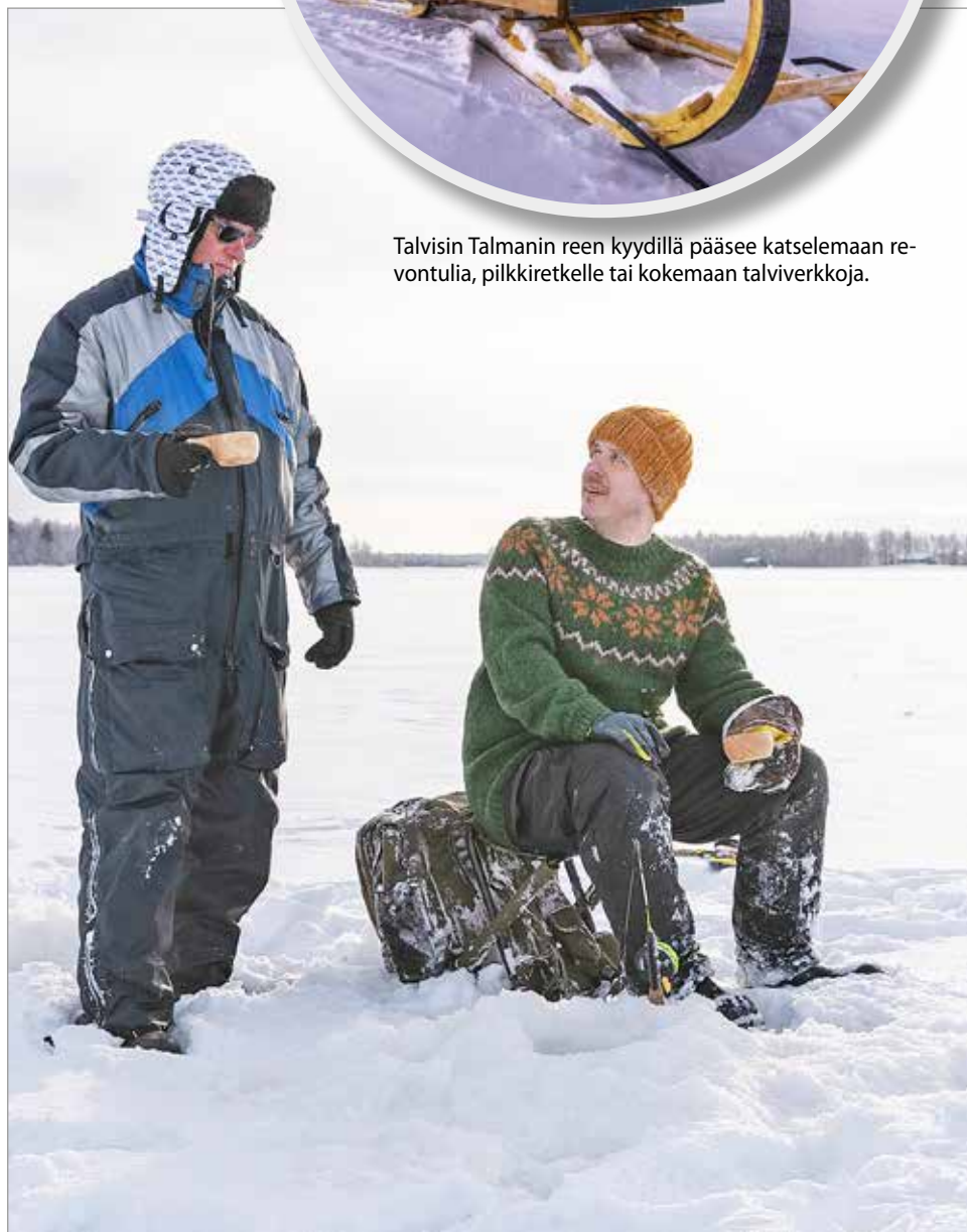
Talvisin Talmanin reen kyydillä pääsee katselemaan reventulia, pilkkiretkelle tai kokemaan talviverkkoja.