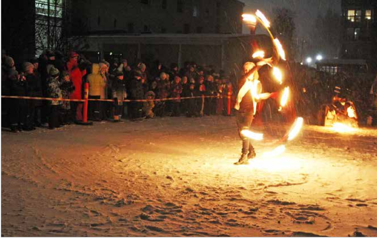
Tulishow keräsi kunnantalon pihalle yli 200 katsojaa.

Valtakunnallisella Mielen-terveysviikolla vietettiin Iissä valonjuhlaa. Avajaispäivän näyttävän ohjelmanumero oli rovaniemeläisen Kuuranvalkeat ry:n tulishow kunnantalon pihalla.