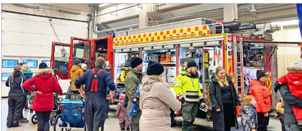
Iin paloasemalla riitti toimintaa koko Päivä Paloasemalla- tapahtuman ajan.

Päivä Paloasemalla -tapahtuma starttasi Paloturvallisuusviikon 25.11. Tapahtumaa on järjestetty vuodesta 2008. Päivä Paloasemalla on Suomen suurin turvallisuusaiheinen tapahtuma, ja sitä järjestetään vuosittain noin 360 paloasemalla ympäri Suomen. Iin paloaseman tapahtuma sai etenkin lapsiperheet liikkeelle, tutustumaan palokunnan kalustoon. Paloautot kiinnostivat lapsia eniten ja kuskinpaikalle riitti jonoa koko tapahtuman ajan. MTR