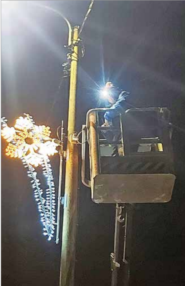
Kuivaniemen pääkadun varteen on Yrittäjien toimesta hankittu komeat jouluvalot. Valitettavasti valoista saatiin vain yksi palaamaan joulunavauksessa.