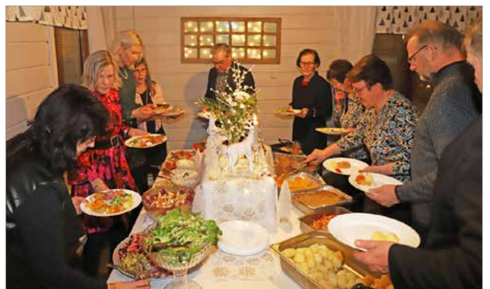
Syyskokouksen jälkeen nautittiin Kuivaniemen Kievarin laittaman joulupöydän runsaista antimista.

Toimintasuunnitelmassa todettiin alkavan 43. toimintavuosi. Jäseniä on 35 uuden toimintavuoden alkaessa Yhteistyötä tehdään kunnan ja