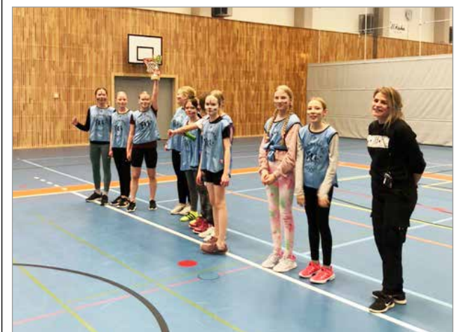
Iin alakoulujen tyttöjoukkueiden koripallomestarit löytyivät tänä vuonna Alarannan koululta.

Alaranta oli selkeästi parempi, päästen nostamaan ottelun jälkeen voittopokaalin ilmaan. MTR