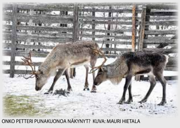
ONKO PETTERI PUNAKUONOA NÄKYNYT?