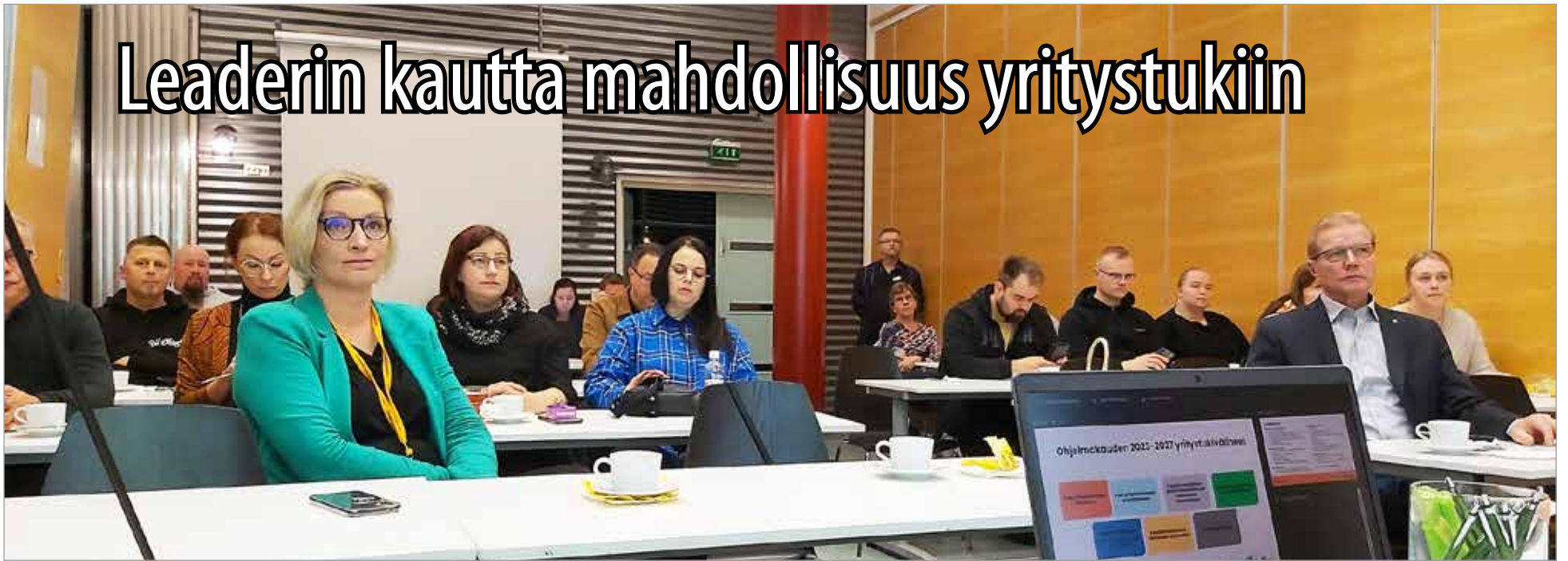
Oulun Seudun Leaderin rahoitusinfo lissä houkutteli paikalle yli 20 kuulijaa.