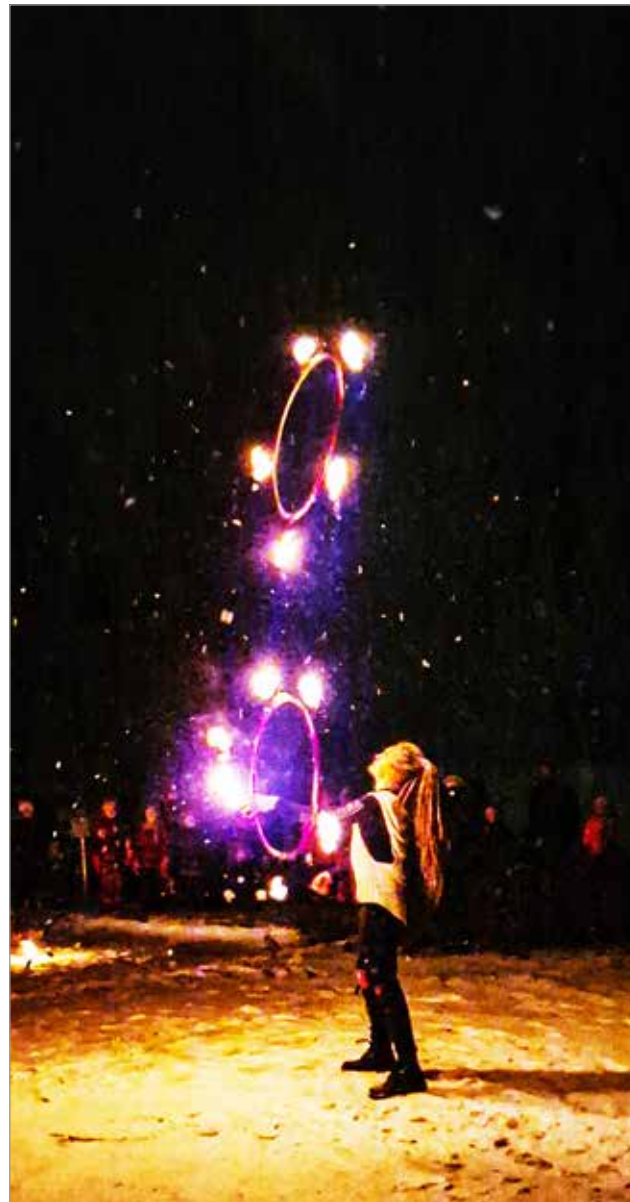
Tulirenkaat ilmassa.