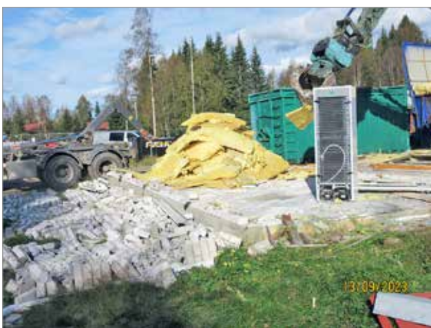
Kuivaniemellä purettiin viimekesänä rivitaloja Ratatie 12:sta. Kohteesta saatiin lisää tietoa purkujätteen kierrätyksestä.