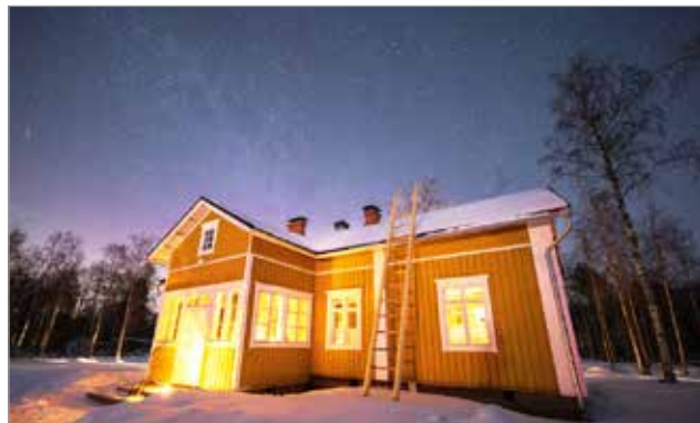
Valtaosa Pohjois-Iin Pauhussa majoittuvista ovat kansainvälisiä matkailijoita.

Jenny Kärki