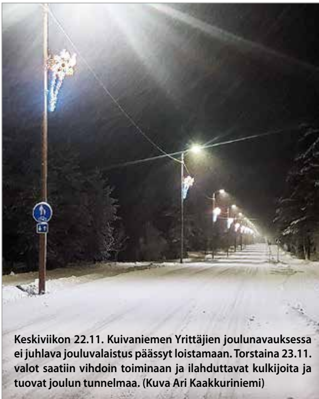
Keskiviikon 22.11. Kuivaniemen Yrittäjien joulunavauksessa ei juhlava jouluvalaistus päässyt loistamaan. Torstaina 23.11. valot saatiin vihdoin toimimaan ja ilahduttavat kulkijoita ja tuovat joulun tunnelmaa.