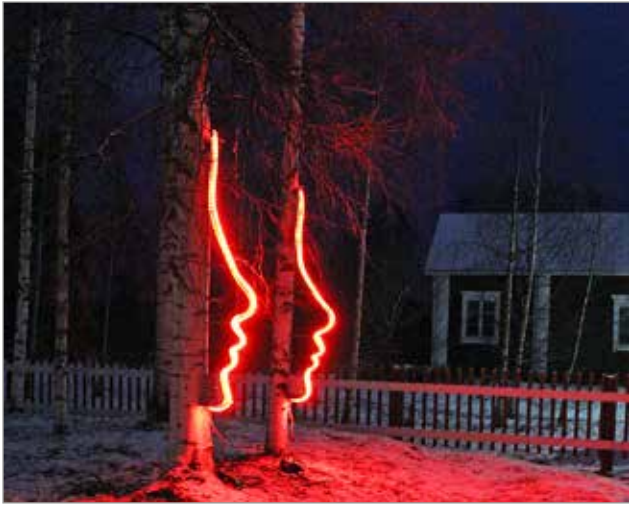
Taidepuistossa voi ihaila Mollu Heimon valotaideteoksia.