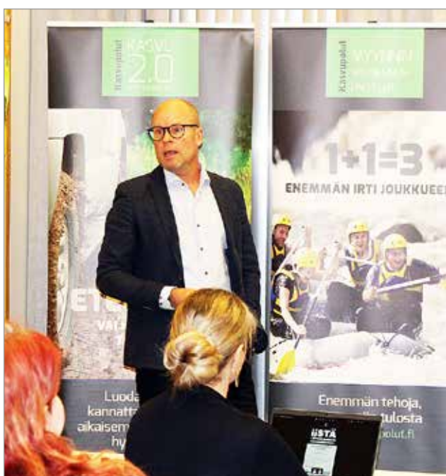
Kannattavan kasvun portaat johtavat yritystä yrittäjän kyvykkyydestä organisaation kyvykkyyteen.