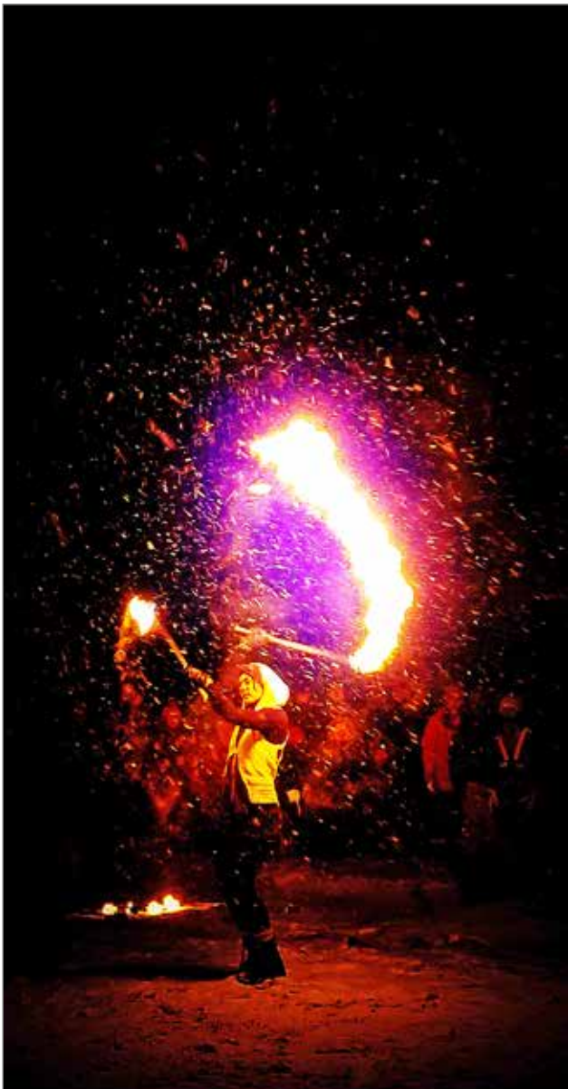
Kuuranvalkeat loi taidokkaan show'n olosuhteista välittämättä.

jonka jälkeen oli mukava käydä nauttimassa kuppi kuumaan Taitotalo ry:n kahviossa Nätteporissa. MTR