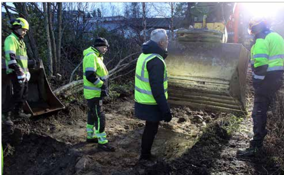
Yhdessä todettiin puiden juurien olevan niin pinnassa, että Oikotien laidan koivut jouduttiin kaatamaan.

-Infra- ja ympäristöpalvelut laativat hulevesijärjestelmän kartoituksen ensi vuonna, valmisteilla olevan uuden omaisuuden hallinnan yhteydessä. Näin voidaan jatkossa suunnitella paremmin ja saada synergia- ja tehokkuusetuja. Sen seurauksena saadaan kustannushyötyä kunnan omaan infraan. Tehokas hulevesijärjestelmä palvelee kuntalaisia ja monipuolistaa luontoa sekä vähentää tulvariskiä. MTR