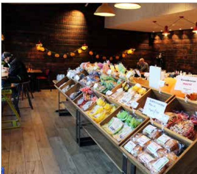
Putaan Pullan viihtyisässä myymälässä on suuri valikoima leipomotuotteita. Ruokailuun löytyy eri vaihtoehtoja salaateista päivän keittoon ja erilaisiin leipiin.