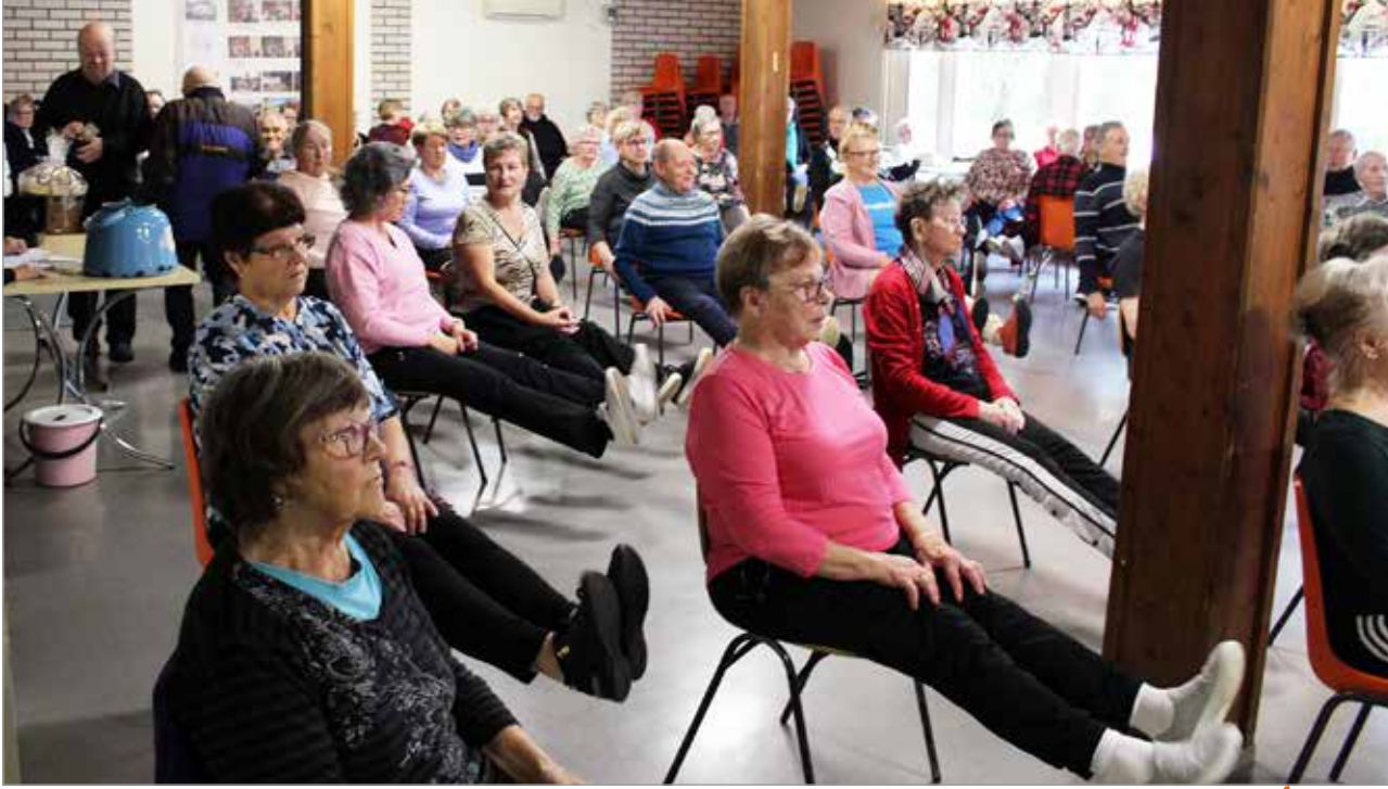
Tuolijumpassa vahvistettiin myös jalkoja.