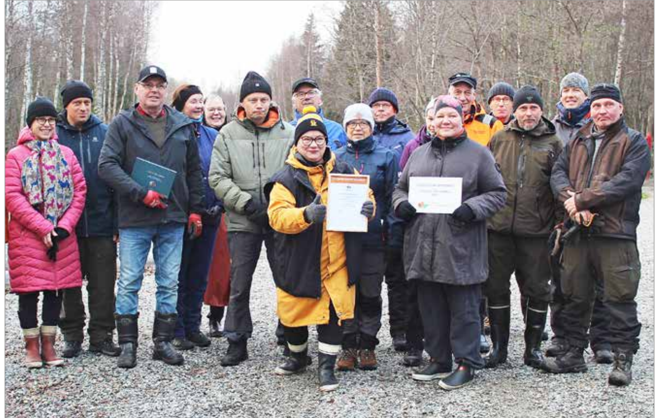
Vuoden maisematekopalkinnon luovuttaneet Oulun Maa- ja kotitalousnaisten edustajat yhdessä Pohjois-lin kyläyhdistyksen aktiivien kanssa Hiastinhaaran maisemissa.