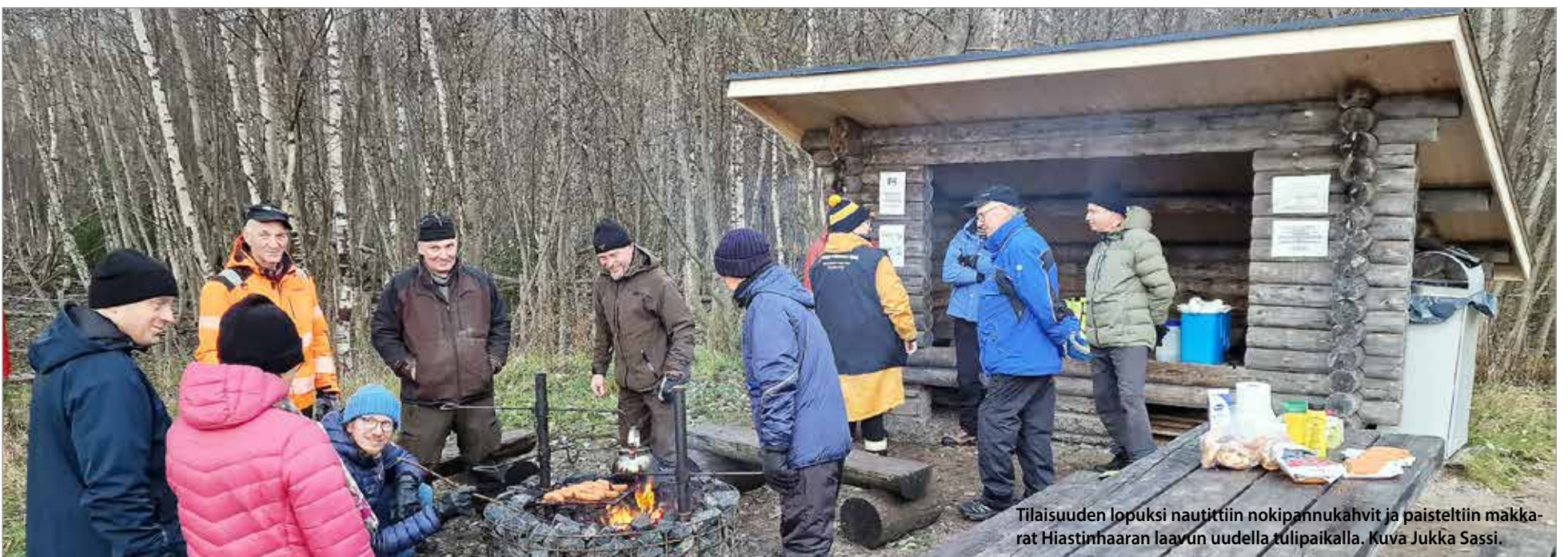
Tilaisuuden loppuun nautittiin nokipannukahvit ja paisteltiin makkarat Hiastinhaaran laavun uudella tulipaikalla.

-Yksityiset maanomistajat, Pohjois-lin jakokunta ja lin kunta ovat suhtautuneet alusta saakka myönteisesti, iso kiitos heille. MTR