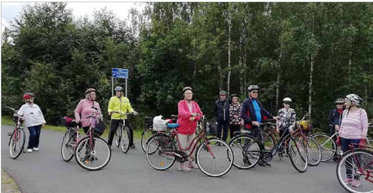
Alkuun oli viisi pyöräilijää ja siitä Innostus pyöräilyyn on lisääntynyt.