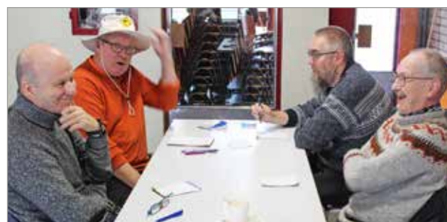
Pökkikankaan Raittiusyhdistyksen joukkueita nauratti ennen kisa. Lopputuloksissa joukkue sijoittui jaetulle viidennelle sijalle.