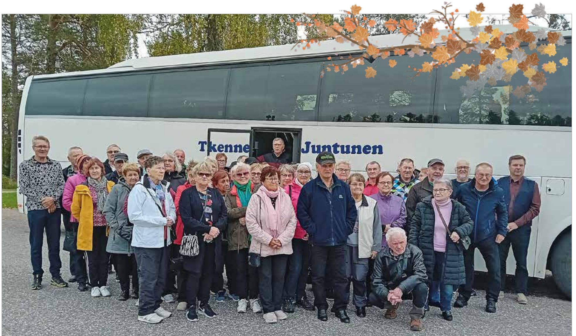
Iloinen ja hyvin yhteen sulautunut Iin ja Utajärven Eläkeläisten joukko toteutti Luoston ruskamatkan.