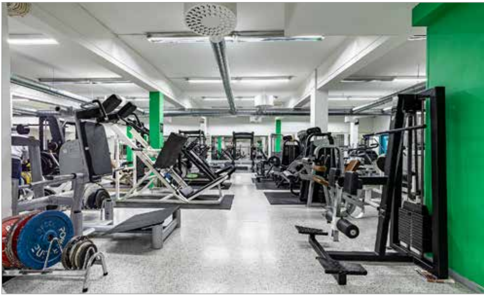
AMLGYMillä on monipuolinen valikoima kuntosalilaitteita, jotka sopivat monenlaiseen harjoitteluun. Yrittäjä Aleksi Laajoen mukaan jokainen kuntosalilla harjoitteleva on yhtä tärkeä.