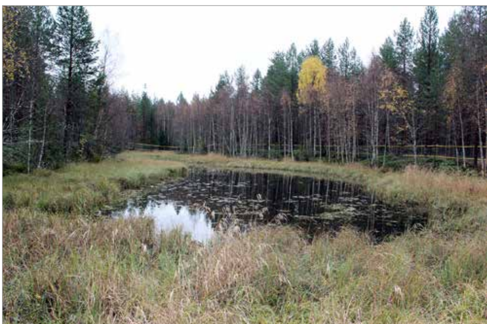
Koirametsän alueella sijaitsevat Pikku-Konin lammet mahdollistavat noutavien koirien harjoittamisen.

70 000 tuhatta ja koirametsiä reilut 20, liitä lähimmät Oulussa ja Ylikimmissä. Uskomme koirametsien määrän jatkossa lisääntyvän, sillä niissä on turvallista juoksuttaa koiria ilman pelkoa toisista koirista tai koirien karkaamisesta omille teilleen. MTR