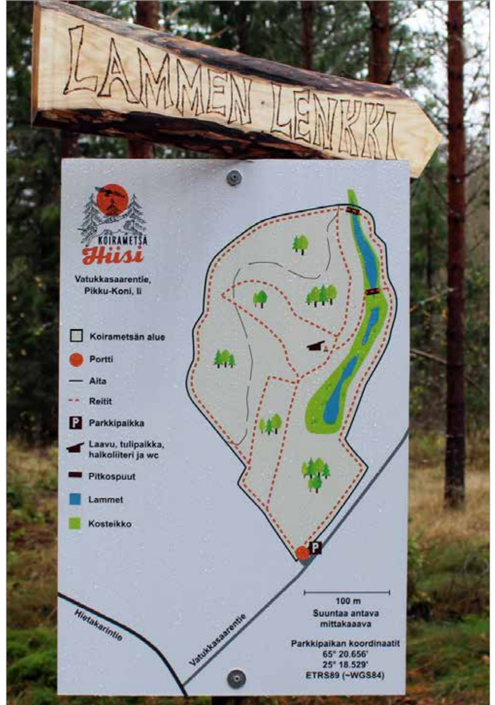
Koirametsä Hiisi on suurin Oulun alueen koirametsä.