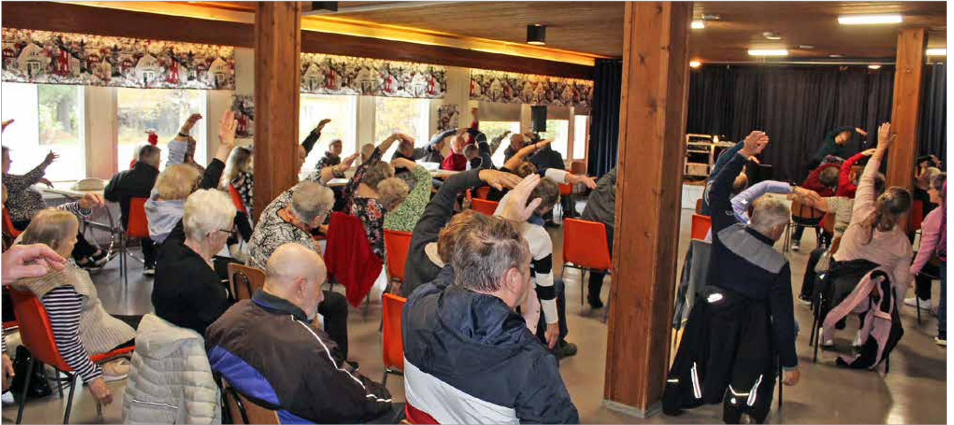
Musiikki- ja liikuntapäivä aloitettiin yhteisellä tuolijumpalla.