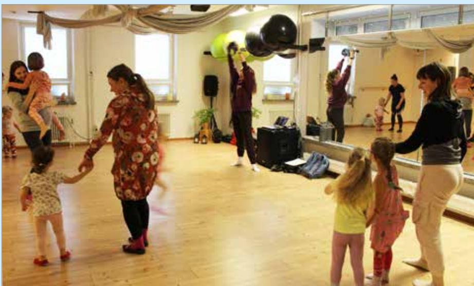
Lapset ja aikuiset pistivät hyvinvointimessuilla ohjatusti tanssiksi.