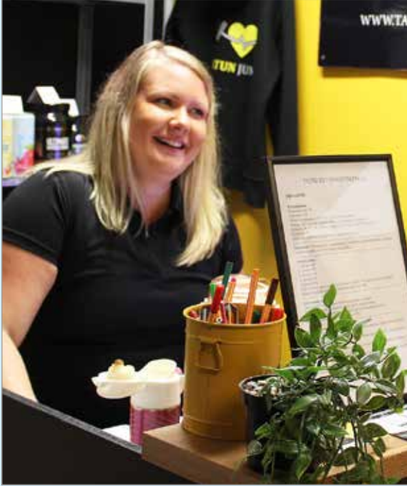
Satu Kaiston hyvinvointikeskus Taffii tarjoaa monipuolista ryhmäliikuntaa ja liikuntaneuvontaa, tilaustunteja ja tapahtumia.