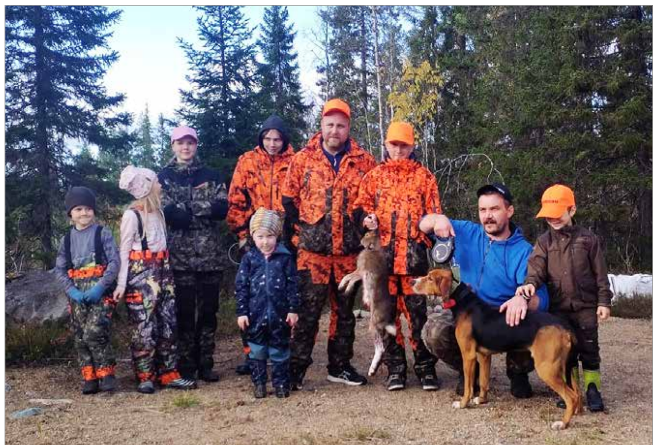
Iltapäivällä metsästyksen jälkeen.