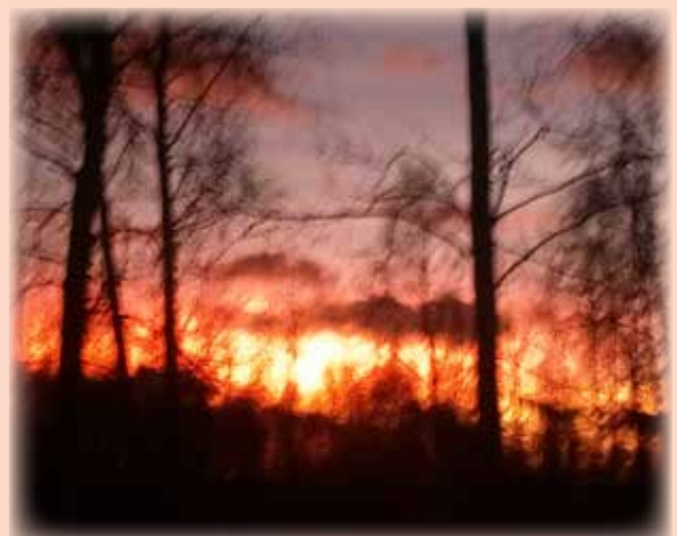
TAIVAAN TULET.

lukijoiden palaute ja jutut: vkkmedia@vkkmedia.fi