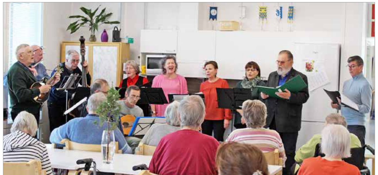
Iin Laulupelimannit vierailivat vanhustenviikolla Emmintuvalla.

tuokion jälkeen vaihdettiin ajatuksia kahvikupposten ääressä muistellen menneitä vuosikymmeniä. MTR