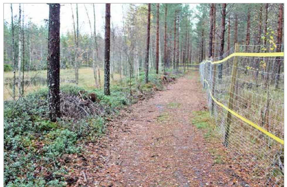
Koirametsää kiertää 1100 metriä pitkä, kaksi metriä korkea aita.