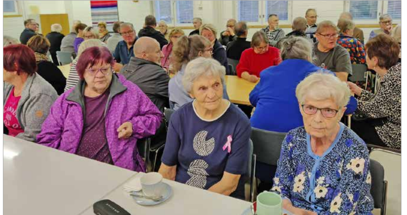
Syöpäyhdistyksen Kuivaniemen osaston tapahtumaan saapui kaikkiaan 55 henkilöä keskustelemaan ja kahvittelemaan.