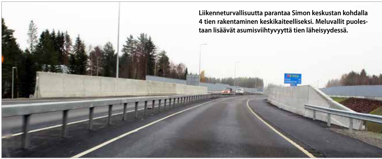
Liikenneturvallisuutta parantaa Simon keskustan kohdalla 4 tien rakentaminen keskikaiteelliseksi. Meluvallit puolestaan lisäävät asumisviihtyvyyttä tien läheisyydessä.