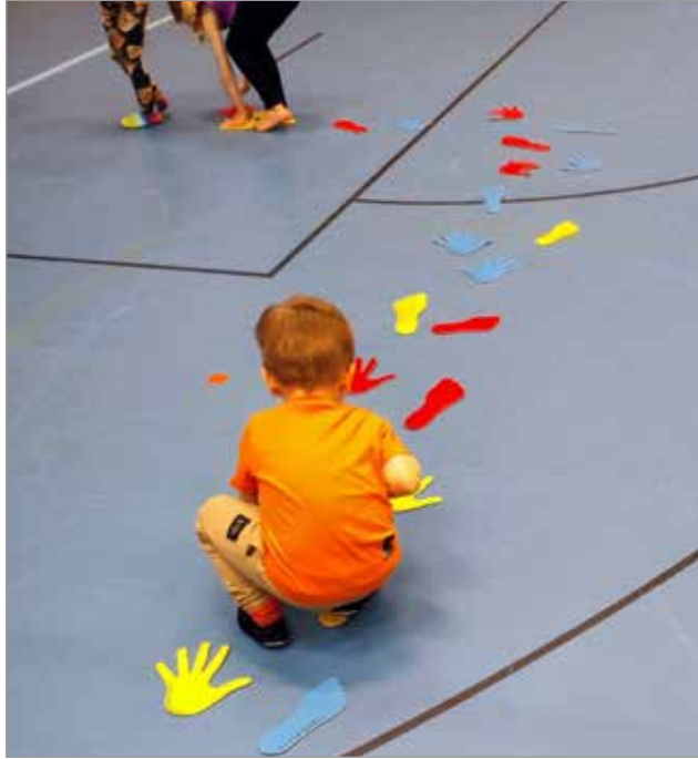
Mannerheimin Lastensuojeluliiton Iin paikallisyhdistys järjestää perheliikkaria keskiviikkoisin IisiAreenalla.

Perheliikkarissa pyritään saamaan myönteisiä kokemuksia, iloa, onnistumisia, osallisuutta ja liikkumista yhdessä. Motoriset ja liikunnalliset toiminnot tukevat perusliikkeiden oppimista ja välineiden käsittelyä. Kognitiivisten ja tiedollisten harjoitteiden myötä kehittyvä ongelmanratkaisukyky, luovuus, muistaminen ja käsitteet.