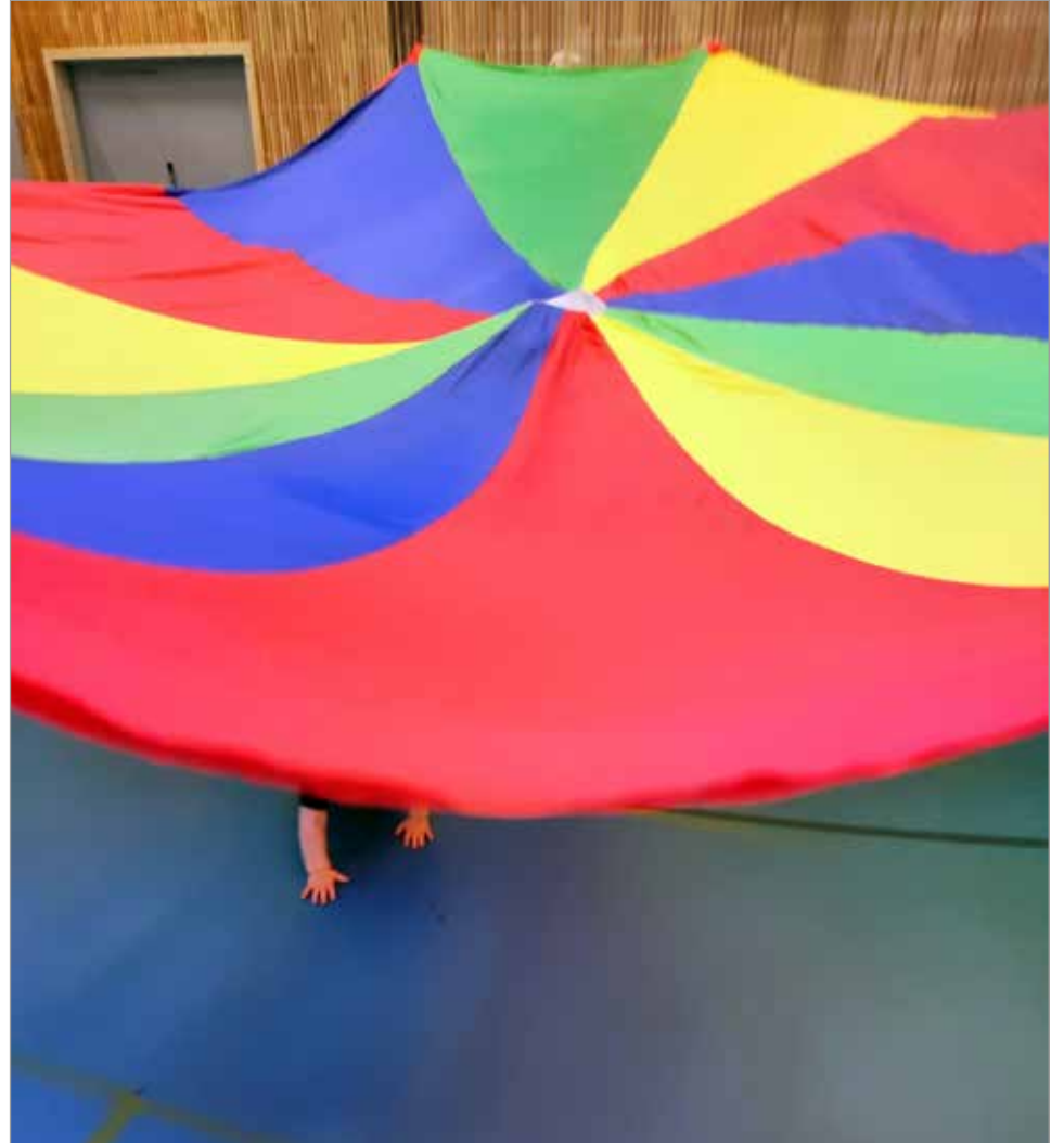
Perheliikkarissa pyritään saamaan myönteisiä kokemuksia, iloa, onnistumisia, osallisuutta ja liikkumista yhdessä.