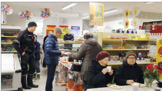
Juhlapäivänä kävi asiakkaita onnittelemassa tasaisena virtana koko päivän ajan. Eri puolilta kauppa oli ripustettu mainostauluja eri vuosikymmenien ajalta.