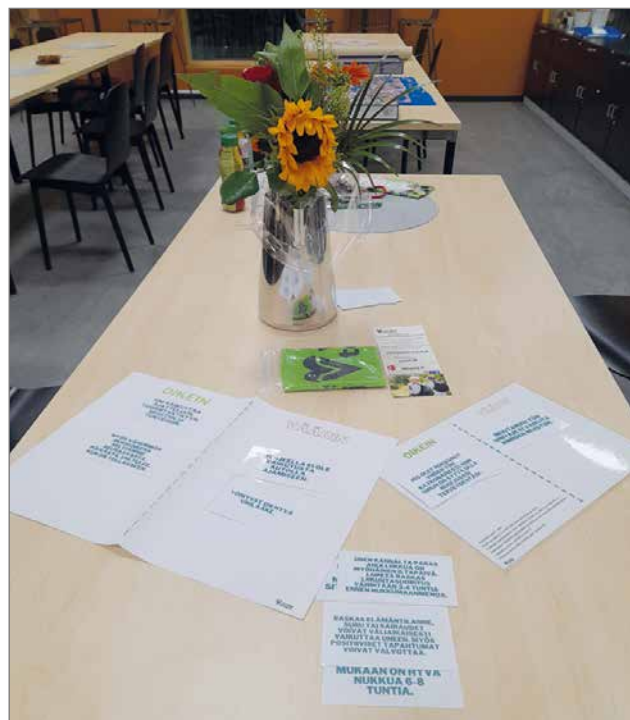
Kortteissa olevia aiheita pohdittiin yhdessä.

Vertaistervarit hanke tarjoaa osallistujilleen vertaistukea ja tietoa elintapamuutoksen tekemiseen ja ylläpitämiseen. Ohjaajina