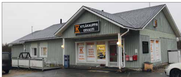
Nykyinen kauppiainstituutti rakennettiin vuonna 1993, jolloin kauppa siirtyi kokonaan omaan rakennukseensa ja niin sanottu kotikauppa-aika jäi taakse.