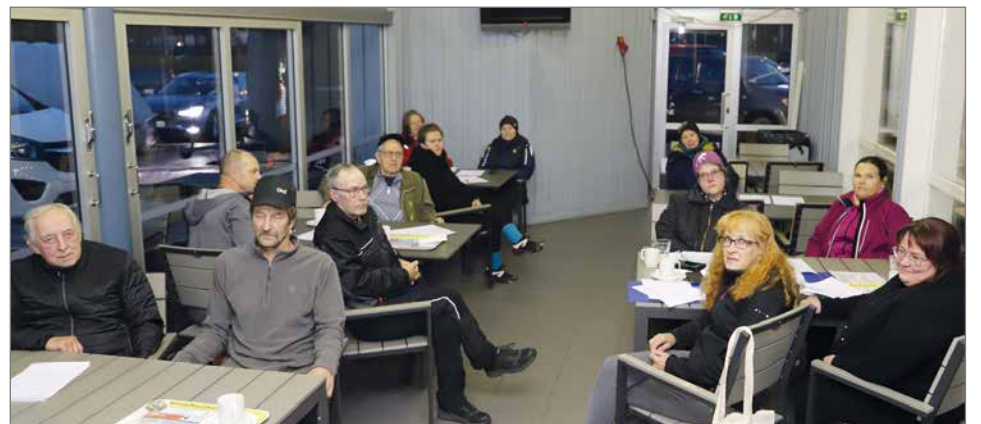
Syyskokoukseen osallistui 13 jäsentä Pudasjärveltä ja Taivalkoskelta.

Päätettiin, että tulevalta kaudella keskitytään lap-