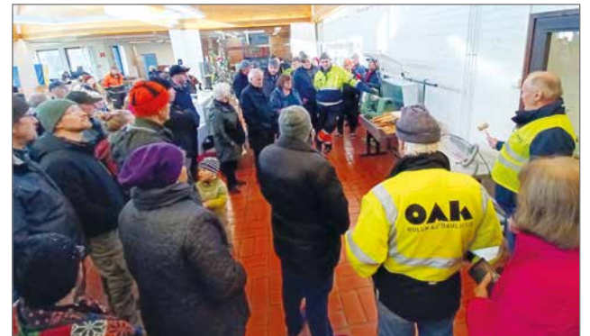
Huutokaupan ensimmäisinä tunteina tupa oli kohtalaisen täynnä.