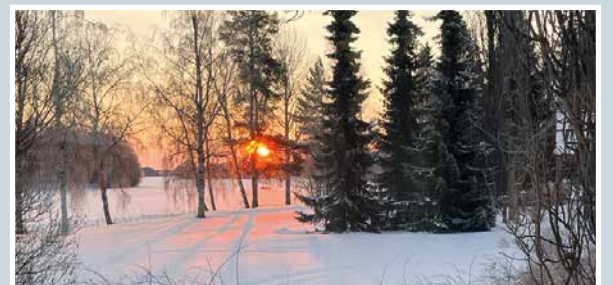
Kohta aukeaa talven ihmemaata!

lukijoiden palaute ja jutut: vkkmedia.fi