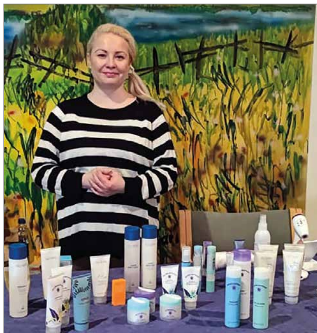
Sanna esitteli kauneuden- ja hyvinvointituotteita.

Siuruan Kylätalon toimijat