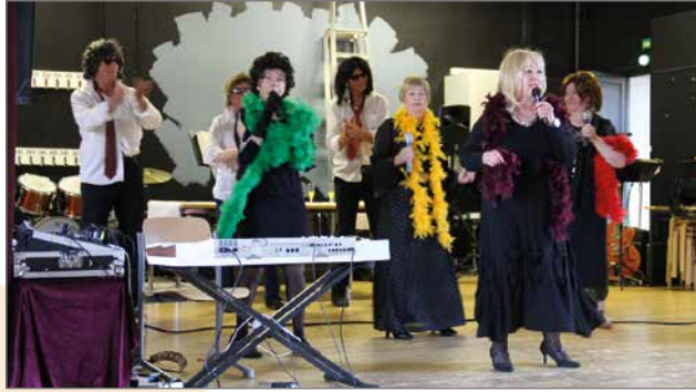
Leidit á La Pudasjärvi ja Go-Go pojat oli rempseä esitys iltamien järjestävän yhdistyksen jäsenten esittämä.

Tämä hauskuuttava ryhmä sai yleisön nauramaan ja