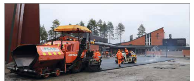
Seurakuntakodin pihamaa asfaltoitiin maanantaina 16.10. eli viikko valtuuston kokouksen jälkeen.

Esimerkiksi elokuun lopulla jia oli 161. ns. tavallisena pyhänä katso-