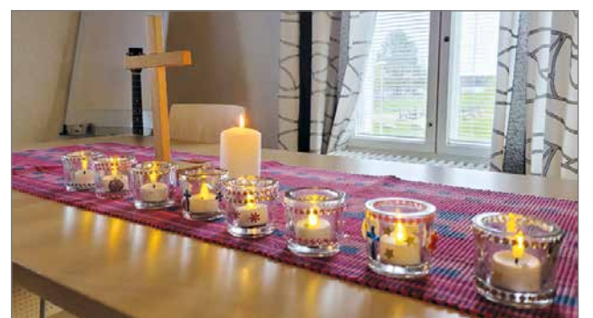
Leiriläiset askartelivat itselleen koristeelliset tuikkukupit.