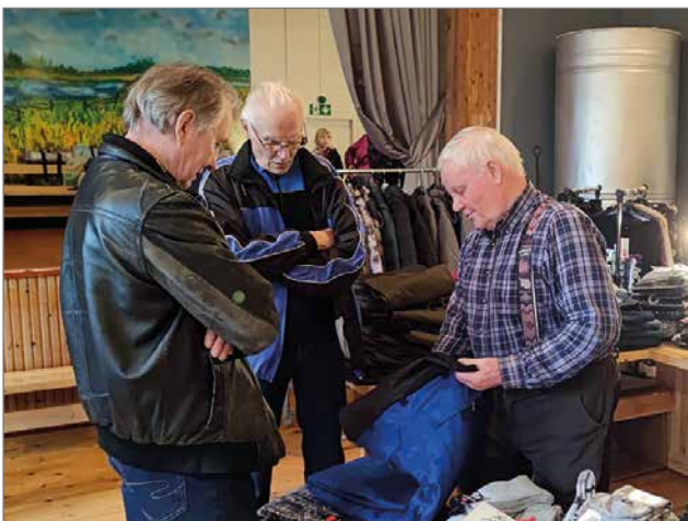
Miehet pääsivät tutustumaan miesesittelijän avustuksella miehille sopiviin tuotteisiin.

kukka-, ruusu-raparperi- ja mojitominttu-mansikkahillo sekä mäntymehu!