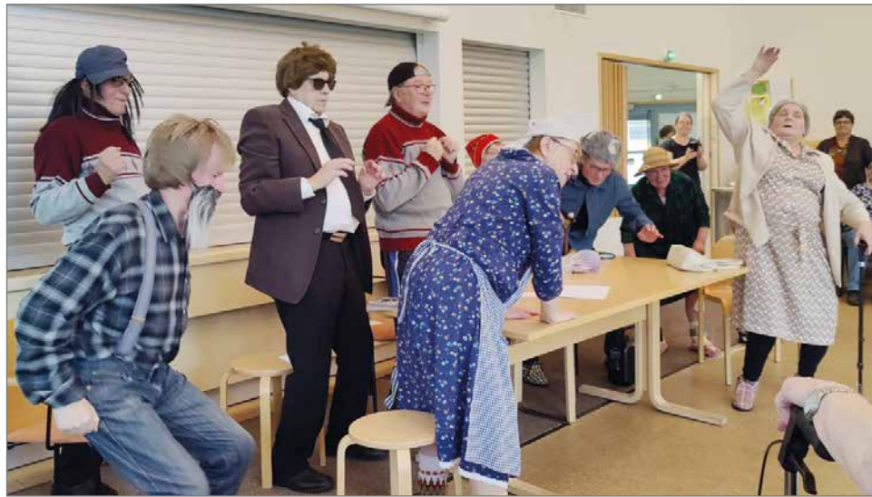
Naurettavan hauska näytelmä kertoo pitkän iän salaisuuksista.