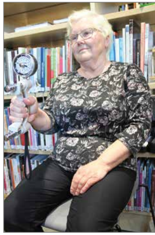
Käsien puristusvoimamittauksia suoritettiin koko messujen ajan.