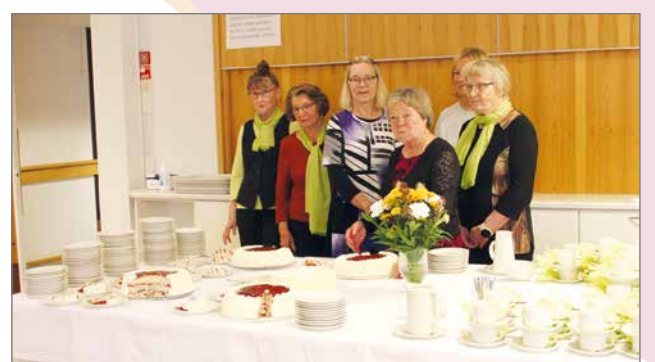
Hilimat olivat laittaneet tarjoilun valmiiksi seurakuntalaisten saapumiseksi kirkkokahville.