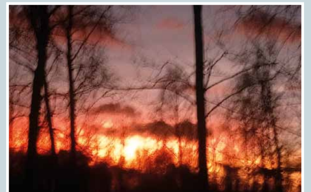
Taivaan tulet.

Martti Kähkönen lukijoiden palaute ja jutut: vkkmedia.fi