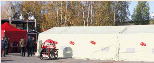
SPR:n evakuointiteltta oli komea näky Pudasjärven torilla. Sillalle mahtui kerralla ruokailemaan noin 60 ihmistä.

Syksyinen ilma hieman nipisteli poskia, mutta lämmittimen ansiosta teltassa oli mukavan lämmintä. Pienemmässä teltassa pihalla porisi jauhelihakeitto, jota valmisti SPR:n muonitusryhmä. Muonitusryhmä on Yli-lin SPR osastosta muodostettu vapaaehtoisen pelastuspalvelun toimintaryhmä, joka toimii SPR:n ruoka-apu hankkeen osana. Muonitusryhmä oli aloittanut päivänsä myös varhain alkuvuokkailuilla seurakun-