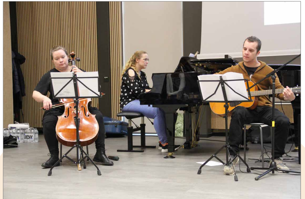
Kansalaisopiston musiikkiryhmän esitys ja yhteislauluokio oli messujen loppukevennyksenä.

Voimaa vanhuuteen -työryhmä