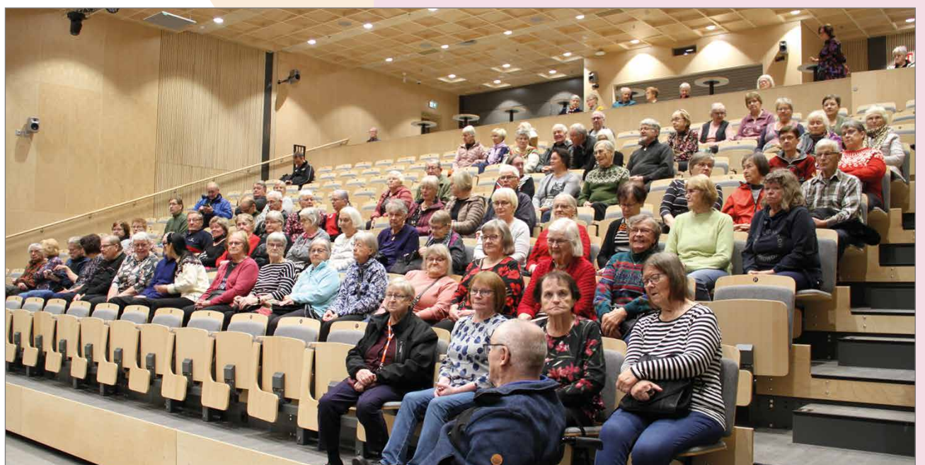
Yleisömäärä yllätti järjestäjät.

Sotalottia puolestaan ei ollut yhtään paikalla. Vuosien 2011-2012 aikana sota-