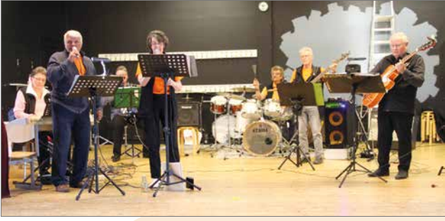
Illan päätti Suopunki-yhtyeen tahdittamat tanssit.

Eläkeliiton Pudasjärven yhdistys ry. oli Vanhustenviikon ohjelmatarjonnassa monessa mukana. Omana ponnistuksenaan yhdistys tarjosi vanhan ajan ohjelmalliset iltamat Suojalinnaassa keskiviikkona 4.10.