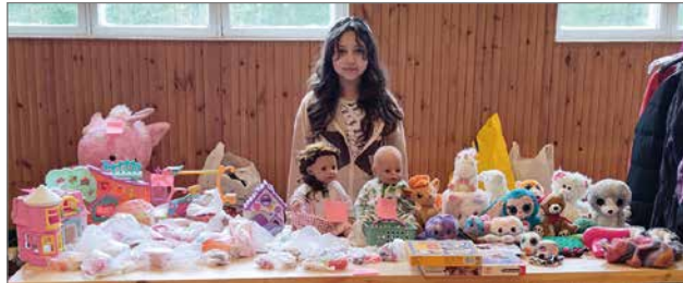
Jadessa tytön pöydällä oli leluja ja vaatteita.