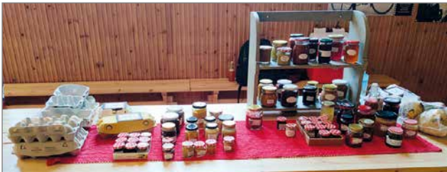
Tannilasta tuli luonnon antimista loihdittuja herkkuja.