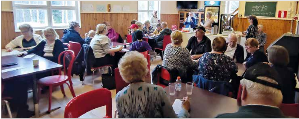
Kylätalon toimijoilla oli jännittävää numeropeliä tarjolla Bington muodossa.

Siuruan Kylätalolla lauantaina 30.9. järjestetty alkustartti Vanhustenviikolle keräsi väkeä kaikkiaan reippaat sata kävijää. Etkot oli paikallaan ja olo seuraavana päivänä sen mukainen - virkistynyt ja onnellinen.