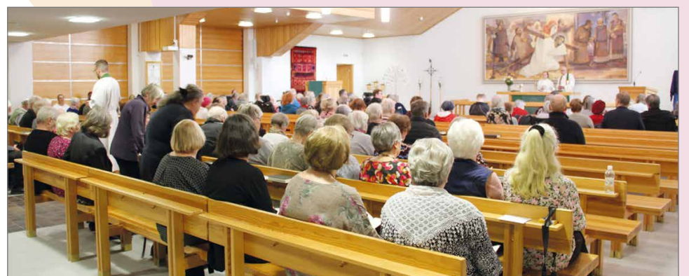
Vanhustenviikon arkimessuun osallistui seurakuntalaisia lähes täyden kirkkosalin verran.

Hilimat olivat kattaneet kahvion puolelle seurakunnan tarjoamat kirkkokahvit