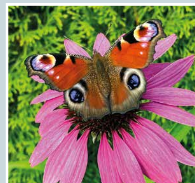
Neitoperhonen kukassa kuin kissan kasvot.

Martti Kähkönen lukijoiden palaute ja jutut: vkkmedia.fi