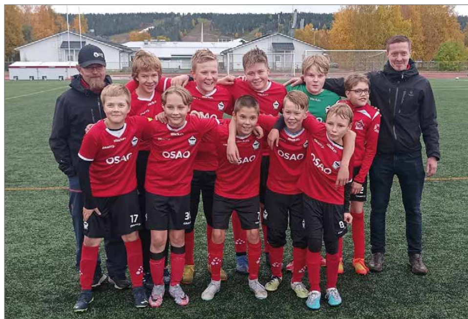
Kauden viimeisen pelin jälkeen hymy oli voiton myötä herkässä.

Kauden viimeiseen peliin Kurenpojat lähti hakemaan pisteitä Rovaniemeltä. Peli RoPS/Valkoista vastaan alkoi Kurenpoikien kannal-