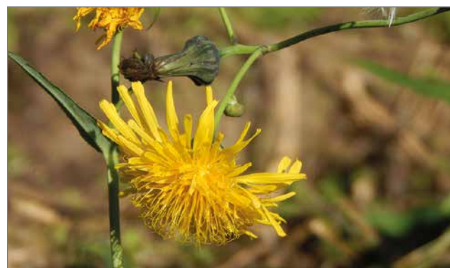
Peltovalvatin kukka on kauniin keltainen ja varsin kookas. Kasvi haarautuu vasta yläosastaan ja tekee haarojen päähän useampia keltaisia pähkylöitä.

lun korkeudella ohi syyskuun puolivälissä. Mutta luonnontapahtumien vuotuisessa kierrossa on vuositaitain suuria eroja. Peltovalvatti on yksi tärkeimmistä syksyisistä kasveista hyönteisille. Vielä lokakuussa voi laskea kukista kymmeniä hyönteislajeja. Peltovalvattia on pidetty viljelysmailla riansa, kasvina, jota on ollut vaikea poistaa. Valvatti voikin tehdä juuristonsa avulla laajoja kasvustoja ja sitä on vaikea kokonaan saada pois-tetuksi. Juurien lisäksi se levittää myös siementen avulla. Viimeisien vuosikymmenien aikana laji on runsastunut voimakkaasti, mikä on