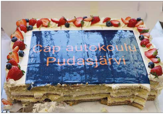
Kaikille tarjottiin täytekakkukahvit Anon Aseen sisätiloissa.