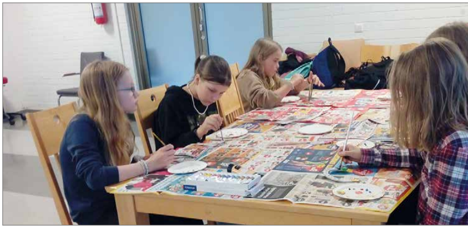
Eläinkerholaiset maalaamassa hevosenkenkiä palkinnoiksi Syysshirnu-tapahtumaan.