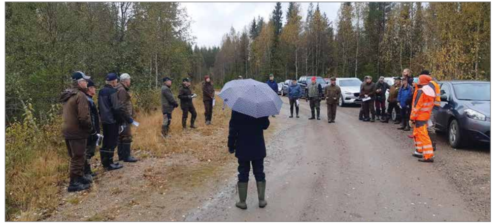
Metsänomistajille ja metsäalan toimijoille on järjestetty keskustelutilaisuuksia ja maastoretkeilyjä, jollainen retkeily Kouvanjoen osalta toteutui 20.9.

- Kouvanjoella on mahdollisuus saavuttaa myös maatalouden ja metsätalouden synergiaetuja. Metsäkeskuksen avoimen metsä- ja luontotiedon perusteella Kouvanjoen valuma-alueella on varsin runsaasti sellai-