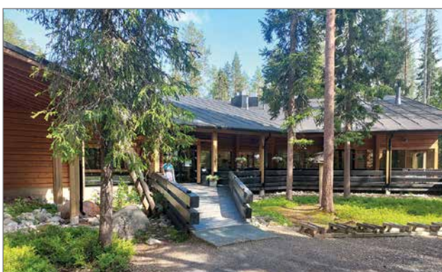
Syötteen luontokeskuksella toimii Kahvila Kerkkä, josta saa kahviotuotteiden lisäksi myös lounasta.

Syötteen Luontokeskus on komea hirsilinna Syötteen kansallispuiston portilla. Luontokeskuksen näyttely "Rakkautella luontosi" avattiin yleisölle joulukuussa 2022, ja se esittelee Syötteen luontoa. Luontokeskuksen sekä näyttelyyn