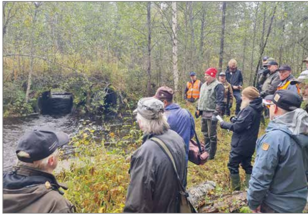
Sivakkakoskeen tutustumisen jälkeen retkikunta suunnisti rumpuputkelle, jossa käytiin läpi vaelluskalojen nousemisen esteisiin liittyviä tekijöitä.

- Iltapäivällä kävimme suometsienhoitokohtel- la tarkastelemassa kosteik-