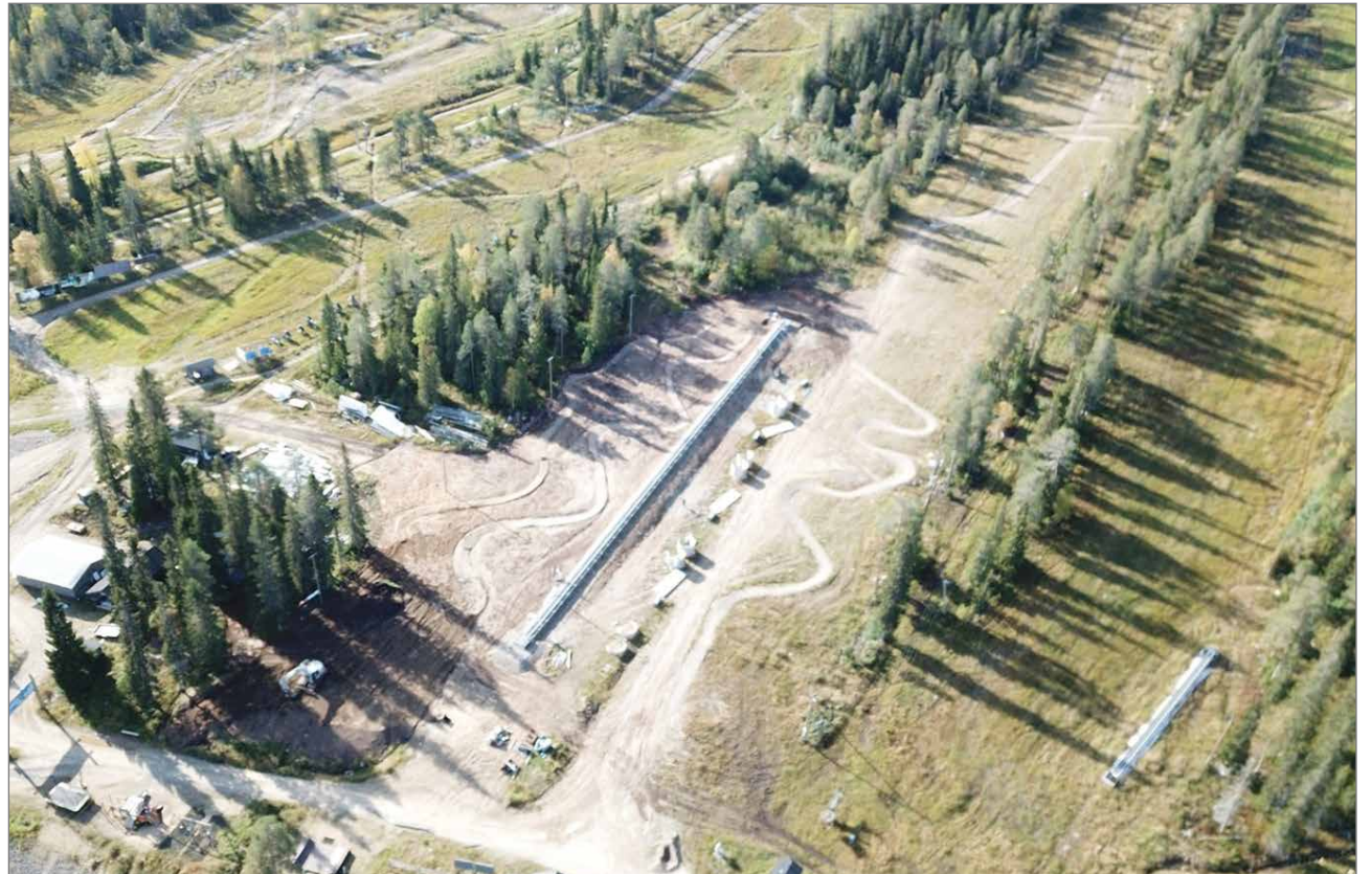
Iso-Syötteen rinteillä on kesän ja syksyn aikana rakennettu ahkerasti. Tulevana talvikautena suurimmat uudistukset ovat 100 metriä pitkä katettu mattohissi, leveä ja led-valaistu harjoittelurinne ja pulkkamäki.