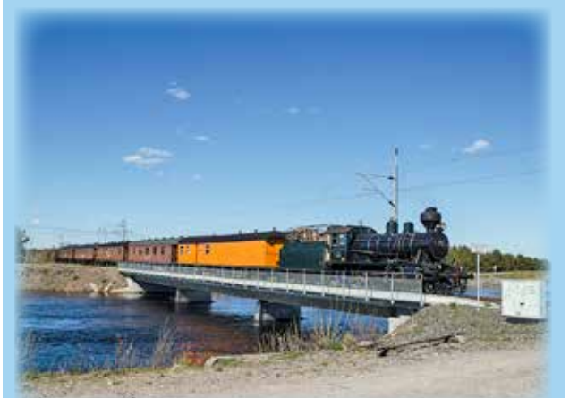
OI NIITÄ AIKOJAI! HÖYRYVETURIN VETÄMÄ JUNA.

lukijoiden palaute ja jutut: vkkmedia@vkkmedia.fi