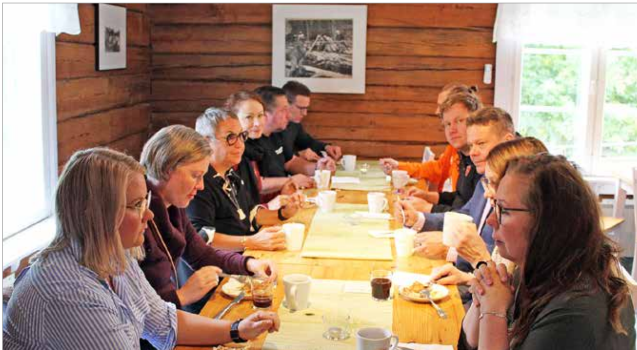
Aamukahville kokoontui reilut kymmenen iiläistä yrittäjää.

Yrittäjän päivää vietettiin maanantaina 5.9. ja tänä vuonna päivän keskiössä ovat lapset ja nuoret, teemalla "Jotta jokainen nuori tahtoisi toimia yritteliäänä yhteiskunnan jäsenenä".