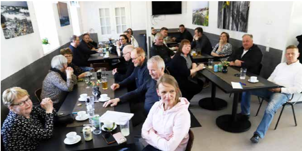
Kesäkauden avaukseen osallistui mukavasti yrittäjiä toukokuun alkupäivinä Iin Silloilla.

Iin Yrittäjillä on ollut tänä vuonna vilkasta toimintaa, etenkin koronarajoitusten poistuttua keväällä.