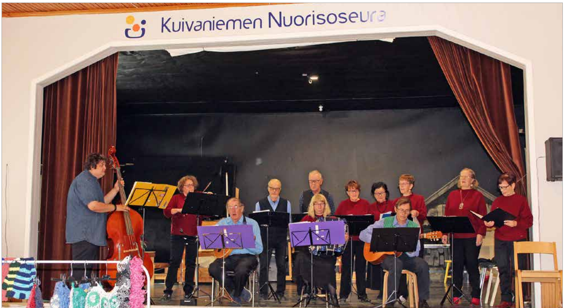
Kuivaniemen-Simon pelimannit avasivat esiintymisensä kappaleella "Kesällä keiuksella kerran"