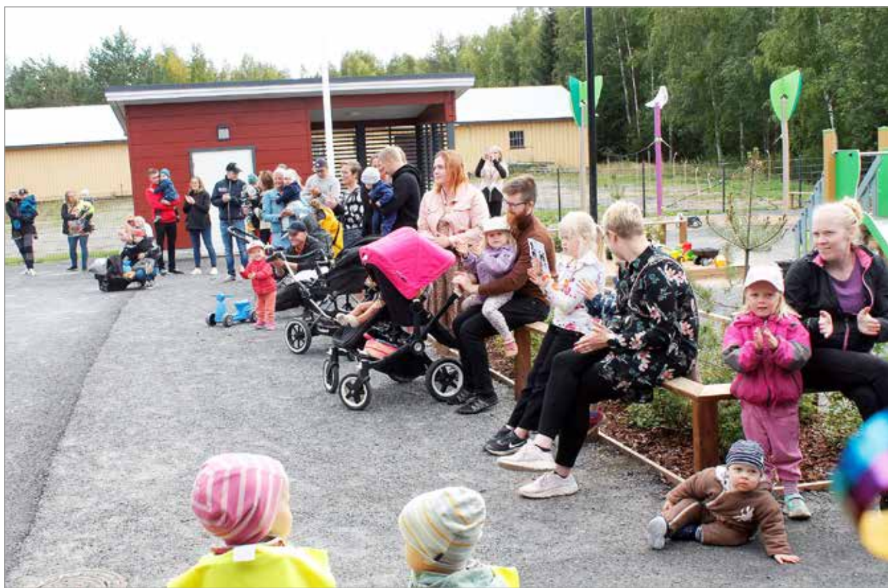
Hirsipäiväkodin avajaisissa kävi useita nykyisiä ja tulevia asiakasperheitä osallistumassa toimintapisteille ja kuuntelemaan musiikki- esitystä.