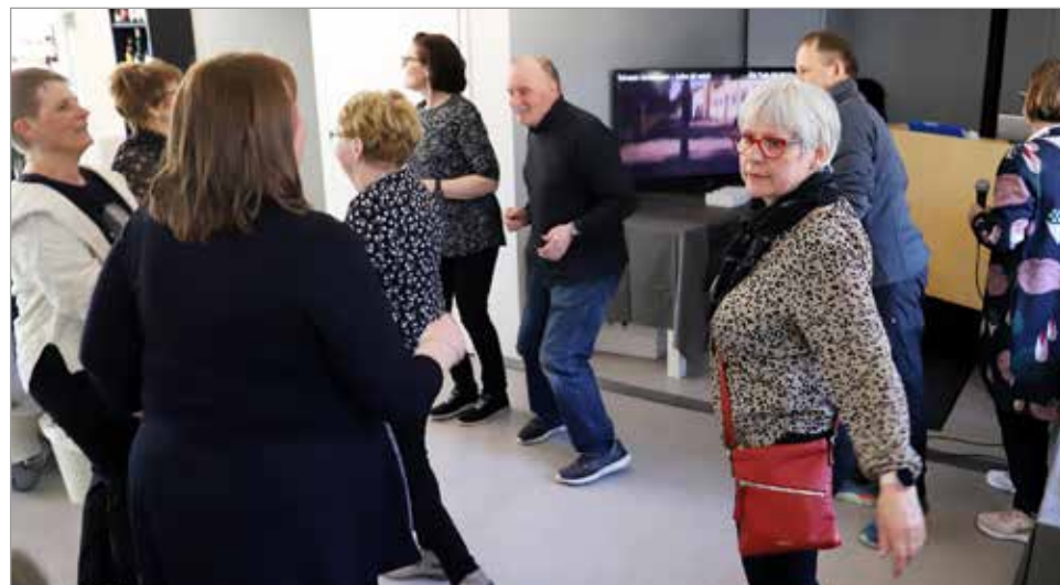
Kesäkauden avauksessa oli rento- ja hauska tunnelma mm. tanssin pyörteissä karaokelauluohjelman aikana.