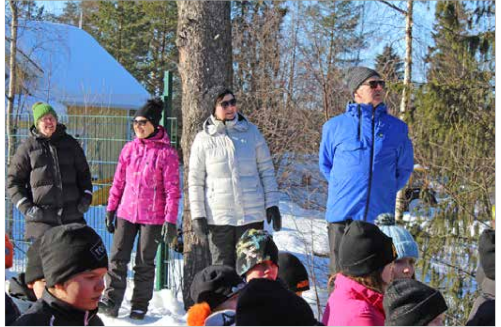
Kahden koronavuoden jälkeen tapahtumaan oli kutsuttu mukaan myös vanhemmat ja isovanhemmat.

Pohjois-lin koulun perinteistä hiihtopäivää vietettiin perjantaina 4.3. Kahden koronavuoden jälkeen myös vanhemmilla ja isovanhemmilla oli mahdollisuus saapua seuraamaan tätä iloista tapahtumaa. Aurinkoinen sää olikin saanut kannustajat liikkeelle ja oppilaat nauttivat hiihdosta kukin omalla tavallaan. Osa hiihti kullasta ja kunniaista, osan nauttiessa keväisestä luonnosta ja liikkumisesta omaan rauhallisempaan tahtiinsa. Maalissa odottivat mehut ja ruokailun jälkeen sarjojen kolme parasta palkittiin komeilla pokaaleilla. Kaikki hiihtäjät saivat tietenkin suut makeiksi, jonka jälkeen oli aika lähteä hiihtolomaviikon viettoon. MTR