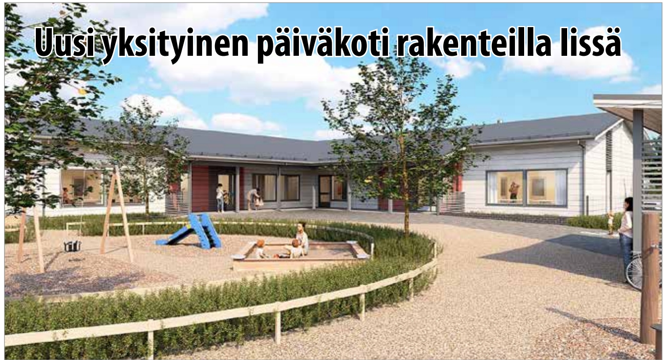
Havainnekuvan mukaan tältä tulee näyttämään uuden Päiväkoti Tahdin etupiha.

Kuivaniemen perhekerho To 17.3.2022 10:00 - 12:00 Kuivaniemen seurakuntasali. Perhekerhon ohjelmassa on leikkiä, askartelua, mukavaa yhteistä tekemistä ja yhdessäoloa. Tule tapaamaan toisia lapsia ja aikuisia ja vaihtamaan kuulumisia! Perhekerhoon ovat tervetulleita vanhemmat, isovanhemmat ja hoitajat kaikenikäisten lasten kanssa. Tule kerhoon vain kun olet itse terveenä ja perheessäsi ollaan terveenä! Lämpimästi tervetuloa!