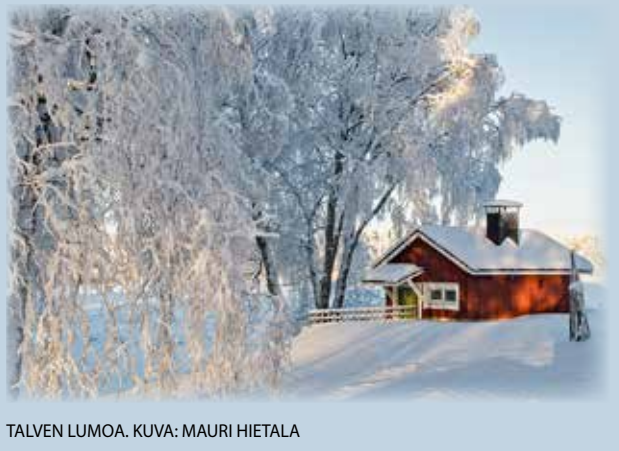
TALVEN LUMOA.