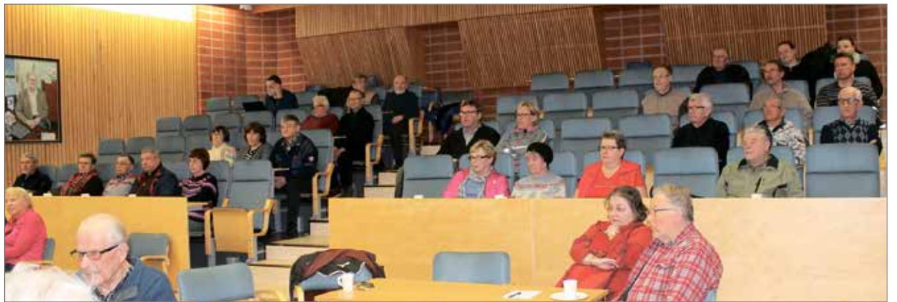
Nätteporin valtuustosaliin oli kerääntynyt liki 50 henkilöä muistelemaan lijoen uittoa.

Juttua piisasi niin paljon, että aika meinasi loppua kes-