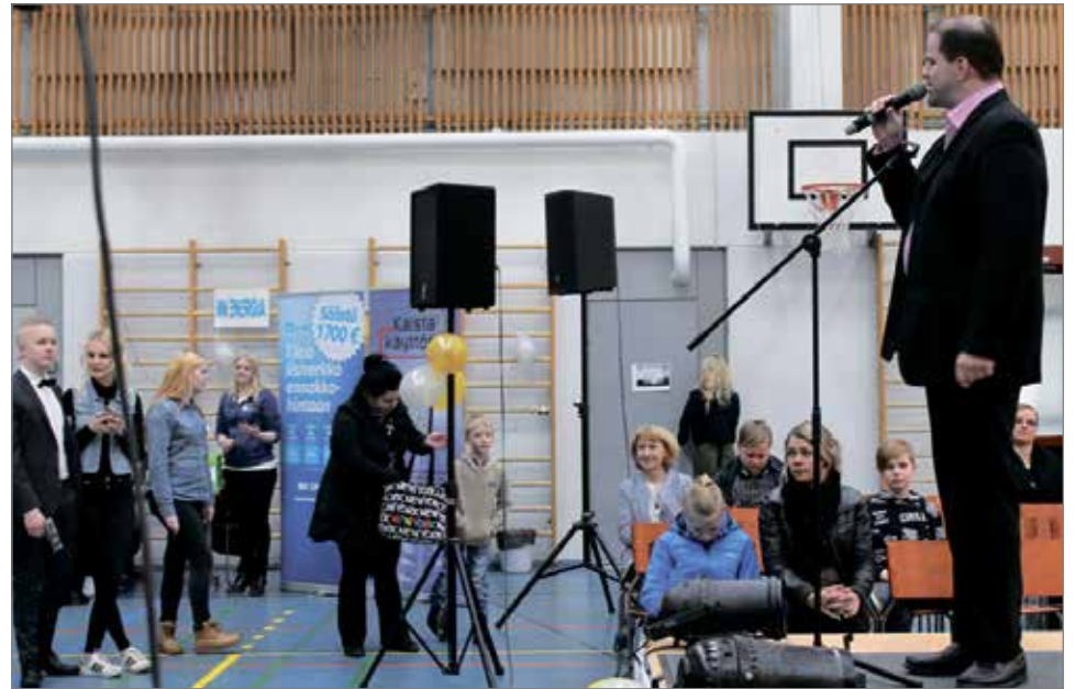
Stand up -koomikko ja imitaattori Ari Kettukangas nauratti yleisöä.