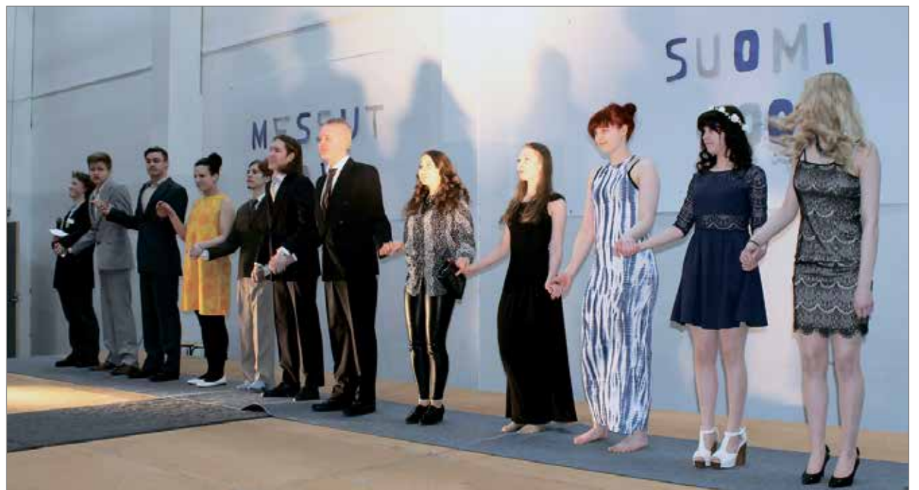
Lukiolaisten muotinäytös kiinnosti yleisöä.