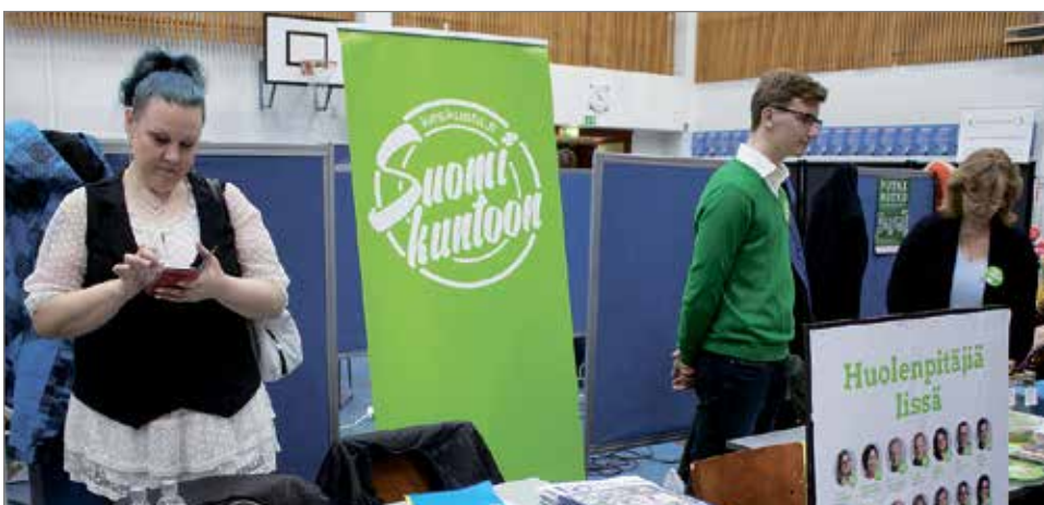
Perussuomalaisten ja Keskustan pöydät olivat vierekkäin.

Iin lukion yrittäjyyskurssin järjestämiä Iin messuja vietettiin lauantaina 8.4. 10-vuotisjuhlamessujen ja Suomi 100-vuotta -teemalla Valtarin koululla.