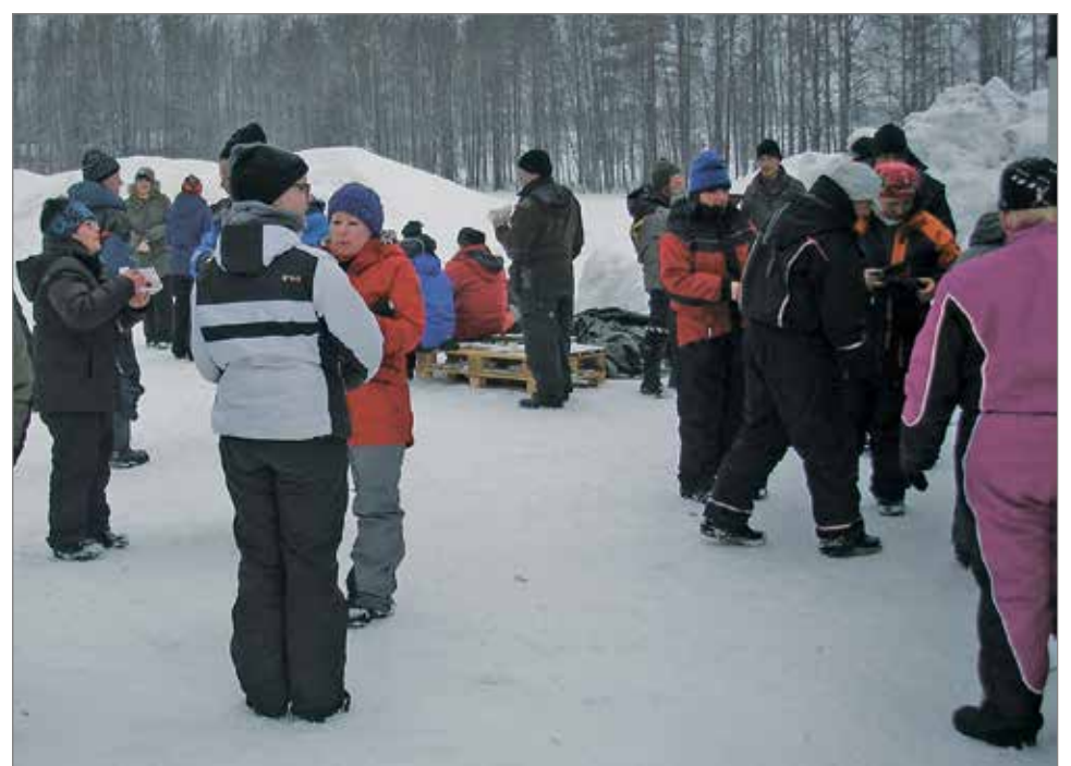
Pilkkikilpailun tuloksia odotellaan.

Kiitämme kilpailun onnistumisesta kilpailijoita, ahkeria talkoolaisia ja kaikkia tukijoita: Iin kunta, Kärkkäinen Ii, S-market Ii, K-market Ii, Iin Apteekki, Sievin Savi Kuivaniemi, Sale Kuivaniemi, Kuivaniemen Kukkapirtti, Kuiva-Kaluste, Intersport Kemi, Simon Apteekki, Sale