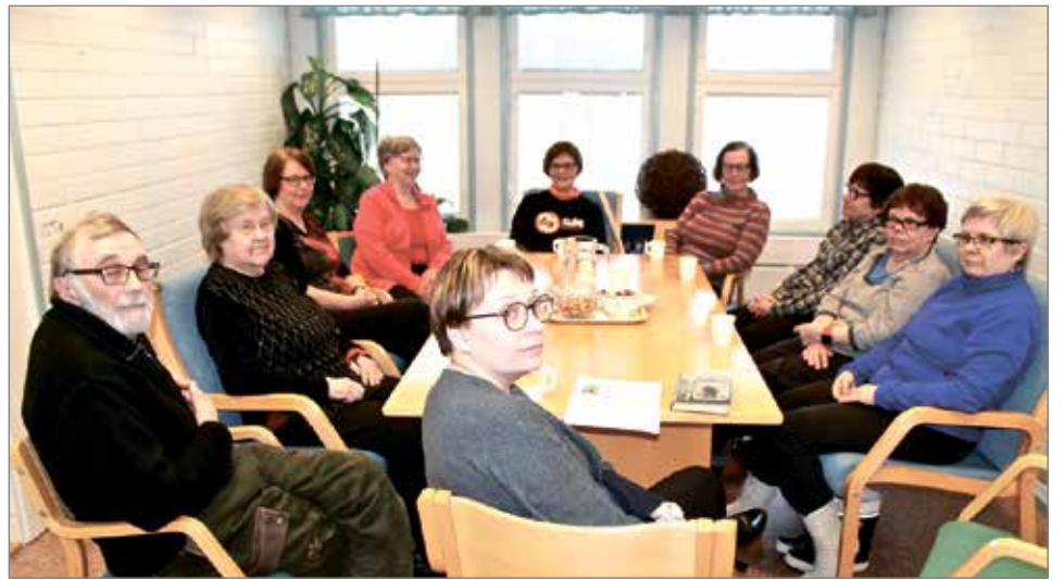
Kuivaniemellä lukupiirissä oli kymmenen osallistujaa.