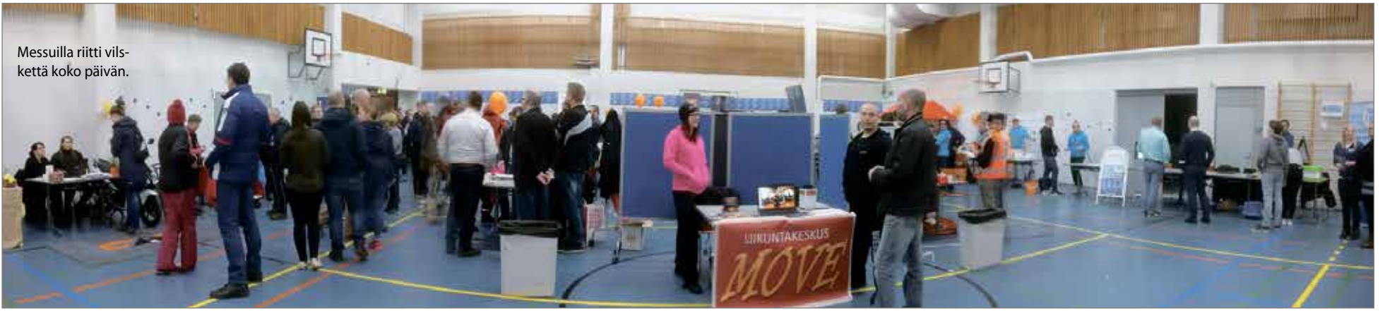
Messuilla riitti vilskettä koko päivän.