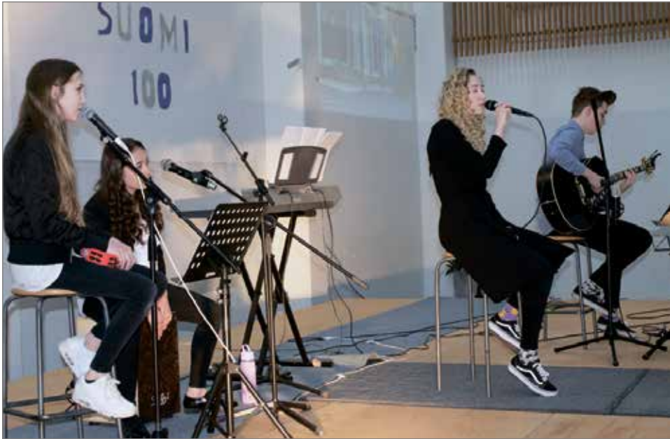
Wonderfuss täydennystä siskoilla esiintyi messuilla.