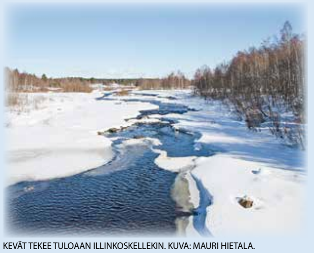
KEVÄT TEKEE TULOAA ILLINKOSKELLEKIN.

lukijoiden palaute ja jutut: vkkmedia@vkkmedia.fi