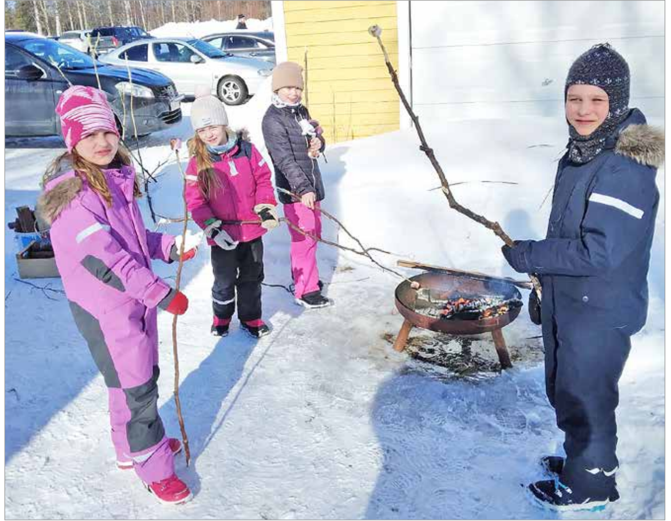
Lapset riasruivat saadessaan paahtaa nuotiolla vahtokarkkeja, jotka tarjosi Kuivaniemen Nuorisoseura.

Kuivaniemen Nuorisoseurala pidettiin 1.4. koko perheen aprillirieha, samalla ohjelmassa oli pääsiäismyyjäiset, mäenlaskua, makkaranpaistoa ja onnenpyörää. Eniten lapset ilahtuivat päästessään maksutta kokeilemaan vahtokarkin paahtamista nuotiolla.