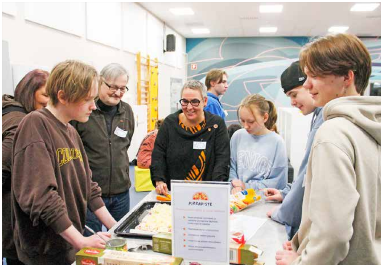
Pizzapisteellä ryhmät harjoittelivat neuvottelutaitojaan valitessaan täytteitä pizzeriaan: mitä tehdään, kun osa ryhmäläisistä pitää kinkusta, mutta mukana on kasvissyöjiäkin?