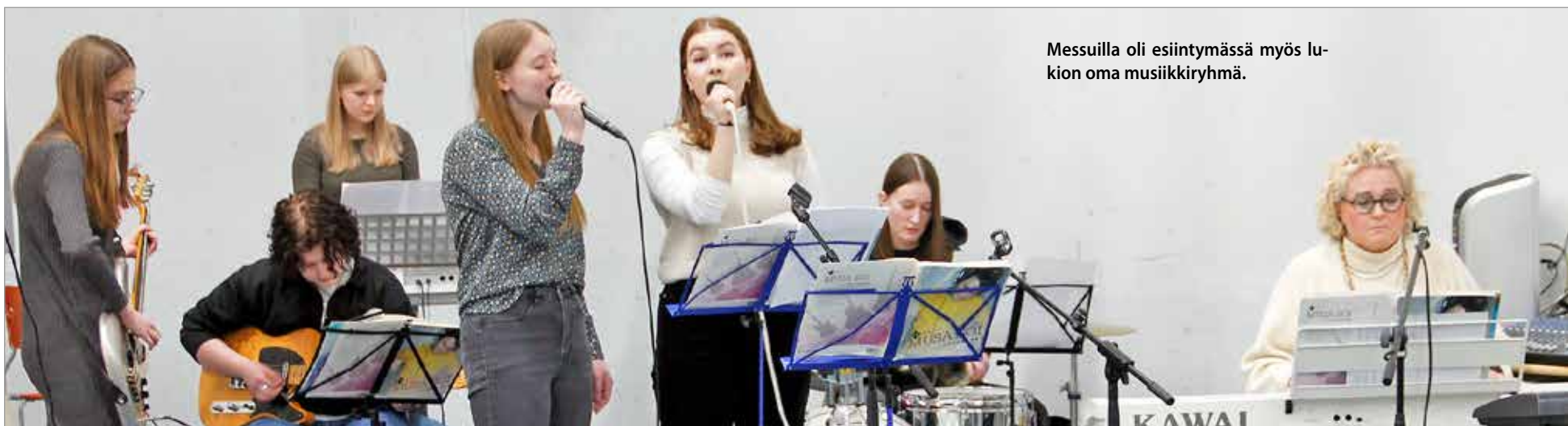
Messuilla oli esiintymässä myös lu- kion oma musiikkiryhmä.