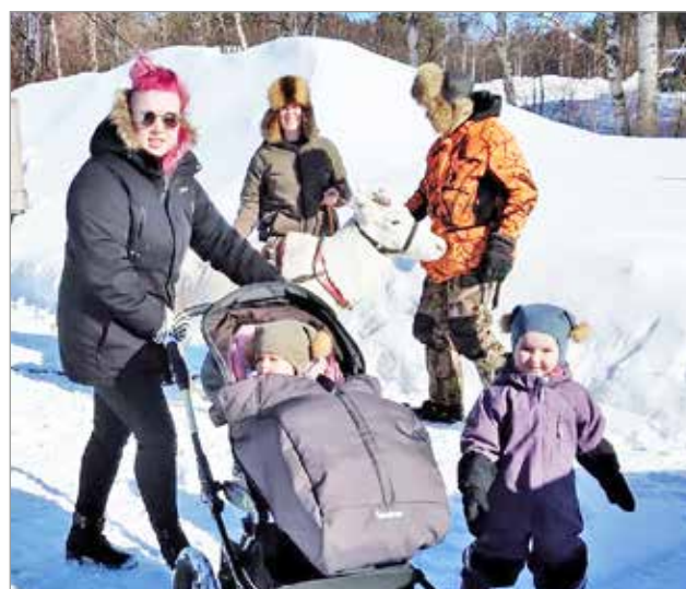
Aurinkoinen talvisää heli Aprilliriehassa kävijöitä.