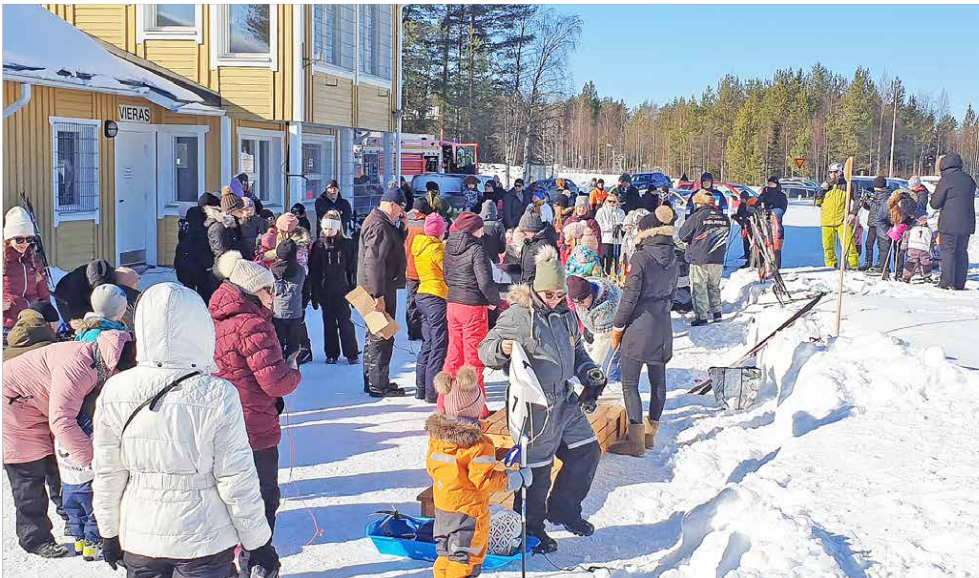
Kuivaniemellä aseman urheilukentällä järjestetty ulkoilutapahtuma oli yleisömenestys!