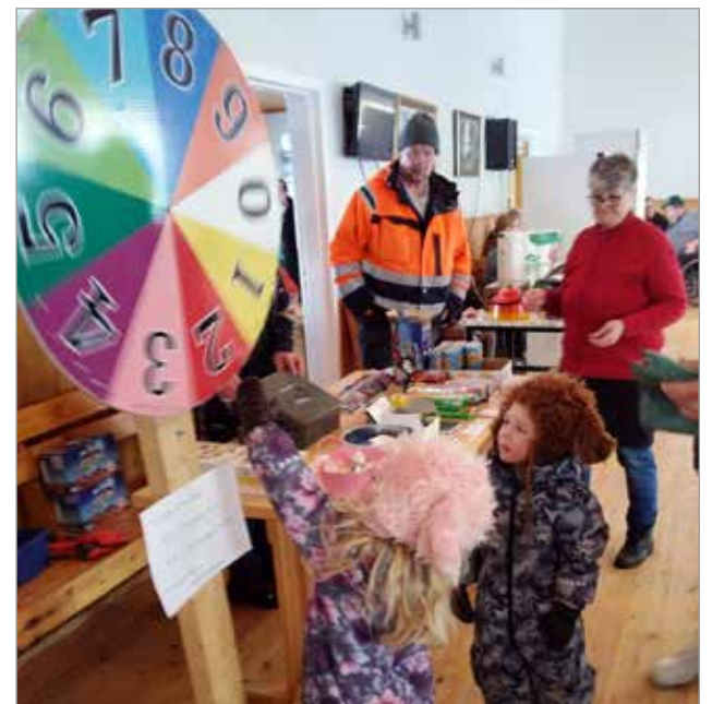
Onnekkaat onnenpyörän pelaajat.