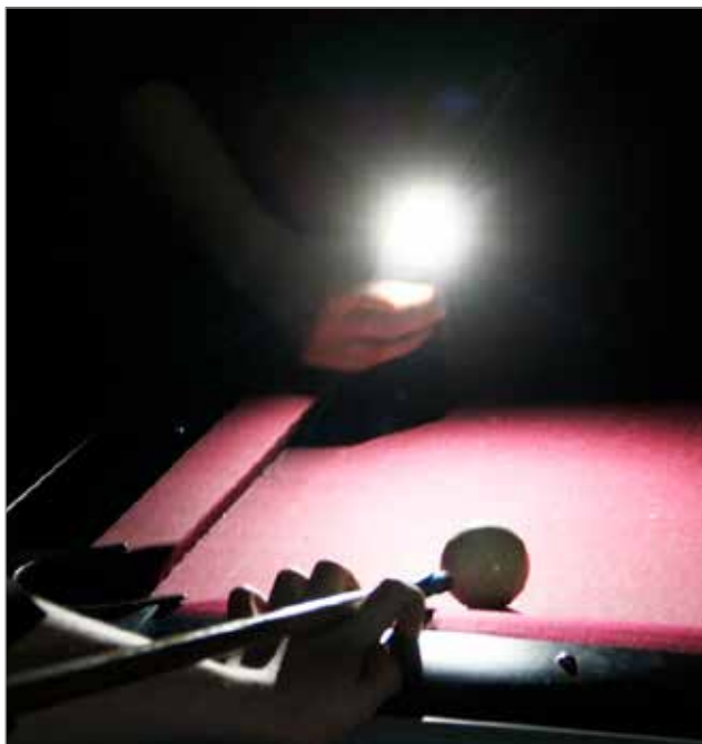
Pizzan paiston jälkeen vietettiin Earth Houria, jonka ajaksi nuokkarilta sammutettiin valot. Tämä ei kuitenkaan haitannut biljardin pelaamista, jota näppärimmät valaisivat puhelimella.