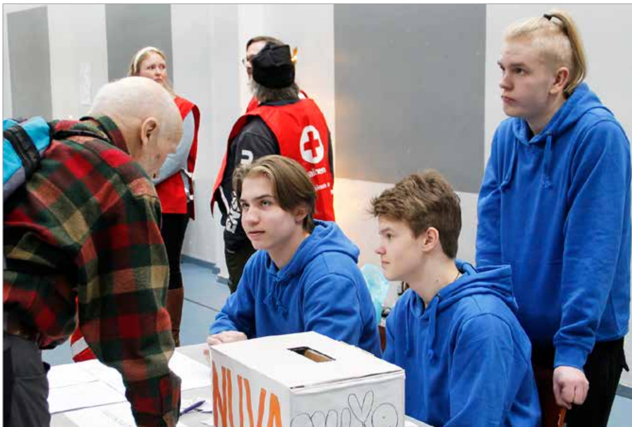
Iin Nuorisovaltuuston porukka esitteli toimintaansa Iin messuilla ja he esittelivät muun muassa nuorille järjestettyjen varjovalien tu- loksia.