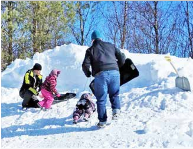
Nuorisoseuran viereen tehdyssä pulkkamässä riitti vilskettä.