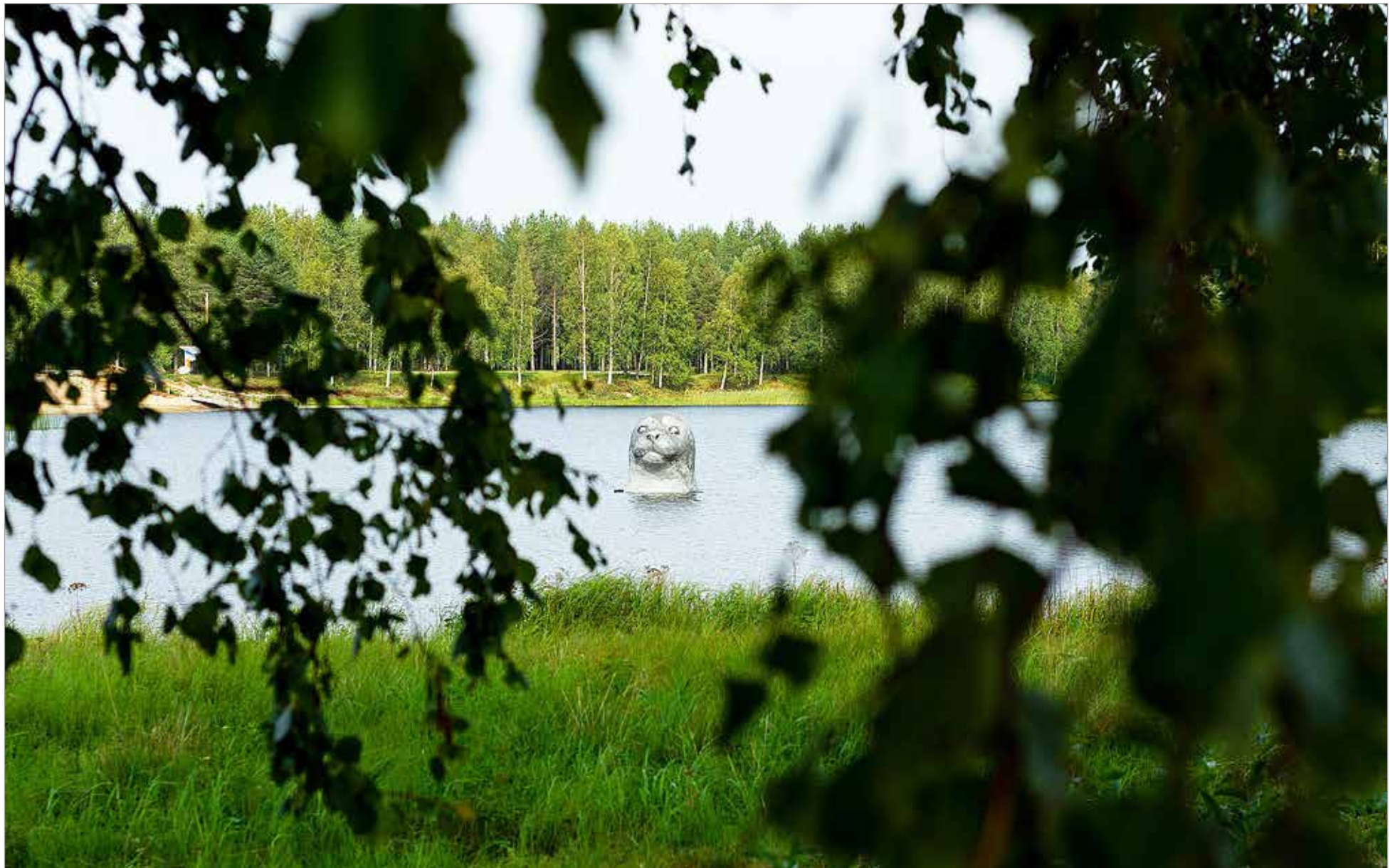
Sanna Koivisto on tunnettu erityisesti julkisista teoksistaan, kuten tämä Norppa -niminen teos. Vuoden 2019 IlmastoAreena -tapahtumaan kierrätysmateriaalista valmistettu Norppa kurkistaa lijoesta ja ilahduttaa Nelostietä kulkevia kesäisin. Kuva Inka Hyvönen.