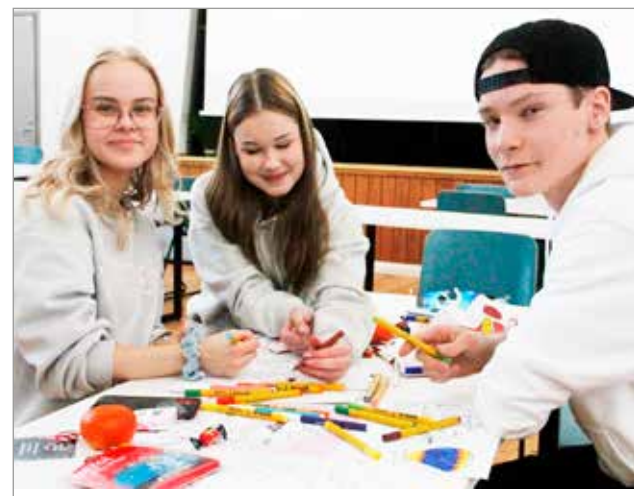
Lapsille messuilla oli myös paljon puuhaa, kuten kasvomaalaus- ta ja värityötehtäviä.