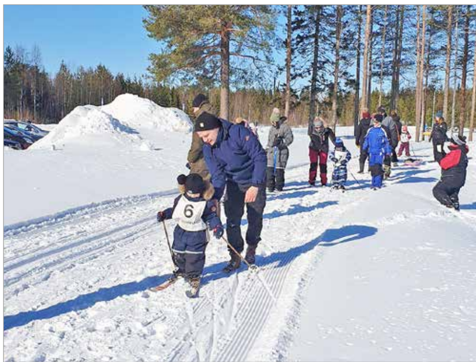
Jopa 52 pientä hiihtäjää osallistui hiihtokisaan 25.3.