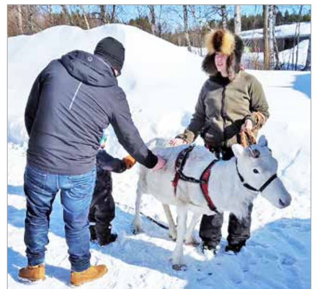
Kuivaniemen Nuorisoseura oli saanut lainaksi Joulupukilta poron, jota lapset saivat käydä tapaamassa.