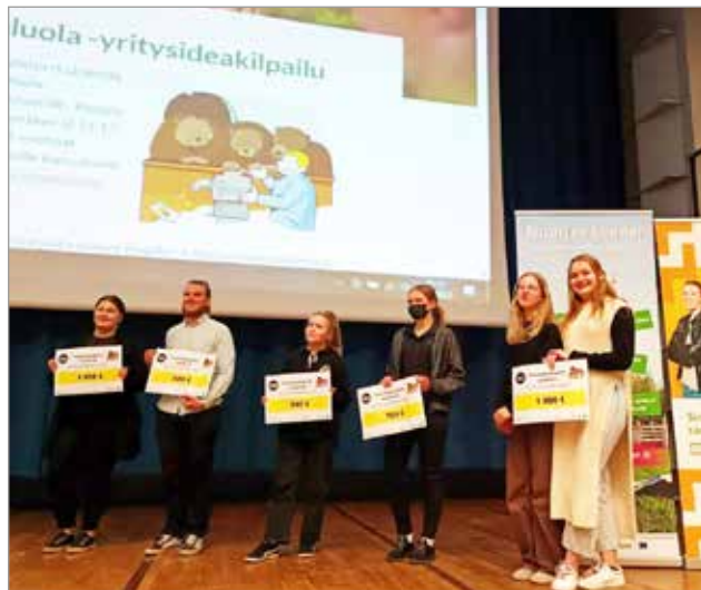
Kuva viime vuoden 13-17-vuotiaiden sarjan voittajasta: Jakkukylän Siltakahvila, joka oli viiden iiläisen nuoren yritys.