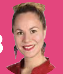
Sarkkinen Hanna kansanedustaja, filosofian maisteri Oulu