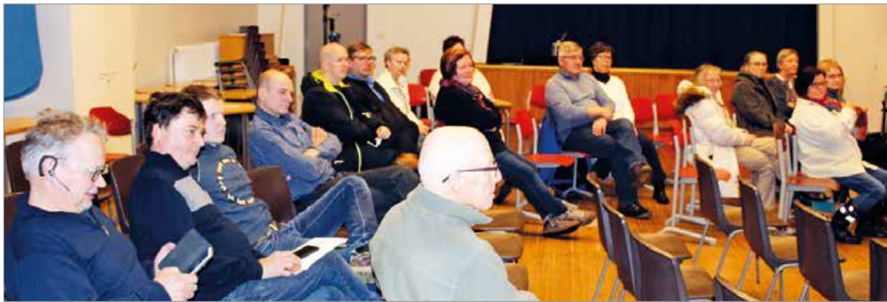
Tuulivoimaloiden YVA-prosesseista oli saapunut saamaan lisätietoa parikymmentä kuntalaista.

Suomen Luonnonsuojeluliiton periaatteellisen kannan Ylönen totesi olevan tuulivoimaan myönteisen. Luonnonsuojeluliitto edellyttää, ettei tuulivoimaa rakenneta lintujen päämuutoreiteille, ei matalanveden vyöhykkeille, eikä aivan tien laitaan. Myöskään suojelualueet eivät sovellu tuulivoimapuistoille, eikä niitä tulisi sijoittaa erämaisiin maisemiin. MTR