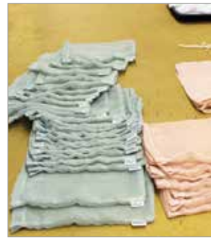
Kierrätysmateriaaleista tehtyjen kestopussin valmistukseen osallistuneet vierailijat saivat pussin vaivansa palkaksi.