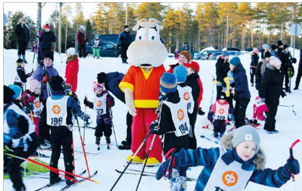
Hippo sai innokkaita hiihtäjiä seurakseen jo ennen hiihtojen alkamista.

Pienimpien sarjat hiihrettiin ilman ajanottoa. Yhteislähdöillä hiihdetyissä kilpailuis- sa ajat otettiin sarjoista 7v alkaen. MTR