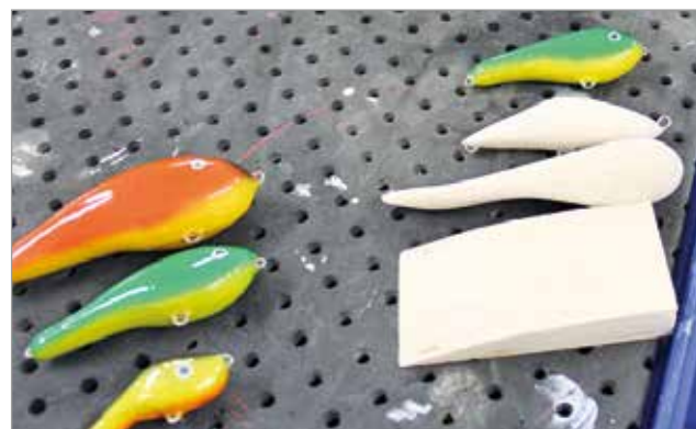
Palsapuusta puutyöosastolla valmistetaan vaappuja. Onko tässä lipajan tulevaisuuden hittituote.