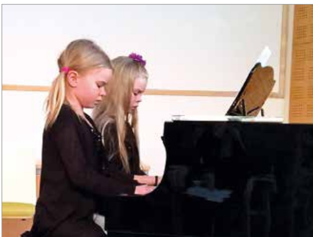
Yhteismusiisoinnissa voi opiskella vaikkapa duoa pianolla.