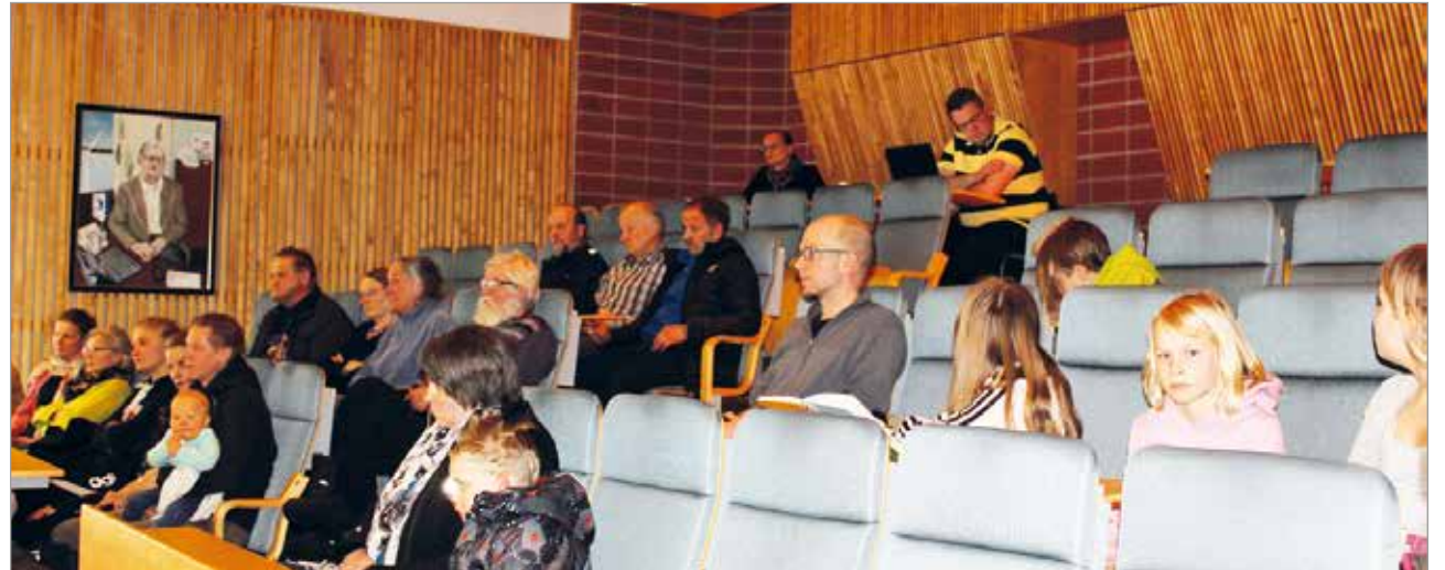
Keskustelutilaisuuteen Ylirannan koulun kohtalosta oli saapunut myös kylän lapsia.