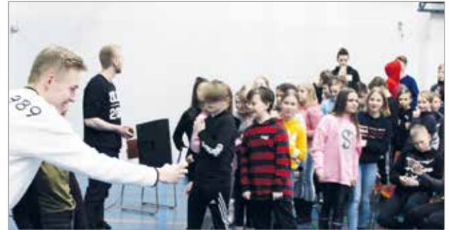
Kaikki halusivat selfien idoliensa kanssa.