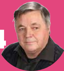
Nybacka Silvo lähihoitaja, sähköasentaja Lumijoki