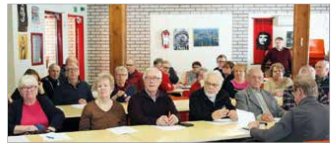
Eläkeläiset ry Jokilaaksojen aluejärjestön kevätkokouksen lihin saapui kolmekymmentäkahdeksan virallista kokousedustajaa.

-Teette tärkeää edunvalvontatyötä, sekä järjestätte monenlaista virkistystoimintaa. Retket, liikunta ja koulutus ovat tärkeitä virkistykseen kannalta, estään samalla yksinäisyyttä, Liedes totesi toivottaessaan kokousvieraat tervetulleiksi Iihin. MTR