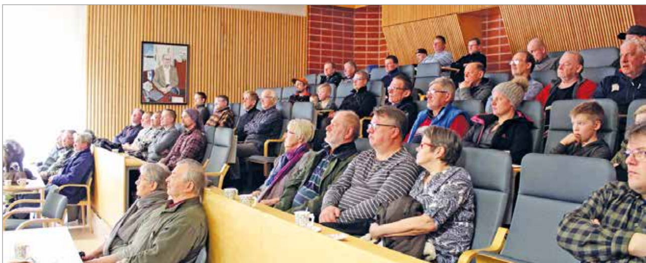
Eränkäynti ennen ja nyt -luento kiinnosti iiläisiä.