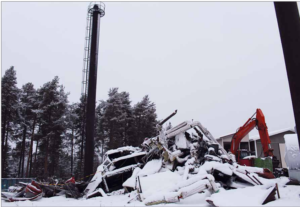
Suvantolan kaukolämpölaite purettiin syksyn ja alkutalven aikana.

Pentinkankaan uudessa lämpölaiteosessa polttoaineena käytetään hakkeen lisäksi pellettä. Myös varavoimalassa on luovuttu öljyn käytöstä. MTR