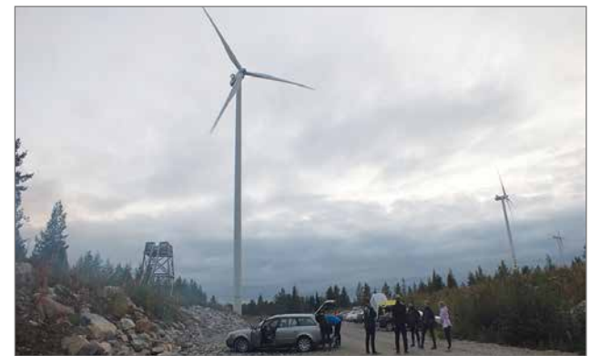
Iissä tuulivoima on osa arkipäivää, eivätkä tuulivoimalat haittaa alueiden monipuolista hyödyntämistä, vaikkapa suunnistuskilpailuihin.

Molempien hankkeiden toteutuessa kokonaisuudessaan, lisäänny tuulivoimaloiden määrä Iissä yli kaksinkertaiseksi. MTR