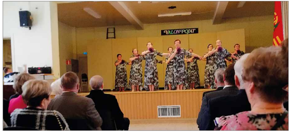
Oulun Tarmon Pohjan Akat on saanut mainetta kansainvälisissä voimistelutapahtumissa Voimistelijoiden keski-ikä on 70:n tienoilla, mutta minkä nuorena oppii sen vanhana taitaa.

Puheessaan Itkonen kävi läpi TUL:n perustamisen 26.1. 1919 ja suomalaisen liikuntaelämän eri vaiheet. Urheiluseurojen ja kaantumisen työväen- ja porvariseuroihin oli suomalaisen liikuntaelämän rikkaus ja mahdollisesti sen, että