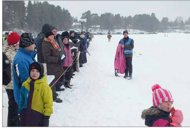
Iin Raveissa on tunnelmaa.

Iin perinteiset jääravit ravataan tänä vuonna tulevina lauantaina. Illinsuvannolla nähdään jälleen tiukkoja taistoja seitsemässä hevosja kahdessa ponilähdössä.