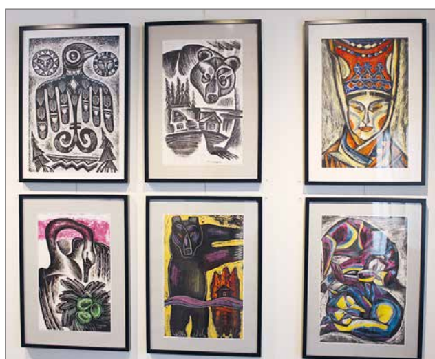
Näyttelyn teokset ovat esillä Nätteporin aulassa maaliskuun alkupuolelle saakka.

Irina Sitdikova kuuluu vuonna 1995 perustettuun