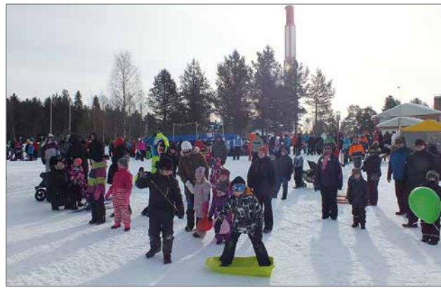
Lumivalakiat kerää Rantakestilään tuhatpäisen yleisön.

Perinteiset Lumivalakiat Rantakestilässä ovat tänä vuonna lauantaina 16.3. koko perheelle suunnattu iloinen kevätalventapahtuma. Lapsia viihdyttää kahteenkin kertaan esiintyvä Liikkuva Laulureppu ja iloisimmat ilmeet saaneet lasten kasvoille liukukurimäkikisa puolilta päivin.