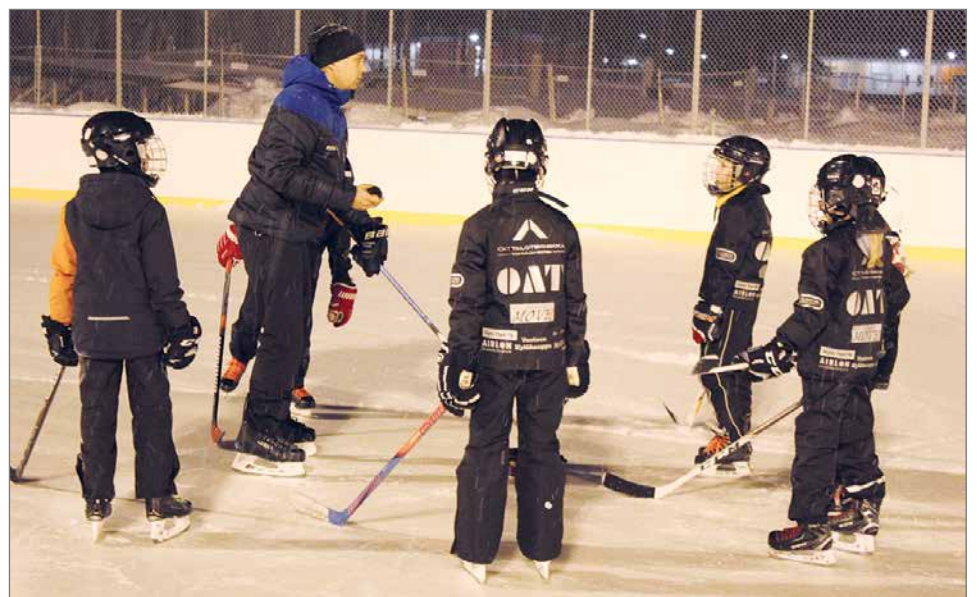
Pienet tytöt ja pojat mahtuvat hyvin samaan joukkueeseen.

vänkuvaan kuuluu yhteydenpito seuroihin, sekä kouluttaminen ja leirivalmentajana toimiminen. -Pohjoisessa tyttöjäkiekko on mennyt harppauksilla eteenpäin ja Kuortaneelle kutsuttujen kuudenkymmenen Suomen parhaimman alle 16-vuotiaan tyttökiekkoilijan leirille pääsi yksitoista tyttöä poh-