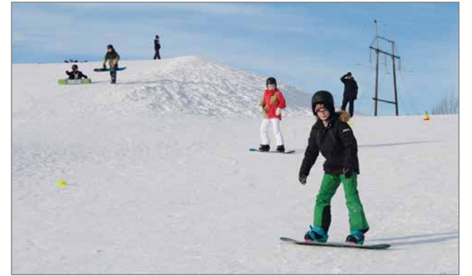
Harjoitus tekee mestarin ja Tikkamäessä on turvallista aloittaa harjoittelu.