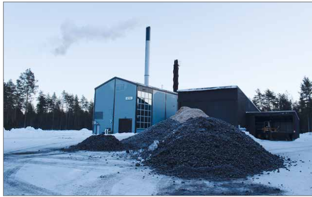
Iiläisten kaukolämpö tuotetaan tällä hetkellä Oulunseudun Sähkön uudella laitoksella Pentinkankaalla.