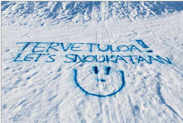
Tikkamäki toivottaa laskettelijat tervetulleiksi.

tintäasiassa ja saada heidät huomaamaan myös someviestinnän tärkeys perinteisten viestintäkanavien rinnalla, Ari Alatossava kertoo. MTR