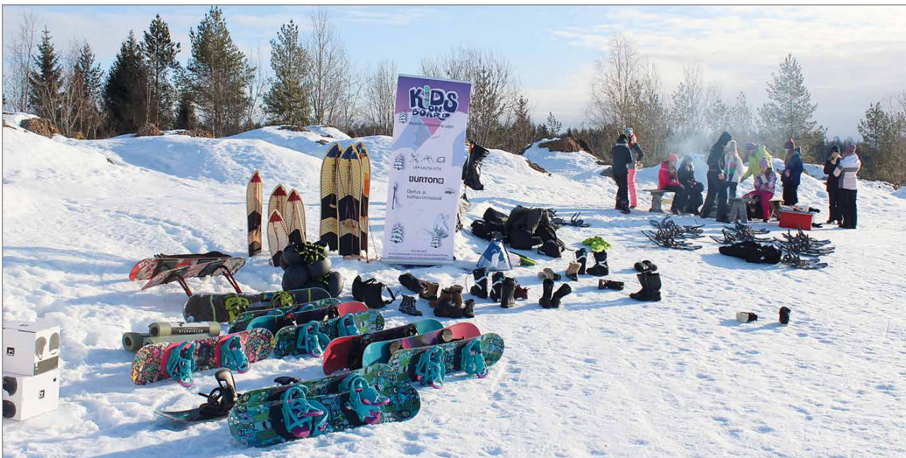
Liikkuva koulu -hankkeen puitteissa Iin kouluille on hankittu monipuolisesti liikuntavälineitä.