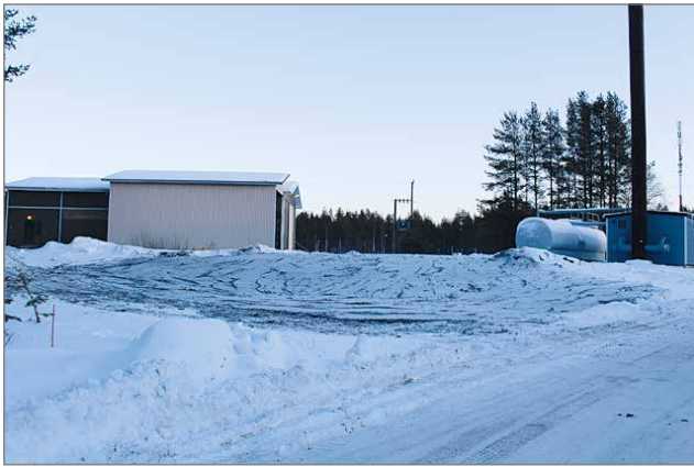
Monien iiläisten maamerkki on poistunut piipun kaaduttua.