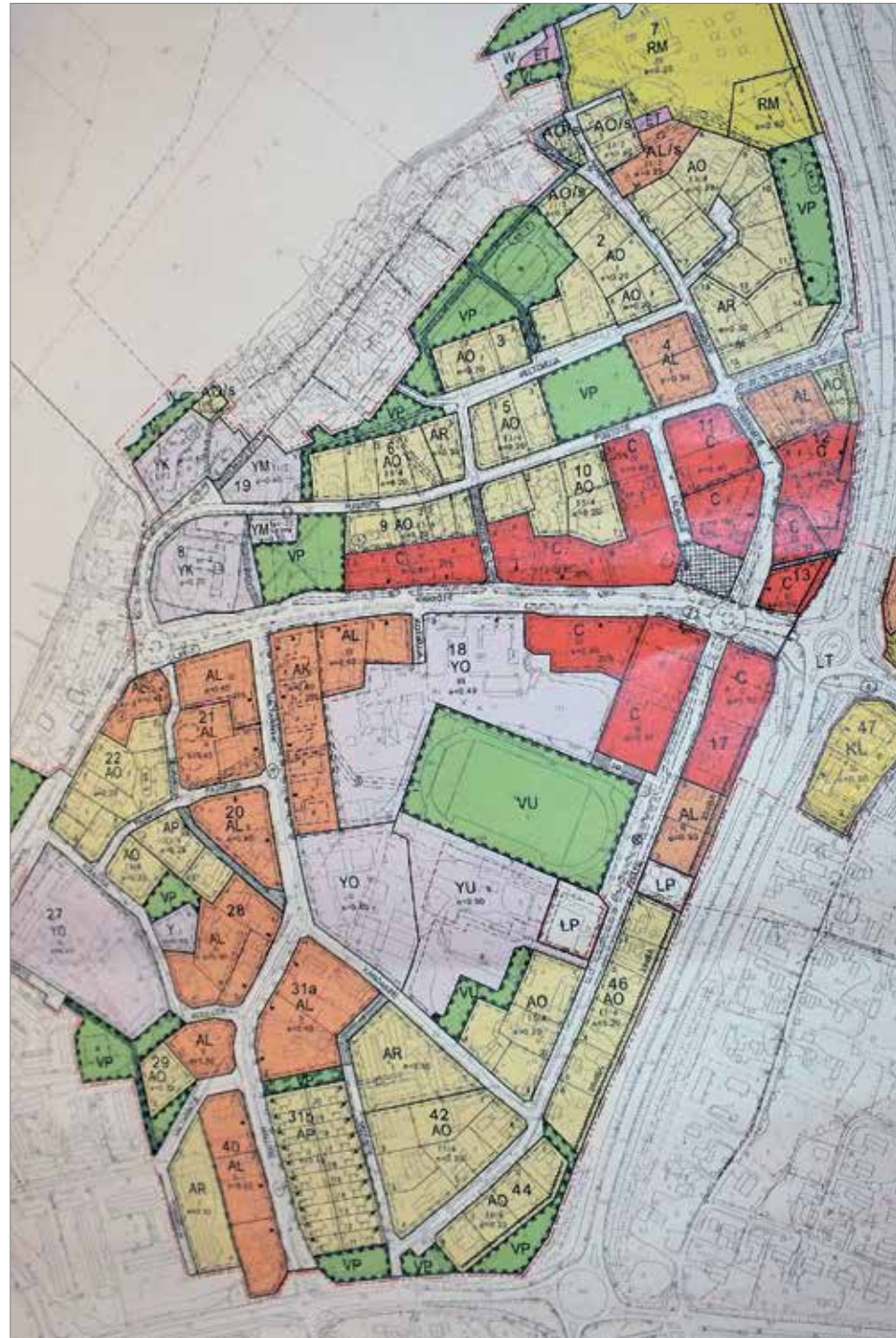
Iin kirkonseudun asemakaavamuutos antaa mahdollisuuksia kehitykselle

Iin kirkonseudun asemakaavan muutos on edennyt kaavaehdotusvaiheeseen. Ehdotus on nähtävillä 12.3. saakka. Kuntalaisilla ja muilla osallisilla on mahdollisuus esittää siihen muistutus, joka on toimitettava Iin kunnanhallitukselle viimeistään 12.3.