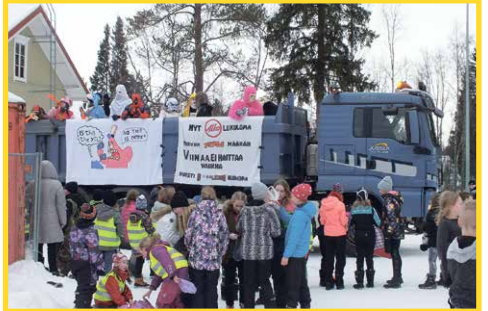
Pohjois-Iin koulullakin abiturientit vierailivat heittämässä karkkeja.