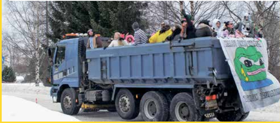
Täältä tullaan elämä.

abiturienttien reitti kiersi keskustan lisäksi myös lähiympäristön alakoulujen kautta. Mukana oli 44 abiturienttia. MTR