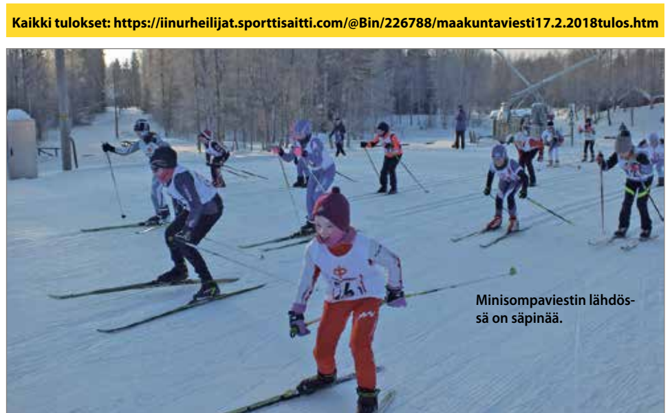
Minisompaviestien lähdössä on säpinää.

Kaikki tulokset: https://iinurheilijat.sporttisaitti.com/@Bin/226788/maakuntaviesti17.2.2018tulos.htm