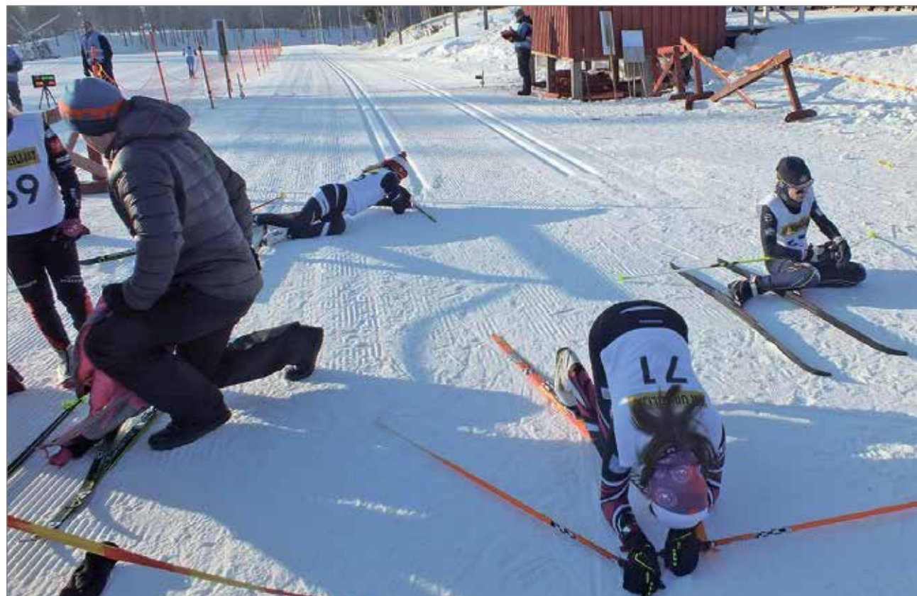
Kaikkensa antaneet hiihtäjät sarjasta T14 maalissa.