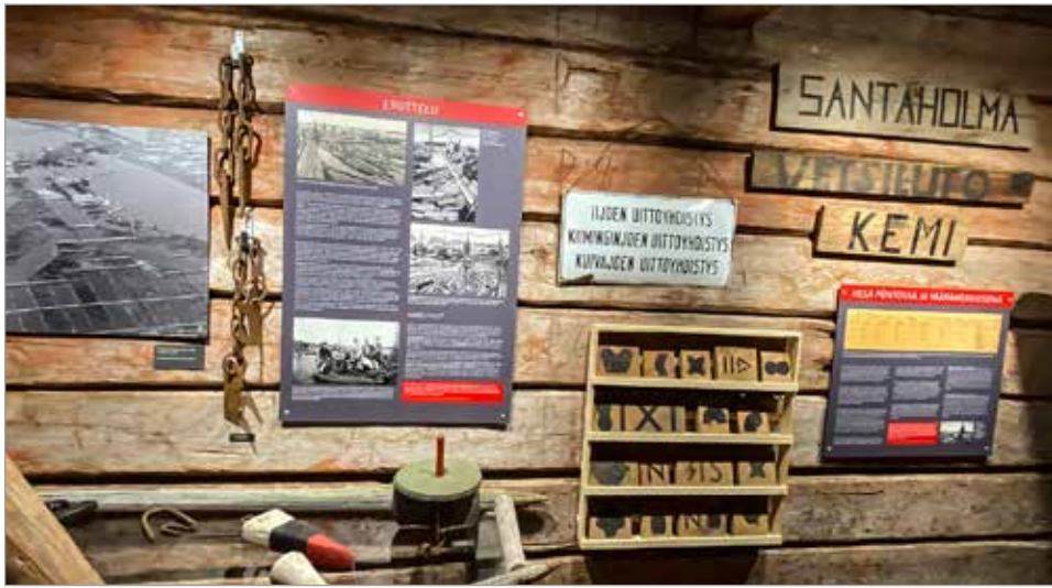
Uittoaitassa on paljon uittoon liittyvää aineistoa, esineitä ja valokuvia.

Virkatodistukset eli sukuselvitykset 24/7 osoitteesta www.tilaavirkatodistus.fi tai Oulun aluekeskusrekisteristä p. 08 3161 303.