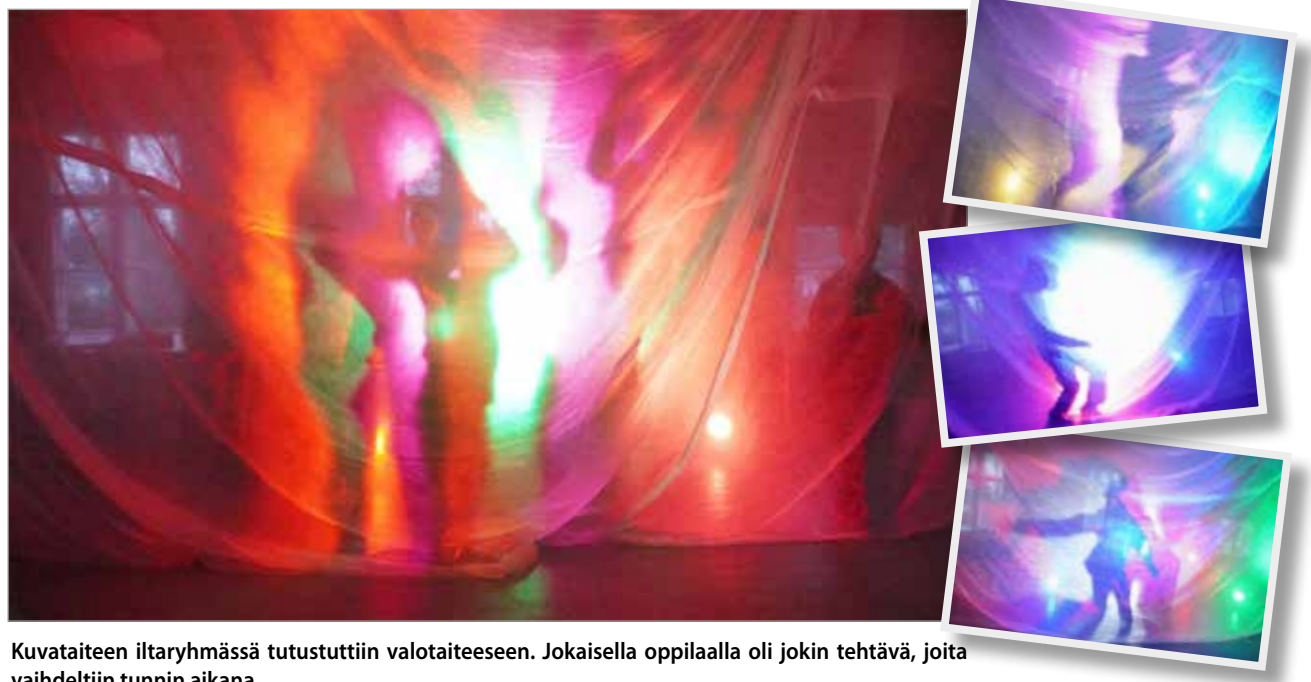
Kuvataiteen iltaryhmässä tutustuttiin valotaiteeseen. Jokaisella oppilaalla oli jokin tehtävä, joita vaihdeltiin tunnin aikana.