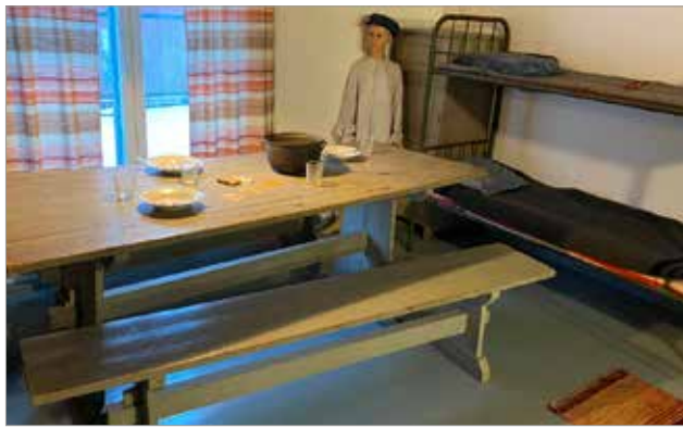
Huilingin yläkerran uittoikämppä

Uittonäyttely oli avoinna myös lauantaina 27.11.2021.