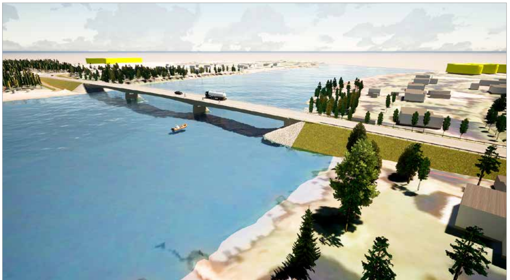
Havainnekuva Yli-Iihin suunnitella olevasta uudesta sillasta, joka ylittää Iijoen Kiimingintien (maantie 849) alussa.

Hankkeen rakennussuunnitelma valmistuu vuoden 2023 lopussa. Hankkeen kustannusarvio on noin 10 miljoonaa euroa. Rakennustöiden tarkkaa ajankohtaa ei ole vielä päätetty.