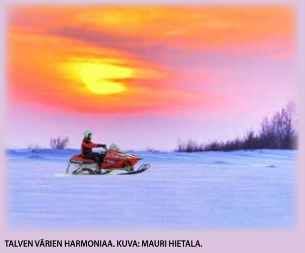
TALVEN VÄRIEN HARMONIAA.

lukijoiden palaute ja jutut: vkkmedia@vkkmedia.fi