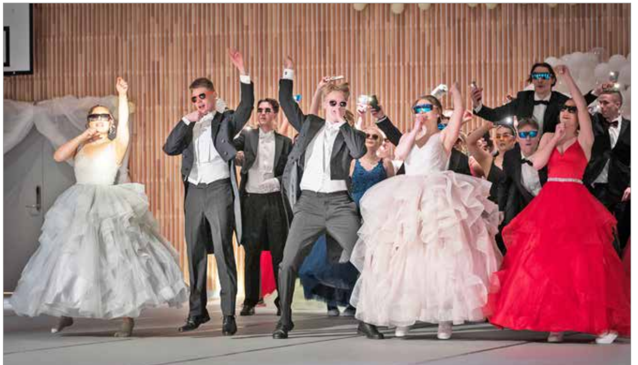
Vanhojen tansseissa ohjelmistossa oli myös vapaamuotoisempi irrottelunumero.