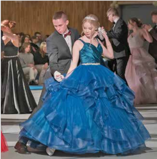
Kuvat yllä ja alla: Eleganttia keinahtelua tanssilattialla.