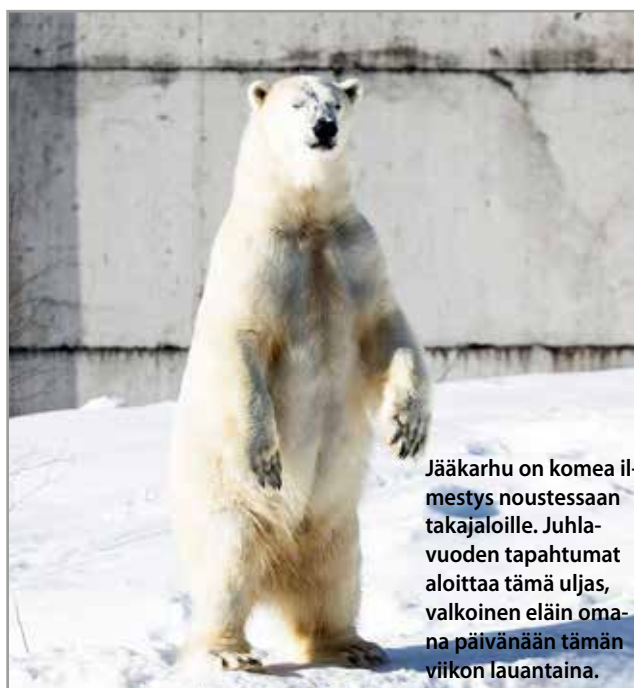
Jääkarhu on komea ilmestys noustessaan takajaloille. Juhlavuoden tapahtumat aloittaa tämä uljas, valkoinen eläin omalla päivänään tämän viikon lauantaina.

-Ranuan eläinpuiston juhlavuosi on merkittävä merkkipäivä yhtiön historiassa. Tällä hetkellä Ranua Resort -nimellä markkinoitava matkailukokonaisuus on ainoa laatuinen niin Suomessa kuin globaalisti. Arktisiin eläinlajeihin erikoistunut eläinpuisto sekä kattavat matkailupalvelut sen ympärillä ovat avoinna vuoden jokaisena päivänä palvelen matkailijoita Suomesta ja ympäri maailman. Nyt vietettävä jääkarhupäivä on juhlavuoden ensimmäinen tapahtuma. Jääkarhut ovat olleet Ranuan eläinpuiston vetonaula vuodesta 1989 alkaen. Jääkarhut ovat erityisen alttiita ilmastonmuutokselle ja niinpä Ranuan eläinpuistolla, osana Euroopan eläintarhajarjestöä EAZAa, on tärkeä rooli tämän upean eläinlajin säilymisessä myös tuleville sukupolville, kertoo Ranuan Seudun Matkailu Oy:n toimitusjohtaja Johanna Koi-vunen. TS