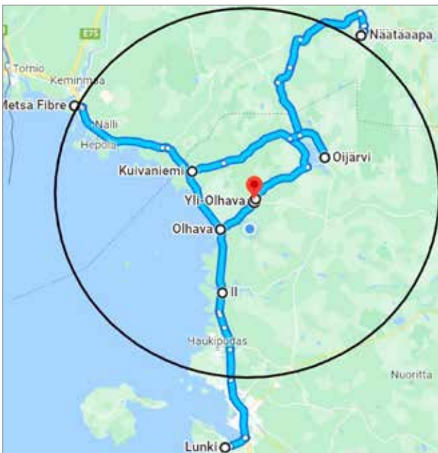
Kuvassa työssäkäyntialue Yli-Olhavassa asuvan näkökulmasta. Esimerkiksi Ylitalon työpaikka on Oulunsalossa. Kuivaniemi-Olhava-Oijärvi -sektorin asukkaiden näkökulmista sekä Kemi että tuleva Ranuan metanolit tehdas ovat normaalilla työssäkäyntialueella.