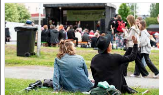
Kulttuuriasioiden keskustelufoorumi edistää lin kulttuuritoimintaa sekä yhdistyksien välistä yhteistyötä. Kuvassa viime kesän järjestetty Nättepop-piknik.