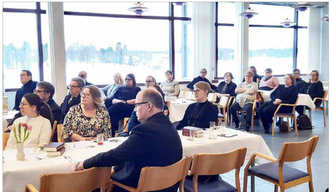
Tilaisuudessa kuultiin katsaus seurakunnan tuleviin näkymiin, jonka jälkeen henkilökunta ja luottamushenkilöt pääsivät tutustumaan toisiinsa.