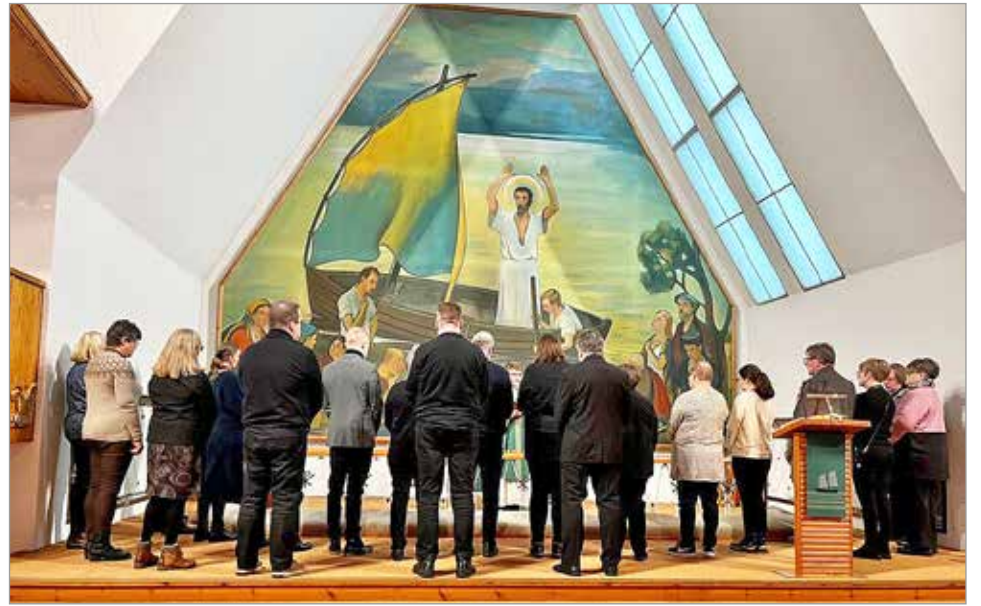
Iin seurakunnan luottamushenkilöt siunattiin tehtäviinsä 12.2. Jumalanpalveluksen yhteydessä.