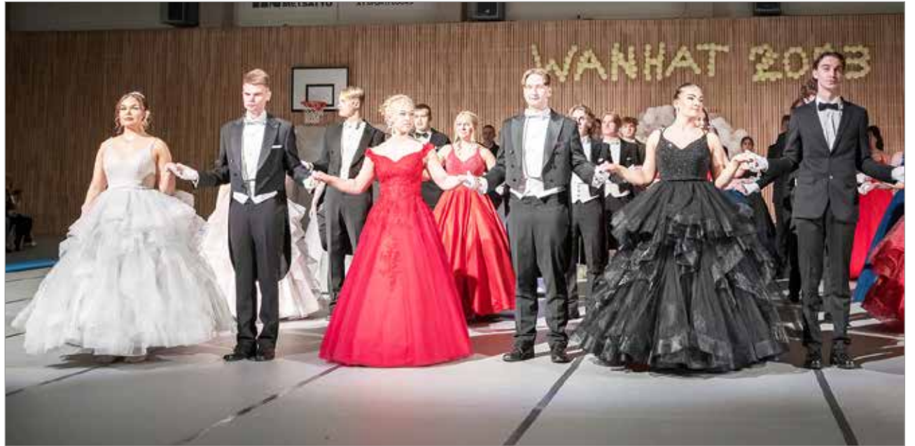
Perjantaina 10.2. Iisi-areenalla uudet lukion vanhimmat ottivat paikkansa näyttävästi.