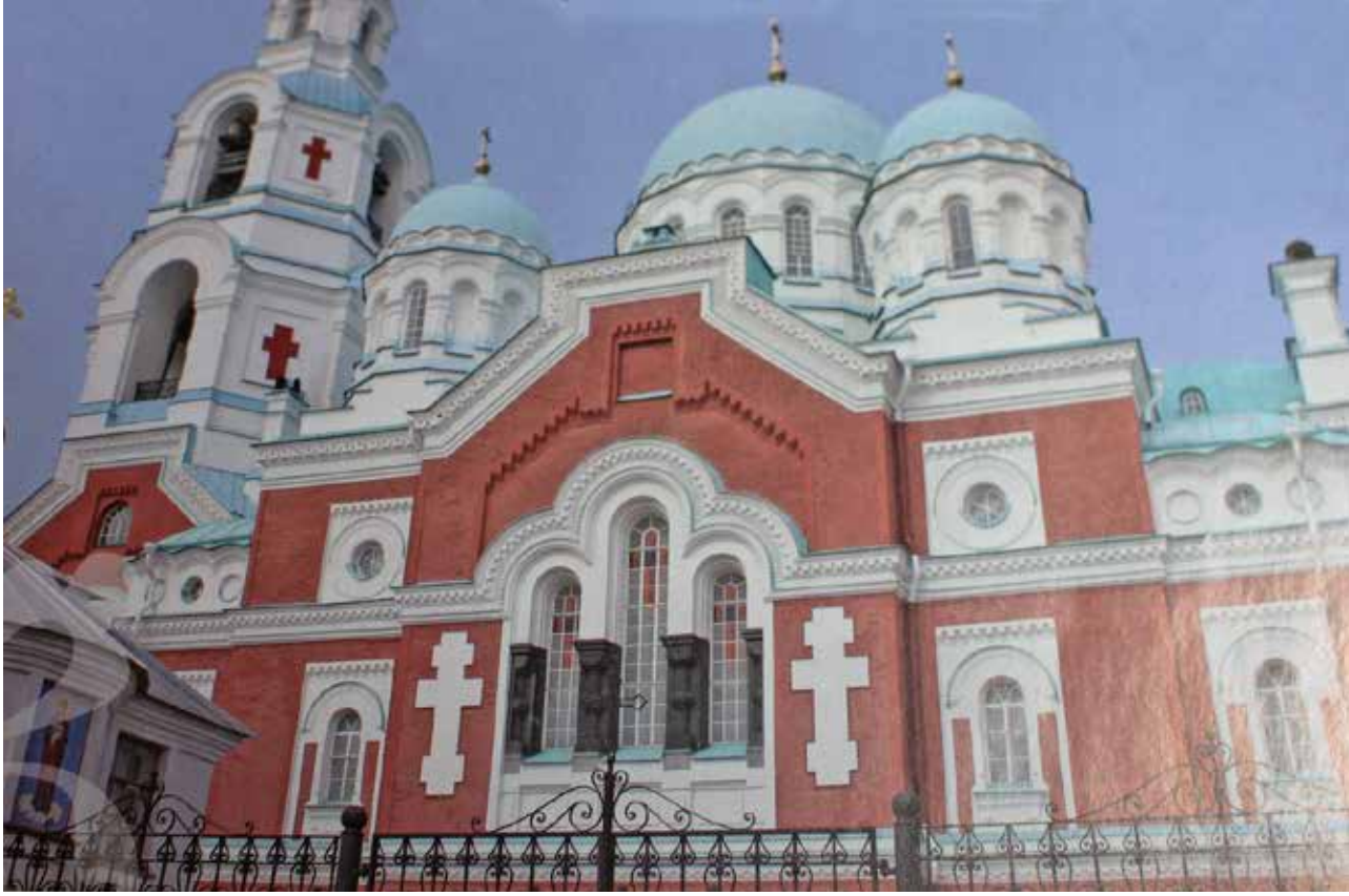
Valamon luostarin todellinen keskipiste on vuosina 1887–1896 rakennettu komea pääkirkko. Yläkirkko on omistettu Kristuksen Kirkastumiselle ja alakirkko pyhittäjisille Sergeille ja Hermanille. Pääkirkon torni kohoaa 70 metrin korkeuteen maanpinnasta, ja suurin kupoli on 42 metriä korkea.