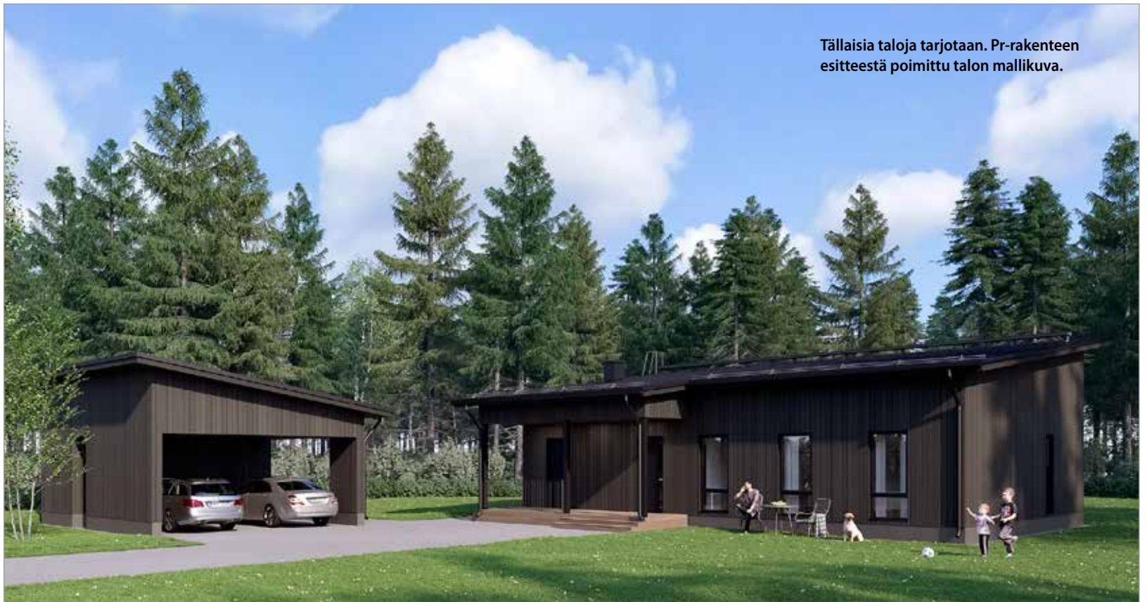
Tällaisia taloja tarjotaan. Pr-rakenteen esitteestä poimittu talon mallikuva.

Jakkukylä on vastannut kysyntään tuomalla myynnissä olevat yksityisten tontit näkyvästi markkinoille jakkukyla.fi/tontteja -sivulla. Jakkukylään on lihitymisen jälkeen, vuoden 2018 alusta valmistunut jo kahdeksan uutta omakotitaloa, kun nyt rakenteilla olevat talot ovat valmiina. MH