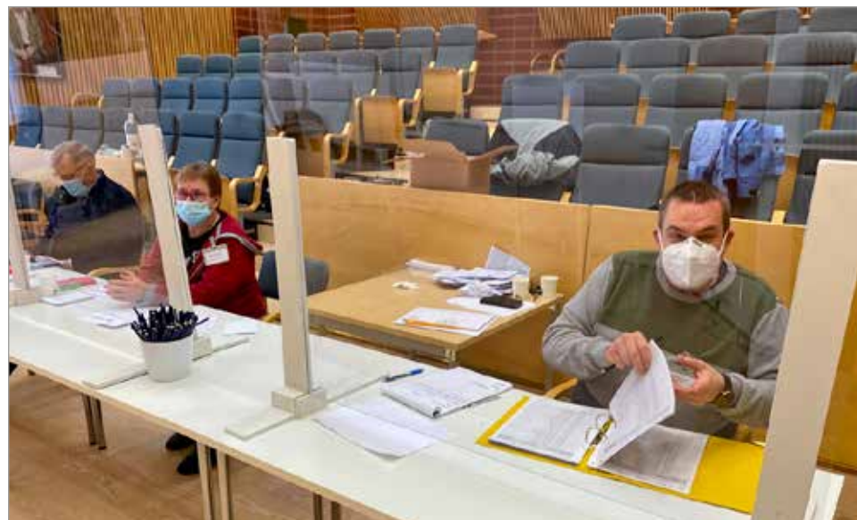
Vaalivirkailijat odottavat äänestäjiä.