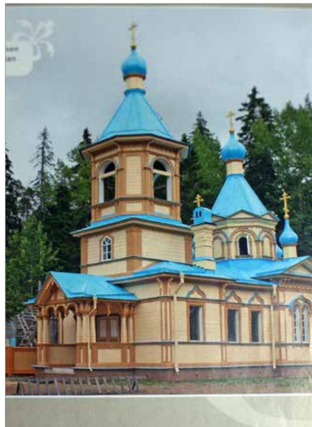
Neitsyt Marian kuolonuneen nukkumisen muistolle omistettu Getsemanen skiitan kirkko.