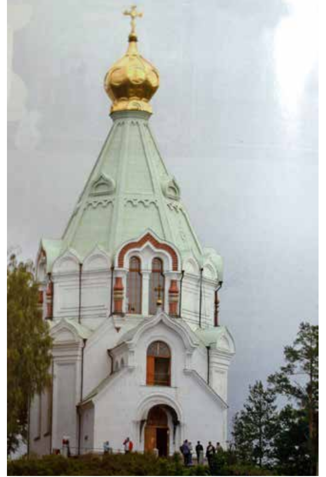
Luostarinlahden suulla olevalla Ristisaarella kimaltelee Pyhän Nikolaoksen skiitan kullattu kupoli. Majakkanakin toiminut kirkko pyhitettiin aikoinaan Pyhälle Nikolaokselle, joka oli mm. merenkulkijain suojelija.

Ensimmäinen maailmansota katkaisi luostarin yhteydet Venäjän ortodoksisen