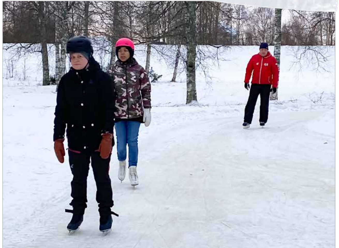
Radalla oli sunnuntaina useita luistelijoina, myös paljon lapsiperheitä.