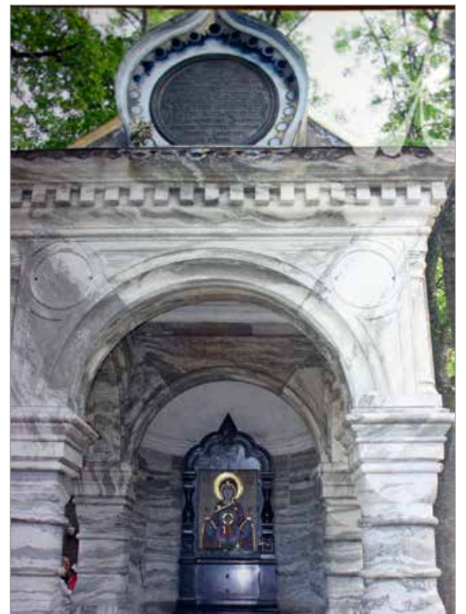
Znamenie- eli ennusmerkki-ikonille rakennettu kappeli rakennettiin Aleksanteri II:n Valamon vierailun kunniaksi vuonna 1858.