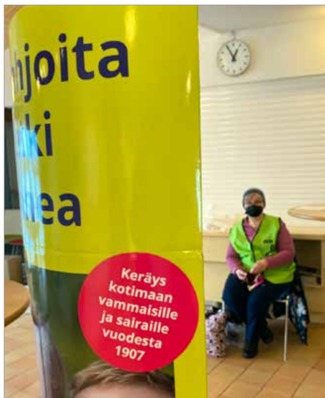
Vaalikeräys vammaisille lin Nätteporissa.