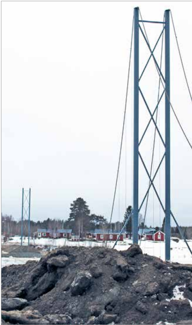
Jakun koulun kohdalla lijoen ylittävän riippusillan pylonit kohoavat 20 metrin korkeuteen.

mikuun alussa. Sillan kantaa kannattavat vaijerit tukeutuvat pyloneihin. Sillan kokonaispituudeksi tulee lähes 250 metriä, jännevälillä ollessa 180 metriä. MTR