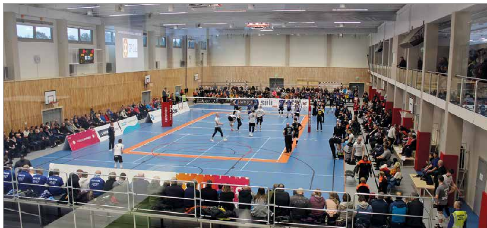
Iisi-areenalle saapui reilut 400 katsojaa seuraamaan lentopalloa Suomen huipulta.