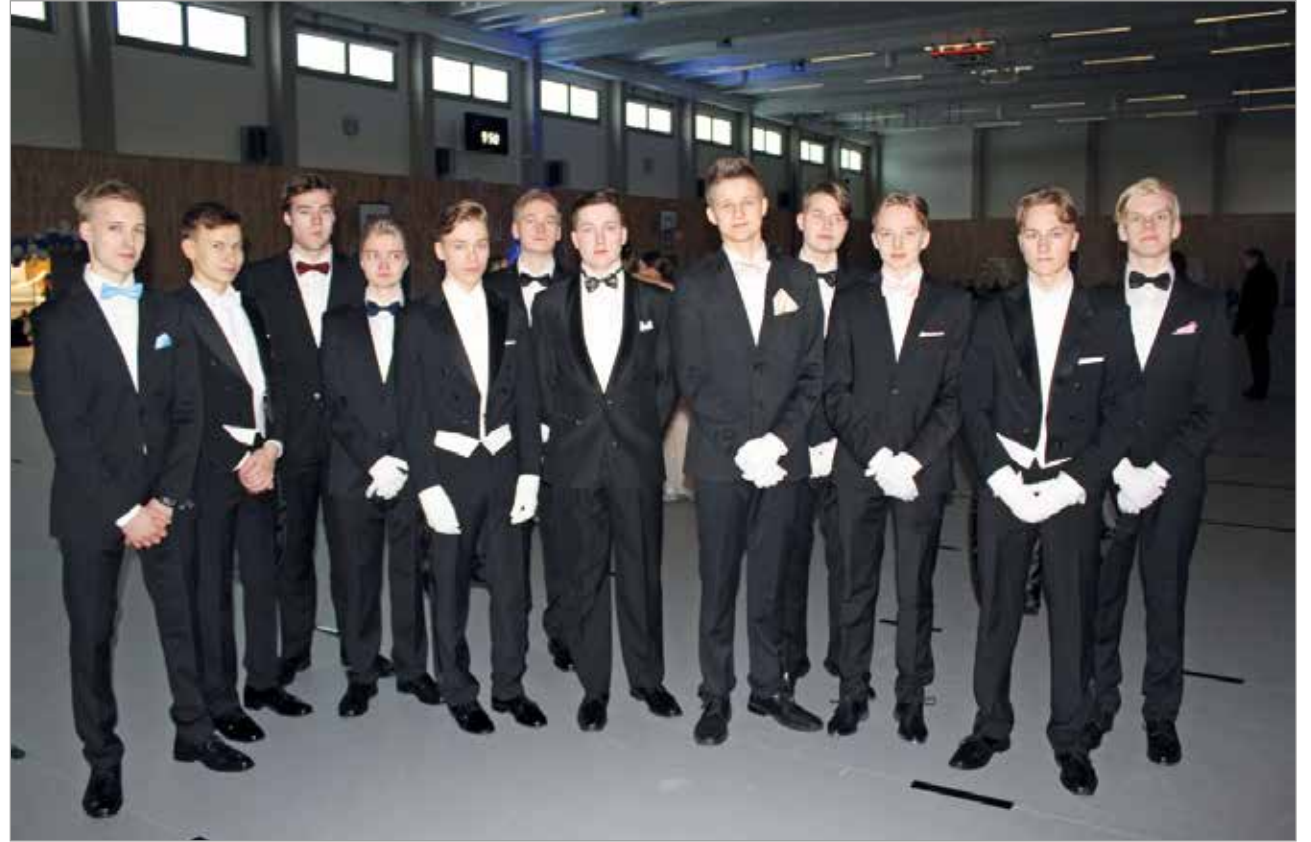
Tyylikkää herrat odottavat daamejaan.

Perinteisiä Iin lukion vanhojen tansseja tanssittiin tällä kertaa Iisi-areenalla perjantaina. Vanhojenpäivä on lukion toiseksi viimeisen vuoden opiskelijoiden viettämä juhlapäivä, jonka tunnusmaisimpina piirteinä