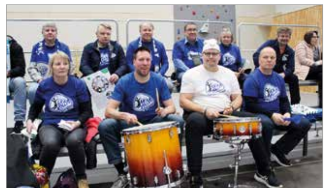
Akaa Fun Club kannusti omiaan läpi ottelun rumpujen ja torvien voimalla.