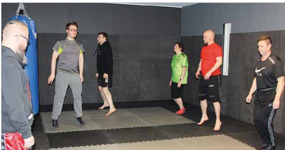
Krav Maga tunnin aluksi verryteltiin. Itsepuolustus kiinnostaa monia.