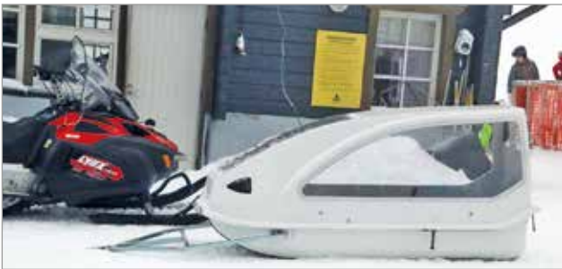
Uusinta uutta ovat nykyaikaiset ensiapuahkiot, joilla voidaan tarvittaessa siirtää ensiapua tarvitseva potilas nopeasti ja turvallisesti saamaan hoitoa.