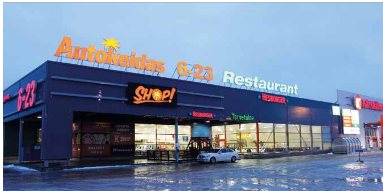
Iin Autokeidas on valittu Tilausajokuljettajien vuoden 2019 taukopaikaksi.