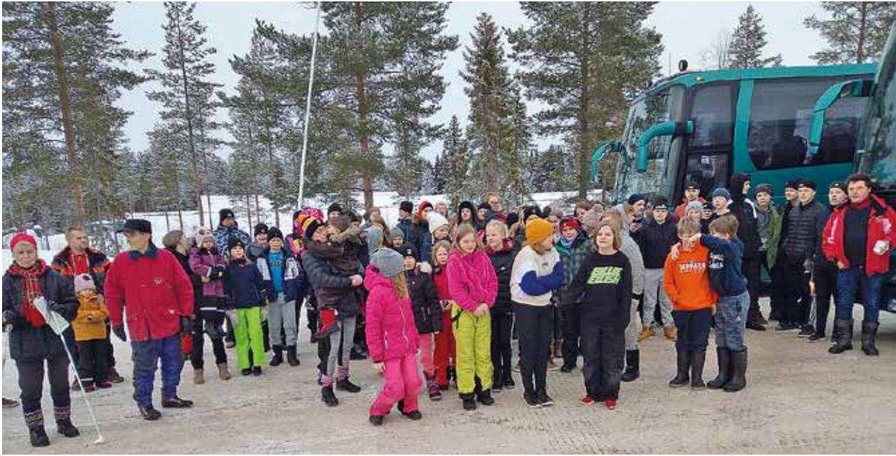
Lasketteluretkelle Syötteelle osallistui 74 henkeä. Matkaa tehtiin kahdella Hekkasen bussilla.