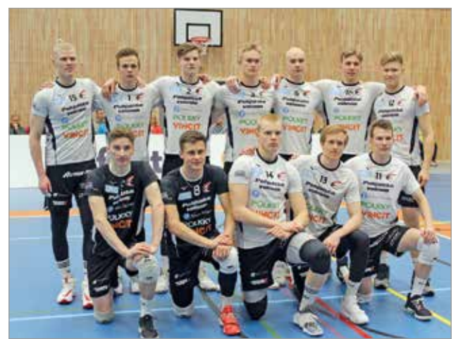
Oululainen lentopalloseura ETTA valmiina lentopalloliigan otteluun Akaa-Volleyta vastaan.

Iisi-areena osoittautui kaikin puolin toimivaksi paikaksi järjestää otteluita tai muita tapahtumia näinkin isolle katsojamäärälle. Lisäkatsomoiden ansiosta areenalle saadaan hyvät tilat jopa yli viidellesadalle katsojalle. MTR