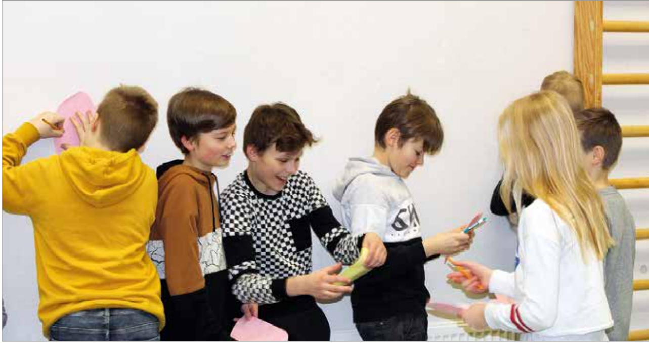
Ystäväpäiväkortteja on kiva antaa ja saada.