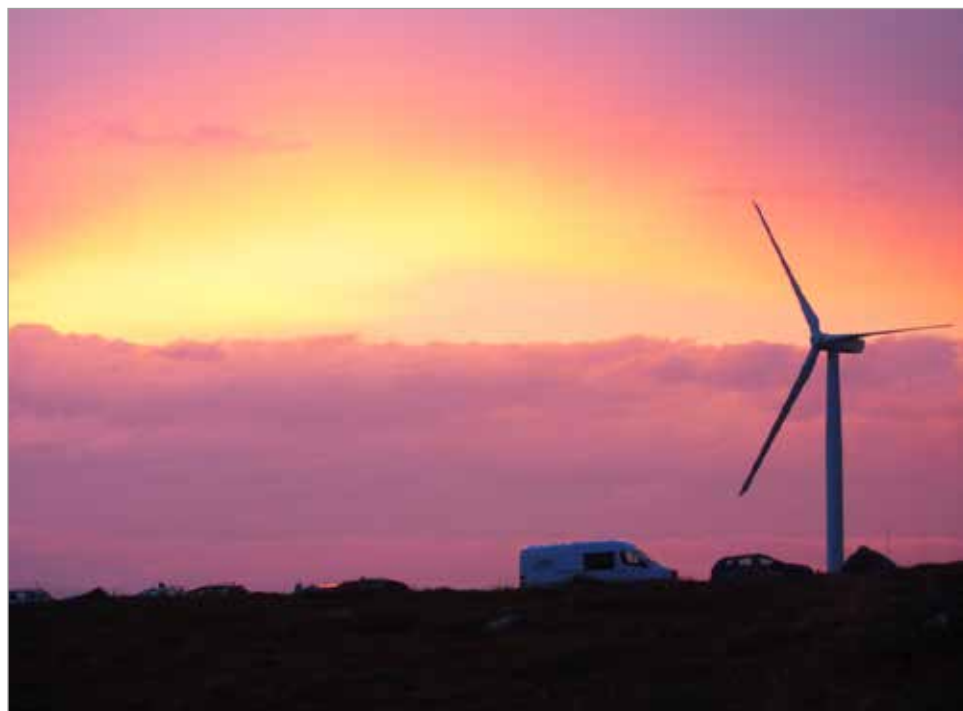
Palkitun yrityksen tuulivoimaloiden asennus- ja huoltotöissä laatu ja turvallisuus kulkevat käsikädessä.