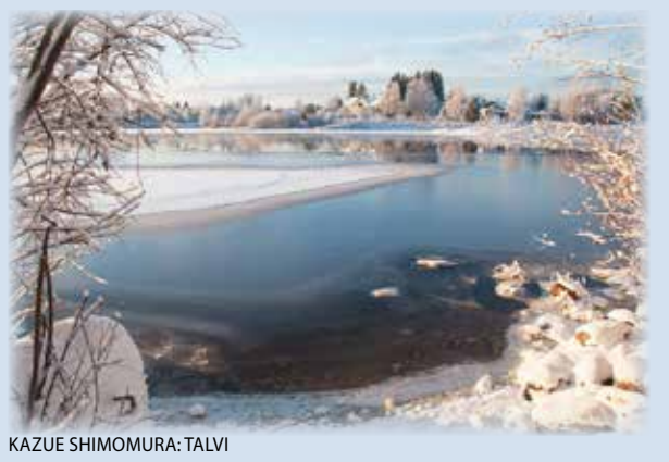
KAZUE SHIMOMURA: TALVI

lukijoiden palaute ja jutut: vkkmedia.fi