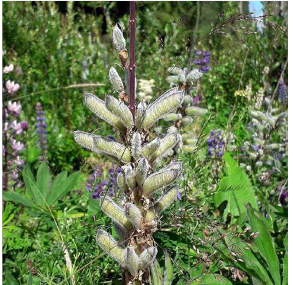
Komealupiinin siemenet leviävät helposti ympäristöönsä ja luontoon.