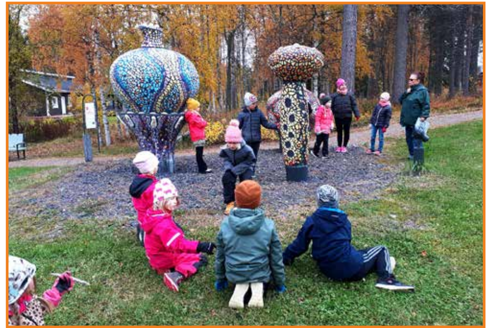
Ojakylän koulun oppilaat toimivat oppaina Lähde! -puiston taidepolulla.