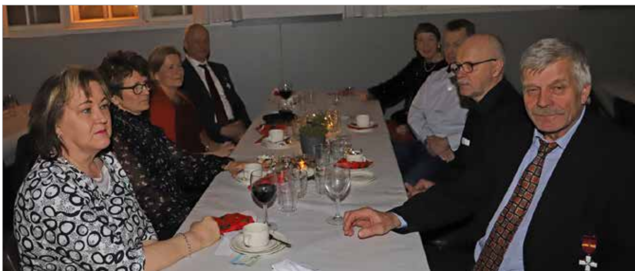
Yrittäjien pikkujouluun osallistui 57 yrittäjää ja puolisoa.