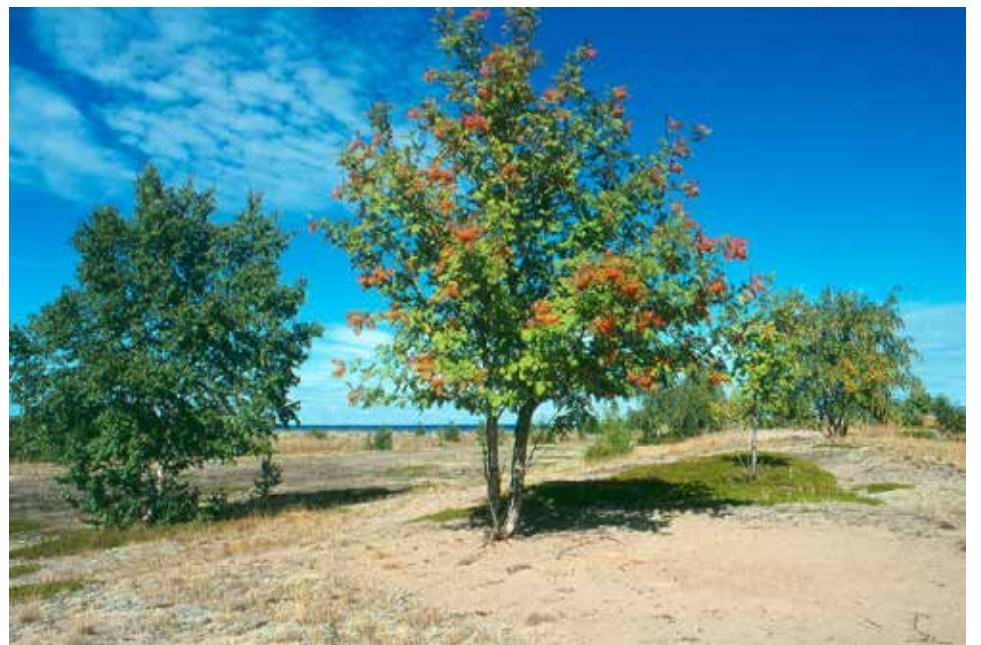
Maakrunnin pohjois-itäsuunnan hiekkadyynejä

kunnan valitukseen antoi lupalta maatalousministeriö 10.8.1960. Maatalousministeriö päätti, ettei ole esitetty syytä lääninhallituksen päätöksen muuttamiseen, päätös "siis jää pysyväksi".