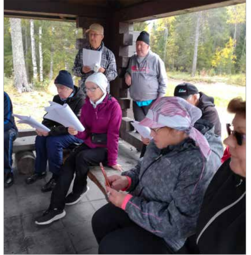
Ulkoilupäivien aikana on liikunnan ohella myös muuta ohjelmaa, kuten lissäsaaren ulkoilutapahtumassa kuluvaan syksyn aikana.