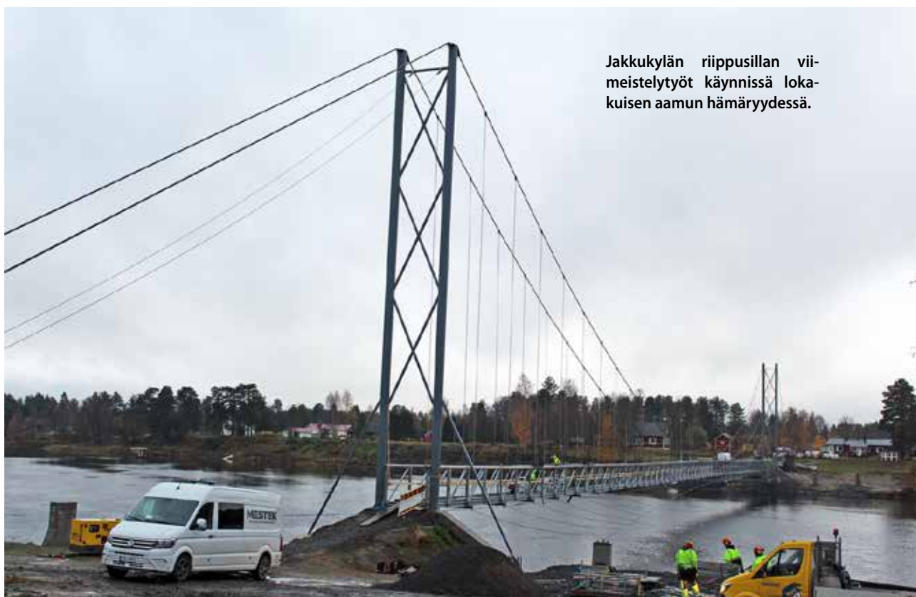
Jakkukylän riippusillan viimeistelytöitä käynnissä lokuisen aamun hämärtyessä.

konaispituus on noin 250 metriä, jännevälillä 180 metriä. Kunta on myöntänyt sillan rakentamiseen useissa eri vaiheissa yhteensä 1,2 miljoonaa euroa, johon valtiolta on saatu avustusta noin 400 000 euroa. Kyläyhdistys on kerännyt siltahankkeeseen 50 000 euroa. Sillan uskotaan olevan valmis ja käytettävissä tämän vuoden aikana. Suurimmat hyötyjät sillasta ovat koululaiset ja kunnassa lasketaan koulukyydytyksissä syntyvän säästöä reilut 80 000 euroa vuodessa. MTR