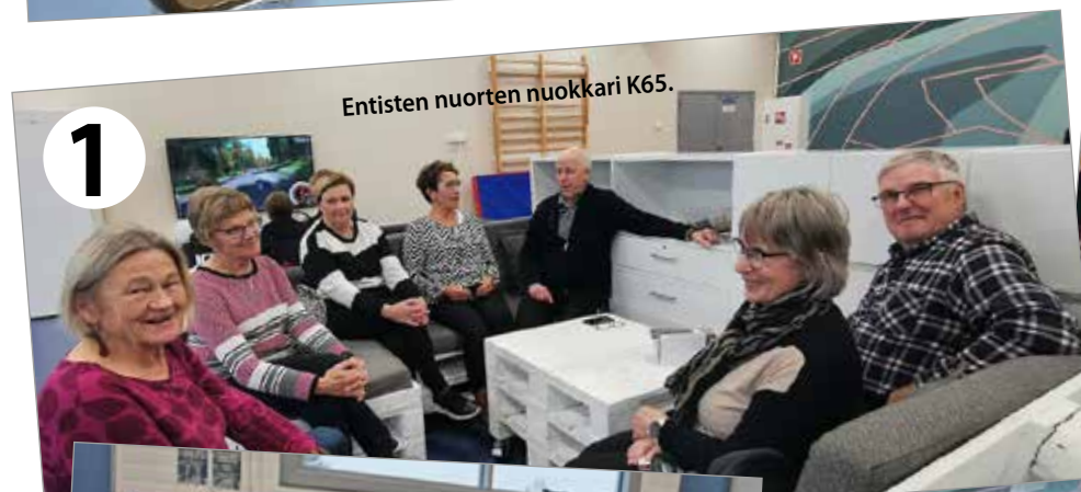
Entisten nuorten nuokkari K65.