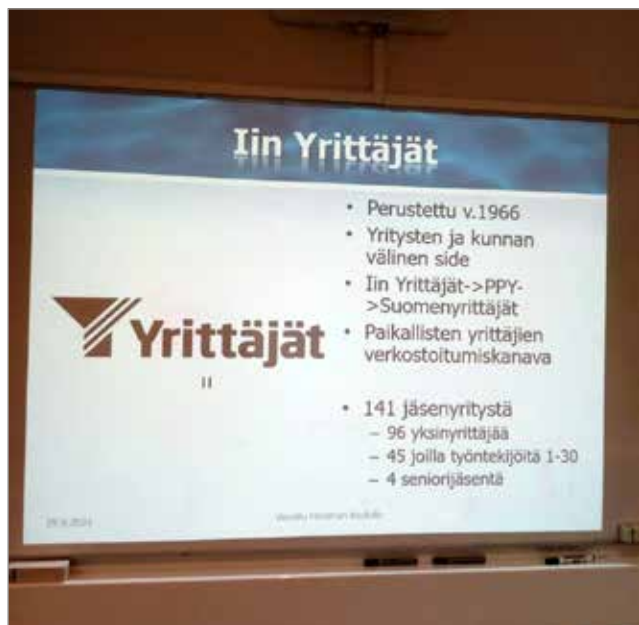
Iin Yrittäjistä ajankohtaista.