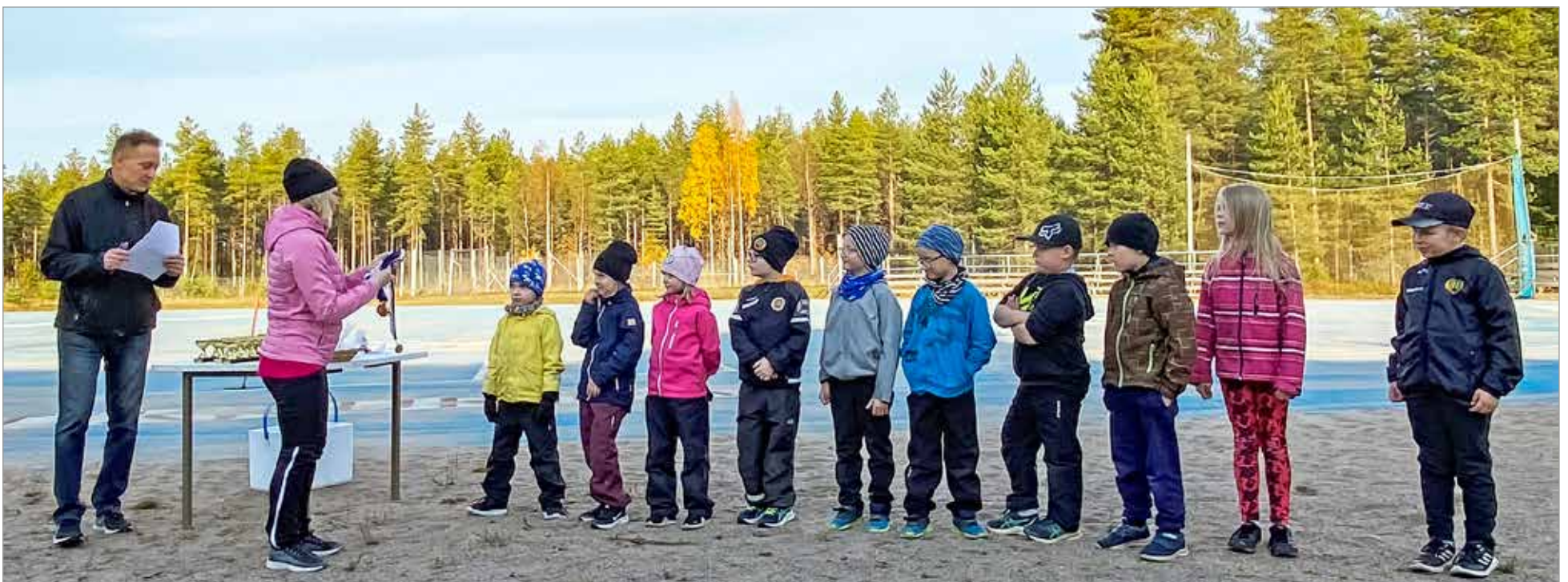
Pesäpalloliitto lahjoitti pienille G- ja F-junioreille mitalit kuluneesta kaudesta. Kuvassa osa G-junioreiden pelaajista. Turnauksina pelattavaan G-junioreiden sarjaan on parhaimmillaan saatu mukaan kaksi joukkuetta ja G-ikäisiä pelaajia on vuoden aikana mukana toiminnassa ollut yhteensä 20.