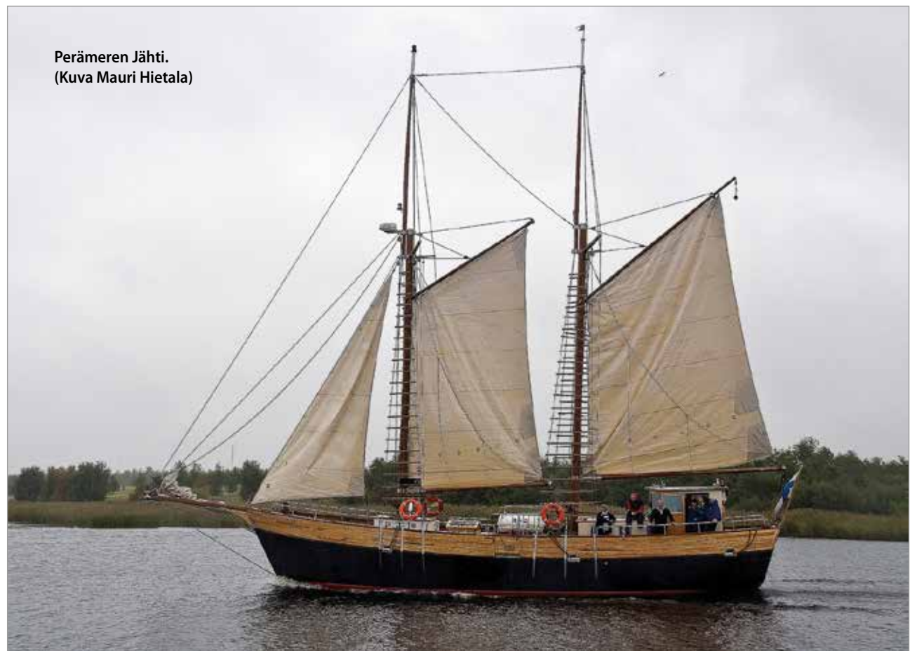
Perämeren Jähti.

Leo Tervosen haaveena oli pitkään rakentaa maalais-