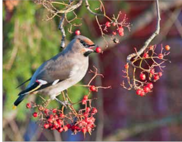
Tilhi syömässä pihlajanmarjoja.

sia pihlajanmarjahillokkeita ja hyytelöitä ja juodaan mehua, joissa happaman pihlajanmarjan lisänä on jokin makeampi marja tai hedelmä, esimerkiksi omena. MH