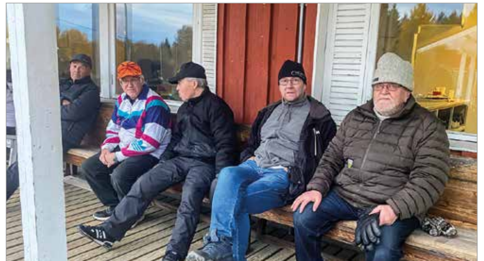
Katsomoyleisössä tuttuja kasvoja.