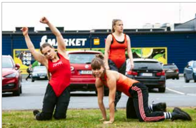
Ryhmä esiintyi myös kauppojen pihalla ja Ympäristötaidepuistossa.

Keväällä 2021 Lontoossa perustettu kollektiivi koostuu seitsemästä autonomisesta tanssitaiteilijasta eri puolilta Eurooppaa. Kollektiivin Iissä aloittaman projektin lähtökohtana on taitelijoiden mukaan kokea ja luoda vuorovaikutusta paikallisen ympäristön ja yhteisöjen kanssa. Projektia tullaan työstämään Iin lisäksi Maksniemessä sekä Oulunkummussa. MH