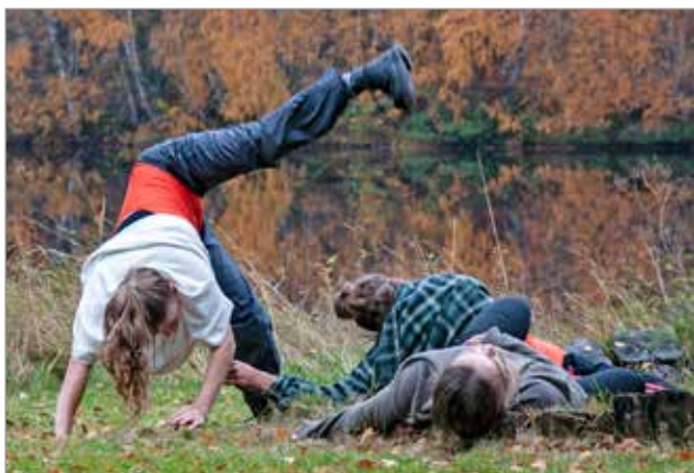
Joku paikallinen esiintymässä Ympäristötaidepuistossa.

Lada, Lada, Lada -autojen kaikkia varaosia Kuopiossa.