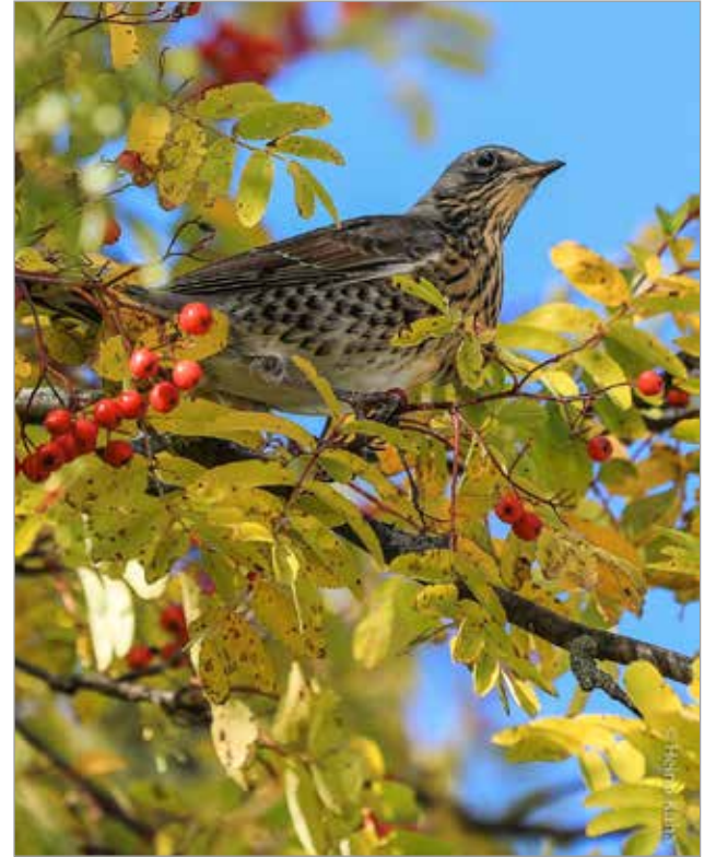
Kovasti runsastuneet räkättirastaat käyvät pihlajien kimppuun ensimmäisenä.