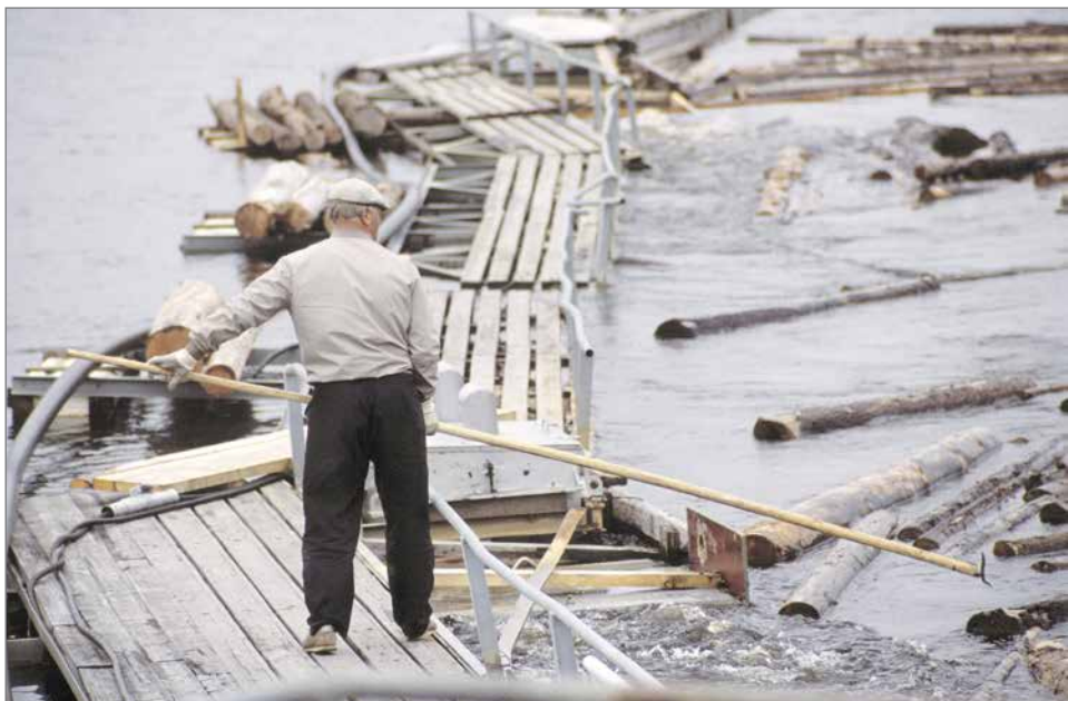
Uittomies syöttämässä puita uittoränniin Raasakan voimalaitoksen yläpuolella.