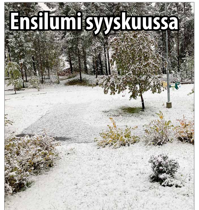
Ensilumi satoi Pohjois-Pohjanmaalle 14. syyskuuta.