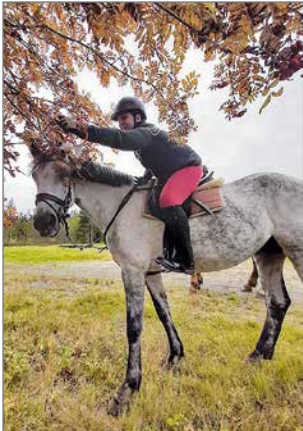
Ketunhännä löytyi pihlajasta.