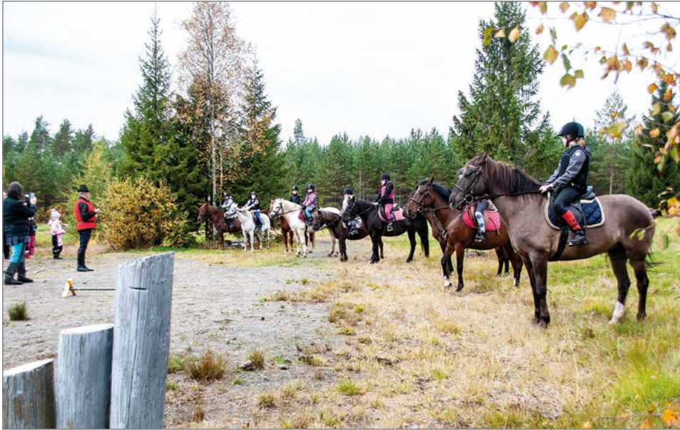
Nuorten ryhmän osallistujia.

Sen lisäksi kisasivat kaksi muuta ryhmää, lasten ja nuorten ryhmä sekä aikuisten ryhmä. MH