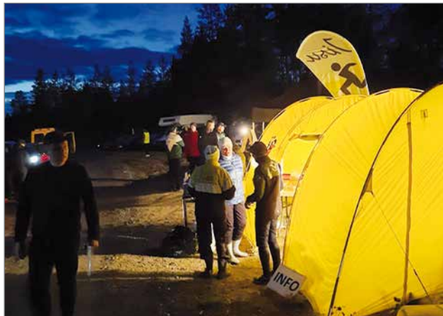
Yösuunnistuksissa on oma lumoava tunnelmansa. (Kuva Risto Luovonpää).

H21A 7,5km (Lähti: 15, Keskeytti: 0, Hylätty: 2) 1. Lammi Alekski RasKu 46:54, 2. Kuusikko Miska Pohjant 50:22 +03:28, 3. Kosola Ville Pohjant 54:18 +07:24, 4. Karppinen Timo Pohjant 54:29 +07:35, 5. Rahko Sampu Pohjant 56:16 +09:22, 6. Vapa Marko OH 56:19 +09:25, 7. Nissi Markus 57:50 +10:56, 8. Hyypä Jarmo Pohjant 1:00:48 +13:54, 9. Koirikivi Riku Pohjant 1:01:21 +14:27, 10. Niemelä Hannu Pohjant 1:03:25 +16:31, 11. Horula Miikka Pohjant 1:04:55 +18:01, 12. Taulavuori Arttu Alati Pi 1:07:06 +20:12, 13. Säkkinen Mika 1:13:55 +27:01, Similä Severi Pohjant hyl. Tornberg Juho hyl. D21 4,5km (Lähti: 5, Keskeytti: 0, Hylätty: 0) 1. Laatikainen