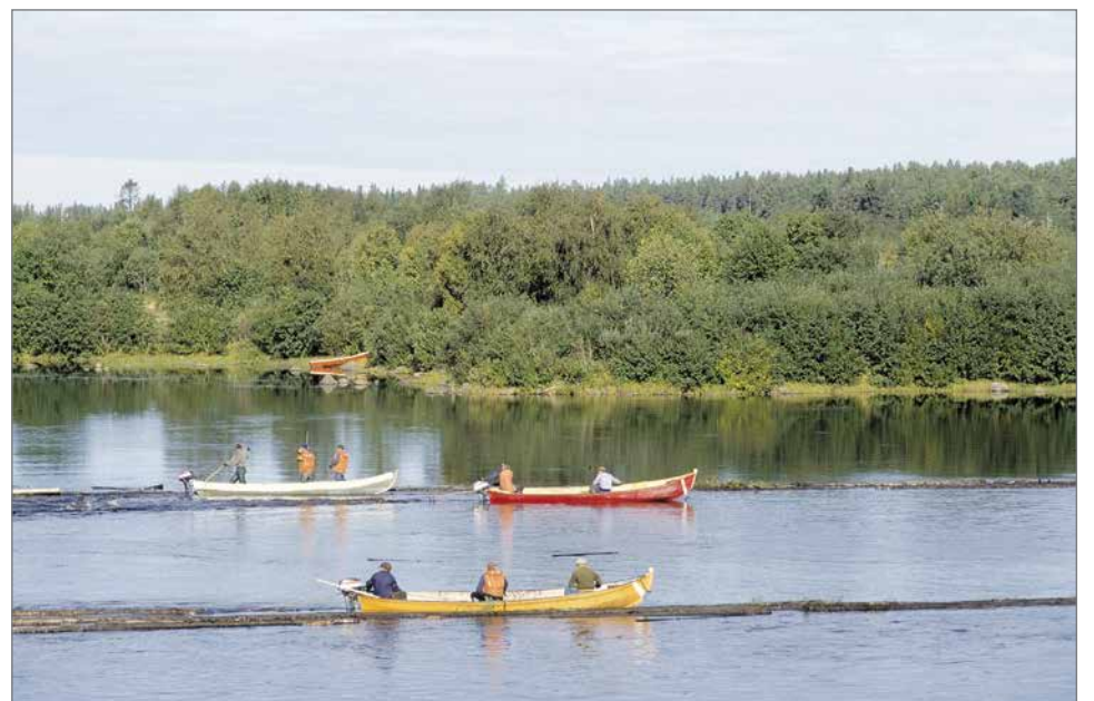
Ijoen uitto loppui vuonna 1988, jolta vuodelta hännänajoa kunnantöimiston kohdalla.