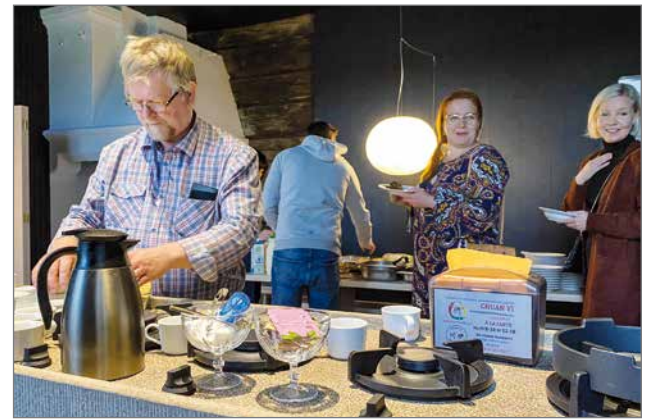
Ravintola Chuan Yin loihdima aamiaistarjoilu oli rakennuksen alakerrassa.