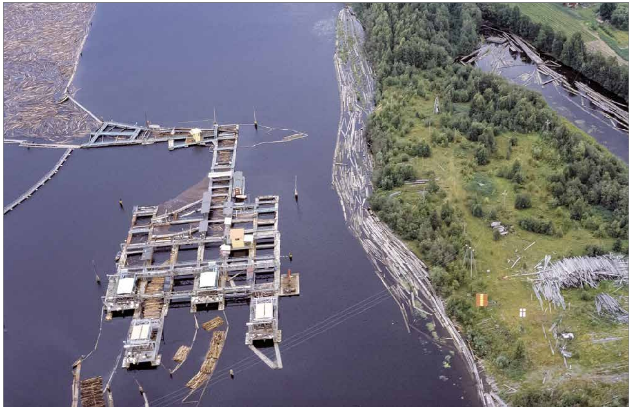
Erottelulaitteisto Simakan saaren kohdalla. Kuvattu lentokoneesta.

Erottelutyömaa oli suuri työllistäjä, 1960- ja 1970-lu-