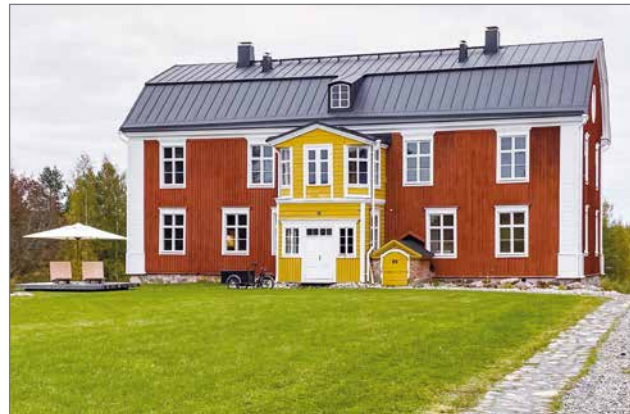
Vuonna 1796 rakennettu Akolan kartanon päärakennus.

sisätilat suhteellisen moderneiksi. Mutta osa sisätilojen vanhaa, kuten yläkerran alkuperäiset seinämaalaukset ja rosoiset tapetit on säilytetty. MH