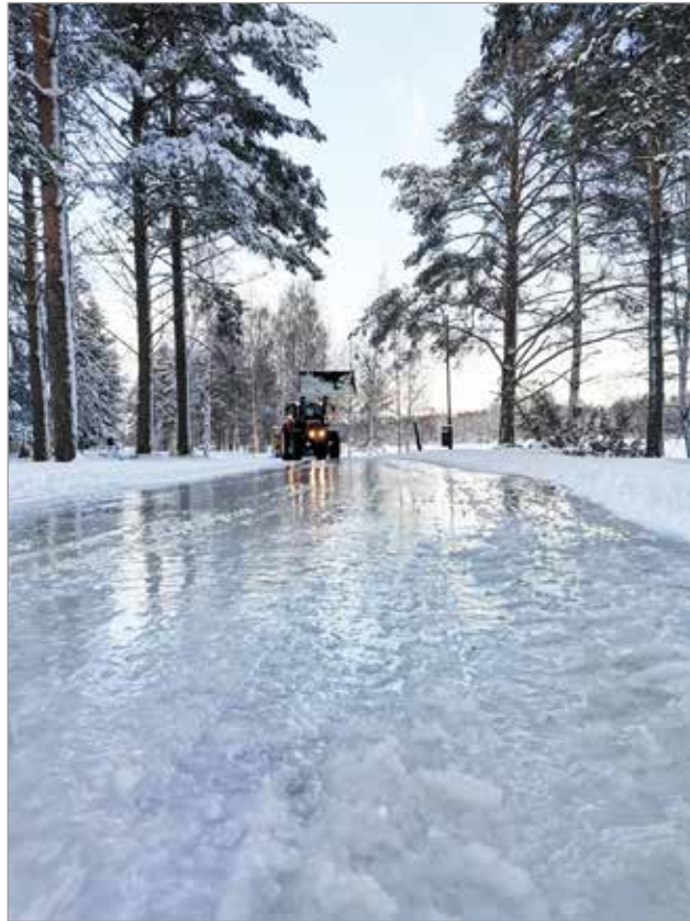
Taideluistelupolun viereen tehdään polku myös kävelijöille.