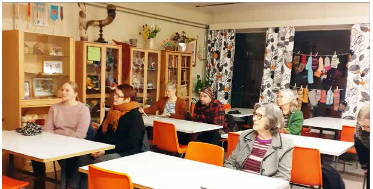
Paikalla olleet kuulijat olivat kiinnostuneita ystävätoiminnan aloittamisesta lissä.

Lisätietoa saa sähköpos- titse sprin.osasto@gmail.