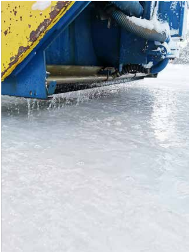
Helmikuun alussa taideluisteluradalla oli kova jäädytystyö käyn- nissä. Seuraavana työvaiheena on radan höyläys.

senssin omistaville kilpaur- heilijoille. Iissä on useita kansainvälisesti menestynei- tä koirahiihdossa kilpailevia ja kunta haluaa päätöksel- lään tukea lajiharjoittelua. JK