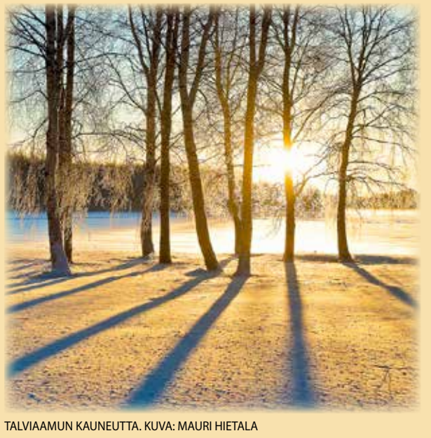
TALVIAAMUN KAUNEUTTA.

lukijoiden palaute ja jutut: vkkmedia@vkkmedia.fi