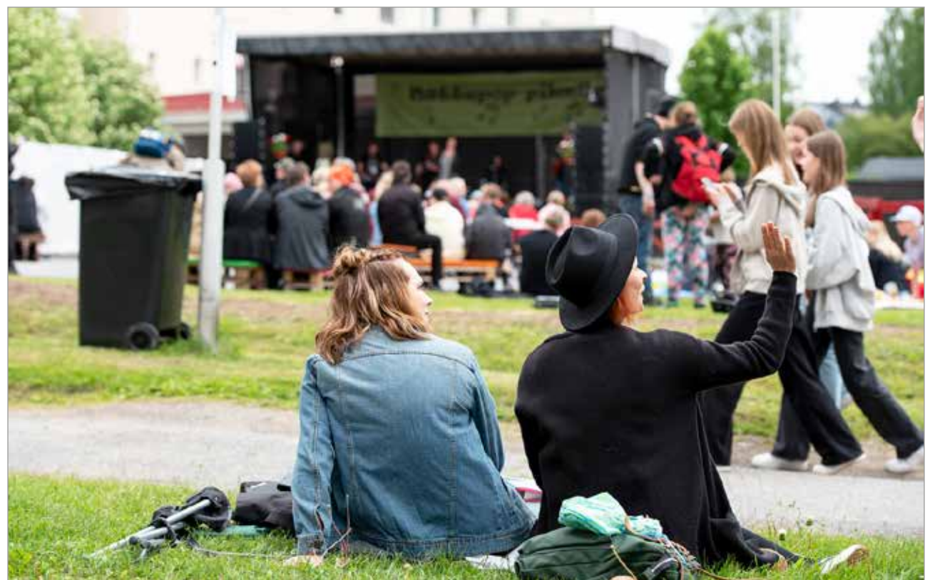
Kulttuuriasioiden keskustelufoorumi edistää Iin kulttuuritoimintaa sekä yhdistyksen välistä yhteistyötä. Kuvassa viime kesänä järjestetty Nätepop-piknik.