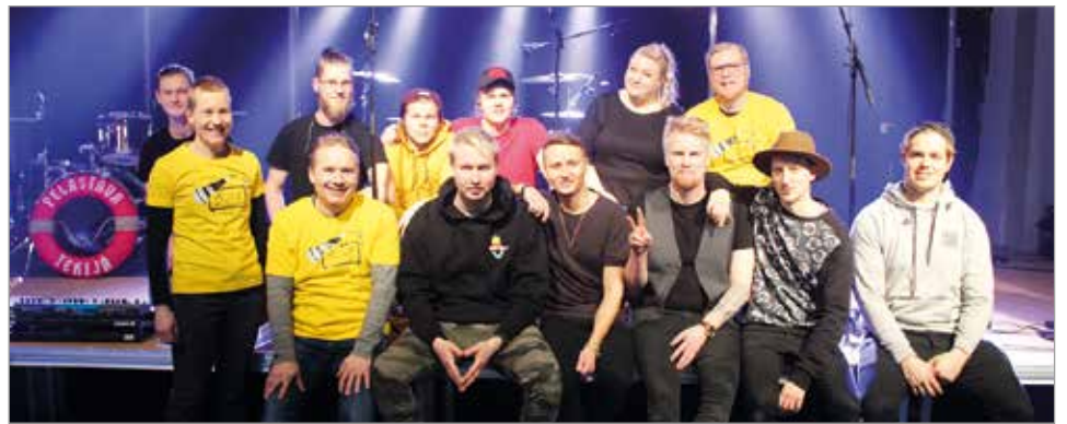
Illan esiintyjät ja järjestäjät yhteiskuvassa ennen kolmannen IiGospelin alkamista.