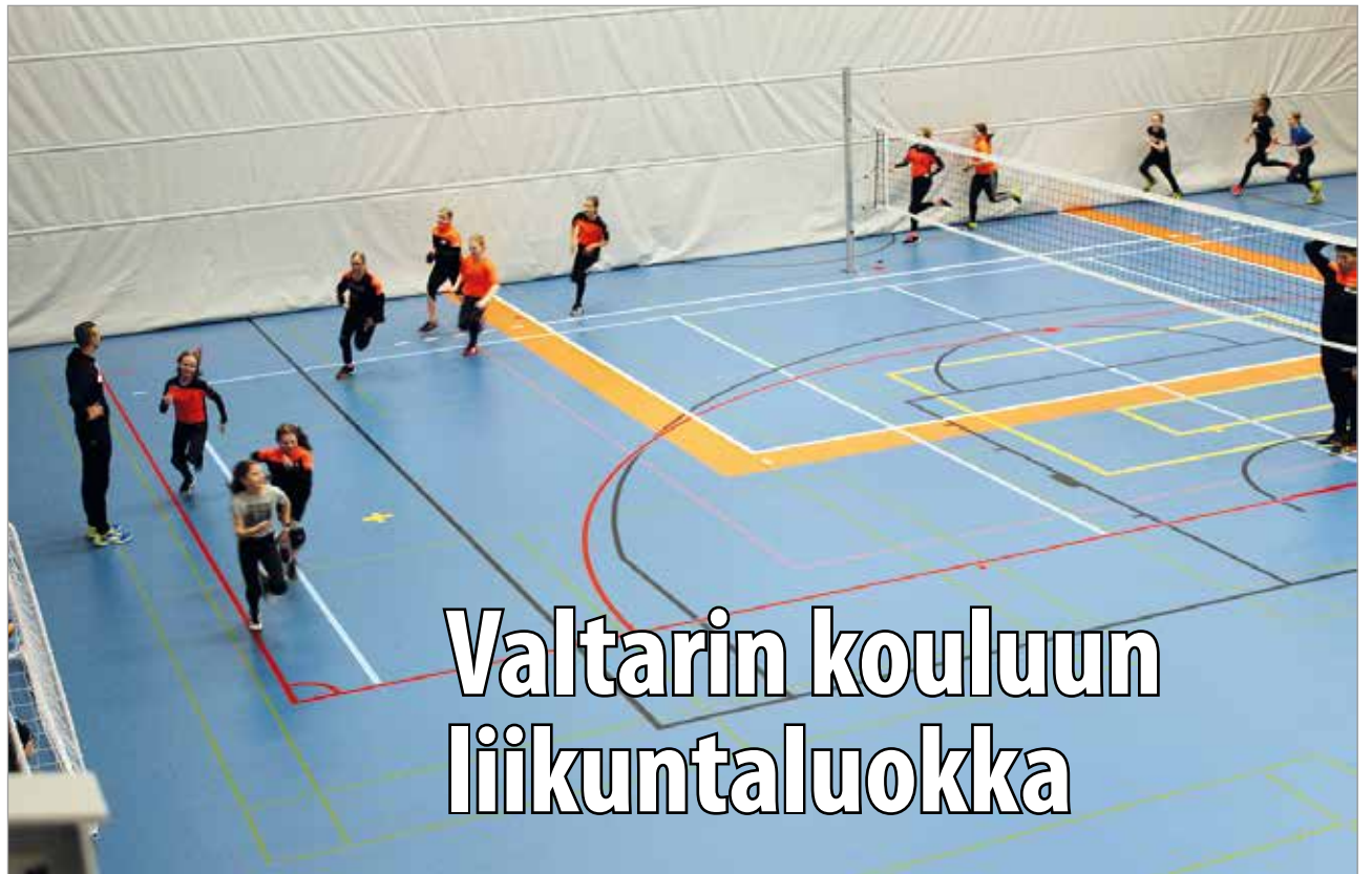
lin liikuntakeskus mahdollistaa liikuntaluokkalaisille monipuoliset mahdollisuudet kehittää liikunnallisia taitojaan. Liikuntaluokka aloittaa syksyllä 2020.