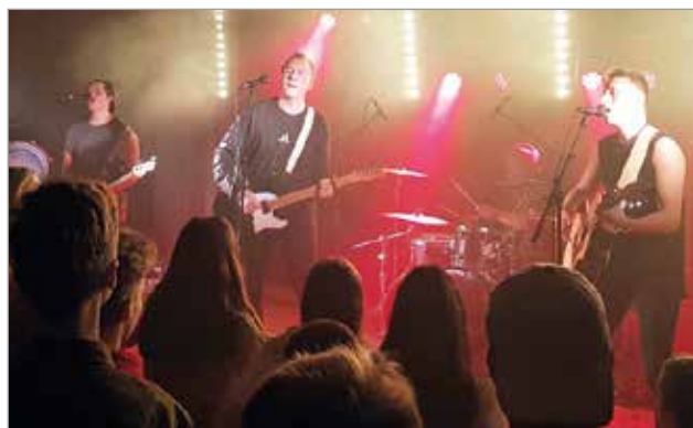
Park7 on kansainvälisesti tunnettu gospelbändi.