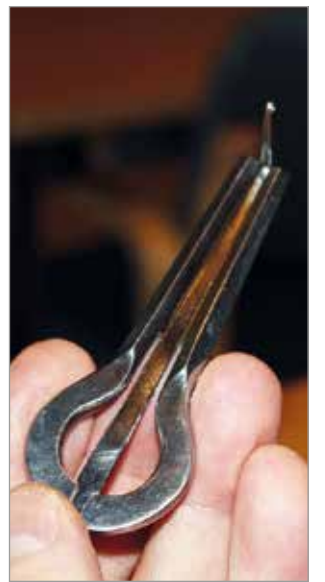
Munniharppu on Töhtyriässä kansallissoittimen asemassa.

Mitä jos muuttaisimme vuodeksi Siperiaan, taloon ilman juoksevaa vettä ja huussi löytyy pihan perältä, kysyi Helsingin Sanomien toimittaja Jussi Konttinen muutama vuosi sitten vai- moltaan.