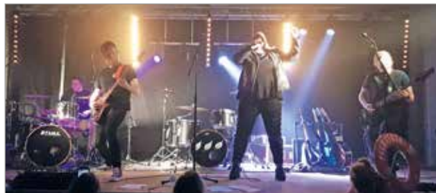
Pelastava Tekijä on oululainen gospelmetallibändi.

- Tunnustavana kristittyinä tavoitteeni on levittää ilosanomaa ja hyvää mieltä, Miika kertoi. MTR