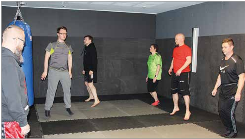
Krav Maga tunnin aluksi verryteltiin. Itsepuolustus kiinnostaa monia.

Movessa on kevään aikana mahdollista osallistua myös pumpptreeneihin, kuntonyrkkeilyyn ja kuntotahainyrkkeilyyn. Junnuille Pasi Ojala suunnittelee lisäksi nassikkapainin ja ketteryysharjoittelun ohjattuja ryhmiä. MTR