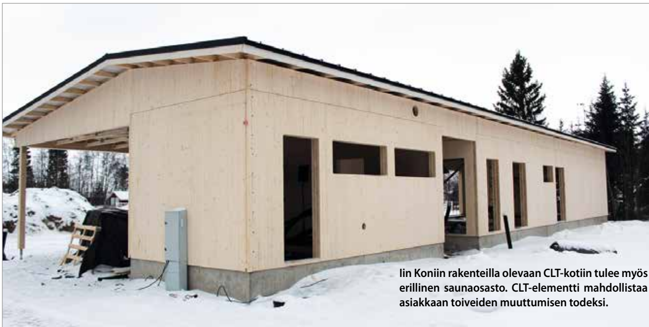
Iin Koniin rakenteilla olevaan CLT-kotiin tulee myös erillinen saunaosasto. CLT-elementti mahdollistaa asiakkaan toiveiden muuttumisen todeksi.

- Tilauskantamme on hyvä, mutta vielä on mahdollista toteuttaa hankkeita tulevalle kesälle, jos tekee tilauksensa mahdollisimman pian. Kauttamme on mahdollista saada talo tai huvila yhdellä sopimuksella, täysin valmiiksi rakennettuna, Tapani Pakanen toteaa.