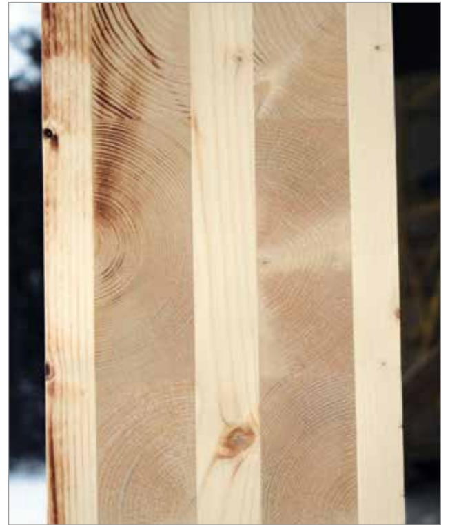
CLT-elementti on samalla valmis sisäseinä ja talon kantava rakenne, jota voidaan työstää haluttuun muotoon ja mittaan.