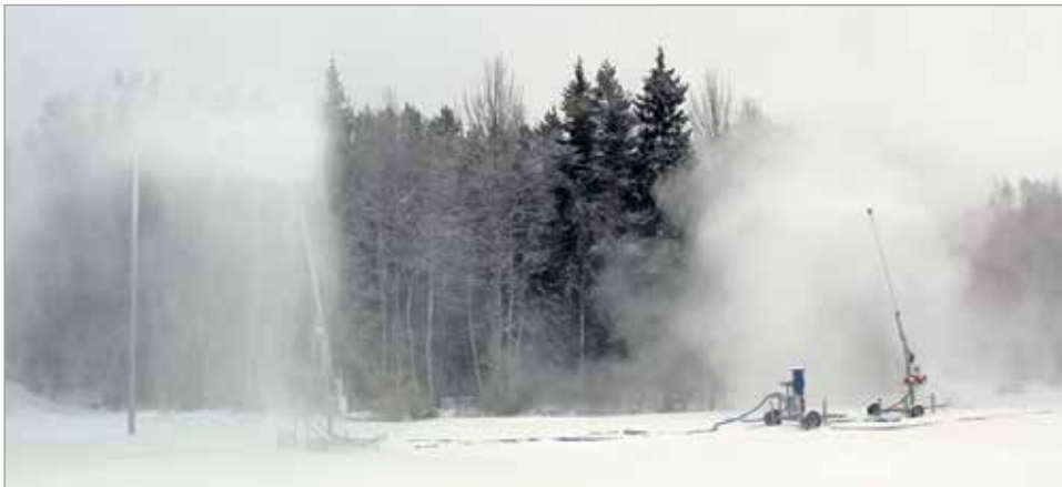
Koekäytössä tykeillä tehtiin päivässä lunta parisataa kuutiota.

Illinsaareissa käyttämättöminä olleiden lumitykkien käyttöönotosta järjestettiin neuvottelutilaisuus kunnan ja hiihtäjien kesken 29.1.