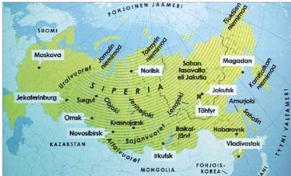
Siperian laajuutta on vaikea Suomessa käsittää.