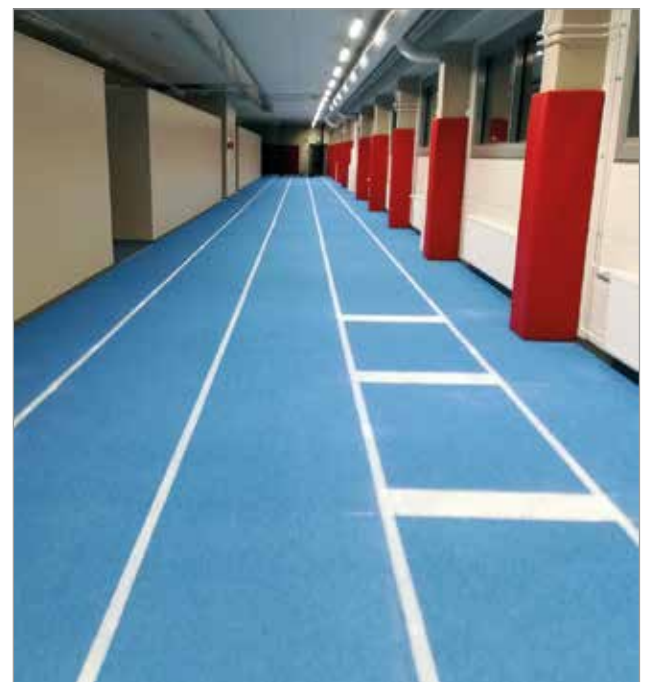
Liikuntahallin 60 metriä pitkä juoksuuora mahdollistaa kilpailutoiminnan. Samoin pituushyppy/kolmiloikkapaikka.