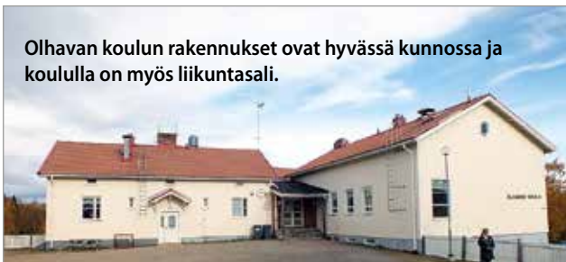
Olhavan koulun rakennukset ovat hyvässä kunnossa ja koululla on myös liikuntasali.

Iihin on juuri valmistunut uusi liikuntakeskus ja kunnasta löytyy hyvät mahdollisuudet monipuoliseen liikunnan harrastamiseen, joita tuleva liikuntaluokka tulee hyödyntämään. MTR