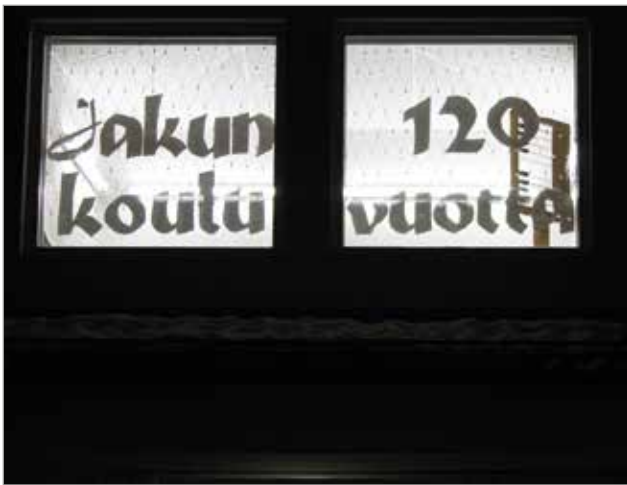
120 vuotta toiminut Jakun koulu on historiallisen muutoksen kynnyksellä. Riippusilta yhdistää eri rannoilla lijokea olevat kyläosat ja lapset pääsevät helposti kouluun.