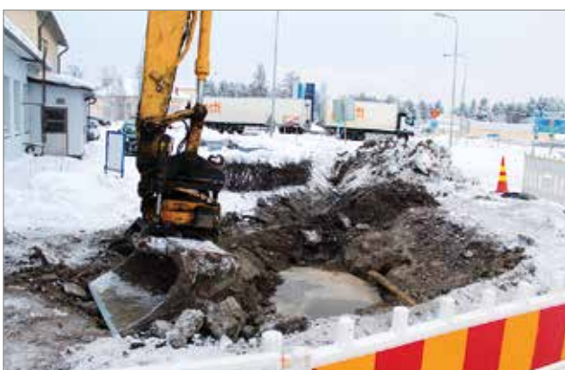
Runkovesiputken vuoto lin keskustassa havaittiin tammikuun puolivälissä.

Iin keskustassa havaittiin vuoto runkovesiputkessa tammikuun puolivälissä. Vuotopaikka sijaitsi Jäppisen huoltamon ja Kirkkotien välissä.