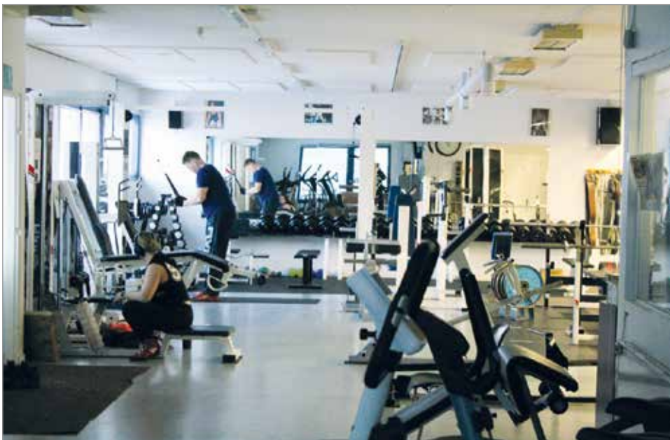
Iin Kuntoklubin valoisat tilat löytyvät Iin Kauppatieiltä.