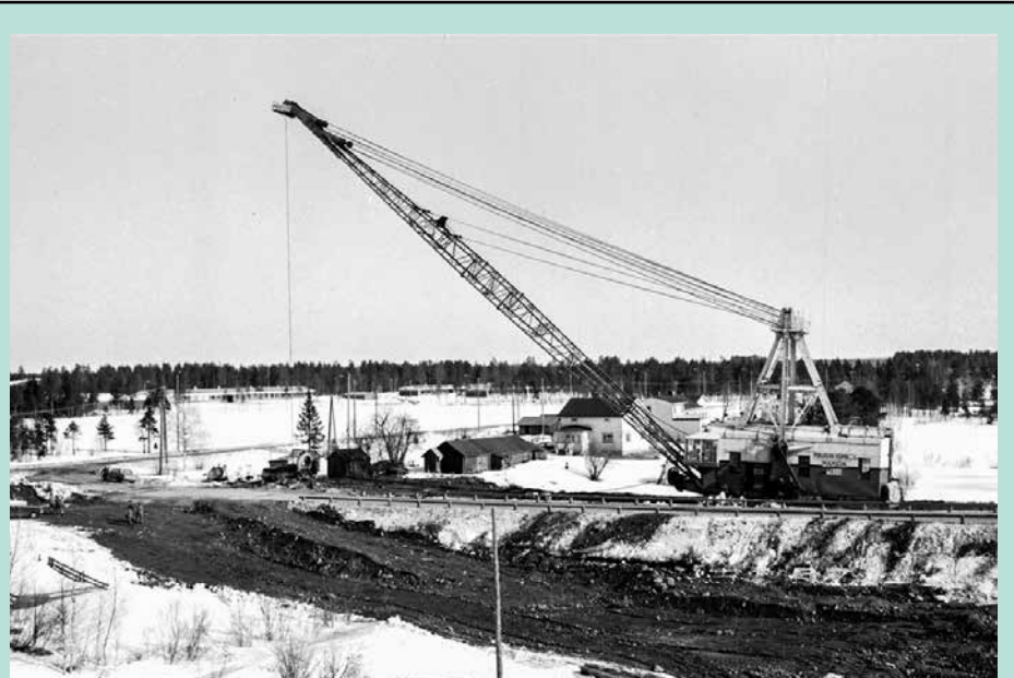
Marion Yli-Iin kirkolla Kiimingintien ja Iintien risteyksessä

sa kaksi vuotta ja viihtyvät hyvin Suomessa. Suomen koulutuksen tason he totesivat olevan korkean ja yhden tärkeimmistä syistä heille valita opiskelumaaksi Suomi. MTR