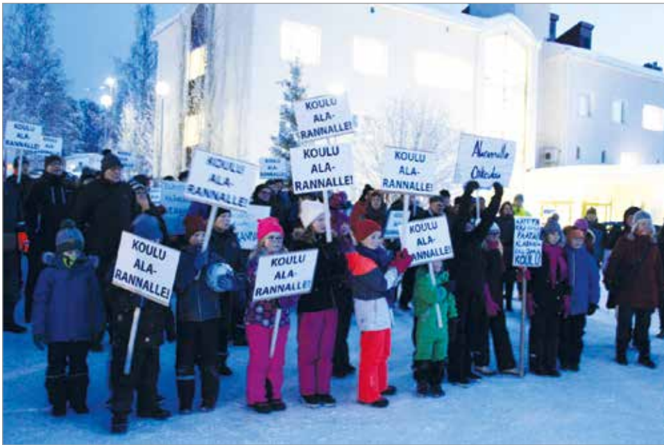
Lapset vaativat koulua Alarannalle.