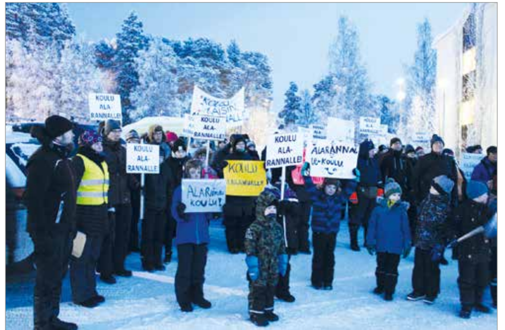
Mielenilmaus keräsi runsaasti osallistujia kunnanviraston eteen.