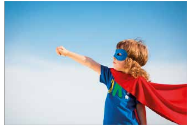
Iin jatkaa ilmastonmuutoksen torjunnan etujoukoissa. Kaikille avoin IlmastoAreena järjestetään 23.-24.8.

IlmastoAreena tiedottaa ilmastonmuutoksesta ja ko-koaa yhteen kaikki keskei-