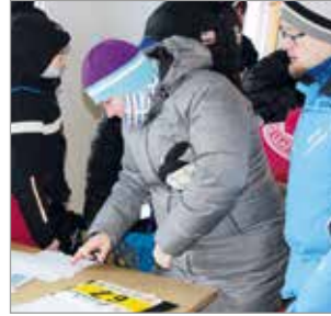
Hiihtomaja tarjosi hyvät tilat odotella omaa lähtövuoroa.

Kovinta kuntoa ja tarkinta suunnistusta miesten pääsar-