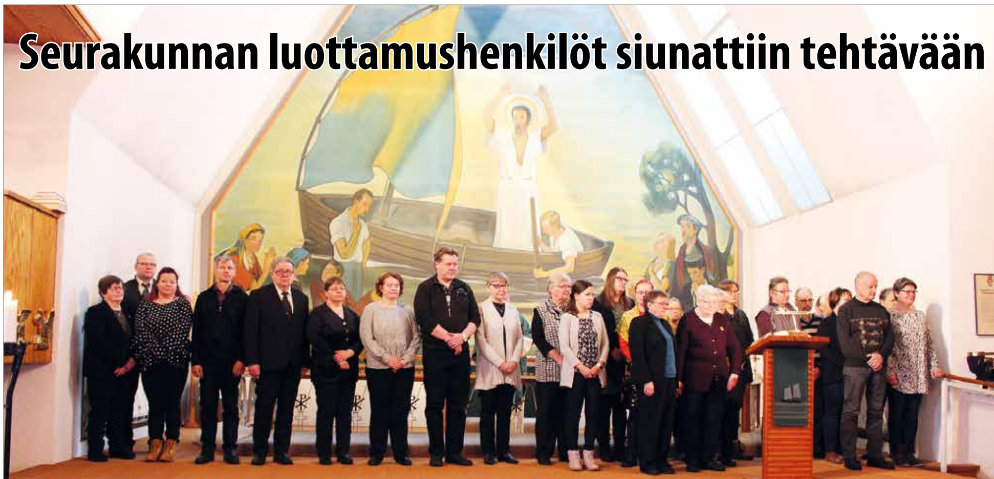
lin seurakunnan luottamustoimiin valitut siunattiin tehtävään lin kirkossa.

lin seurakunnan luottamustoimiin valitut henkilöt siunattiin tehtävänsä lin kirkossa 27.1.