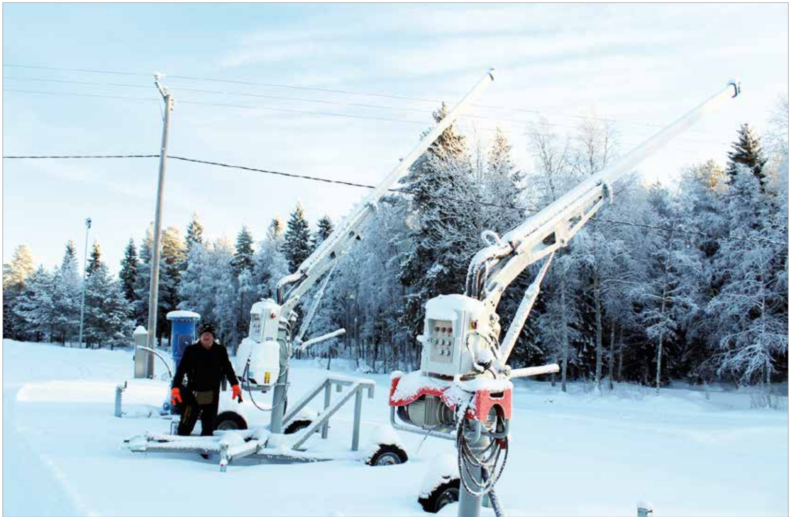
Onko nämä ilmatorjuntaa vai lumetusta varten hankittu, kysyy Seppo Keltamäki.

-Lunta voidaan säilöä vaikkapa maalisuoran viereen, jossa kunnalla on riittävästi maata. Toinen vaihtoehto säilömiseen on latupohjien vierestä hankittavalle maalle, jonka hankimisesta tarkoitukseen on