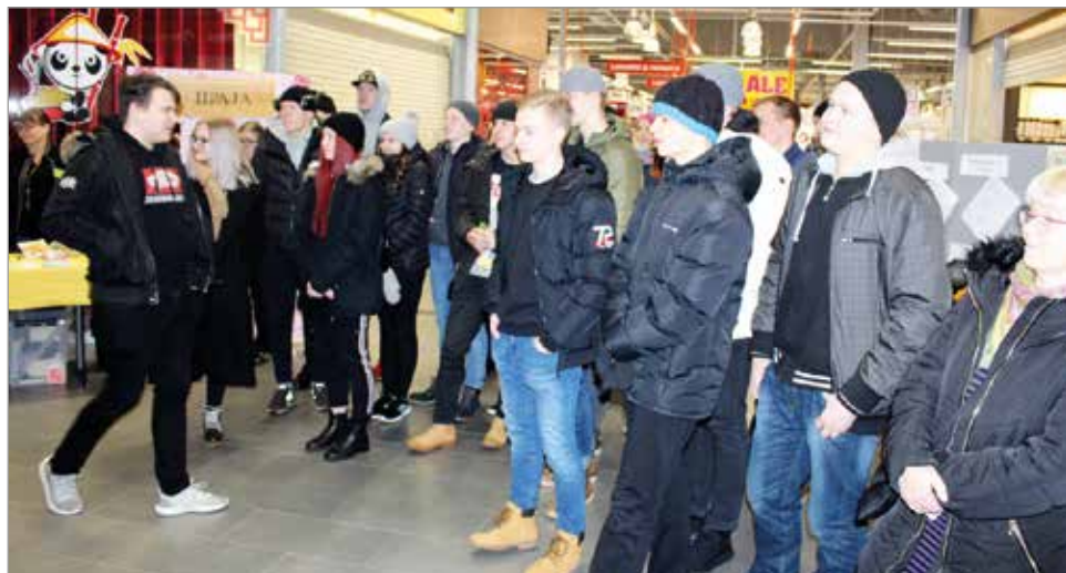
Perjantaiamuna messuihin tutustuivat Iin lukio ja Kuivaniemen koulun yhdeksänne luokat.