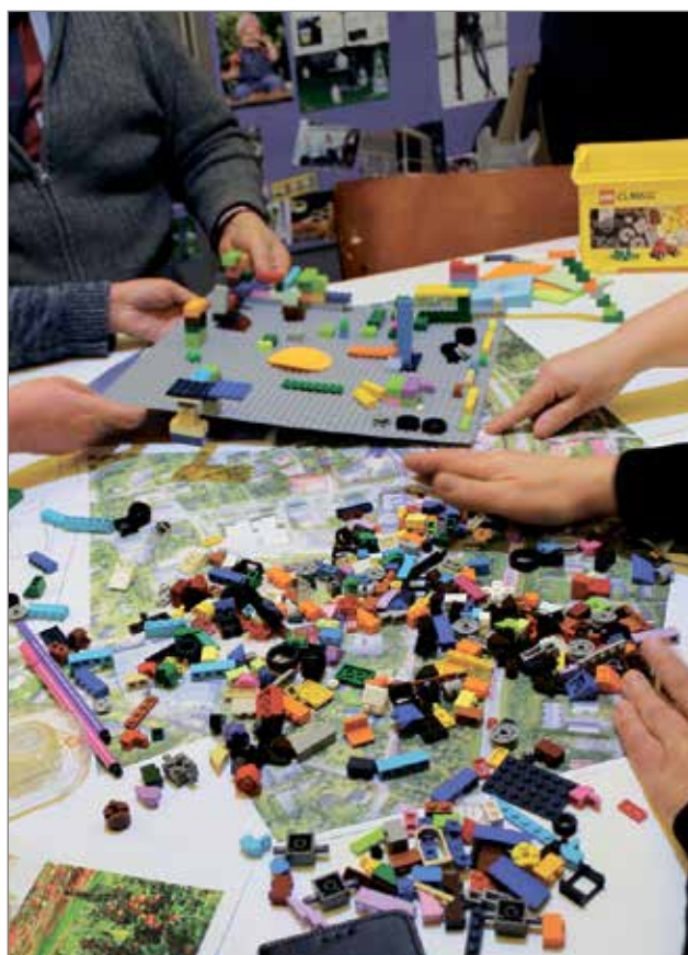
Iin torin suunnittelussa käytettiin Lego-palikoita.

Idea kansalaisten toimitamasta suunnittelutilaisuudesta syntyi päättäjien keskuudessa viime vuonna