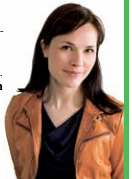
Hanna Halmeenpää kansanedustaja

VIHREÄ TOIMIJA – ILMOITTAUDU TAPAHTUMAAN JA RUOKAILUUN.