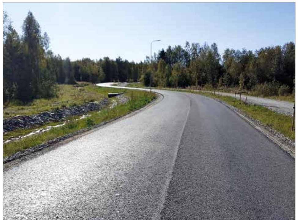
Liikkuminen Tikkasesta 4-tielle helpottui uuden yhteyden kautta.