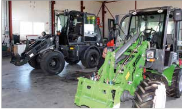
Yritys myy ja huoltaa muun muassa Green Master-pyöräkuormaajia.

raskaan kaluston huolto sekä raskaan kaluston varaosien ja hydraulikan myynti.