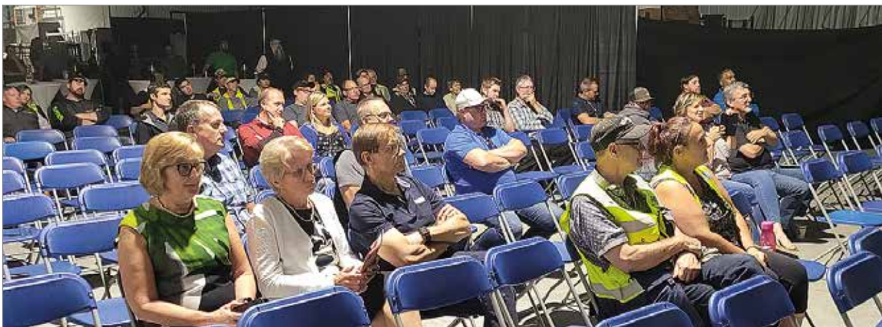
Uuden tehtaan vihkiäisiin oli kutsuttu tehtaan työntekijöiden lisäksi myyjiä ja asiakkaita.