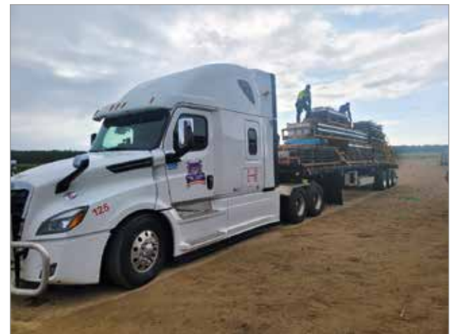
Ovia valmiina lähtöön. Nämä ovat matkaavat tilaajalleen yli 3000 kilometrin matkan.

Iissä taitto-ovia valmistava Findoor on Suomen johtava taitto-ovien valmistaja. Yritys on laajentanut toimintaansa, ensin Ruotsiin, ja sitten Kanadaan, jossa uusi ovitehdas vihittiin juuri käyttöön. Uusi tuotantolaitos rakennettiin Edmontonin lähelle, Westerosen. Suomessa yritys työllistää 45 työntekijää, Ruotsissa muutamia ja Kanadan tehtaalla 15.