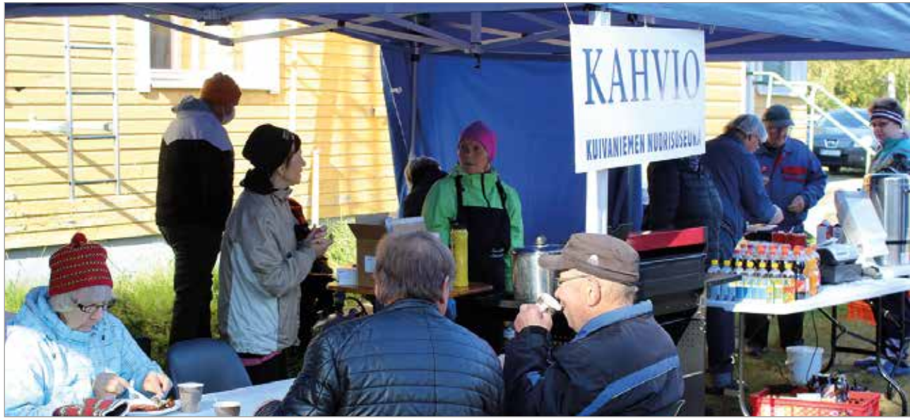
Nuorisoseuran teltalla nautittiin lätkykahvit ja tavattiin tuttuja.