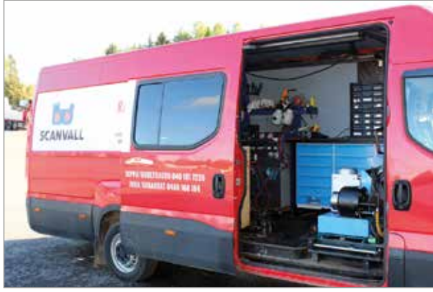
Scanvallin huolto päivystää kellon ympäri ja huoltoauto liikkuu koko Pohjois-Suomen alueella.

Scanvallin pääasiallinen toimiala on metsä- ja maatalouskoneiden sekä muun