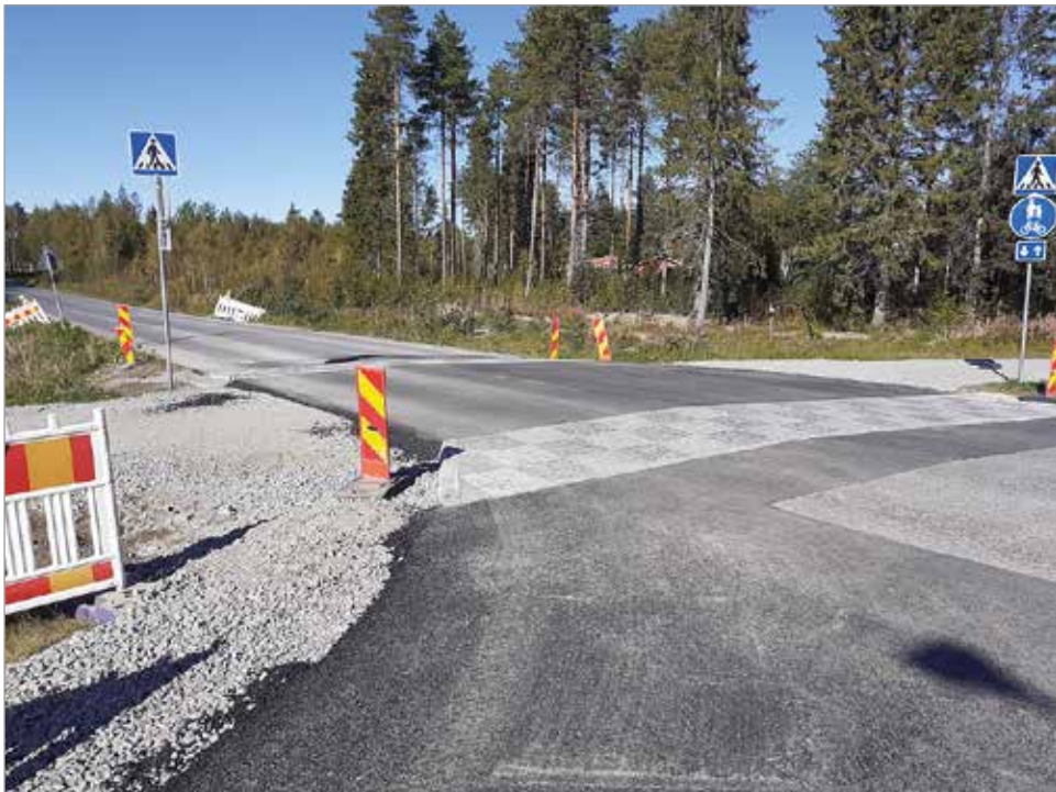
Risteysalueen turvallisuutta parannettiin hidasteilla.

Leipojantien jatke kevyen liikenteen väyläineen saivat kestopäällysteen viikonvaihteessa.