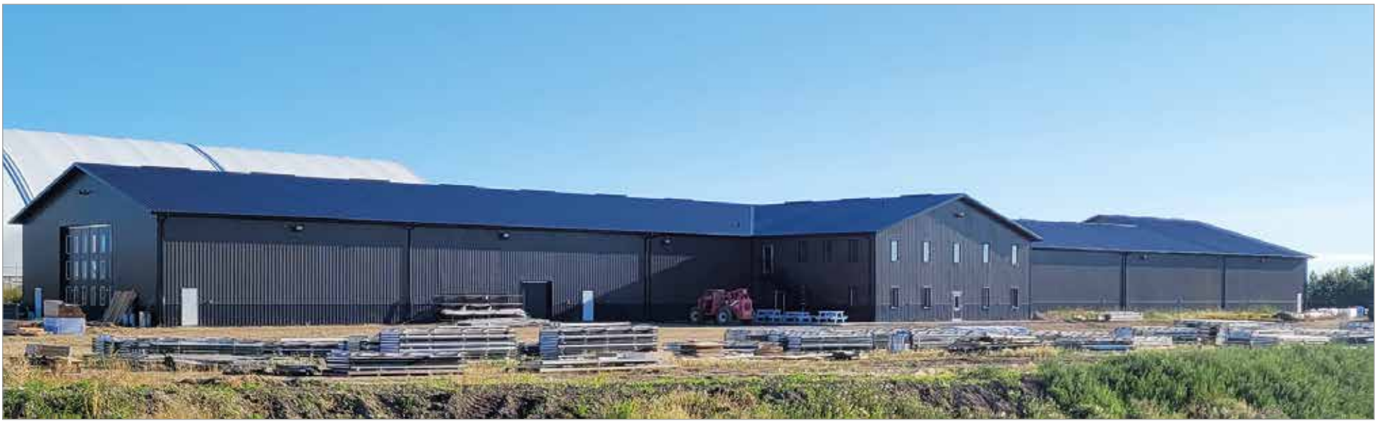
Edmontonin lähelle rakennettu tehdas on kooltaan 20x150metriä.