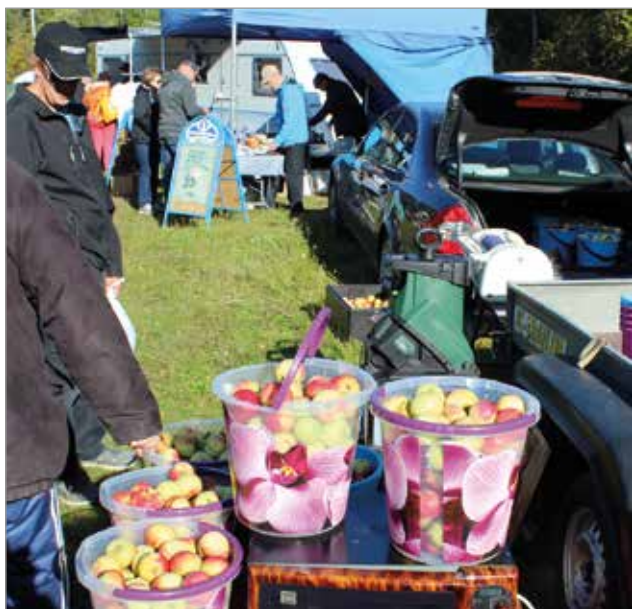
Tänä syksynä omenoita on riittänyt myyntiin saakka.