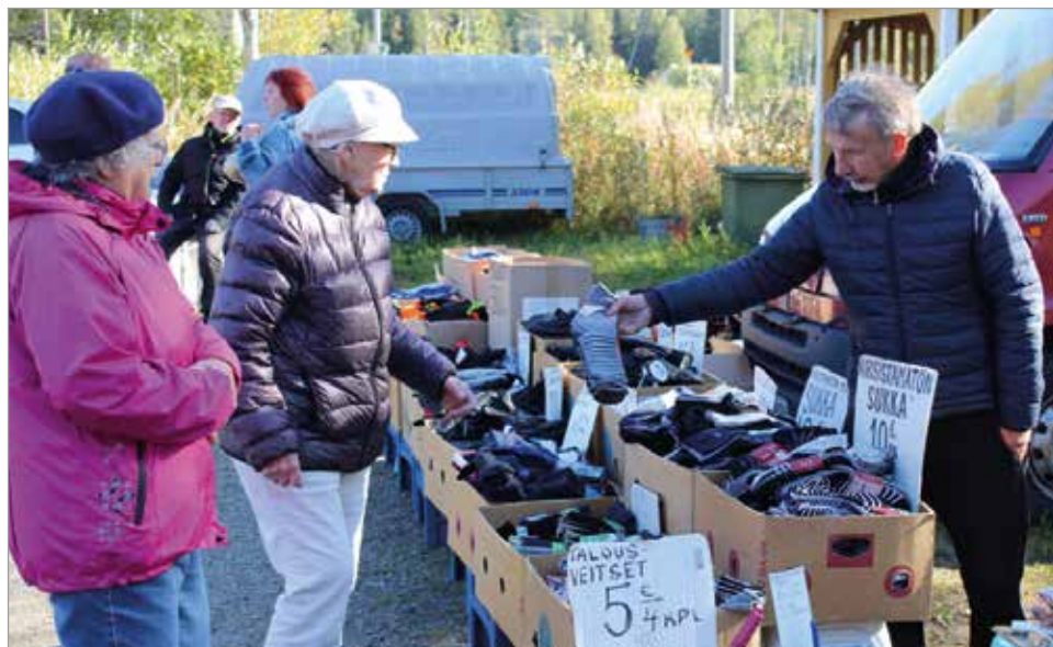
Syksyn viimoihin varauduttiin villasukkien hankinnalla.