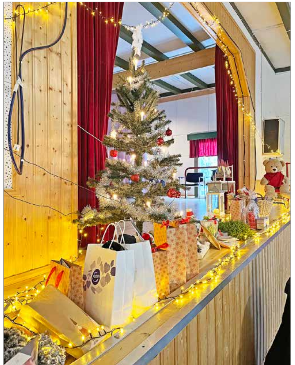
Sampolan joulumyyjäisten lopuksi jaettiin yli 40 arpavoiton palkinnot.