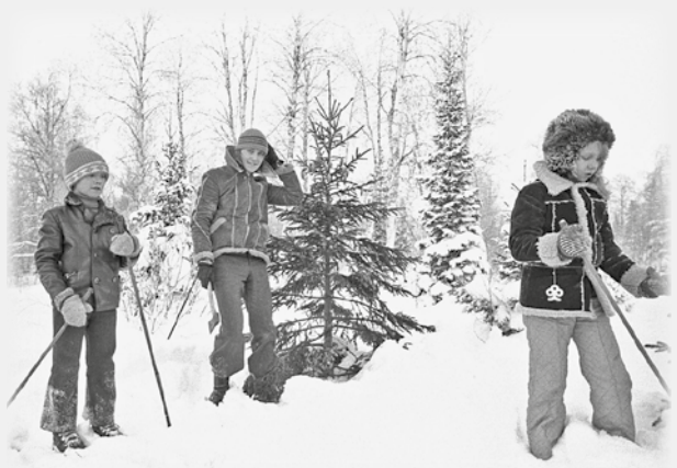
JOULUKUUUSTA HAKEMASSA.

lukijoiden palaute ja jutut: vkkmedia@vkkmedia.fi