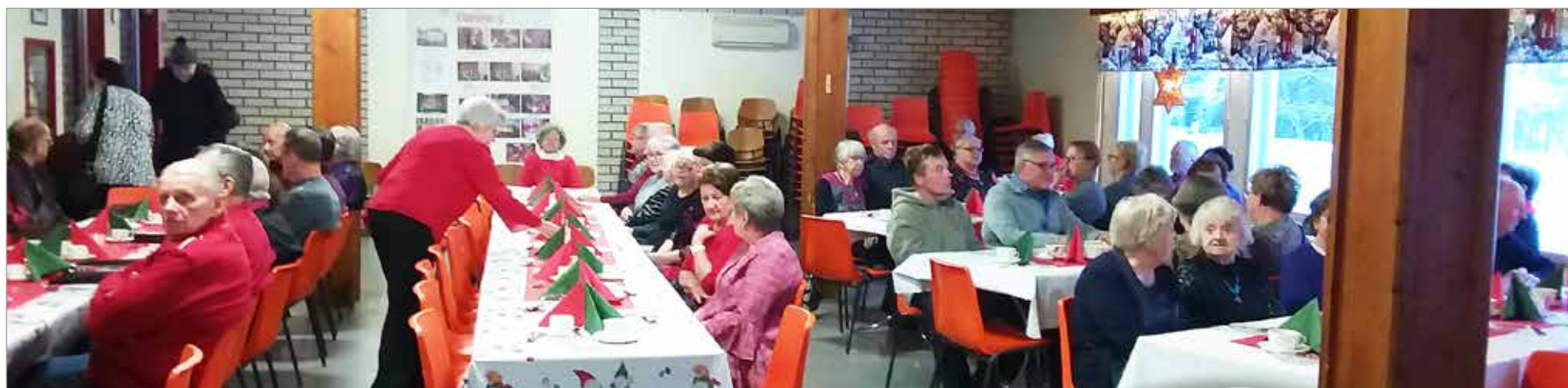
Iin Eläkeläiset pitivät pikkujouluja ja puurojuhlaa Järjestötalolla, jonne kirpeästä ilmasta huolimatta saapui noin 70 henkilöä.