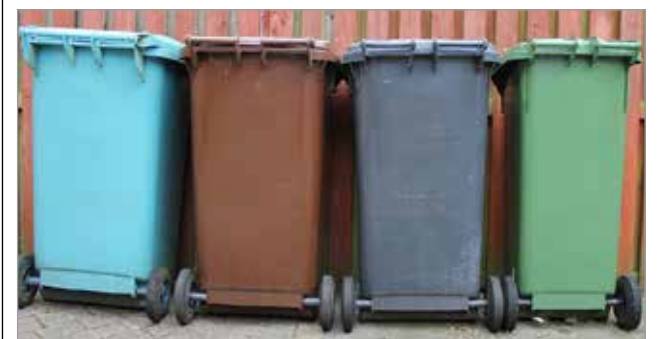
Jätteet kannattaa eritellä jo kotioloissa. (Kuvituskuva)