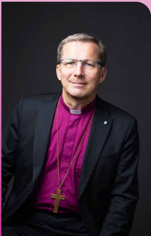
Jukka Keskitalo on Oulun hiippakunnan piispa.

Oulussa adventin 2022 alla Jukka Keskitalo Oulun hiippakunnan piispa