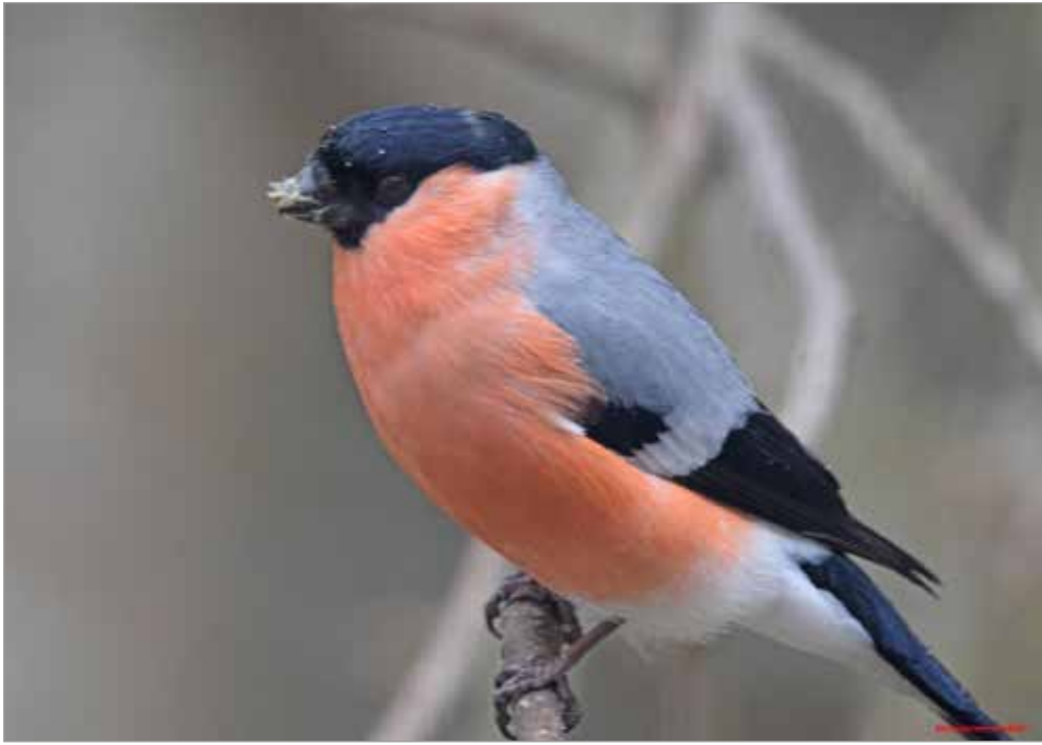
Monet lintulajit keräävät talveksi ruokavarastoja. Linnut myös tankkaavat syksyllä runsaammin ravintoa, jotta energiaa riittäisi kylmiin talviöihin. Lintujen paino onkin talvella 10-20 prosenttia korkeampi kuin kesäaikaan.

Talvinen päivä on lyhyt ja valon määrä vähäinen. Aamu- ja iltahämärä kurot- tautuvat melkein pä yhteen. Pimeään aikaa kuu heittää maan kamaralle varavaloa. Pimeinä talviöinä kuu pais- taa enempi kuin muina vuo- denaikoina. Talvella kuu on yhtä lähellä maata kuin au- rinko on kesällä. Myös poh- joiselle taivaalle leiskuvat revontulet tuovat pimeään yöhön valoa. Todellinen tal- vi alkaa vasta joulun jälke- en ja kylmintä on monesti hel- mikuussa. Mutta joulun jäl- keen päivä myös pidentyy ja valon määrä lisääntyy. Hel- mikuussa näkyy jo enem-