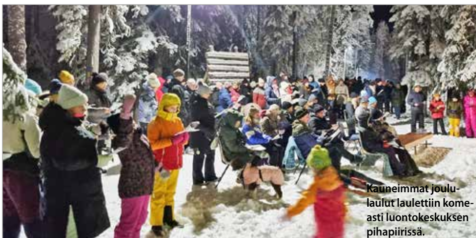
Kauneimmat joululaulut laulettiin komeasti luontokeskuksen pihapiirissä.