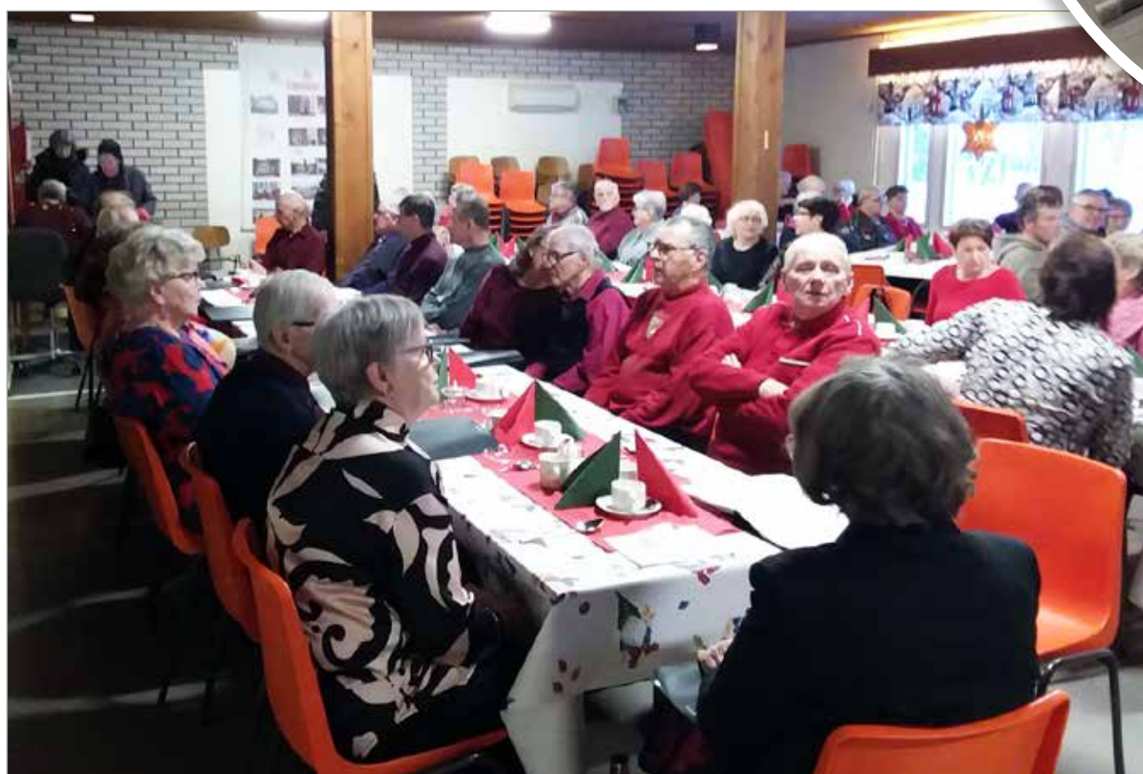
Juhlissa on aina mukava päästä maistamaan tarjoiluja ja niin kävi tälläkin kertaa. Riisipuuro ja sekahedelmäsoppa tekivät kauppansa. Aterioinnin kruunasi torttukahvit.