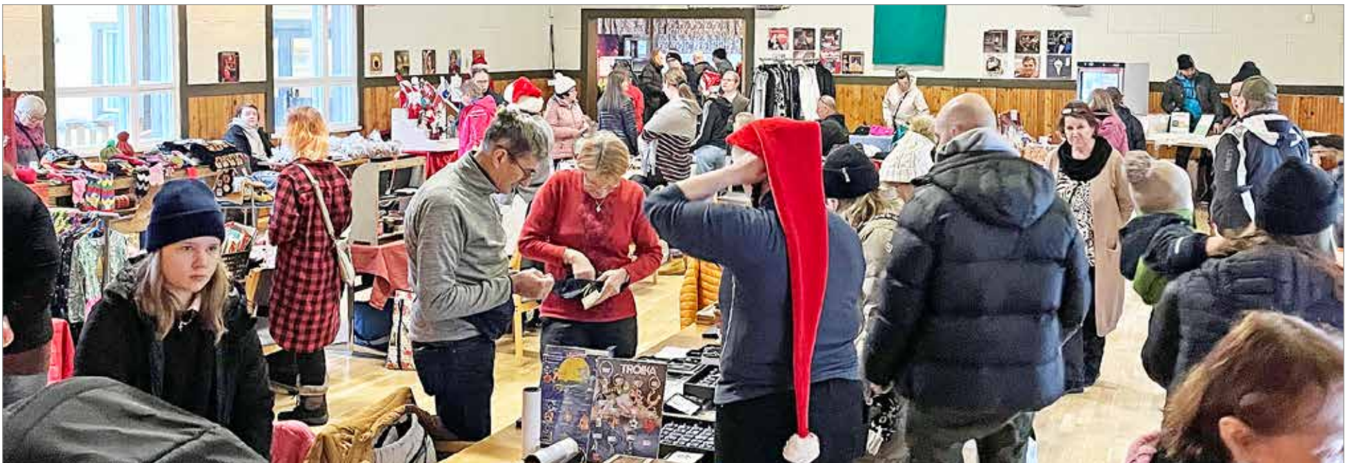
Sampolassa kävi kuhina 3.12. joulumyyjäisissä.