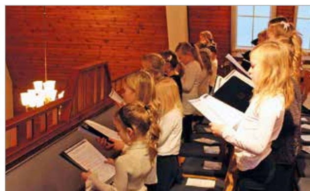
Lapsikuoro avusti ja lauloi tapahtuman aluksi.