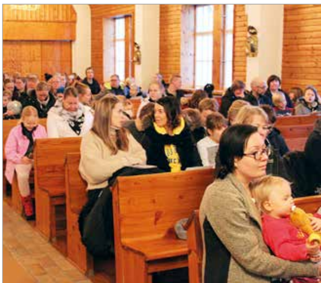
Kauneimmat joululaulut-tapahtuma täyttää kirkot joulun lähestyessä. Kuva Iin kirkossa pidetystä kauneimmat lasten joululaulut tilaisuudesta.

Kauneimmat joululaulut-tapahtumat täyttävät jälleen kirkon eri puolilla maata. Tänä vuonna kampanjan virallisena suojelijana toimii laulaja Katri Helena. Tervehdyksessään hän tote-