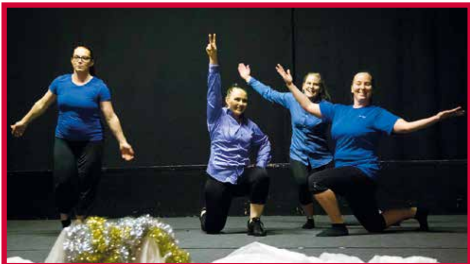
Aikuiset tanssivat jazzin tahtiin.