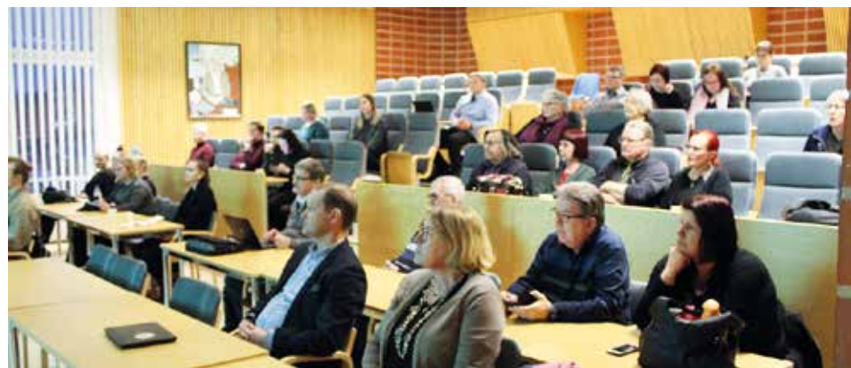
Iin maankäytön tulevaisuuden kehityskuva kiinnostaa kuntalaisia.