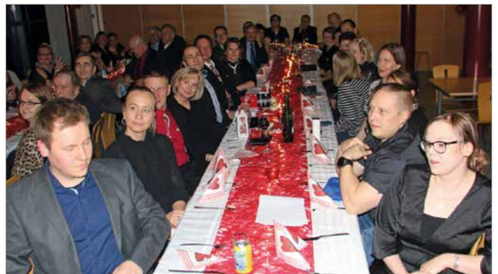
Iin Yrittäjien pikkujoulu pidettiin Chuan Yi -ravintolassa, joka sijaitsee Micropoliuksessa. Yrittäjät viihtyivät pikkujoulun hyvässä tunnelmassa.