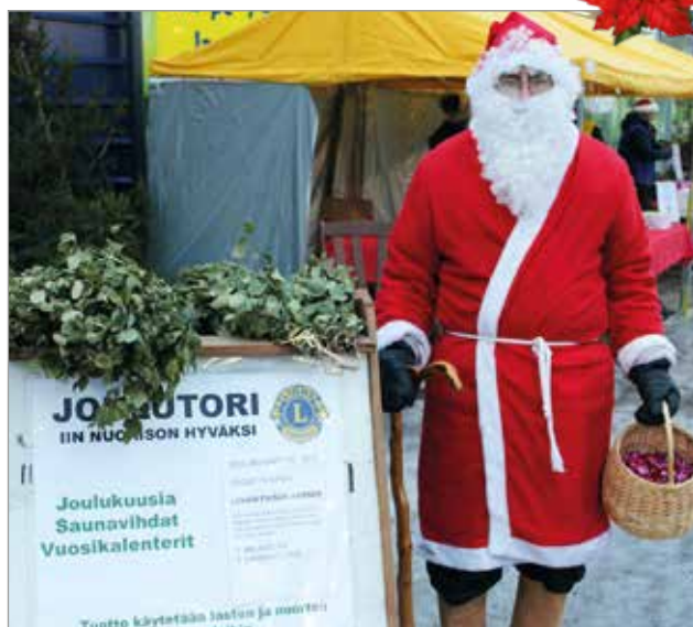
Joulupukki ehti kiireiltään vierailemaan Iin Lions Clubin joulutorille.

Kiittäen kuluneesta vuodesta toivotamme Rauhallista Joulua ja Hyvää Uutta Vuotta 2020