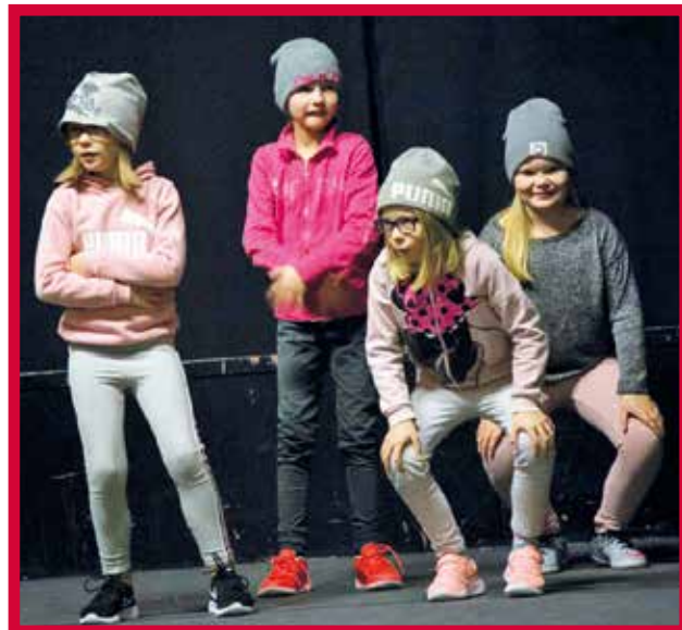
Hiphoparit vauhdissa.

- Tanssikoulu Tanssin Tahdin toiminnan keskeinen tavoite on järjestää pedagogisesti laadukasta opetusta