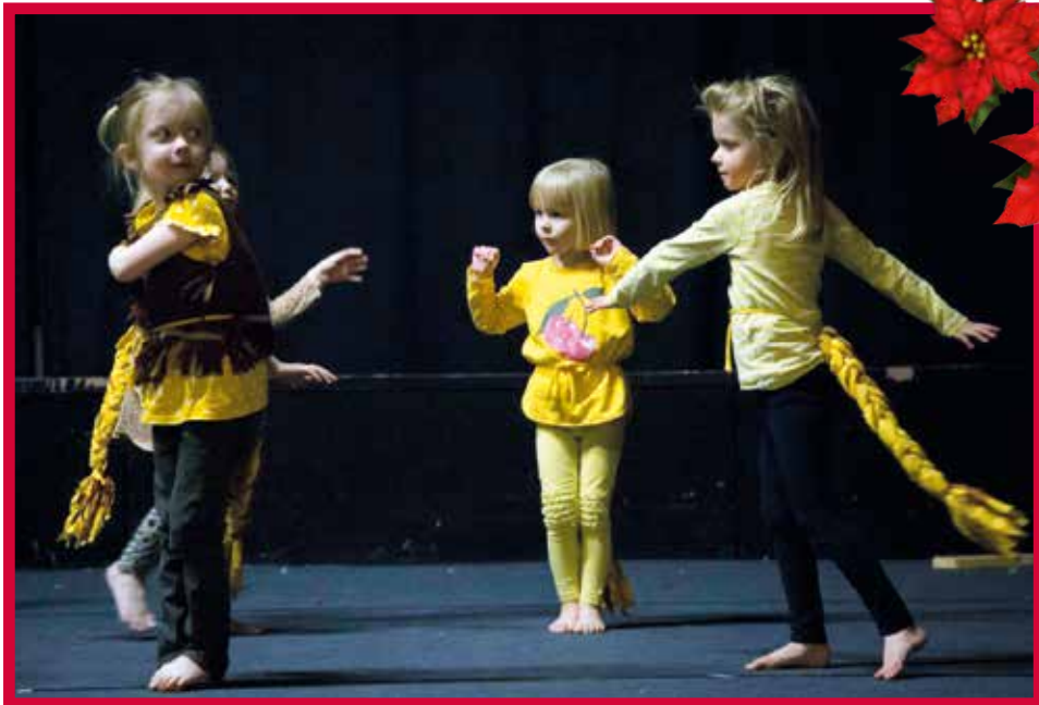
Taaperoiden leijonatanssi hurmasi yleisön.