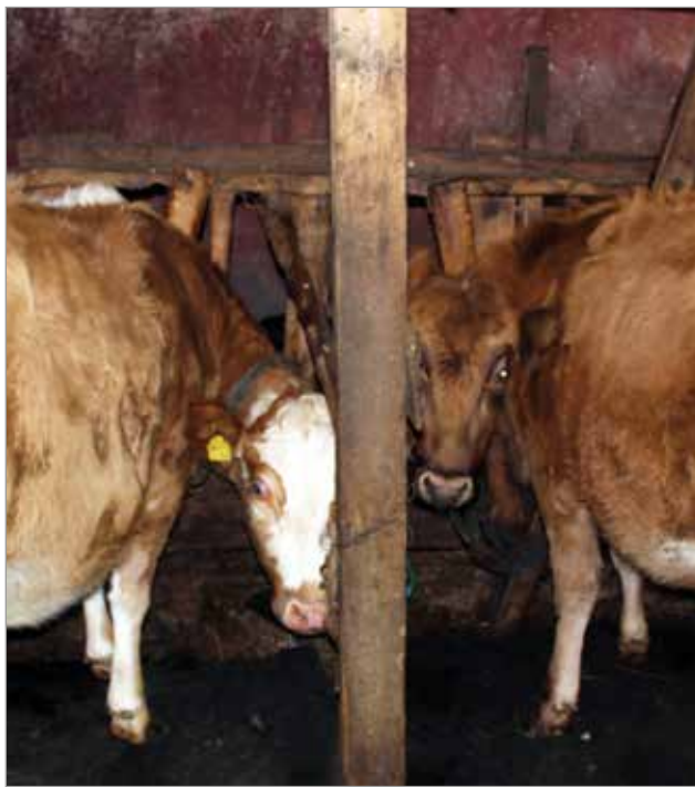
Hiehot tulivat syksyllä Kajaanista, joten maidontuotannon jatkuvuuskin on taattu.

- Mukavinta minusta on saada lehmät kesällä ulos metsälaitumille, teräsmummo toteaa lopuksi. MTR