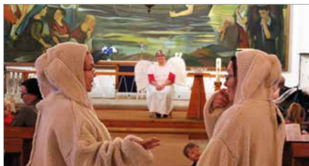
Söpö ja Nöpö jänikset johdattelivat ensimmäisen joulun tapahtumiin. Tässä he kohtaavat tiellä enkelin, ihmetellen mikä heitä vastaan on tullut.

mahdollisuus osallistua tapahtumaan. Kuivaniemellä laulutilaisuus oli Aseman liikuntahallilla sunnuntaina 15.12. MTR