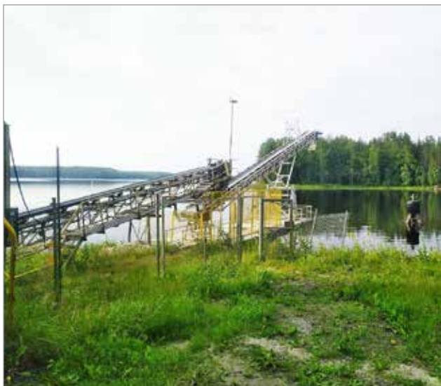
Siilinjärvelle asennetut hihnakuljettimet, joilla lastataan kalkkilätkä.

on vakiintunut, yrittäjällä on välillä vapaa-aikaakin. Aika kuluu hyvin perheen kanssa ja itsestä huolehtimisen parissa.