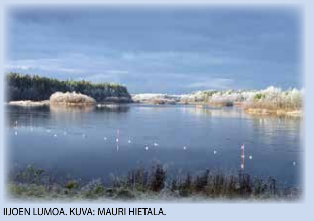
IJOEN LUMOA.

lukijoiden palaute ja jutut: vkkmedia@vkkmedia.fi