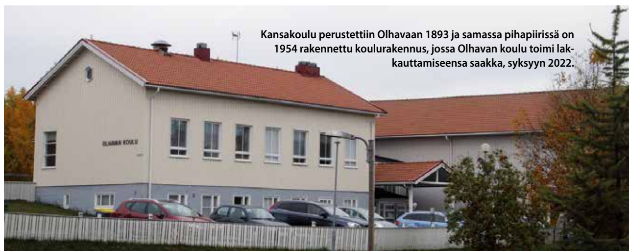
Kansakoulu perustettiin Olhavaan 1893 ja samassa pihapiirissä on 1954 rakennettu koulurakennus, jossa Olhavan koulu toimi lakkauttamiseensa saakka, syksyyn 2022.

Tiistaina 15.11. Pohjois-Suomen hallinto-oikeus kumosi lin kunnanvaltuuston 1.11.2021 tekemän päätöksen Olhavan koulun lakkauttamisesta. Hallinto-oikeuden mukaan lakkauttamispäätöksen valmistelu oli puutteellista, sillä Olhavan koulun henkilökunnalle, oppilaille ja heidän huoltajilleen ei annettu riittävästi tietoa eikä mahdollisuutta vaikuttaa päätöksentekoon.