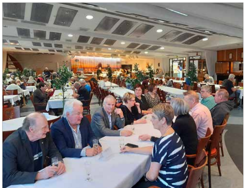
Lauantai-illan yhteisellä illallisella muistettiin eri asioilla kunnostautuneita jäsenyrittäjiä.