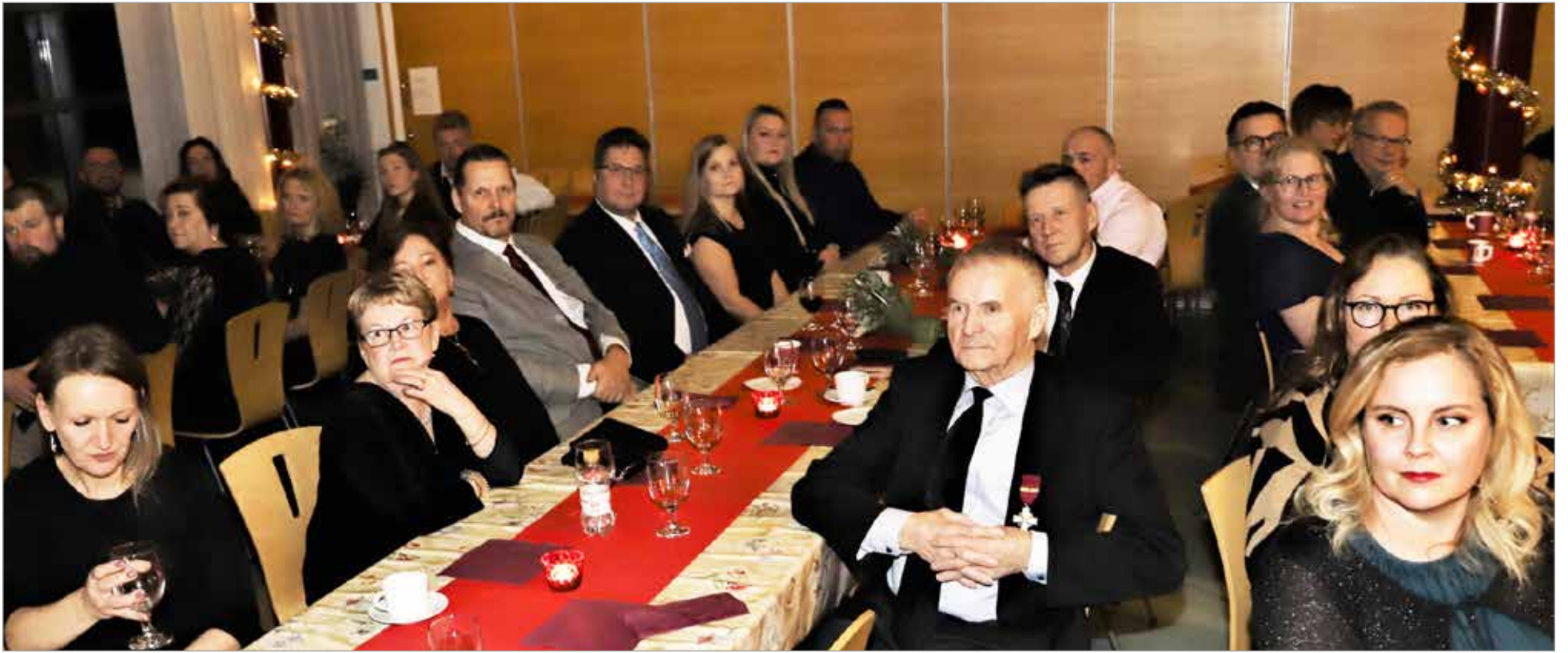
Iin Yrittäjien pikkujouluun osallistui lähes 60 henkilöä.