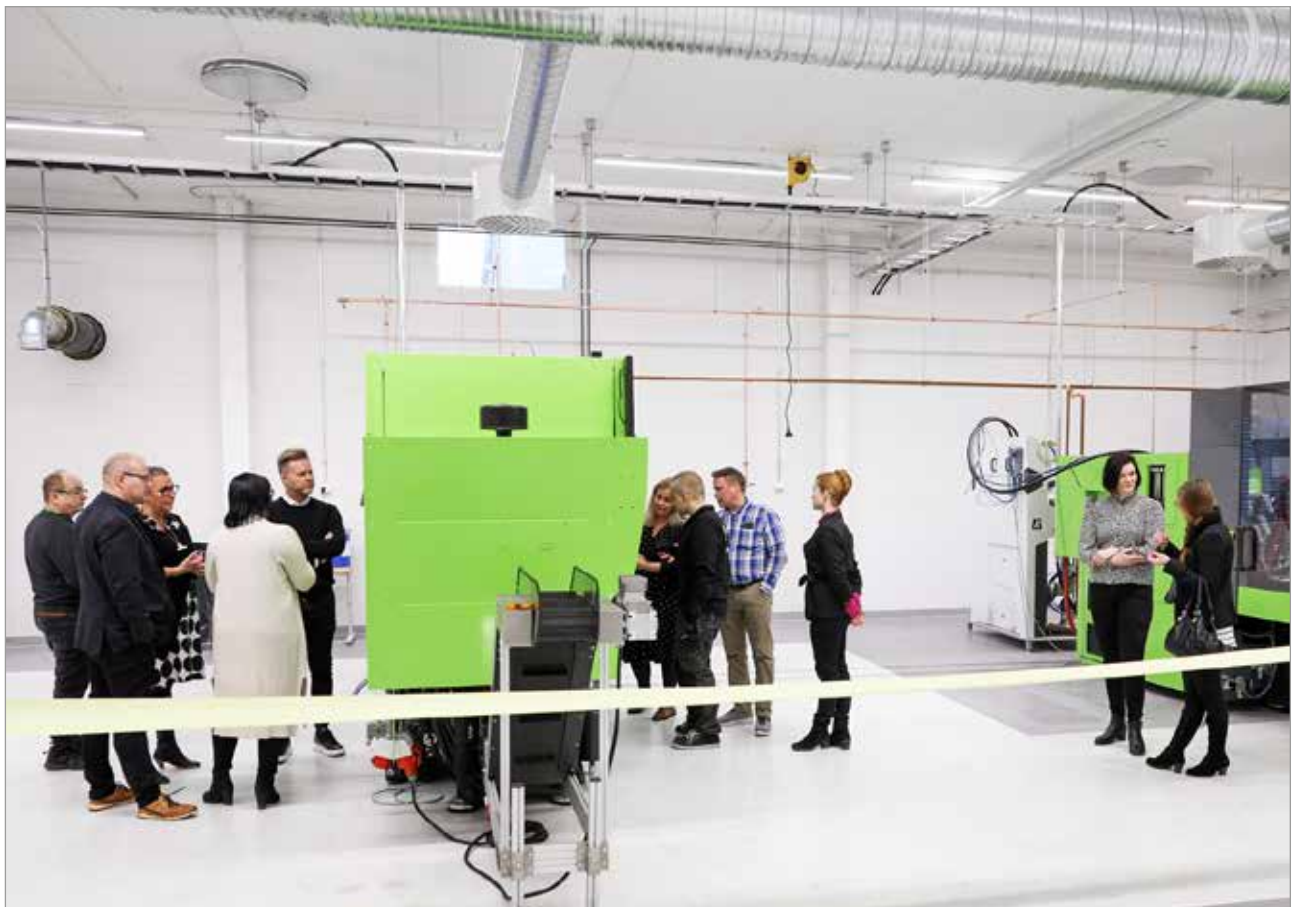
Tapahtuman osallistajat saivat tutustua FinnProfilesin toimintaan ja silikonimuotteja valmistaviin ruiskupuristimiin.