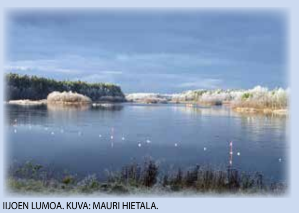
IJOEN LUMOA.

lukijoiden palaute ja jutut: vkkmedia@vkkmedia.fi