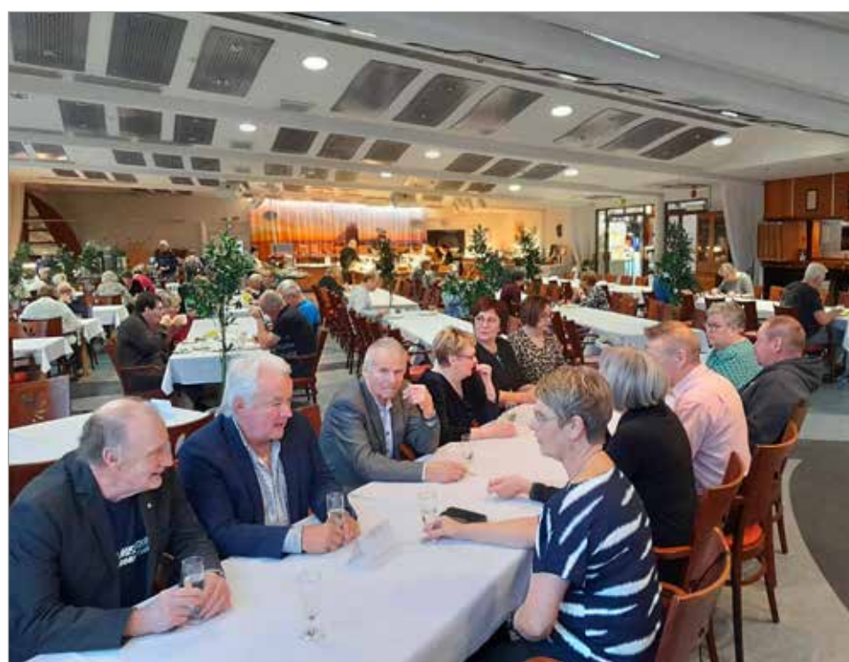
Lauantai-illan yhteisellä illallisella muistettiin eri asioilla kunnostautuneita jäsenyrittäjiä.