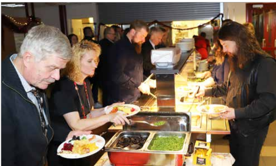
Pikkujouluun kuuluva jouluruokailu oli illan odotettu ohjelma-numero.

jäsenistä on yksinyrittäjiä. Tavoitteena on, että jäsenmäärä nousisi 150 yrittäjään.