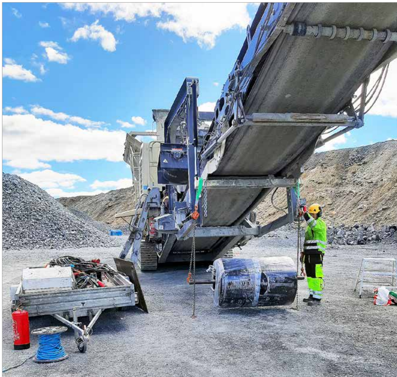
Iin Hihna ja Teollisuuspalvelu Oy:n palveluita tarvitaan muun muassa Kevitsan kaivoksella. Kuvassa mobiilimurskan hihnan asennus käynnissä.